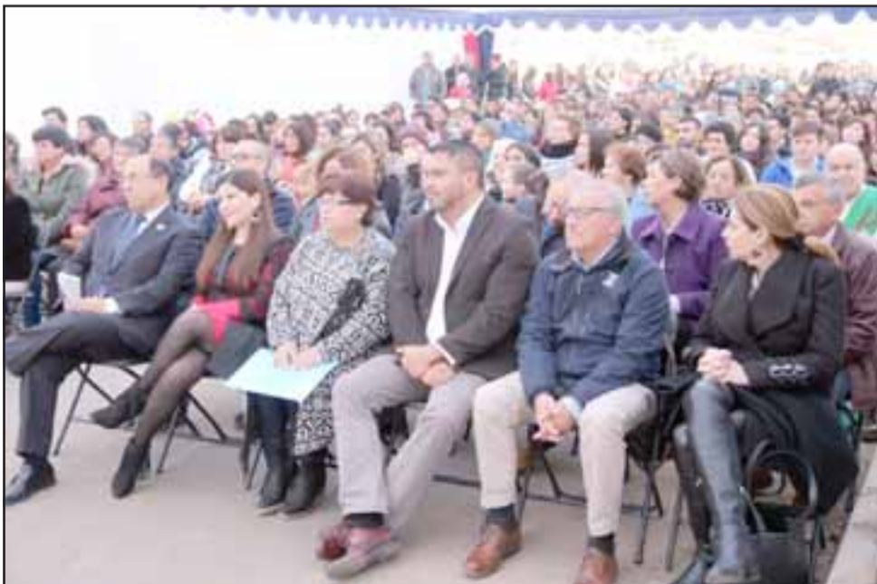
Después de 11 años de ardua lucha, las 159 familias del nuevo barrio de Putaendo recibieron oficialmente las llaves de su casa propia.