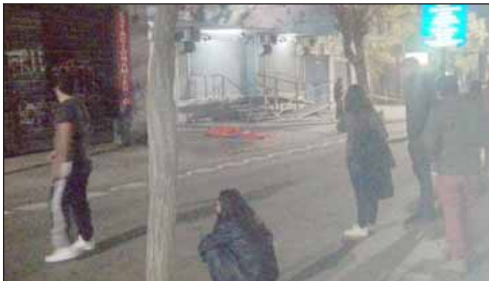
La Policía de Investigaciones realizó diligencias hasta altas horas de la madrugada del domingo para la investigación del caso.