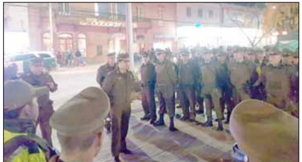
Los funcionarios de Carabineros Aconcagua se unieron al Plan Nacional preventivo de delitos.