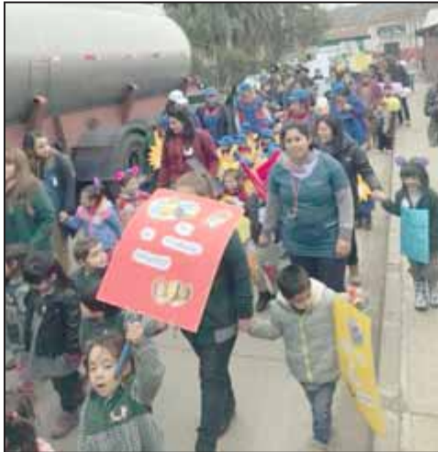
La caminata pacífica fue organizada por la Municipalidad de Santa María, la Oficina de Protección de Derechos y la Seremi de Trabajo y Previsión Social.