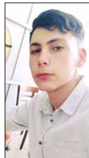
El joven de 17 años de edad falleció a consecuencia de dos heridas con un arma blanca en su cuerpo.