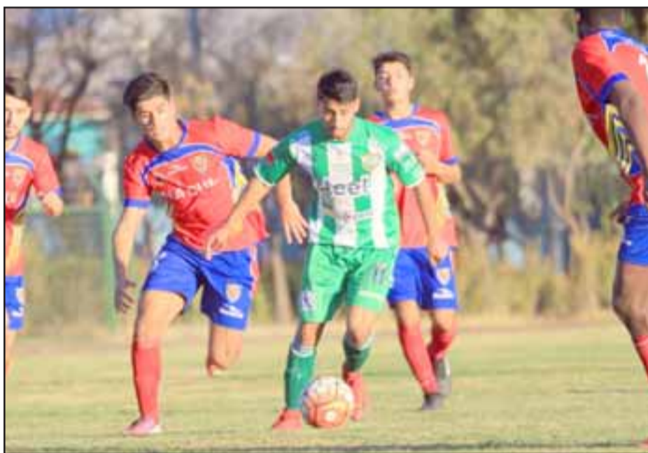
Macul El conjunto aconcgüino se impuso a Macul en el juego que tuvo como escenario el Regional de Los Andes.