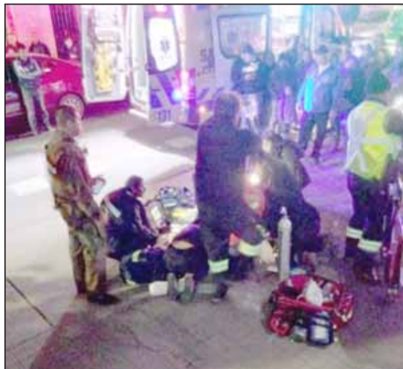
Personal del Samu efectuó maniobras de reanimación a la víctima sin resultados positivos.