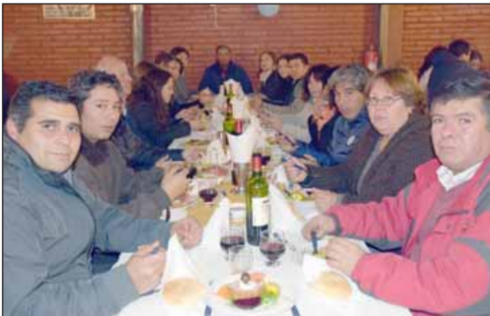
EN EL NEGRO BUENO. - Así también los directivos de cada club disfrutaron en camaradería de la amena actividad y cierre del torneo.