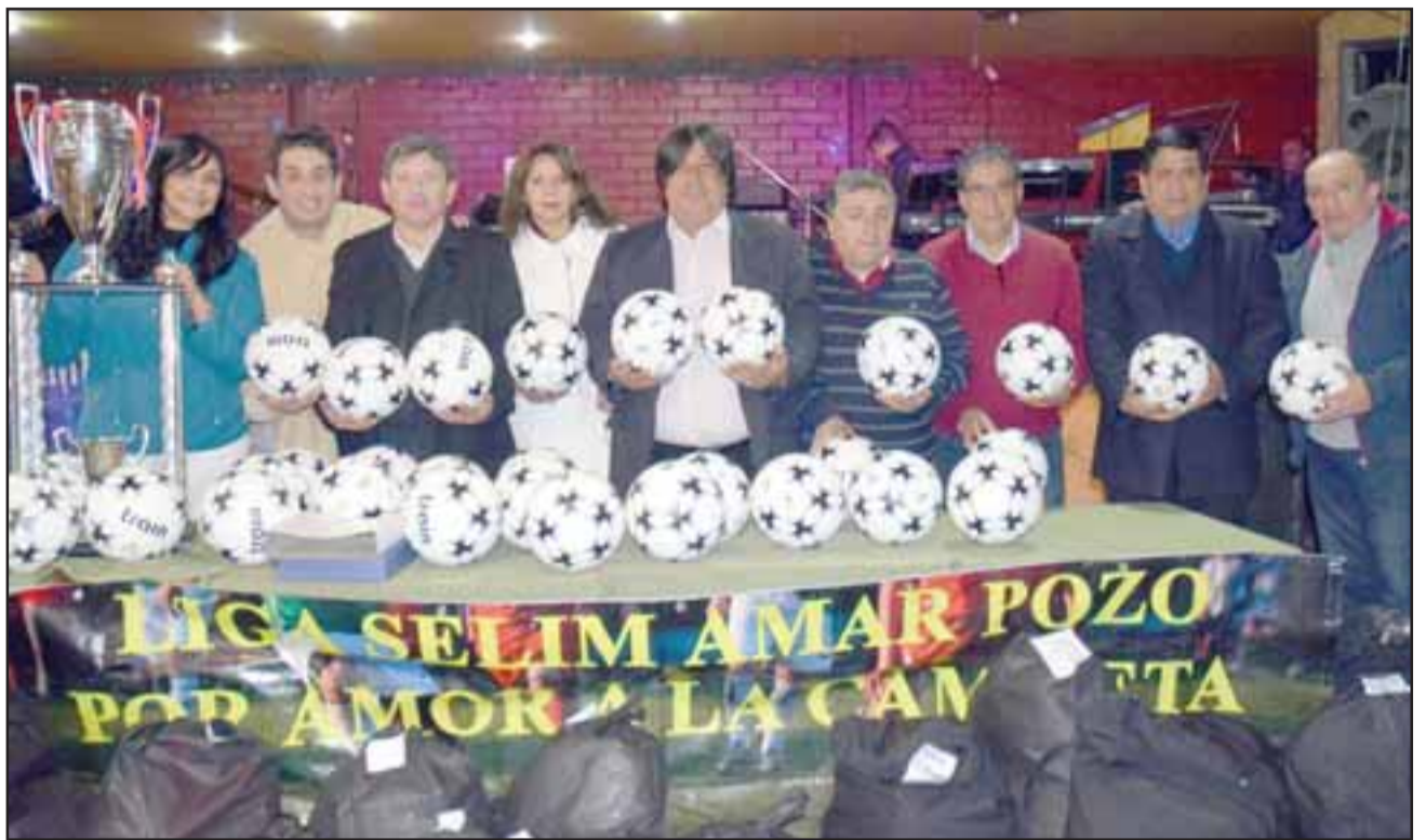
DIRECTIVA E INVITADOS.- Aquí tenemos a la directiva del Torneo junto a varios de los invitados especiales de la gala de premiación.

«El campeón del Grupo B fue el Club Depor-