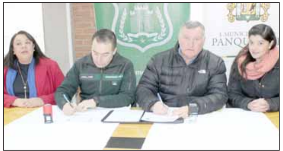
Programa permitirá que condenados a penas alternativas y con residencia en la comuna puedan acceder a capacitaciones y colocación laboral.