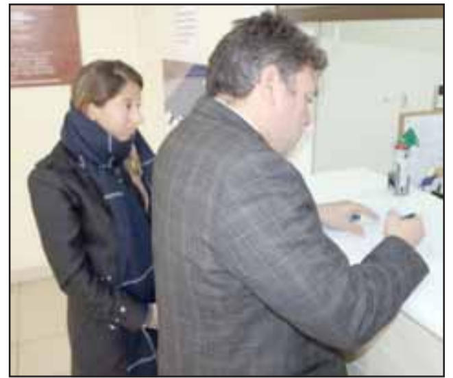
Con el objetivo de que se realicen las acciones penales necesarias para perseguir este delito y también para dar una fuerte señal de repudio a los hechos de violencia contra la mujer, se presentó esta querrela el día viernes.