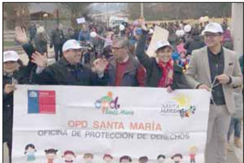
Más de 300 niños le dijeron no al trabajo infantil, sí a los juegos y la educación.