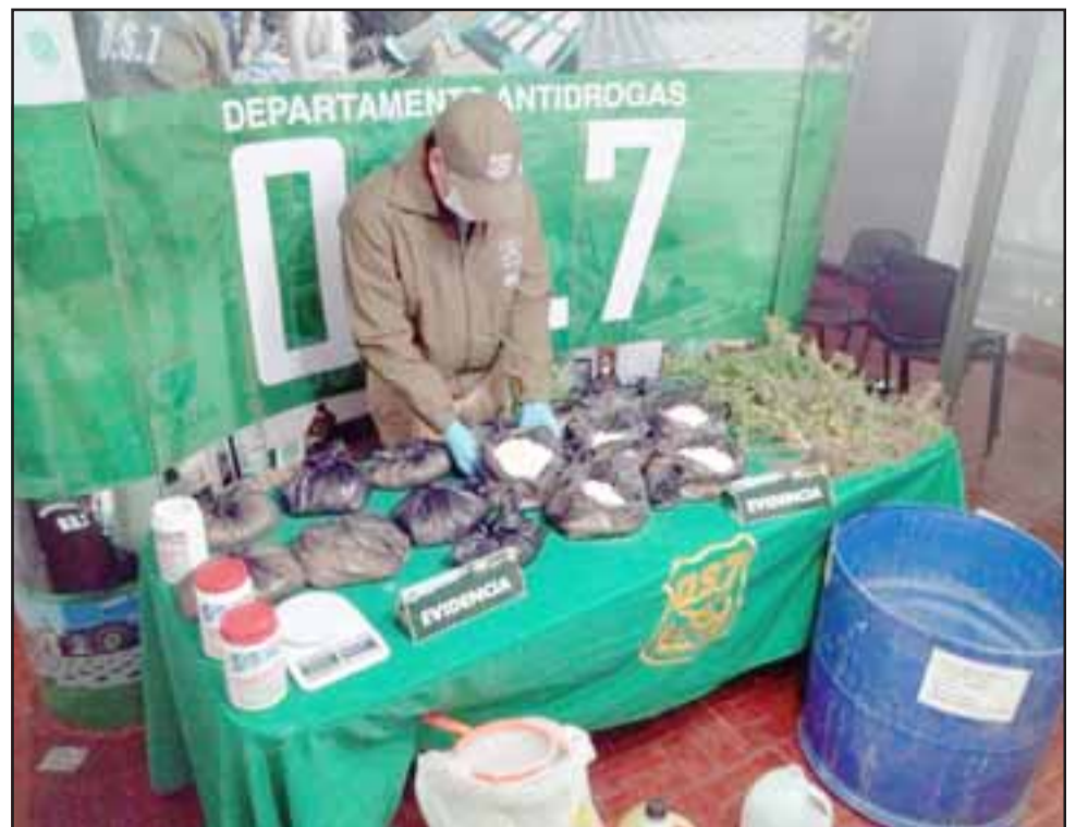
Personal de OS7 de Carabineros Aconcagua incautó 14 kilos de pasta base, plantas de cannabis sativa y diversos químicos desde el inmueble del imputado en Población Luis Gajardo Guerrero de San Felipe.

No obstante el imputado individualizado con las iniciales V.D.R.S. , de 44