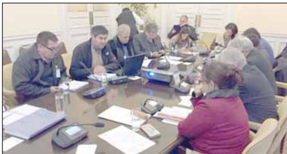
En la propia reunión sostenida con los parlamentarios, hubo coincidencia en mencionar que han logrado por parte de los trabajadores cumplir con lo comprometido.

A lo anterior es que se solicita establecer la modernización de los exámenes ocupacionales para la detección de silicosis y enfermedades derivadas de la vibración y el ruido. Asimismo en esta reunión de trabajo fue abordada la temática para