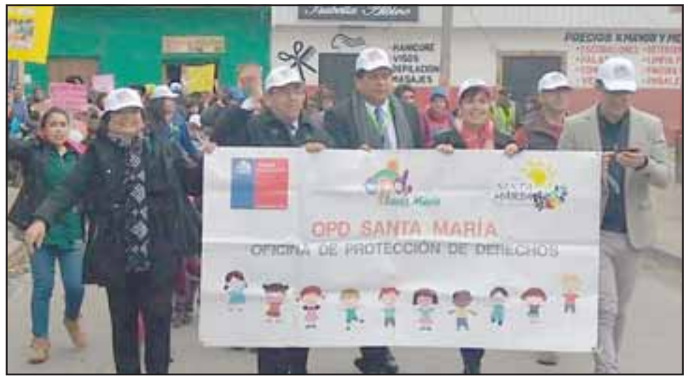
Las autoridades también marcharon al lado de estos pequeñitos para potenciar así la protesta.