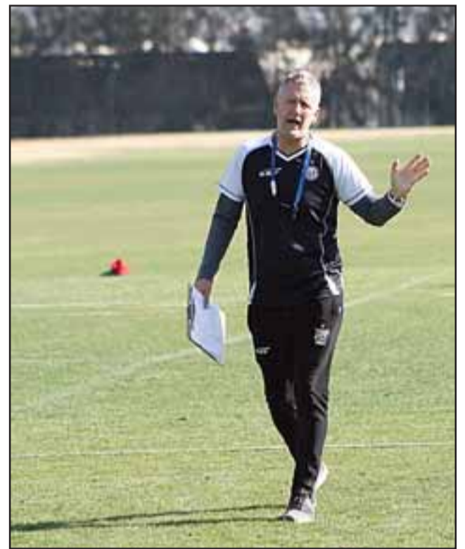
El técnico del conjunto albirrojo confirmó que esta semana su equipo jugará al menos un partido amistoso.