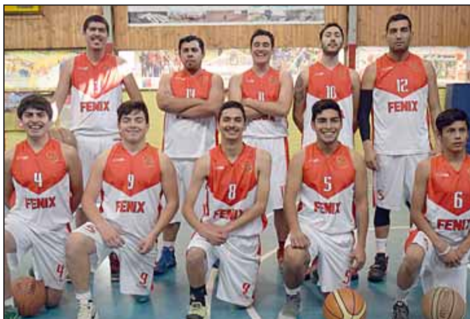
COMO EL AVE FÉNIX. - Aquí tenemos a la muchachada del Club Fénix, de El Belloto, quienes también dieron realce al torneo este año.