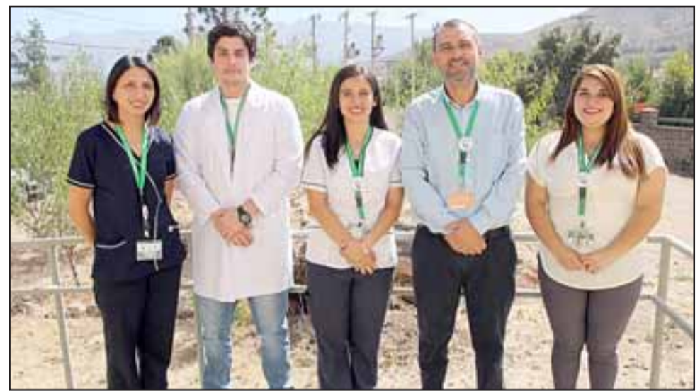
El Hospital Psiquiátrico Dr. Philippe Pinel de Putaendo obtuvo la Acreditación de Calidad, cumpliendo con el 100% de las características obligatorias.