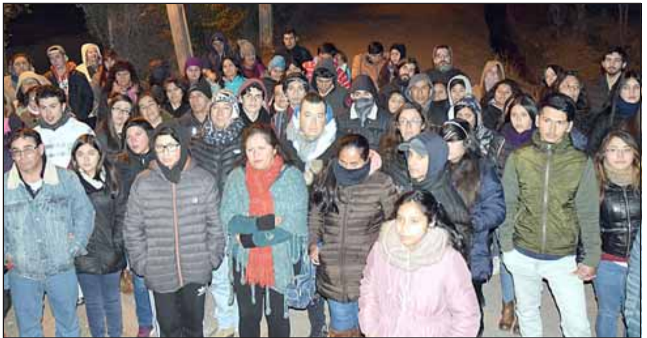
NOCHE DE MITOS Y LEYENDAS.- Más de 100 personas recorrieron los rincones más enigmáticos de la comuna de Santa María para celebrar la Noche de San Juan.

Una vez que nació el cristianismo, muchas tradiciones paganas fueron absorbidas por el calendario cristiano y la conmemoración de la noche más larga del año fue asociada a un evento puramente cristiano: el nacimiento de San Juan Bautista que según la Biblia, tuvo lugar el 24 de junio. Como curiosidad, se