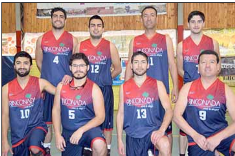
DUROS RINCONADINOS. - El Sónic, de Rinconada de Silva, conquistó el segundo lugar del torneo. Al final todos ganaron.