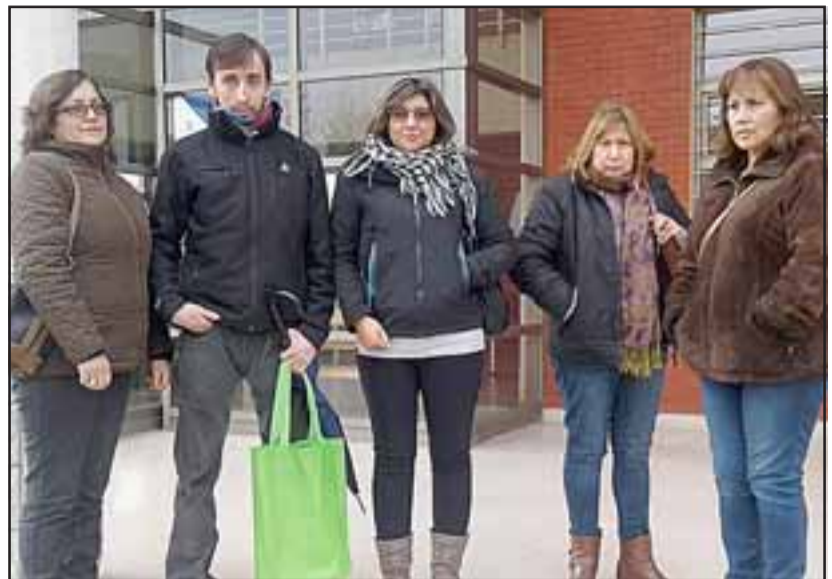
Dirigentes de comités saliendo del Tribunal, en una de las tantas audiencias. (Archivo).

- No comentan absolutamente nada, ellos se remiten a que sea un juicio abreviado donde el día 3 de agosto recién se irá a comentar, leerán todos los documentos que están en contra, nosotros teníamos muchas pruebas que los incriminaban a ellos, que es relativamente una estafa, menos mal que toda la ope-