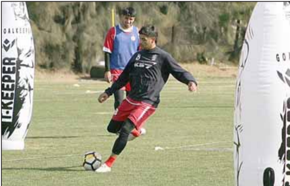
La escuadra sanfelipeña cumplió dos semanas de fuertes trabajos de Intertemporada.