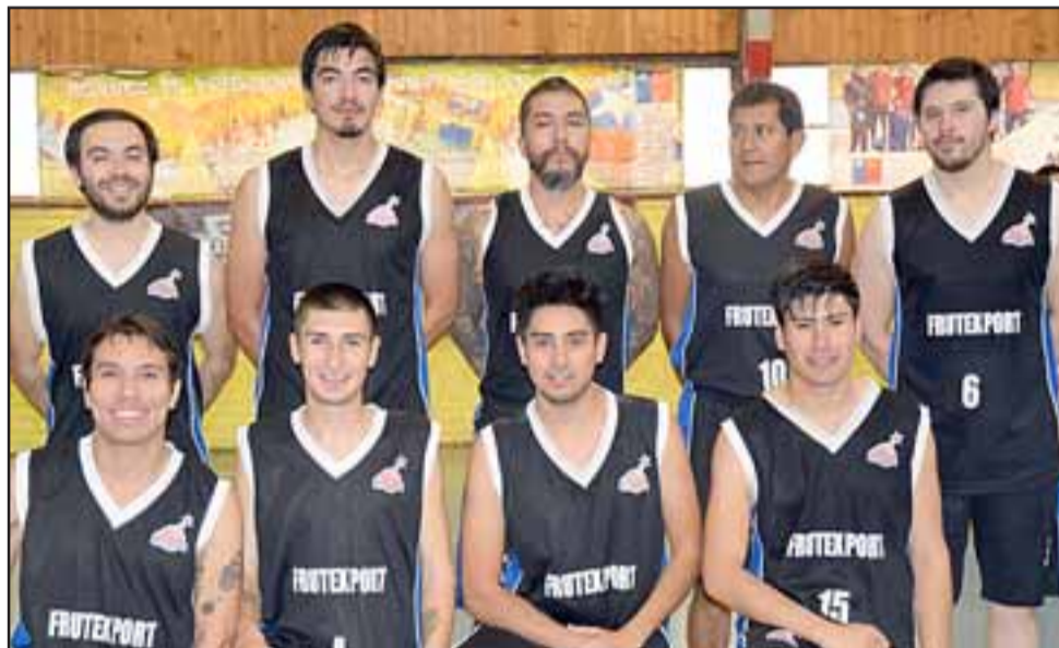
CAMPEONES Y ANFITRIONES. - Ellos son en Club Deportivo Frutexport, de San Felipe, los nuevos campeones 2018.