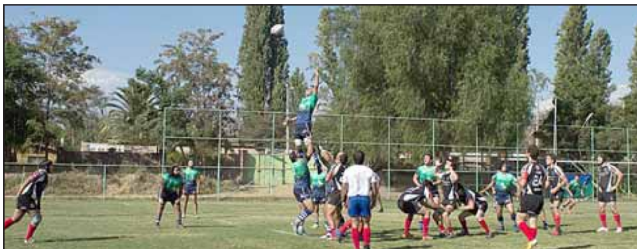
Los Halcones se quedaron con las ganas de estrenarse en el Clasificatorio A de Arusa.