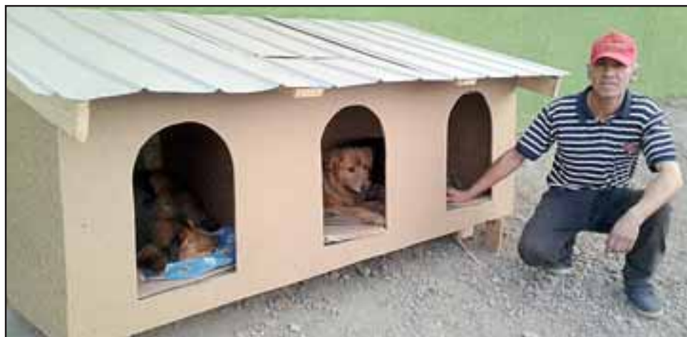
Vitoko junto a la casa con tres habitaciones que cobija al Chascón, Madonna y La Rucia.