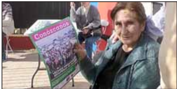
Esta vecina muestra el boletín informativo de su población.

De esta manera, las autoridades hicieron entrega a la comunidad de la primera edición del boletín informativo barrial, el que fue creado con participación de los vecinos que integran el Taller de Periodismo Comunitario y que reúne las noticias del barrio Escuadra Argelia. Se trata de un total de cuatro ediciones que serán distribuidas en la totalidad de las viviendas del sector de manera gratuita.