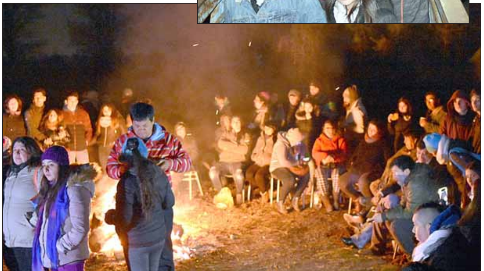
FOGATAS.- Con fogatas al aire libre cada uno de los presentes experimentó una distinta sensación bajo el manto de la noche.