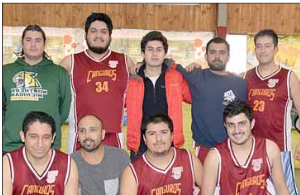
SALTANDO SIN PARAR. - El tercer lugar fue para Canguros, de San Esteban, muchachos que engrandecieron la jornada dando su mejor esfuerzo.