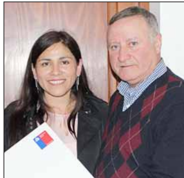
De acuerdo a lo manifestado por la Seremi, está toda la intención de ejecutar un plan integral para desarrollar políticas deportivas en Panquehue.

Acoto que en estos últimos años se ha potenciado el fútbol, tenis, basquetbol, ciclismo extremo, artes marciales, pues lo que interesa es que los jóvenes puedan desenvolverse en aquellas ramas deportivas que sean de su gusto y no impuestas por la autoridad.