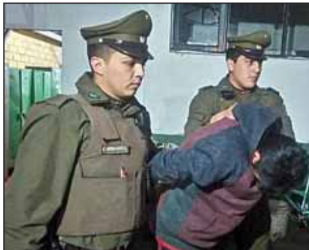
El imputado tras ser capturado por Carabineros fue formalizado por la Fiscalía por Robo en lugar habitado, quedando sujeto a la cautelar de prisión preventiva. (Foto Archivo).

con su grupo familiar. Momentos más tarde recibieron una llamada telefónica de parte del cuidador del fundo, advirtiendo la presencia de dos desconocidos