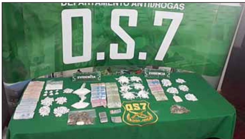
Tras un masivo operativo policial efectuado por Carabineros, se incautó desde tres domicilios clorhidrato de cocaína, pasta base y casi un millón de pesos en efectivo en las villas 250 años e Industrial de San Felipe.

Por representar un serio peligro para la salud de la