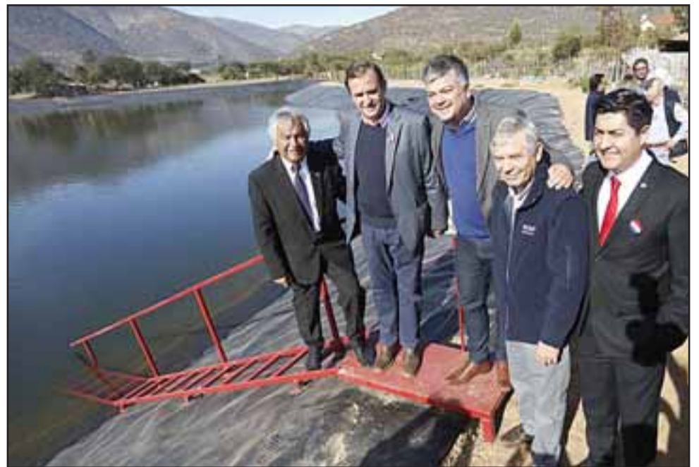
Nuestra comuna de San Felipe también se verá beneficiada con estos fondos aprobados para el recurso hídrico.

SAN FELIPE TAMBIÉN Además, estos recursos