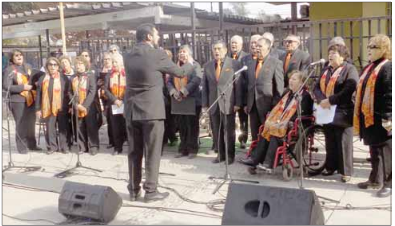
CORO ADULTO MAYOR. - Ellos son los referentes del Coro Adulto Mayor, de San Felipe, quienes harán su mejor trabajo como artistas anfitriones en esta jornada.