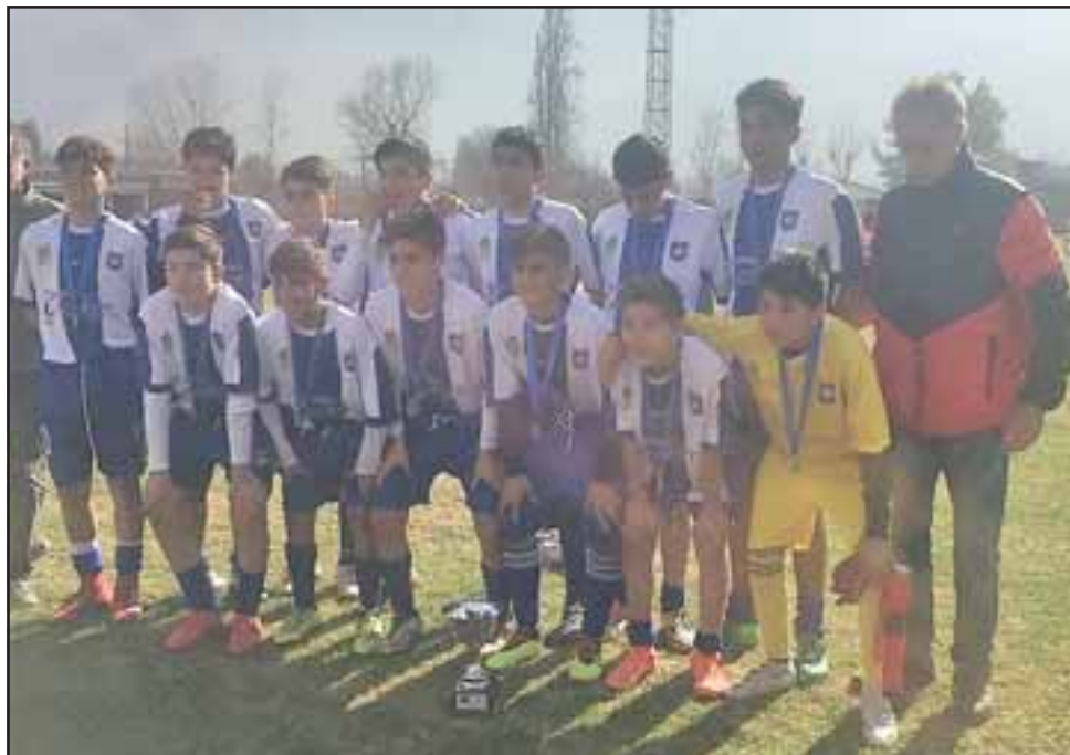
El combinado de la Escuela Industrial se convirtió en el monarca provincial de la serie U14 en la disciplina del fútbol.

la oportunidad de vivir una gran experiencia de vida y deportiva, porque a sus cortas edades podrán jugar en el principal torneo infantil del balompié chileno, y así muy chiquititos comenzarán a soñar con algún día llegar a ser futbolistas profesionales.