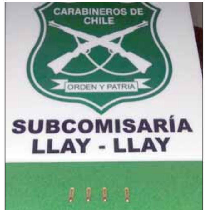
En aquel entonces, los funcionarios policiales incautaron cuatro cartuchos balísticos calibre 22 en poder del actual sentenciado.

AVISO: Por extravío quedan nulos cheques desde N° 2817682 al 2817690, Cuenta Corriente N° 23100018497 del Banco Estado, Sucursal Llay Llay. 26/3