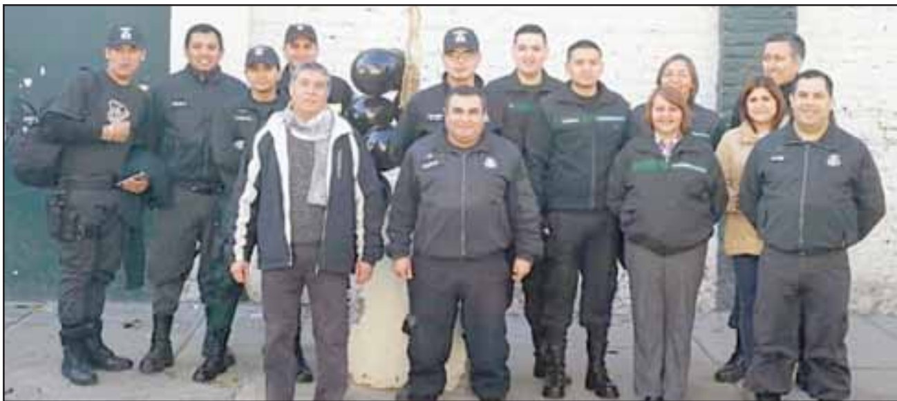
Los funcionarios de Gendarmería de San Felipe se formaron afuera del recinto para expresar su malestar.

en día la realidad penitenciaria, esto le puede suceder a cualquiera porque su labor no es normal, estar bajo la custodia de doscientos internos. En este momento en la unidad penal de San Felipe hay funcionarios en esa circunstancia, pero más allá de eso es nuestro apoyo a las manifestaciones que se están produciendo en la ciudad de Santiago por parte de nuestros dirigentes nacionales, que tienen que ver con una realidad que se viene dando desde hace muchos años: la nula satisfacción de las necesidades básicas para poder cubrir las atenciones y el trabajo propio de Gendarmería de Chile, eso sin lugar a dudas no se ha cumplido, es más, en estos momentos la Unidad de San Felipe es una de las unidades más longevas del país, estamos hablando de una construcción que data del año 1901 y hasta el día de hoy, con la sobre pobla-