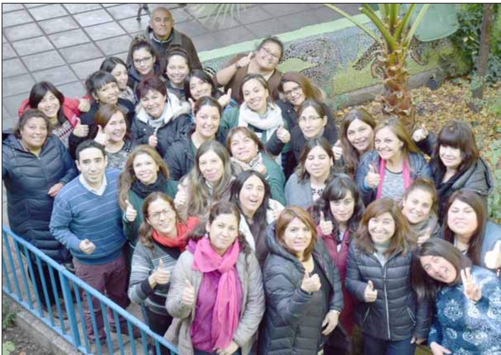
MEJORANDO JUNTOS.- Estos son sólo una parte de los profesores de la Escuela José de San Martín que podrán acceder hasta el año 2020, de las pasantías y demás beneficios de esta Red.

Esta semana fue informada la Dirección de la Es-