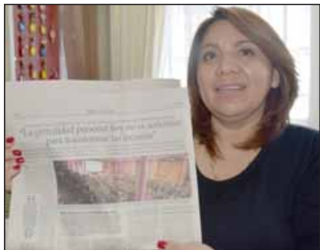
Esta premiación a la escuela ya es noticia nacional, El Mercurio dedicó dos páginas enteras a destacar el trabajo de estos profesores y el de otras escuelas también.