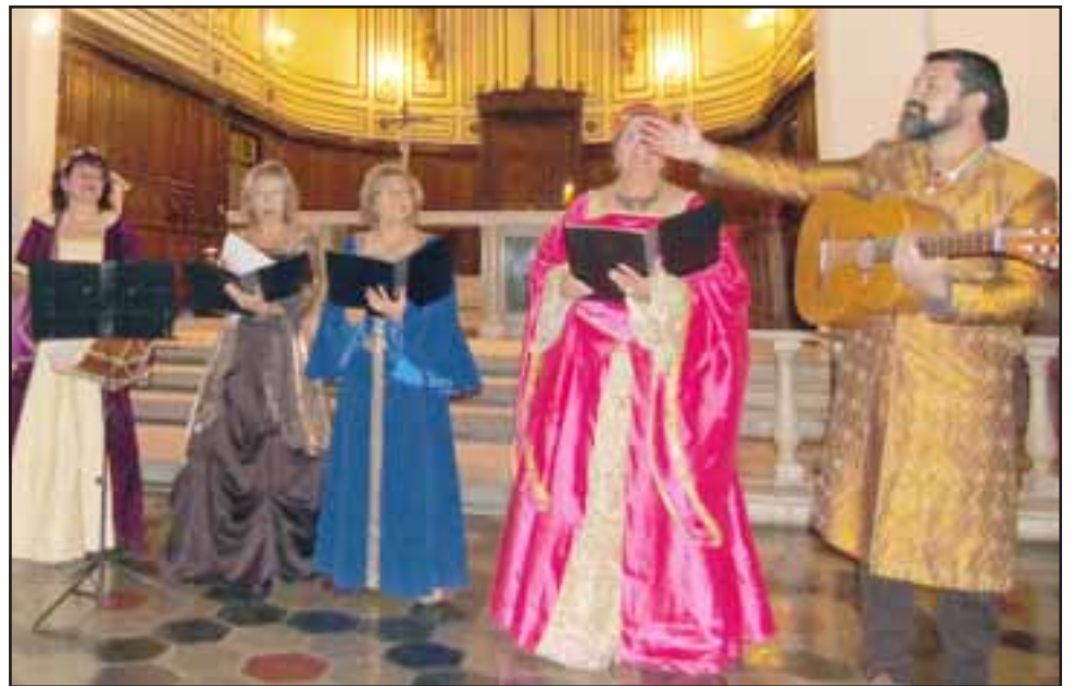
SIEMPRE CAMERATA. - Aquí está Camerata Aconcagua, únicos en la V Región que presentan su repertorio de Música Medieval.