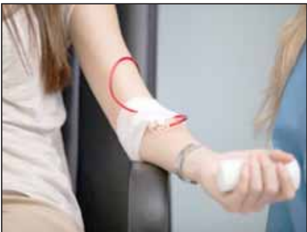
Para donar, los interesados deben tener entre 18 y 60 años, portar su cédula de identidad, pesar más de 50 kilos, haber dormido al menos 5 horas y haber desayunado.

El proceso de donación de sangre, que extrae 450 ml de sangre, permite salvar hasta 3 vidas de personas adultas, ya que al llegar al Centro de Sangre de Valparaíso, ésta es dividida en 3 componentes: glóbulos rojos, plasma y plaquetas, los que se transfundirán a diferentes enfermos en función de sus necesidades.