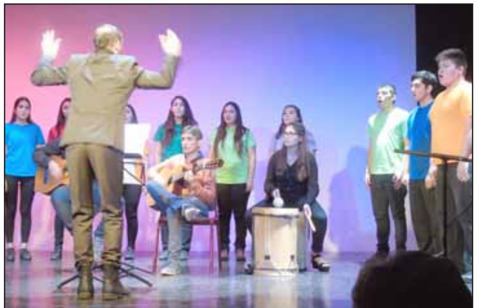
INVITADOS ESPECIALES. - El Coro del Liceo Max Salas, de Los Andes, también mostrará sus mejores interpretaciones corales en este Encuentro interregional de coros.