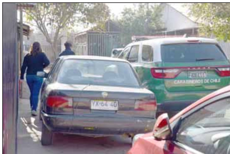
EN INVESTIGACIÓN.- El desconcierto sigue siendo absoluto en torno a este lamentable deceso de un bebé de apenas tres meses de edad en Villa Juan Pablo II.