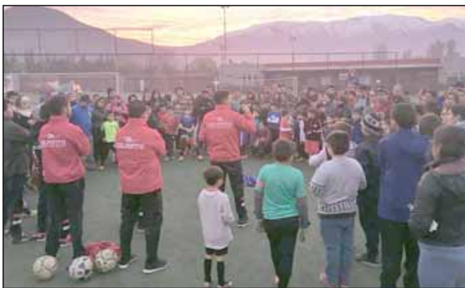
Niños de todo el valle de Aconcagua sueñan con ser los elegidos para ser parte de las nuevas series infantiles del Uní Uní.

mente comprometido, notándose la mano y conducción certera de un profesional ligado toda su vida al fútbol profesional, que ahora hace soñar a la Escuela Industrial con un título regional que lo catapulte al Nacional Escolar de la categoría.