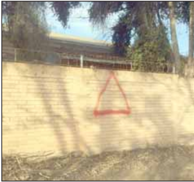
Los delincuentes dejaron una marca en el muro hecha con spray para guiarse en medio de la noche y perpetrar el robo, sin lograr ser descubiertos.