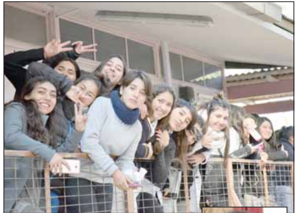
CHICAS SORPRENDIDAS. - Las jovencitas del Liceo de Niñas disfrutaron el sorpresivo concierto ofrecido la mañana de este martes por la Banda Ficks.

pectáculo. Tenemos también la idea de armar un proyecto que nos permita hacer presentaciones de bandas locales en los establecimientos de la comuna y vamos a trabajar en eso, ya que además de entregar espacios a los artistas,