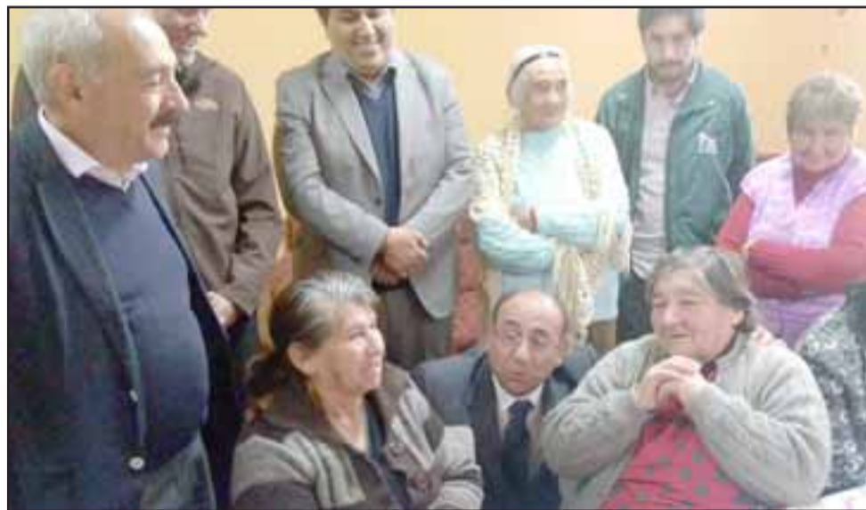
El gobernador compartió con los adultos mayores del sector que todos los martes realizan diferentes actividades de esparcimiento para tener una vejez digna. Incluso cantó junto a ellos el clásico bolero de Carlos Gardel: 'El día que me quieras'.

sector de 'Las 4 Villas' y del resto de la comunidad. Creo que esto es perfectamente posible que lo podamos lograr, acá vive gente decente y honesta. No es justo pensar que todos los que viven aquí son personas de mal vivir, eso no es así", sostuvo el gobernador Rodríguez Cataldo.