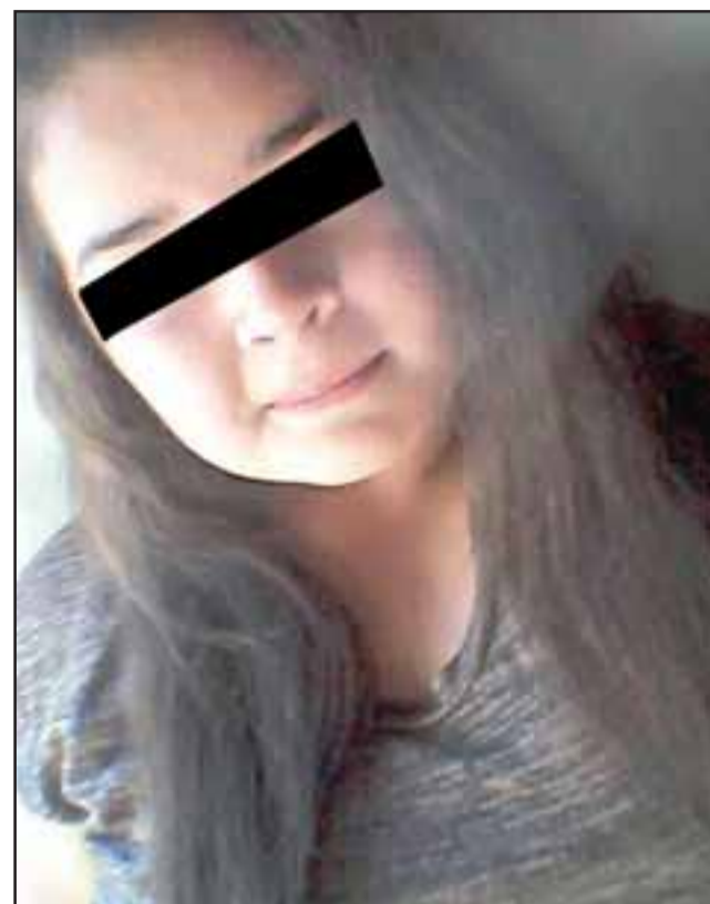
La menor de 17 años de edad fue reportada ante las policías como desaparecida por su madre desde este lunes.