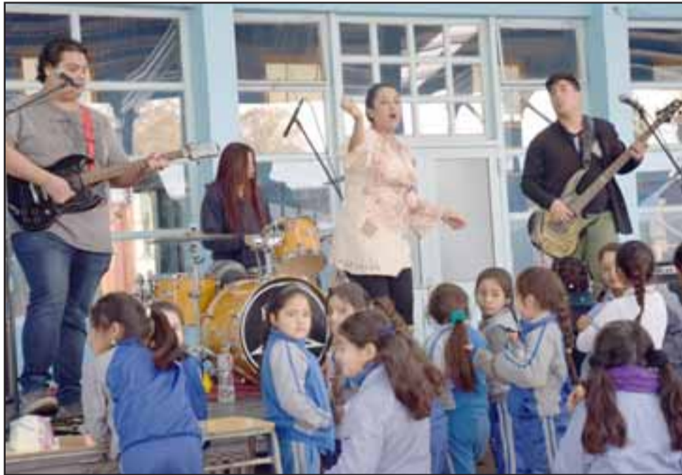
SÚPER FICKS. - Ellos son la única banda inclusiva del Valle de Aconcagua, quienes ya contemplan la idea de seguir presentándose en algunos colegios.

generar espacios para que los artistas locales muestren lo que están haciendo, así que esta presentación se enmarca en nuestros objetivos. Además, fue una especie de intervención artística que no estaba informada, así que las alumnas se sorprendieron bastante y disfrutaron del es-