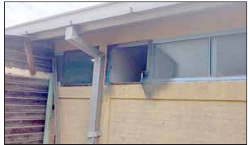
Por esta pequeña ventana los delincuentes ingresaron hasta la bodega de la Escuela San José de Catemu, para sustraer los equipos de amplificación.

La directora detalló que los sujetos ingresaron por una pequeña ventana protegida por una malla mosquitera, la que destruyeron para ingresar a esta dependencia, logrando apoderarse de los equipamientos, escapando por este mismo lugar. Debido a la cantidad y dimensiones de las especies, el robo habría sido cometido por más de una per-