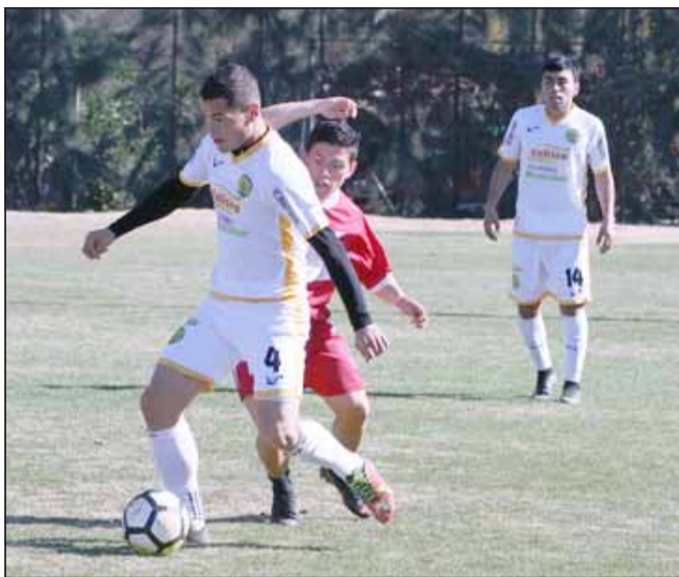
Union San Felipe jugó su primer amistoso de Intertemporada en el cual superó 1 a 0 a Lautaro de Buin.

de estamos en lo futbolístico; si bien es cierto aún falta algo para comenzar el torneo, nos vino muy bien el poder hacer fútbol, ya que el equipo respondió bien en lo físico y en los aspectos del juego también”, analizó el estratega.