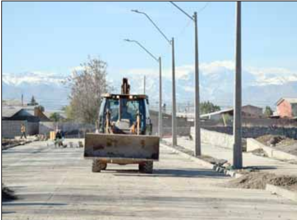
YA CASI.- Para el próximo mes, entre el 5 y 9 de julio, se estará entregando a la comunidad el Proyecto Construcción Circuito Calle San Martín Hermanos Carrera Oriente.