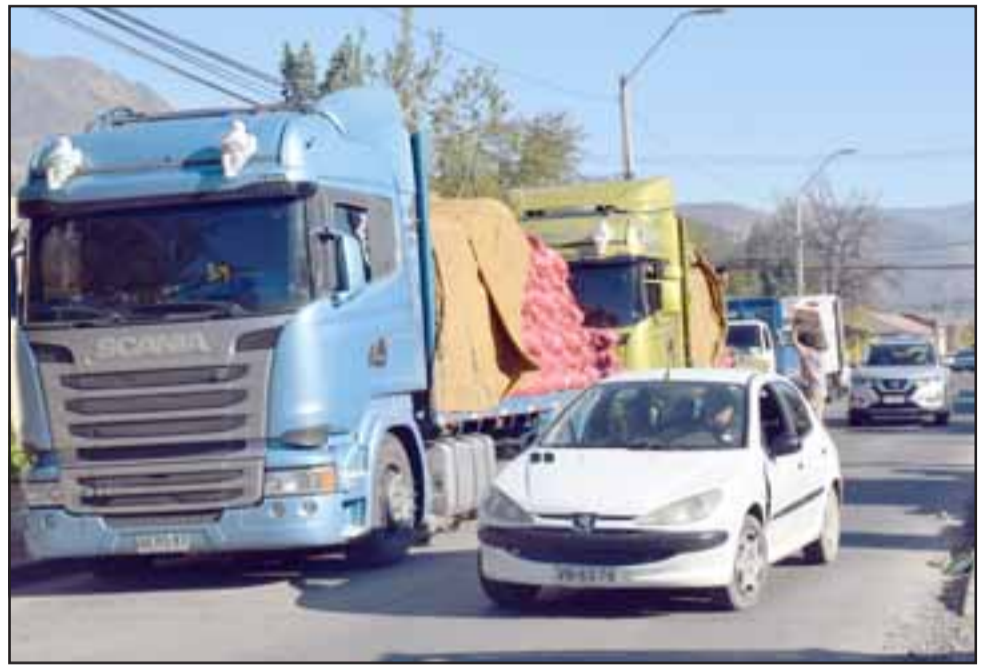
ESTO CAMBIARÁ.- Este es el mediano congestionamiento que se vive actualmente en Calle San Martín con los camiones feriantes.

también límites para el uso que los camioneros con frutas y verduras hacen de la vía, pues a la fecha en varios horarios del día, a veces se generan dificultades para transitar en el sector.