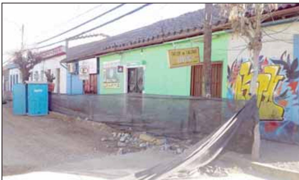
Acá se aprecia el local y también los trabajos que se están realizando en calle Prat.

En ese contexto podemos recordar los dos locales de venta de ropa ubicados por calle Prat, que fueron víctimas de la delincuencia, lo mismo sucedió con la sede de Cruz Roja ubicada en la misma arteria.