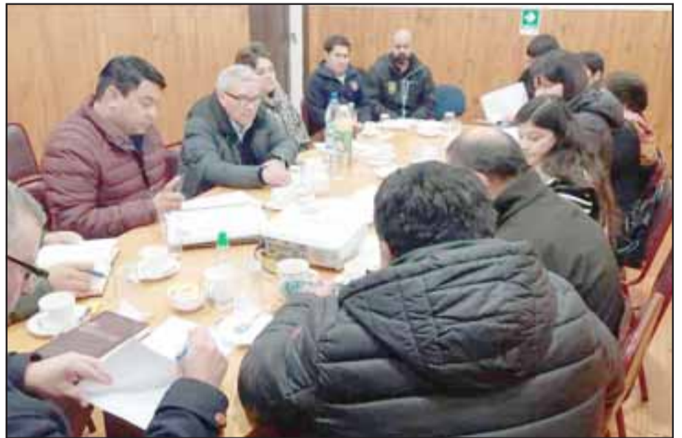
Directores de Departamentos Municipales junto al alcalde de Panquehue se informaron sobre los indicadores que debe mejorar la comuna en el Diagnóstico Regional de Salud.