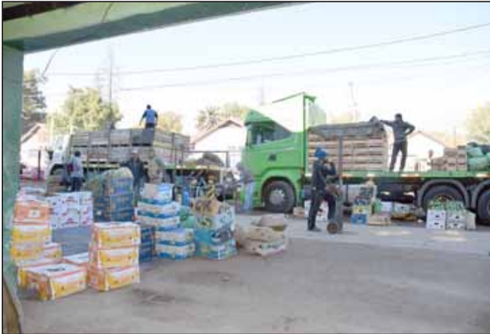
TODO REGULADO.- Este antejardín sería ahora de uso obligatorio para que los camiones estacionen sus pesados vehículos.

Esta obra, pese a que estaría generando 'un respiro' a nuestra ciudad en materia de congestión vial, también estaría requiriendo de un ordenamiento que estableciera