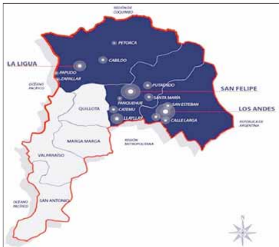
Las provincias de San Felipe, Los Andes y Petorca conformarían la nueva Región de Aconcagua.