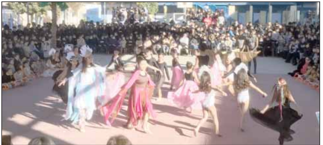
Las alumnas del taller de danza se lucieron con una presentación que destacó por su preparación y vestimenta, en la que colaboraron también sus apoderados.

"Participan todos los niños, participan apoderados también, que se invo-