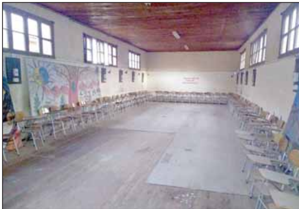
Las autoridades recorrieron los distintos lugares de la ex Escuela para, en el futuro, proyectar una remodelación y tener distintos espacios para que las familias compartan y realicen distintas actividades.

"Este es el punto de partida para poder soñar como lo conversamos con el alcalde, cambiar la imagen que tiene todo este sector de las 4 Villas y del resto de la comunidad", expresó el gobernador Claudio Rodríguez Cataldo.