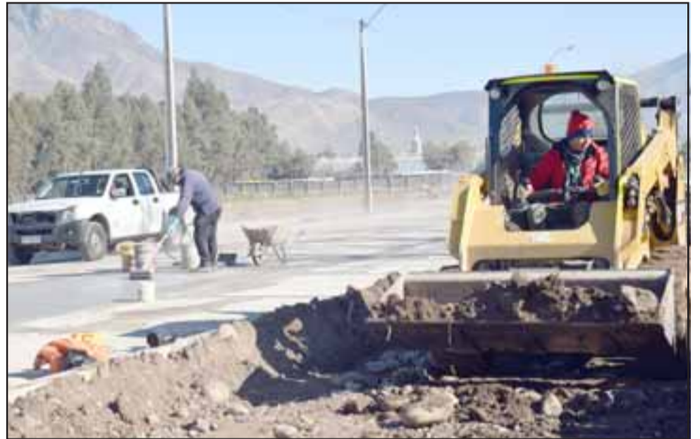
TODO NUEVO.- Este proyecto consiste en la construcción de 492 metros lineales de calle inexistentes, de los cuales 374 metros corresponden a Calle San Martín, desde El Molino a la proyección de la Hermanos Carrera Oriente.