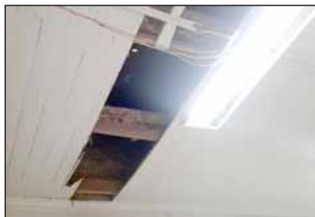
Por este forado en el cielo se supone que ingresaron los delincuentes.