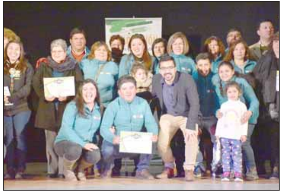
Representantes de distintas organizaciones beneficiadas posan junto a las autoridades encabezadas por el alcalde de Llay Llay.

Respecto al tipo de entidades que participaron del proceso, estas fueron organizaciones de la comuna legalmente constituidas que presentaron sus proyectos a uno de los tres fondos disponibles, de acuerdo a su perfil: Subvención , para organizaciones comunitarias de carácter funcional; Fondeve , para