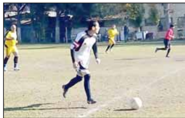
Este domingo habrá movimiento de balón en la Liga Vecinal y el torneo de la Asociación de Fútbol de San Felipe.

Para el domingo 1 de julio se programó la segunda fecha del torneo oficial de la Asociación de Fútbol