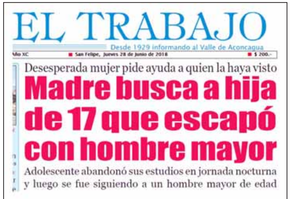
LECTORES AYUDARON.- Este titular y el reportaje del periodista Pablo Salinas dieron resultados rápidos y definitivos en este caso.