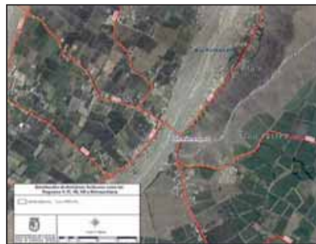
Este es el plano de recorrido de los camiones con anhídrido sulfuroso.

que esté ubicado ahí y transporten en camiones grandes que pueden tener accidentes, porque es un elemento tóxico; si uno libera elementos sin las condiciones necesarias por las cantidades, los trabajadores pueden tener un efecto directo y tóxico inmediato, por ende puede haber un riesgo si por ejemplo hay un choque. Nosotros consideramos que está bien que haya un almacenamiento industrial, pero que se haga con las condiciones necesarias, como por ejemplo lo que dice la municipalidad en la declaración de impacto ambiental, se menciona que tienen que tener ciertos resguardos, arreglar las calles, hacerlas más grandes y el MOP dice algo súper interesante, que deberían tener alarma y un control de GPS para ver donde están los camiones en caso que haya un accidente. A nosotros nos parece muy importante eso porque cuando la persona -si es que llega a haber un accidente- va a estar inconsciente y no va a poder avisar, si es cerca o lejos va a generar un impacto en la comunidad».