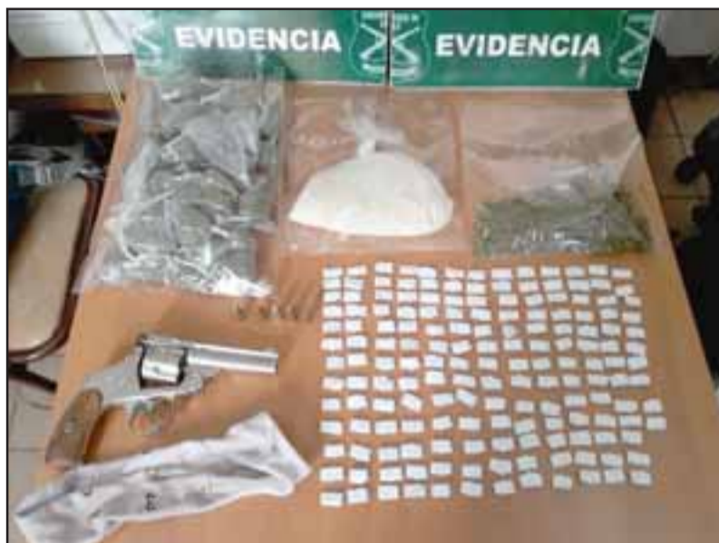
Personal de la SIP de Carabineros de San Felipe logró reducir al delincuente, incautando un arma de fuego cargada, marihuana y pasta base de cocaína en la Villa El Totoral de San Felipe.

De acuerdo a la información policial, el armamento utilizado por el antisocial se trataría de una pistola cargada con cinco cartuchos. Asimismo se pudo comprobar que el bolso del cual se despojó este sujeto, mantenía 48 bolsas de marihuana elaborada y