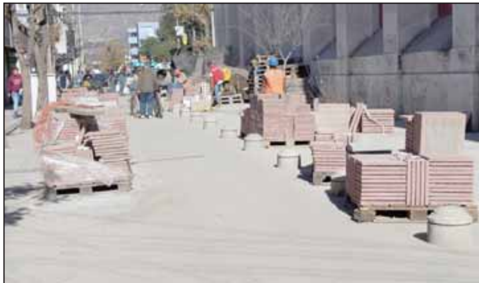
La próxima semana se abrirá el boulevard de calle Coimas, una vez que concluyan los detalles menores como colocación de baldosas y cemento.

«Este eje semipeatonal está finalizando. Es probable que los primeros días de la próxima semana sea entregado al tránsito de veci-