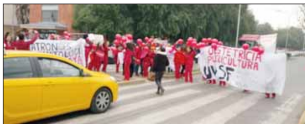
Las matronas manifestándose en la calle, frente al Hospital San Camilo.

En esta manifestación participaron matronas de todo el Valle de Aconcagua, dejando como corresponde personal en turnos éticos.