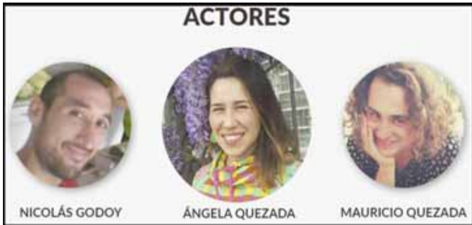
MUCHO TALENTO.- Ellos son los actores que participan en este montaje teatral, y estarán este sábado en San Felipe.

entrada es liberada y todos nuestros lectores están invitados a disfrutar del montaje.