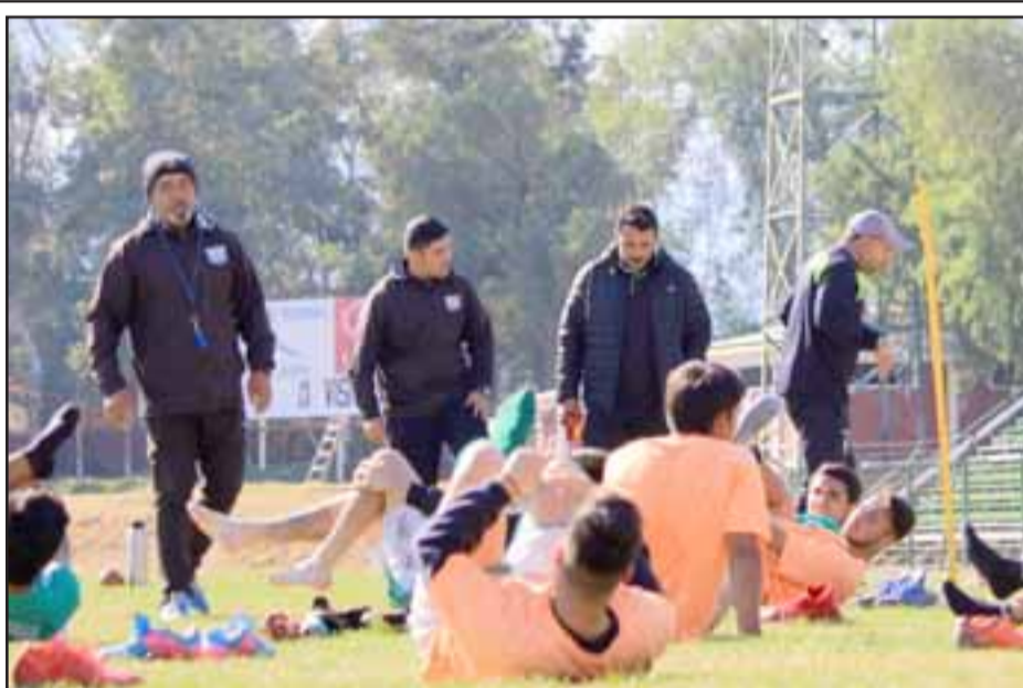
El Conjunto de Los Andes debe dejar los tres puntos en casa en el juego de este sábado frente a Colina.

Aconcagua, el balón estará detenido y de acuerdo a lo que informó su sitio oficial, recién el sábado 7 de julio se reactivará, cuando en la cancha del Prat se juegue el partido pendiente entre Magisterio y Los del Valle.