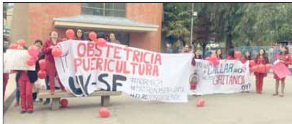
Las matronas manifestándose en el frontis del Policlínico de Especialidades.