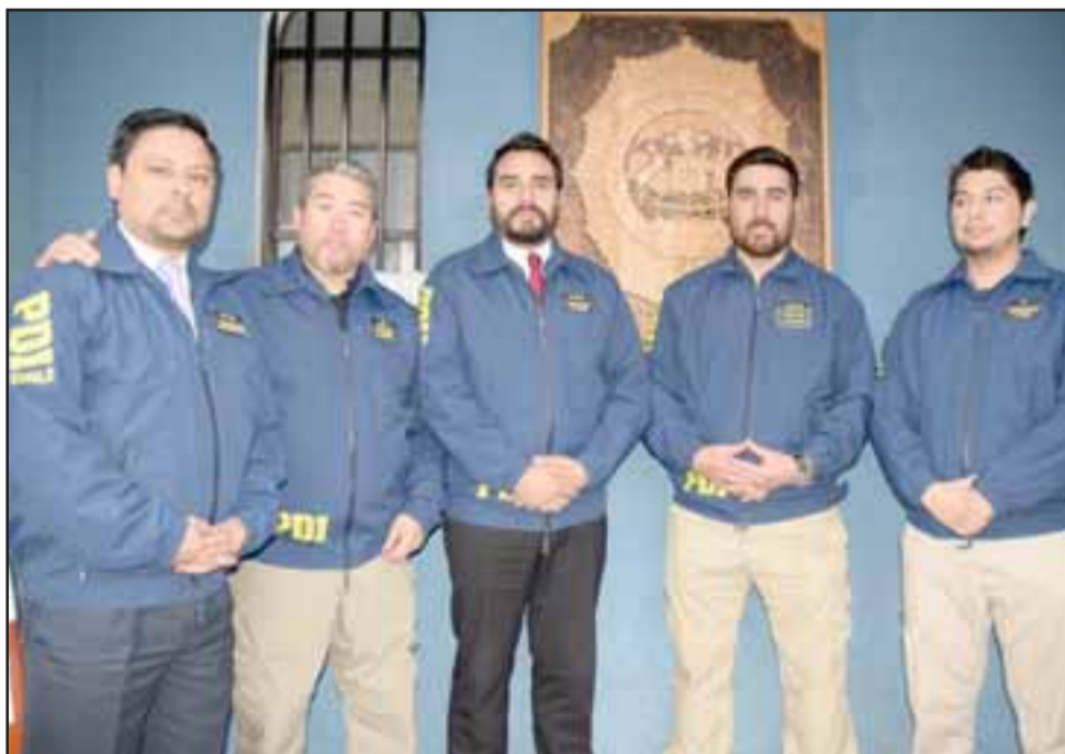
RÁPIDO ACCIONAR.- Ellos son los detectives de la Bicrim San Felipe, encargados de dar con el paradero de la joven que se había fugado.