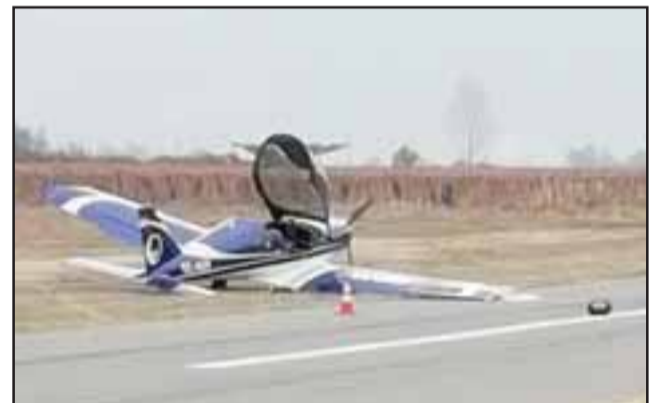
La avioneta quedó a un costado de la pista sin su tren de aterrizaje.