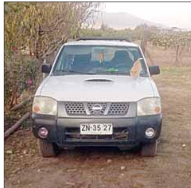
Esta es la otra camioneta que también robaron.

- Siempre me he estacionado en una de esas calles, caminé por una de esas calles donde venden la ropa, hay una señora que está sentada y dice que llega una camioneta blanca Chevrolet Dimax, se pone delante, se bajan, la abren como si fuera de él, se sube un tipo y la hacen partir, no suena la