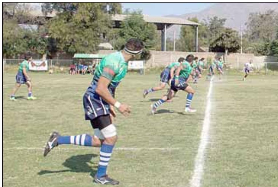
De no surgir un problema mayor, este sábado se producirá el debut de Los Halcones en la dura competencia A de Arusa.