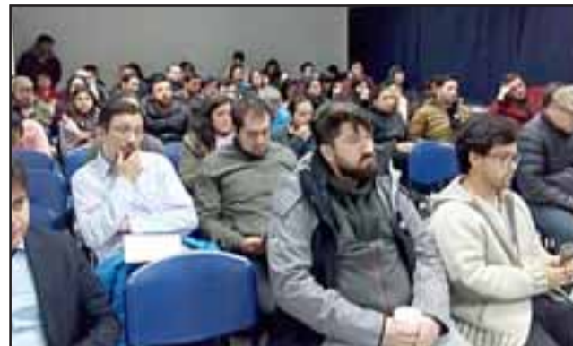
El congresista compartió con docentes y estudiantes, con los que debatió sobre diferentes temáticas que hoy afectan al Valle de Aconcagua.