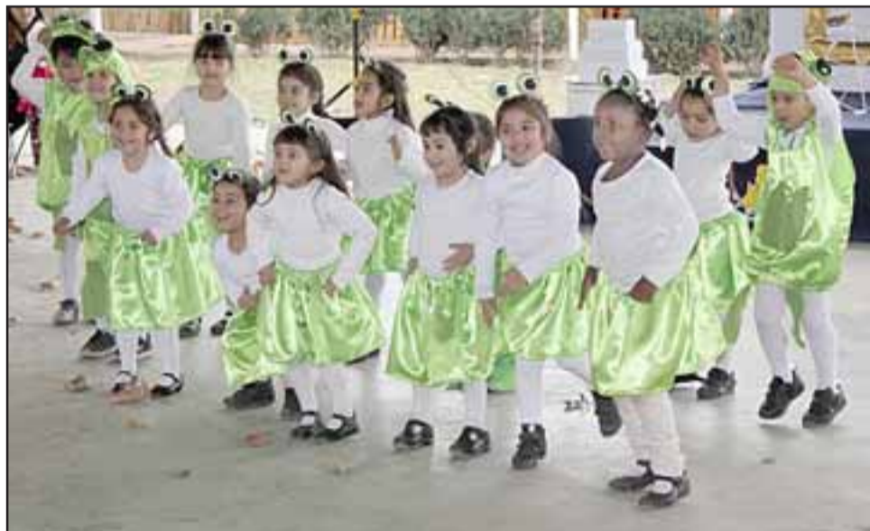
Ellos forman parte de la matrícula de esta escuela panquehuina, en total son 115 niños.