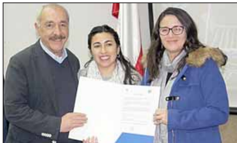
La iniciativa busca reducir brechas en los diferentes determinantes sociales de la salud y en esta primera etapa se desarrollará en las comunas de San Felipe y Calle Larga.

cipios, de los encargados de seguridad pública, todos en búsqueda de las alternativas que permitan nivelar situaciones de inequidad que finalmente inciden en la salud de las personas. Muchas veces a quienes trabajamos en las redes asistenciales se nos asocia con la atención de nuestros usuarios cuando enferman, pero también hay un aspecto fundamental que es actuar preventivamente e incidir en los determinantes sociales de la salud, especialmente cuando, tal como lo ha subrayado el Presidente Piñera, se trata de los grupos más vulnerables», explicó la directora del Servicio de Salud Acon-