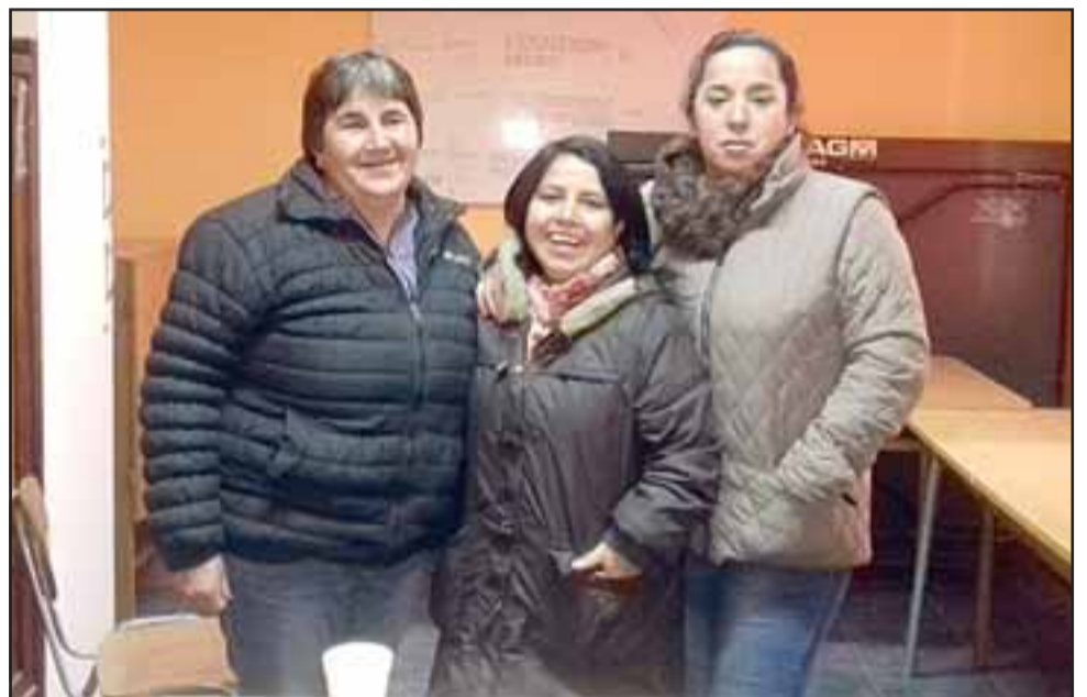
Las integrantes del Tribunal Calificador de Elecciones, Tricel.

- ¿Qué van a hacer, presentarán demandas algo así?