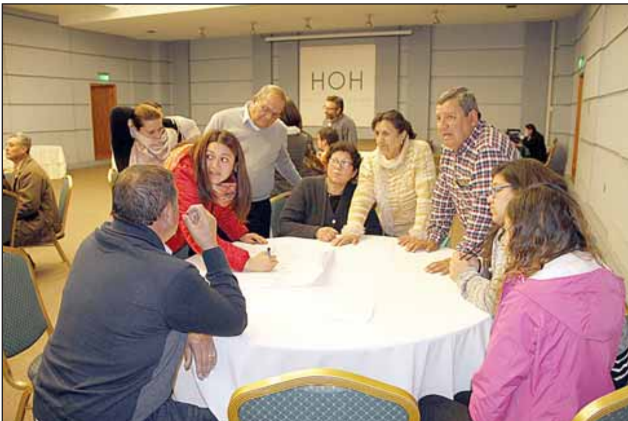
Vecinos de las localidades de Río Blanco, Bocatoma y Riecillo se dieron cita en un nuevo taller socioambiental de Codelco División Andina.