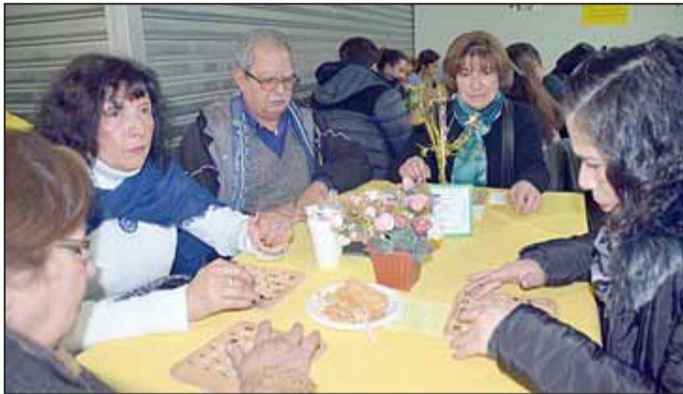
BINGO SOLIDARIO. - Los sanfelipeños respondieron positivamente jugando muchos cartones en este Bingo.