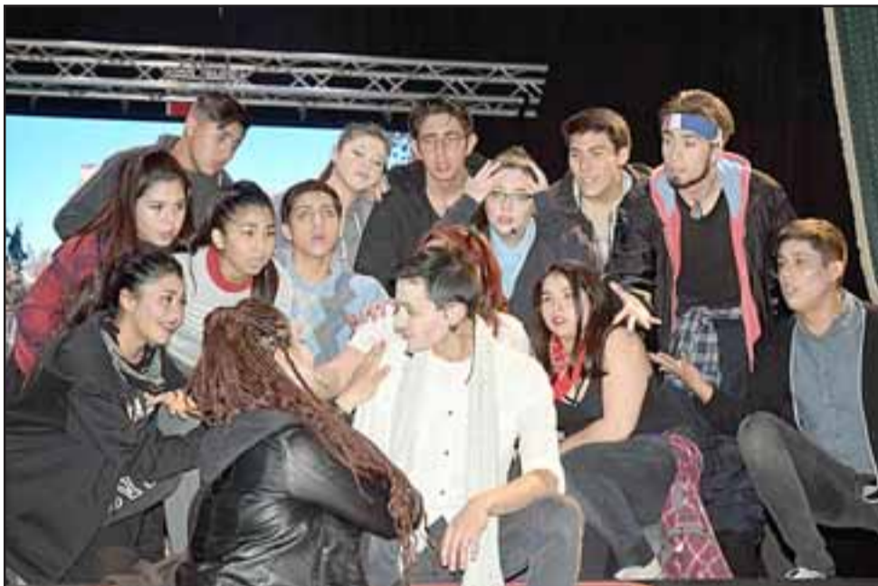
SIEMPRE POLÉMICO.- Y así, el Cristo fue increpado por quienes le apoyan y hostigan durante la obra.