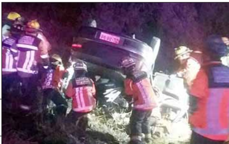
El vehículo que conducía Cristián Fierro Fuentes volcó cerca de la Planta de Los Quilos.

Vehículo menor impactó contra acoplado de camión: