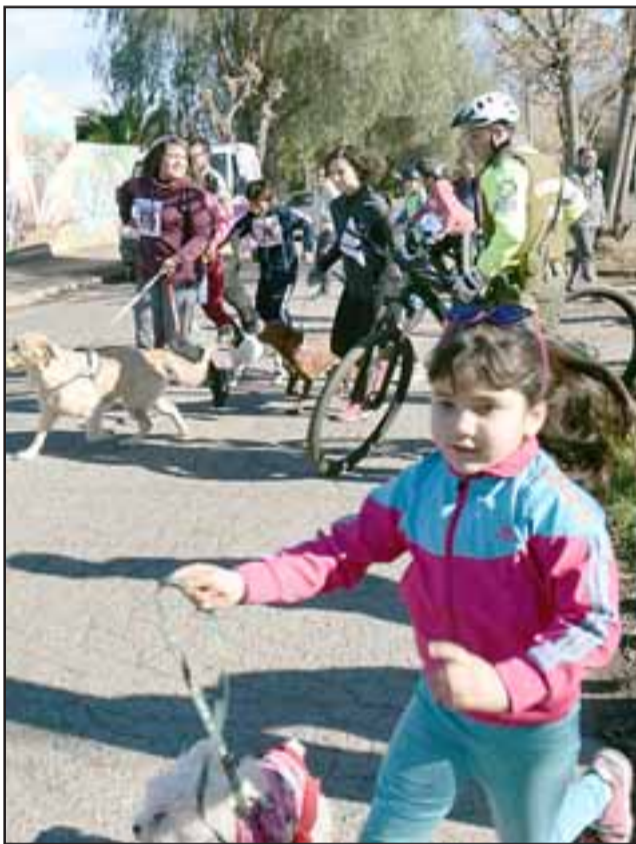
Esta pequeñita fue una de las que más corrió con su mascota, no había que ganar, lo importante era correr.