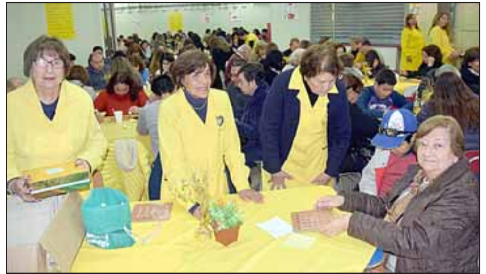
SIEMPRE DE AMARILLO. - Estas voluntarias llevan muchos años sirviendo al prójimo con abnegada entrega.