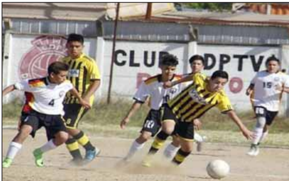
En agosto comenzará el torneo Regional U17.

7: San Felipe, Hijuelas, Los Andes, Putaendo.