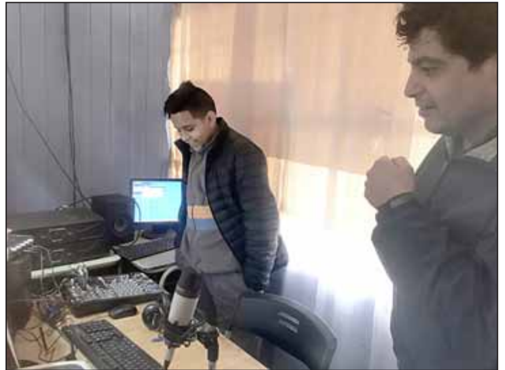
Colocar la radio de la Escuela Manuel Rodríguez en Internet era uno de los objetivos del equipo directivo y docente de ese establecimiento educacional.

La radio se encuentra en proceso de marcha blanca, pero de igual forma, el trabajo fue destacado por el alcalde Patricio Freire,