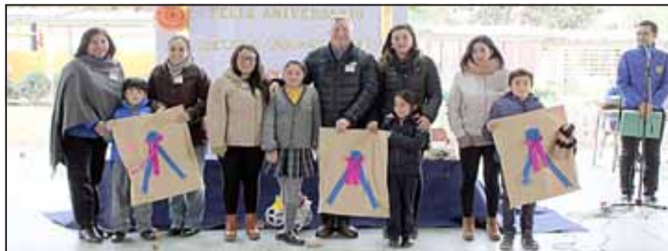
Esta escuela cuenta con un programa de integración que atiende a 30 alumnos desde primer nivel de transición a sexto básico.

La escuela desde el año 2007 a la actualidad ha aumentado su matrícula ostensiblemente, pasando de 78 a 112 alumnos. Este incremento se benefició gracias al ingreso a la jornada escolar completa de párvulos. Además la escuela cuenta con un programa de integración que atiende a 30 alumnos desde primer nivel de transición a sexto básico, apoyado por un equipo multidisciplinario. En la actualidad la escuela cuenta con una matrícula de 115 alumnos.