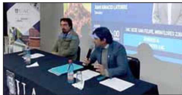
La Sede San Felipe recibió la visita del Senador de Revolución Democrática Juan Ignacio Latorre, quien realizó una ponencia denominada Derecho Humano al Medioambiente.

espacio abierto a todos», agradeció la presencia del Senador Latorre.