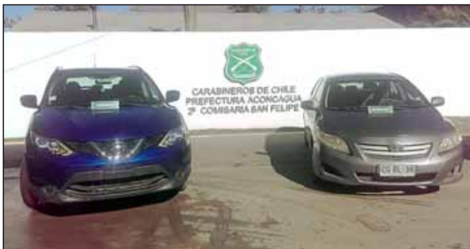
Personal SIP de Carabineros de San Felipe recuperó los vehículos encargados por Robo que se encontraban ocultos dentro de una vivienda de Villa La Estancia de esta ciudad.

La detención de la acusada fue controlada ayer domingo en el Juzgado de Garantía de San Felipe, siendo formalizada por Fiscalía por estos delitos, re-