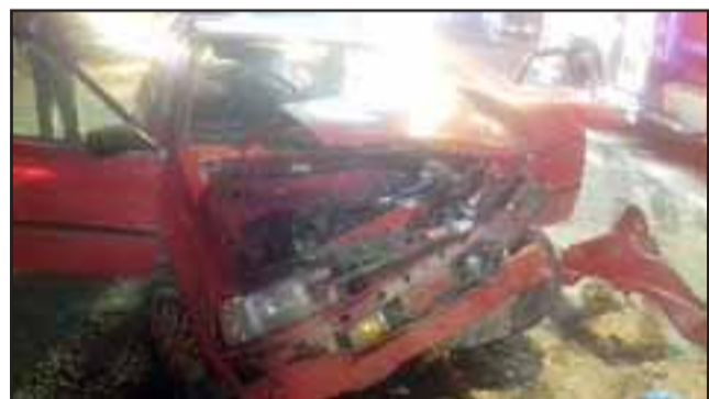
Así quedó el automóvil abordado por la pareja de adultos mayores tras el accidente ocurrido la noche de este viernes.

camión", puntualizó a Diario El Trabajo el teniente de Carabineros, César Bustamante.