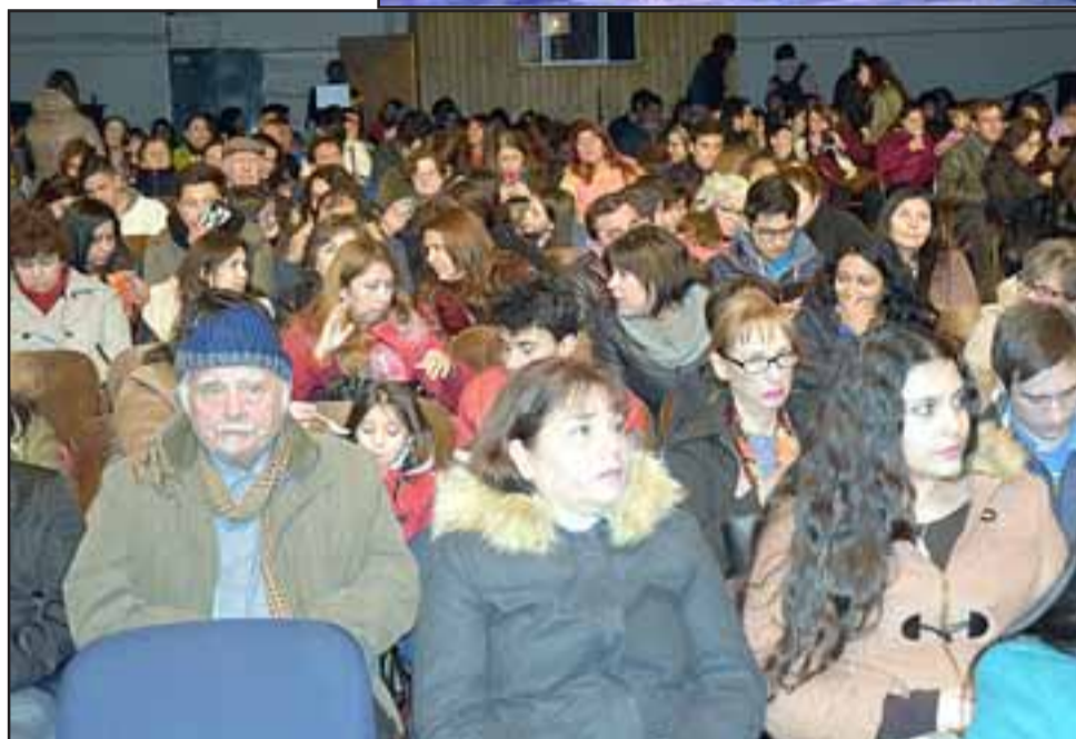
A TEATRO LLENO.- El teatro estaba repleto para ver esta versión actualizada de la obra.