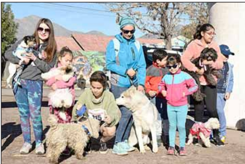
FAMILIAS ANIMALISTAS.- Familias enteras se dieron cita este domingo para vivir la Perruning 2018.