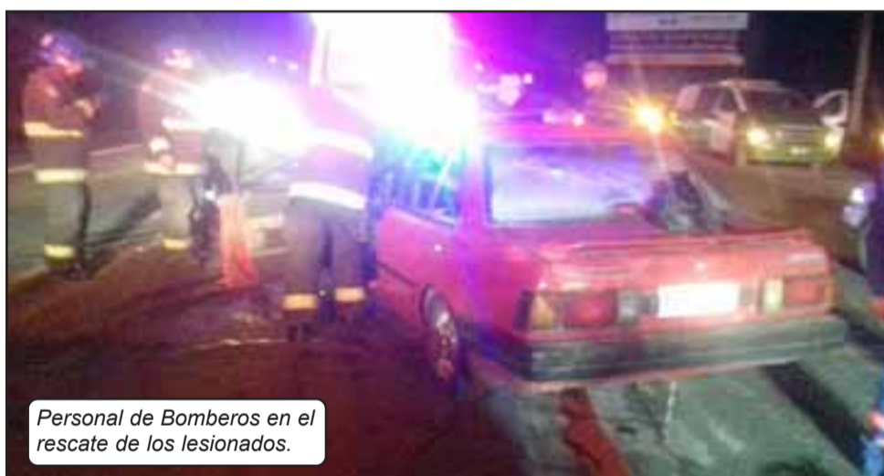
Personal de Bomberos en el rescate de los lesionados.

Según informó Carabineros, un camión que transitaba desde San Felipe en dirección al poniente realizaba una maniobra de viraje en la ruta, "debido a la hora y la poca visibilidad otro vehículo menor que se trasladaba en la misma dirección no se percató que este camión estaba efectuando un viraje colisionando con el acoplado del