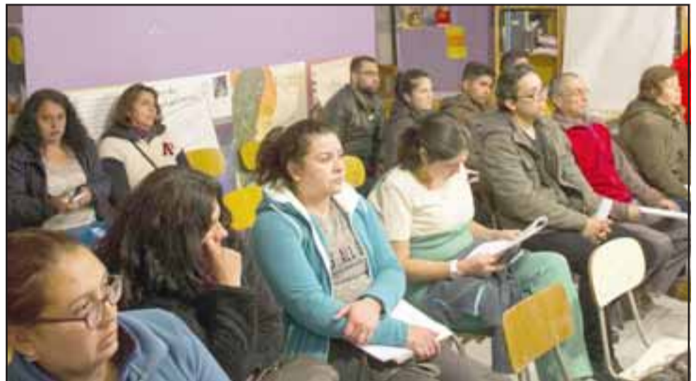
Los vecinos calificaron de positiva la reunión y valoraron la presencia de las autoridades, participando todas las organizaciones del sector, desde la Punta del Olivo hasta Las Cabritas.