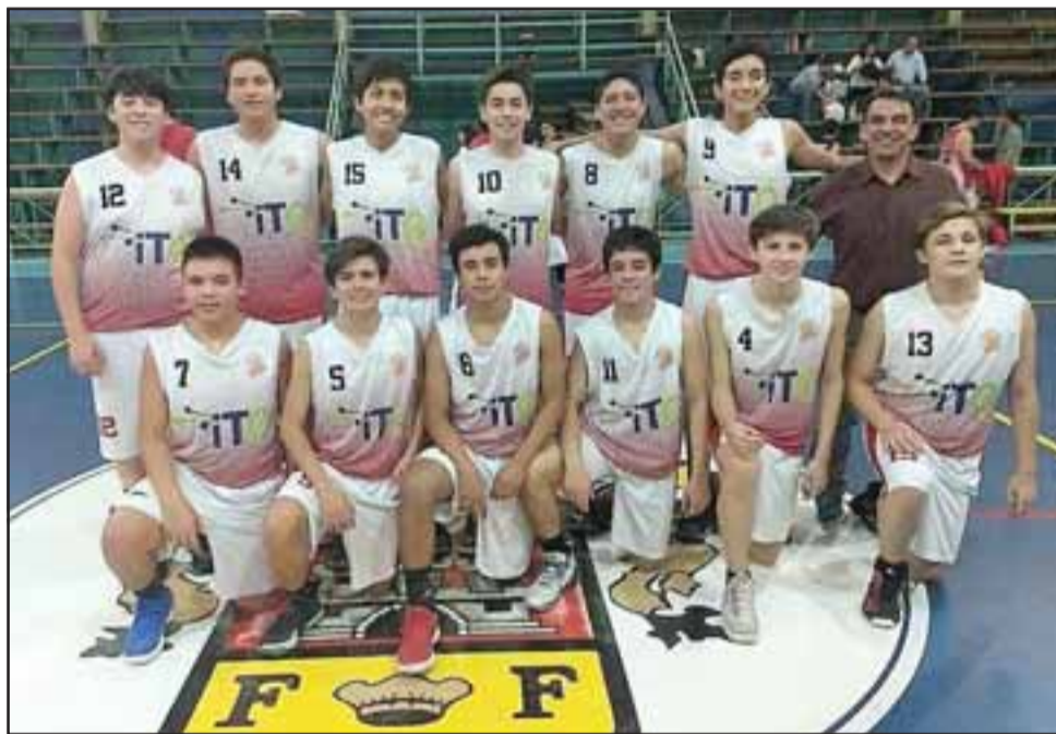
El cuadro U15 de San Felipe Basket tiene grandes opciones de avanzar al cuadrangular final de la Libcentro menores.