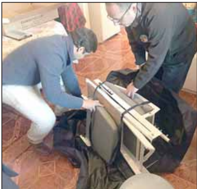
El equipo es armado y desarmado en cuestión de minutos para convertir el dormitorio de los paciente en una clínica dental.