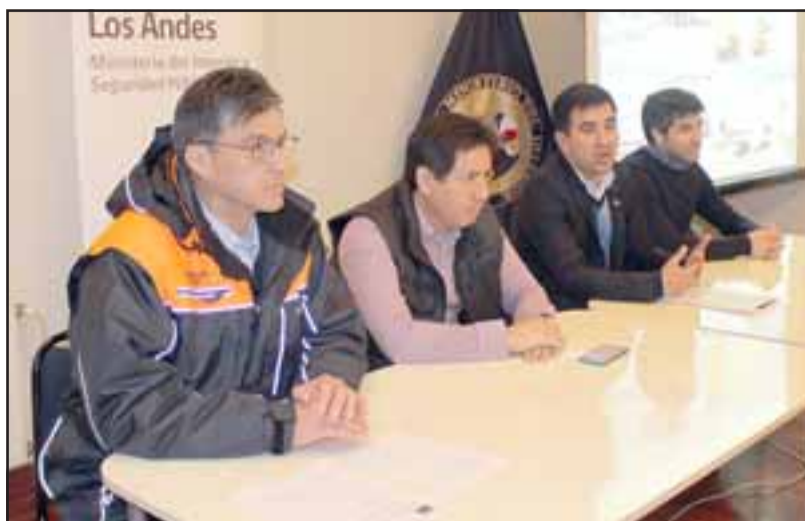
En la Gobernación de Los Andes fue presentado el estudio que busca mejorar las condiciones de seguridad y fluidez vial del Sistema Paso Cristo Redentor.

El gobernador destacó que "esto va a permitir mejorar la circulación, la seguridad vial en ese sector y va a permitir ser coherente con las inversiones que está haciendo el Estado chileno en el lado chileno con el nuevo Complejo Los Libertadores y la inversión argentina en el lado de Horcones. Con estas tres grandes inversiones y con toda certeza mejoraremos el paso más importante que existe entre Argentina y Chile en cuanto a transporte de carga", destacó el gobernador.