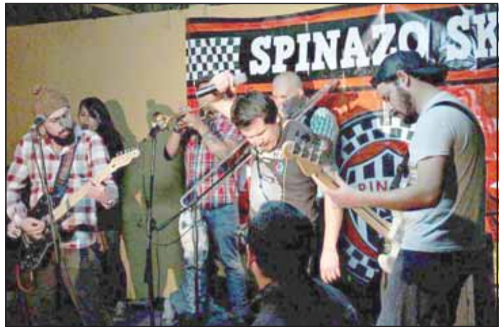
GRANDES SPINAZO.- Con un gran concierto en Artesanos Bar de Los Andes, la banda de rock sanfelipeña Spinazo Ska, celebró sus 16 años de trayectoria musical.

- Actualmente estamos invitados a participar de un evento con diversas bandas de la Quinta Re-