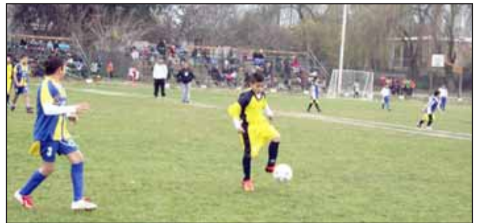
El campeonato contará con la participación de niños nacidos en los años 2007-2008 y 2009-2010, siendo la inscripción gratuita.