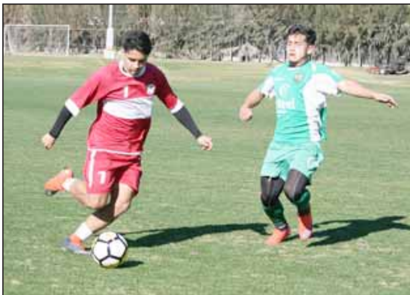
Unión San Felipe sostendrá hoy en la mañana un nuevo ensayo de cara a la segunda rueda del torneo de la B.

Con esto la escuadra albirroja no jugará el duelo amistoso que estaba programado para este sábado frente al cuadro de Melipilla.