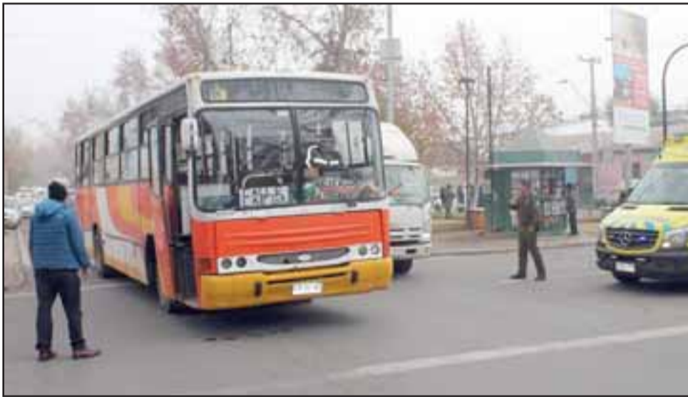
Esta es la Micro que atropelló a la abuelita cuando ella intentaba cruzar Avenida Argentina, en Los Andes.

Precisó que el chofer de la micro estaba en normal estado de temperancia, con toda la documentación del vehículo al día y también el certificado de recorrido en regla.