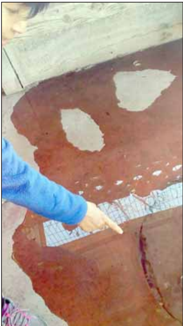
La afectada muestra la cámara reventada.