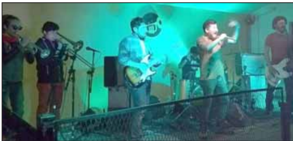
Todas las semanas estos músicos locales ensayan sus temas, pues en materia Ska ellos la llevan en Aconcagua.