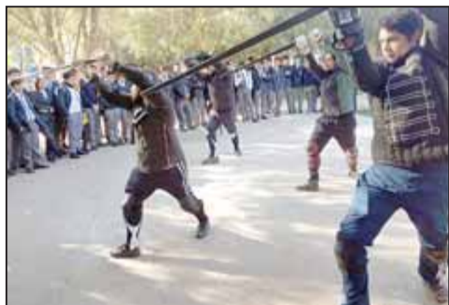
ACERO ACONCAGUA.- En varios eventos públicos de nuestra provincia cada vez a los jóvenes les atrae más esta disciplina de las Artes Marciales.

participarán instructores y practicantes con años de experiencia. En Europa esta disciplina se practica mucho y casi todos sus torneos son con espadas de acero. Acá en Chile, por el poco tiempo que lleva la práctica de Hema (Historical European Martial Arts / Artes Marciales Históricas Europeas) y por el elevado costo del equipo, es primera vez que podemos hacer un torneo con acero.