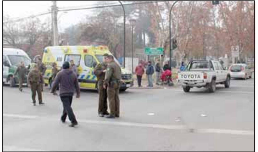
Carabineros y el Samu atendieron rápidamente a la víctima, quien sigue con riesgo vital en el hospital andino.