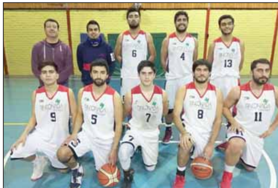
Desde Rinconada de Los Andes, Sonic llegó a competir al Apertura de Abar.