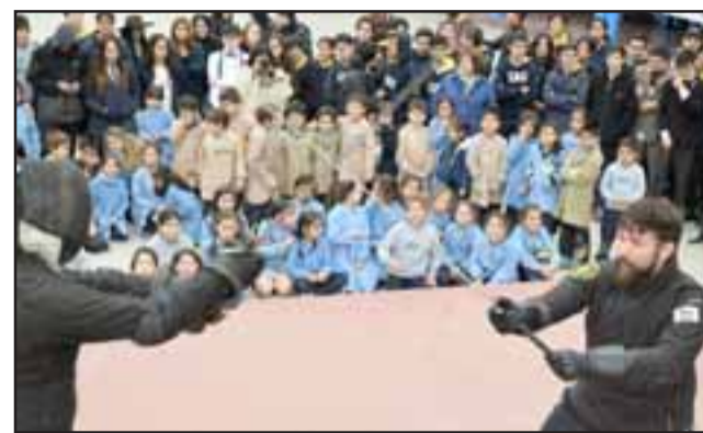
SESIONES DEMOSTRATIVAS.- A nivel estudiantil la Seha ha desarrollado varias presentaciones en colegios de San Felipe, para ilustrar el trabajo que viene haciendo en el valle.

- En realidad serán cuatro torneos en uno: Sable militar chileno; Espada Larga Damas; Espada Larga Varones y un invitational de Espada Larga de Acero , en el cual sólo