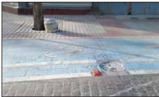
El bolardo sacado de cuajo de su posición original en Calle Salinas frente a Helados Olguín.

Es por eso que se llama a las autoridades pertinente a preocuparse del mal estado de la calle, para de esta manera prevenir accidentes. Reiteramos, el hoyo se