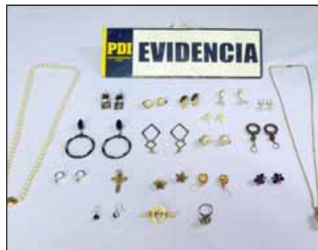
La Brigada Criminalística de la PDI de San Felipe recuperó las joyas valuadas en más de $15 millones sustraídas desde un departamento del Edificio Las Nieves de Calle Toro Mazote, en San Felipe.

Caen 'Zapato Feo' robando y 'El 12 pollos' reduciendo mercancía: