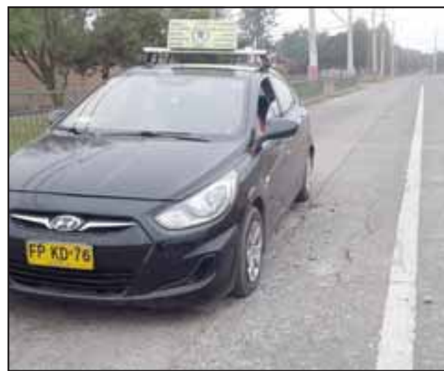
Acá vemos a un conductor de colectivo pasando por el hoyo en su vehículo de alquiler.