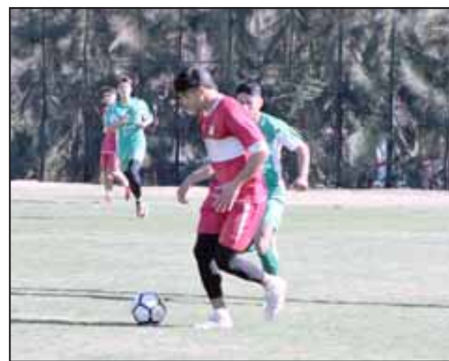
El próximo sábado el Uní Uní se reestrenará en el torneo de la Primera B.