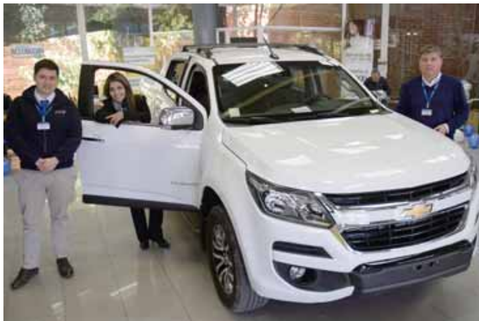
LA COLORADO.- Personal de la gerencia Kovacs muestra a Diario El Trabajo la lujosa Colorado, petrolera de alta gama y potentes cualidades.