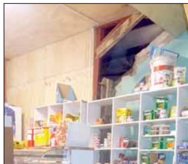
Los delincuentes habrían efectuado este forado para escapar hacia las techumbres para no ser descubiertos.