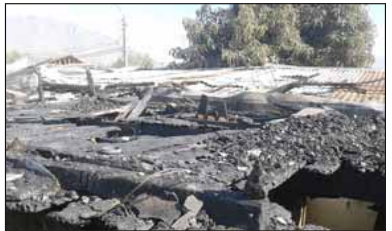
Totalmente destruido por el fuego resultó una habitación ubicada en el segundo piso de un inmueble situado en Pasaje Cuatro N° 4336 de Población Luis Gajardo Guerrero II Etapa de San Felipe.

Comenta que ella estaba en Los Andes, donde una hermana, “no había nadie acá, porque mi marido había llegado hace poco y se produce el incendio, algo