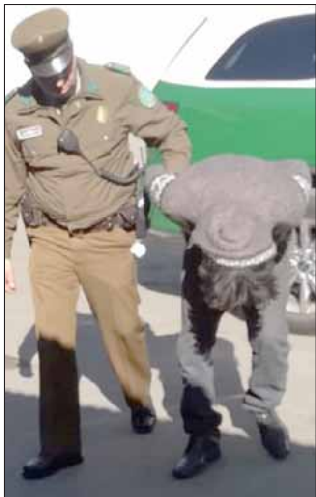
Este sábado Carabineros de la Tenencia de Santa María capturaron a delincuente habitual apodado 'El Doce Pollos' por su presunta participación en el robo.