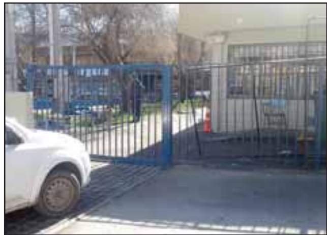
El frontis de la Upla Campus San Felipe.