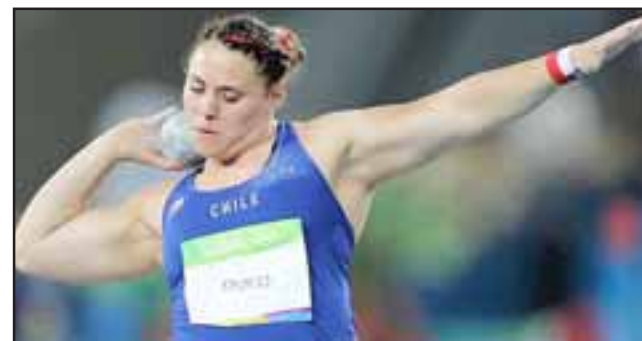
La atleta sanfelipeña es acusada de haber utilizado una potente sustancia con el fin de mejorar su rendimiento deportivo.

La suministración de este componente se debe hacer de manera diaria y se debe hacer en ayunas, para recién dos horas después de inyectado consumir alimentos.