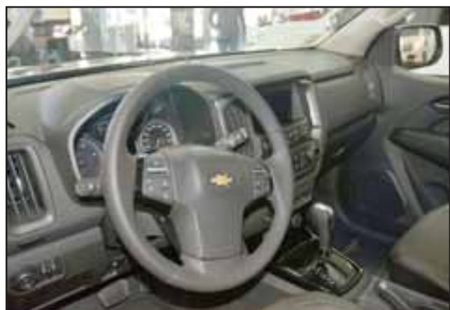
DE LUJO.- La versión Colorado High Country AT 4WD trae seis airbags, barras de techo transversales, defensa delantera, pisaderas laterales, barra trasera deportiva, lona marítima con cubre-pickup, cuero interior Browstone, entre otras cosas.

puedo decir que esta petrolera nos llegó con siete asientos, kit cromado, sensor de punto ciego, alerta de colisión frontal, seis airbags, motor 2.8 Turbo Diesel Duramax y 4x4, llantas de aceleración 18' bitono, pisaderas