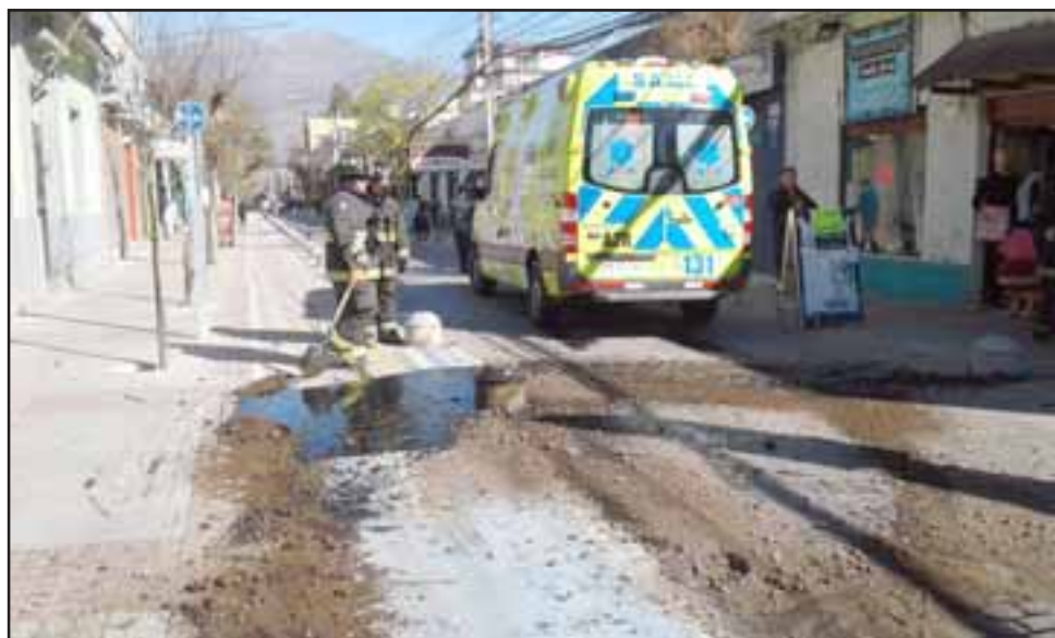
Después del choque, vemos al personal de Bomberos desparramando arena en la calzada.