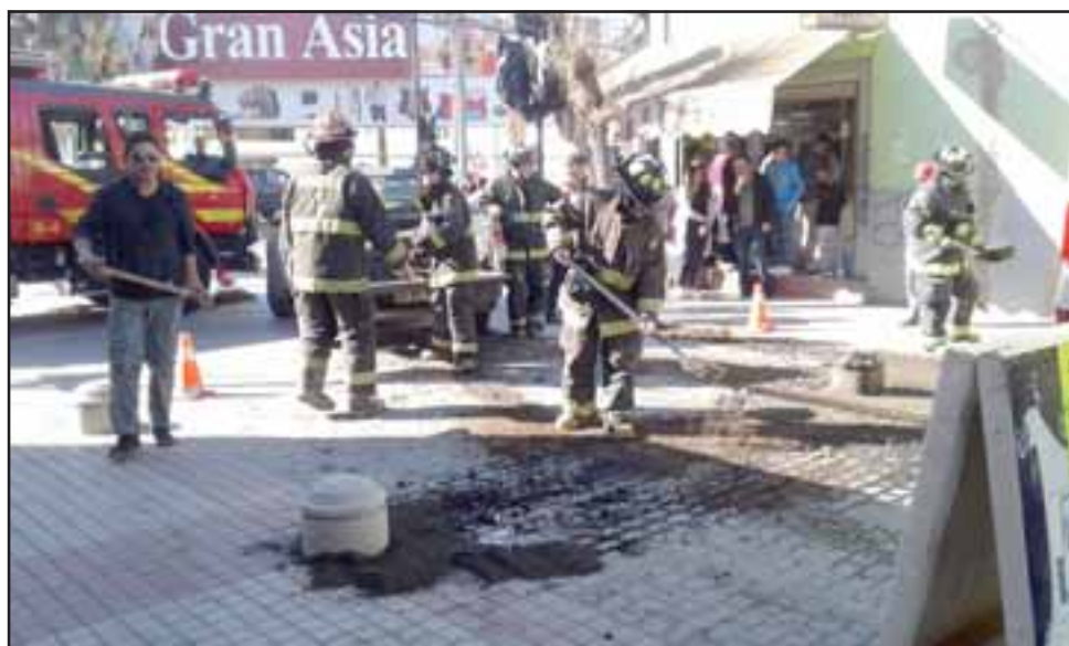
Personal municipal junto a Bomberos debieron echar bastante arena sobre la calzada con aceite.