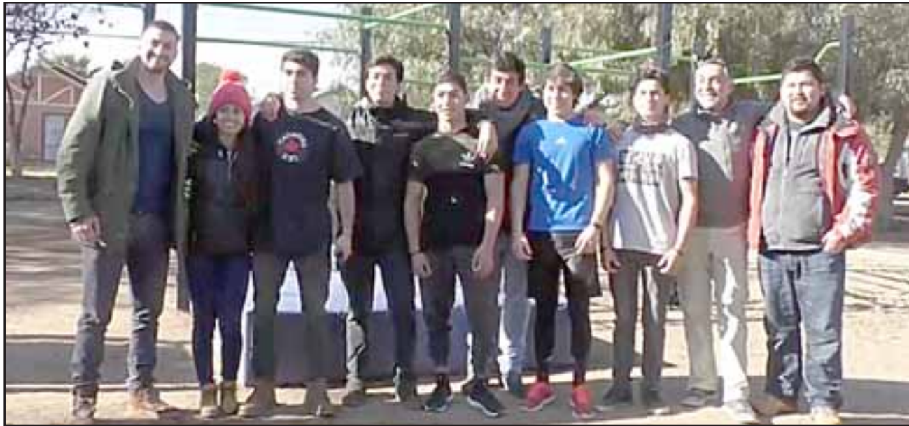
La Oficina de la Juventud junto con el Departamento de Deportes y la agrupación Ambition Team, prepararon el primer campeonato de esta disciplina titulada 'Batalla de Los Valles'.

El evento, que se desarrollará este próximo sábado 21 de julio, tendrá como sede el Parque de Barras, gestionado por la Municipalidad y contará con la participación de más de 20 exponentes de diversos lugares del país.