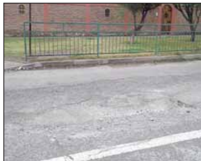
Acá, el hoyo que se ha vuelto peligroso para los conductores que por esa arteria transitan a diario.