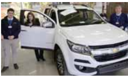
Por fin llegaron a Kovacs San Felipe las potentes petroleras 'Colorado' y 'Trailblazer'.

Acusan persecución a funcionario Asemuch dio respaldo al administrador municipal