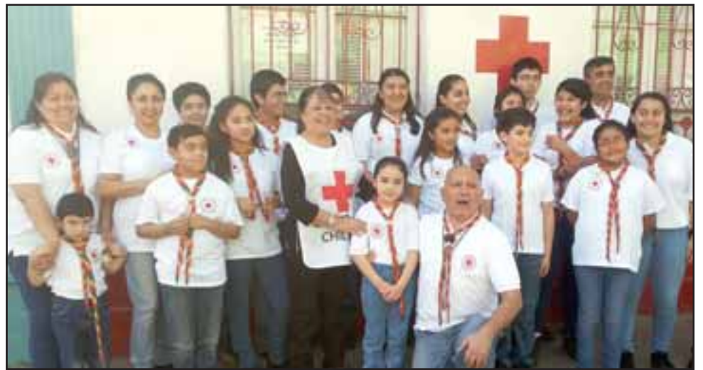
VIDA EJEMPLAR.- Durante más de 30 años este guía Scout ha desarrollado cientos de actividades para el beneficio y formación de los niños.