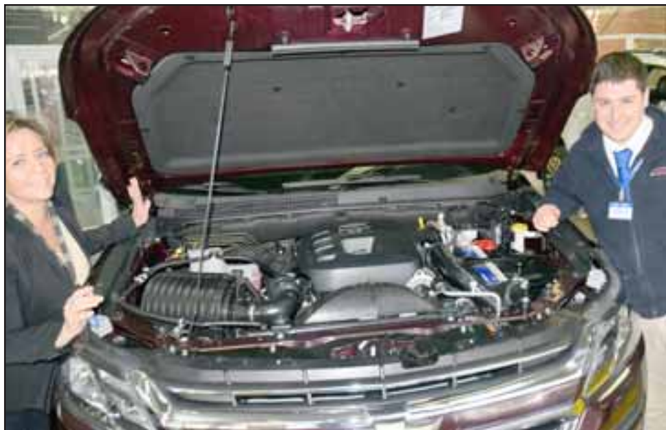
MOTOR COLORADO.- Aquí tenemos la versión mecánica de motor 2.8 Turbo Diesel Duramax y 4x4, esta versión mecánica (LTZ4WD) con 200 CB, 500 nm, caja mecánica de seis velocidades, encendido remoto de motor y activación de climatización interior.