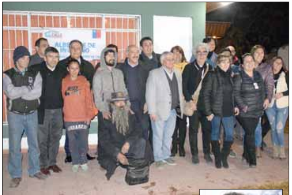
A raíz de las lluvias y el frío, propios del invierno, idearon esta iniciativa que durará todo el invierno.

Hasta el momento son bastante las personas que reciben atención en el albergue municipal, muchos de ellos también se favorecen con las donaciones de los vecinos.