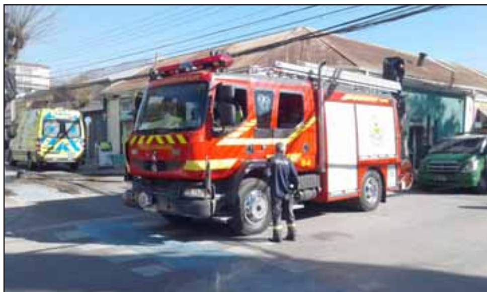
El ABC en el lugar Ambulancia, Bomberos y Carabineros durante la emergencia en que chocó la ambulancia con una bolardo.

El tránsito se mantuvo cortado por Calle Salinas hacia el sur debiendo los vehículos seguir por Calle Santo Domingo hacia el oriente.