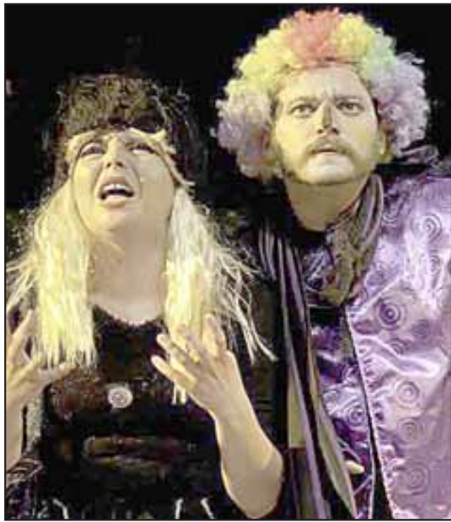
LA GRAN INCÓGNITA. - Hoy los niños podrán descubrir si Tremebunda, la araña, logra apoderarse de nuestra mágica Flor del bosque.