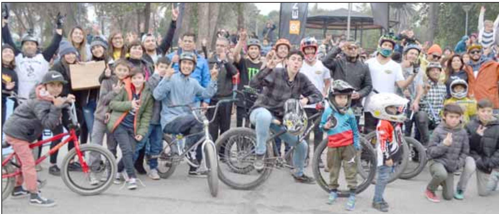
JUVENTUD EXTREMA.- Aquí tenemos a decenas de jóvenes amantes del MTX, hay varios campeones nacionales que son también de la comuna de Santa María.

«La verdad es que este lunes tuvimos una fiesta deportiva distinta a otras que hemos desarrollado anteriormente, una fiesta del Deporte Extremo, y la organizamos para que los niños disfrutaran más de sus vacaciones de invierno, en la misma hubo una gran participación de jóvenes tanto en moto como en bicicleta. Yo quiero agradecer a tantas personas que vinieron con sus hijos al evento, fue un espectáculo muy especial con grandes cam-