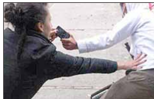
El hecho fue denunciado pasadas las 18:00 horas de este miércoles en calle Santo Domingo de San Felipe. (Foto Referencial).

En horas de la mañana de ayer jueves la imputada, identificada con las iniciales F.F.O.O. de 19 años de edad, sin antecedentes delictuales, fue derivada hasta el Juzgado de Garantía de San Felipe para ser forma-