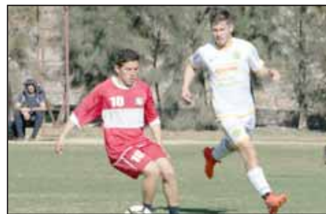
Frente a Puerto Montt, los de Lovrinkevich buscarán iniciar con el pie derecho su incursión en la decisiva segunda rueda del torneo.