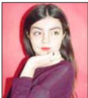
La joven adolescente sanfelipeña, de 16 años de edad, cursa actualmente el tercero medio.

Este concurso se hizo en el marco del encuentro en la Academia de Líderes Católicos: “He participado en la Academia de Líderes Católicos, donde uno de estos sábados me gradué y antes de la graduación tuvimos un concurso de oratoria a nivel nacional, donde