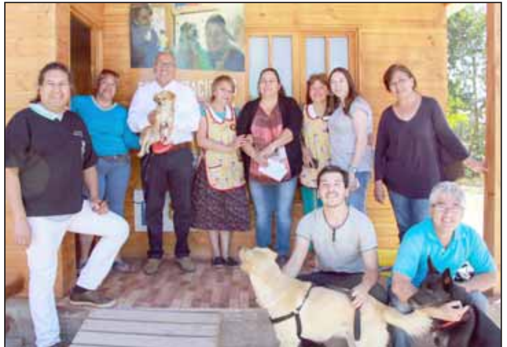
El operativo de 'microchipeo' es bastante demandado por la ciudadanía y se enmarca en el programa de Tenencia Responsable de Mascotas y Animales de Compañía de la Subdere.

Los dueños de mascotas interesados en realizar esta inscripción deben acudir con su carné de identidad para completar la documentación que les permita