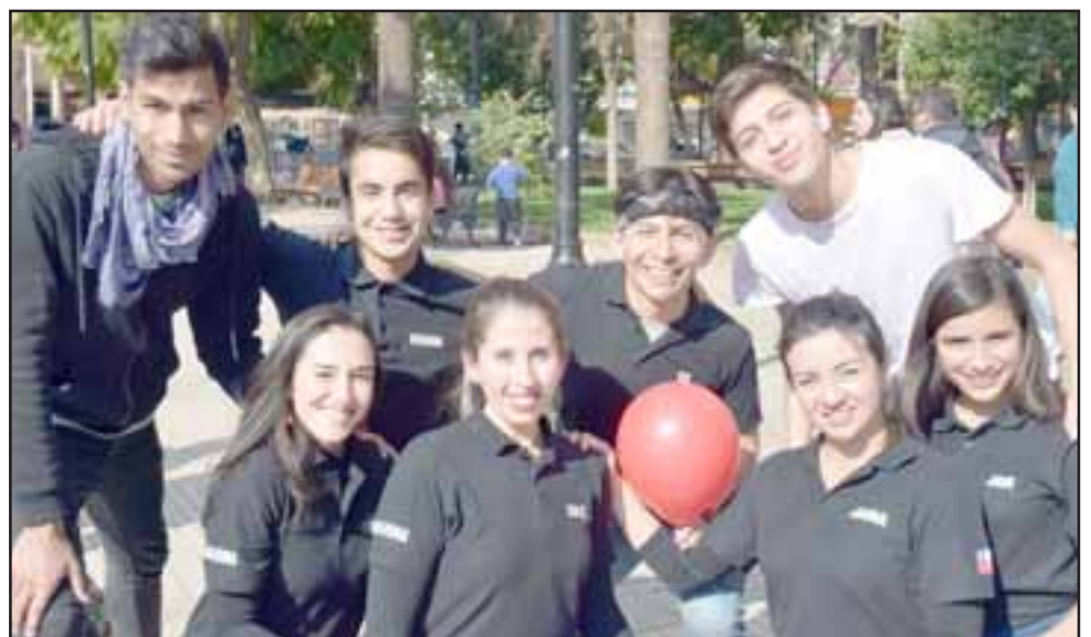
VAMOS CHIQUILLOS.- Ellos son parte de los jóvenes bailarines que están desarrollando esta Rifa, así que apoyemos su sana iniciativa.