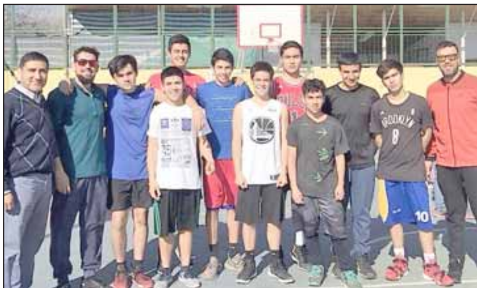
La naciente y prometedora rama cestera de Trasandino quiere formar parte de Abar.

sandino y clubes de otras comunas del valle de Aconcagua que quieren formar parte de la asociación cestera de San Felipe: "Veremos si hay la posibilidad de modificar los estatutos y con ello facilitar el ingreso de otros clubes, que dicho sea de paso ya compiten acá, pero que ahora quieren ser socios y con ello asumir responsabilidades; debo dejar claro que a nosotros nos gustaría contar con ellos porque se fortalecería la actividad cestera de todo el valle", explicó Acuña.