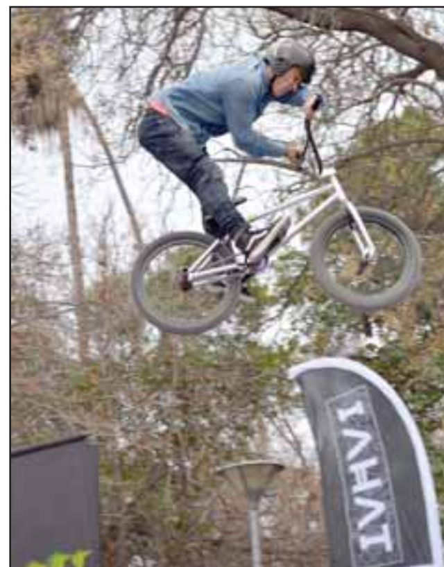
IMPRESIONANTE.- Así volaron estos intrépidos jóvenes en sus bicicletas, ante un público asombrado con sus acrobacias.

Roberto González Short