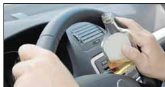
El conductor fue fiscalizado por Carabineros siendo detenido por manejo en estado de ebriedad. (Foto Referencial).

Según los antecedentes del caso, el informe de alcoholemia arrojó finalmente que el acusado conducía con 2.39 gramos de alcohol en su sangre, con su licencia para conducir suspendida tras haber sido condenado por el Juzgado de Garantía