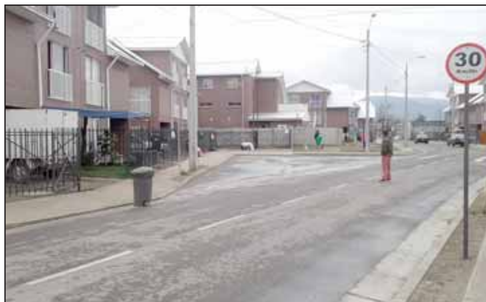
Entrada del Condominio Peumayén de San Felipe donde están los problemas denunciados ayer en Diario El Trabajo.