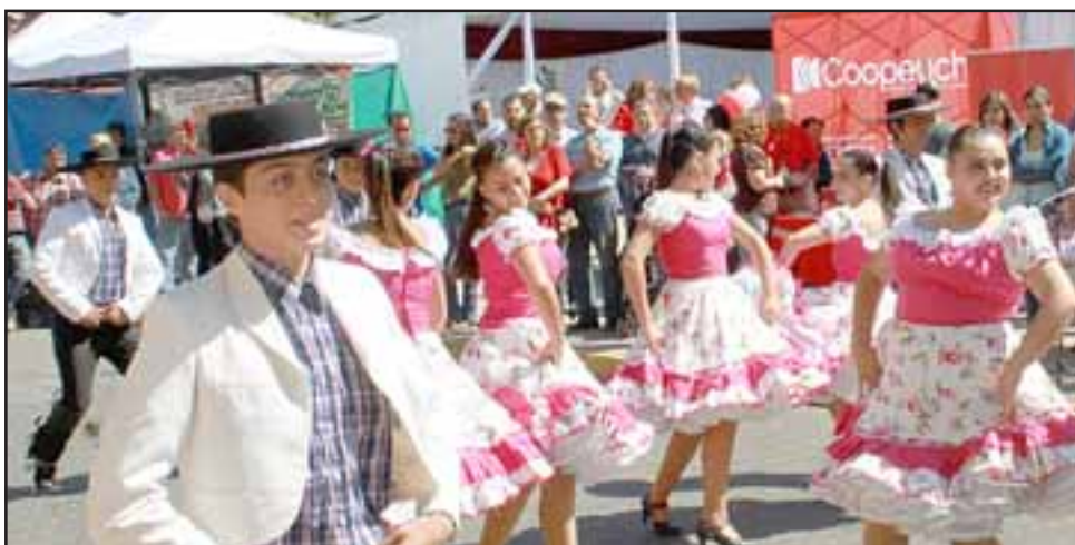
Estos artistas locales todos los años potencian el folklore de nuestra comuna en la Fiesta de la Vendimia, en El Almendral.

va ya 22 años de existencia; está conformado por 30 bailarines, y participan personas desde los 14 a los 35 años de edad.