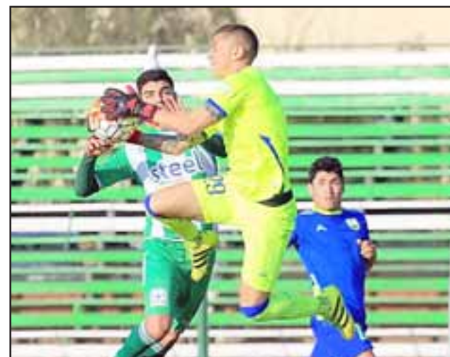
Frente a un rival venido desde el norte, Trasandino se jugará sus últimas cartas para asegurar su clasificación a la liguilla final del torneo de la Tercera A.

El pleito entre Trasandino y Mejillones fue programado para las tres y media de la tarde de mañana; la entrada seguirá costando $3.000 (tres mil pesos), pero los hinchas que la adquieran hoy viernes en la