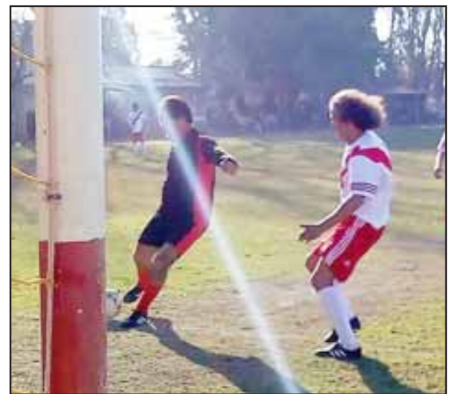
Este domingo podría haber campeón en la competencia de la Liga Vecinal.