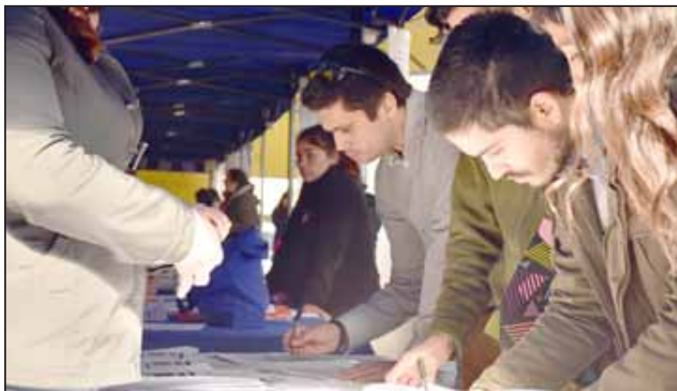
La actividad convocó a gran cantidad de personas que llegaron a requerir mayores antecedentes sobre alternativas para quienes buscan trabajo o desean mejorar sus expectativas laborales actuales.