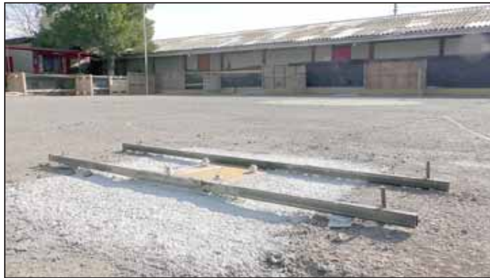
En el mes de septiembre deberían ser entregados los trabajos en la Escuela John Kennedy, donde con una inversión de 35 millones de pesos se pretende techar el patio del colegio.