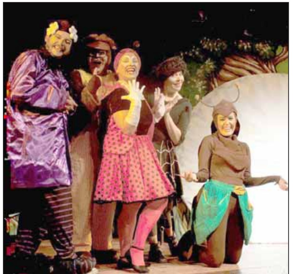
TEATRO FAMILIAR. - Ellos son parte de los personajes que darán vida al bosque en donde vive La Flor Encantada. Teatro infantil hoy viernes.