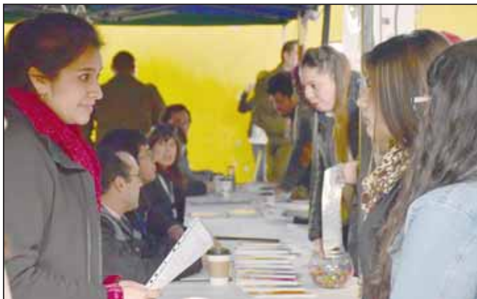
Más de 150 empleos fueron intermediados con la realización de la feria.

feria que dará resultados, ya que estamos intermediando de manera efectiva en esta feria más de 150 puestos de empleo en nuestra comuna", aseguró el edil.