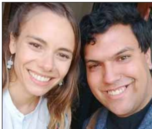
LA MÁS BELLA.- Aquí lo vemos en compañía de la actriz principal de la serie 'Si yo fuera rico', María Gracia Omegna.