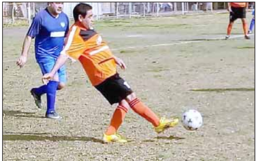
Con los resultados que dejó la fecha pasada, solo al final se sabrá cual será el campeón en la Liga Vecinal.

Barcelona 0 – Andacollo 0; Aconcagua 0 – Unión Esfuerzo 0; Santos 2 – Unión Esperanza 1; Pedro Aguirre Cerda 4 – Villa Argelia 0; Carlos Barrera 4 – Resto del Mundo 0; Tsunami 4 – Hernán Pérez Quijanes 1; Los Amigos 4 – Villa Los Álamos 2.