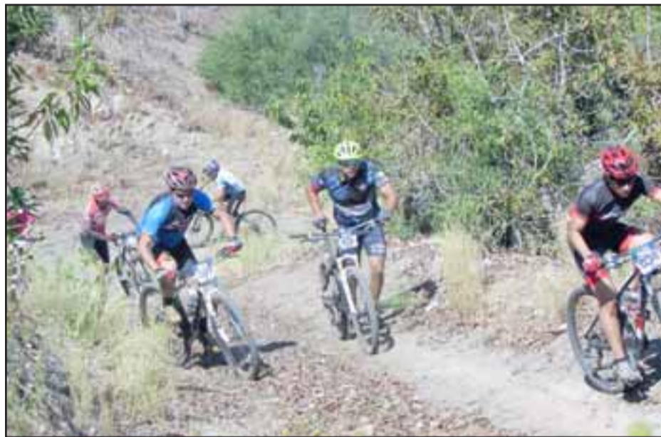
Hoy se abrieron las inscripciones para XCM Sendero de Chile que organizará el club Gárgolas SMA.