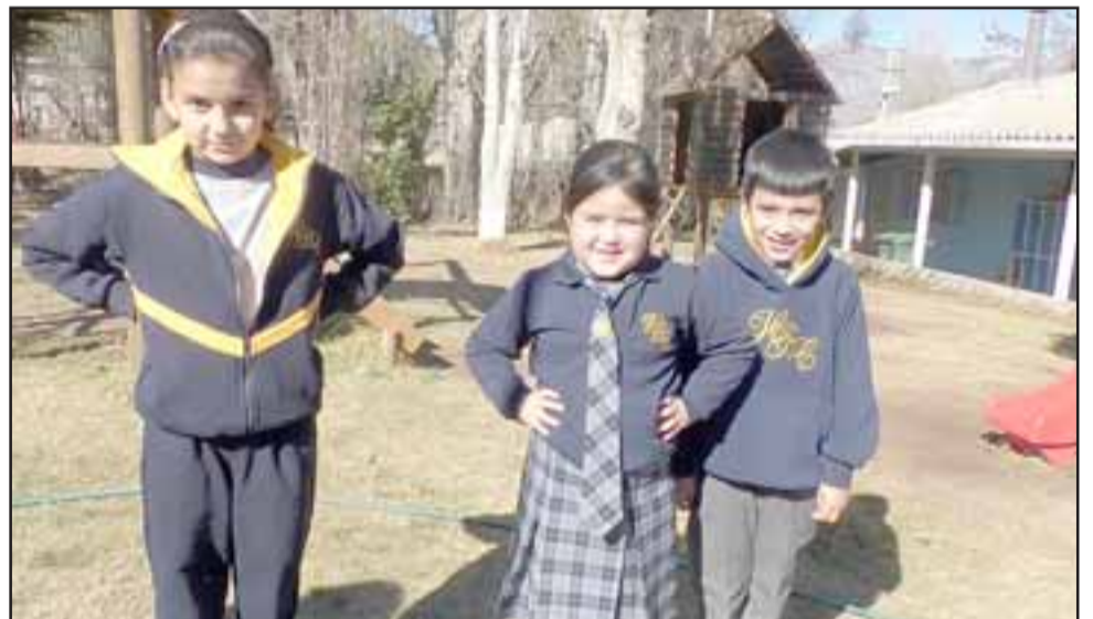
Estos pequeños alumnos lucen felices los nuevos uniformes, pelerones y buzos que se compraron para todo el alumnado del establecimiento.