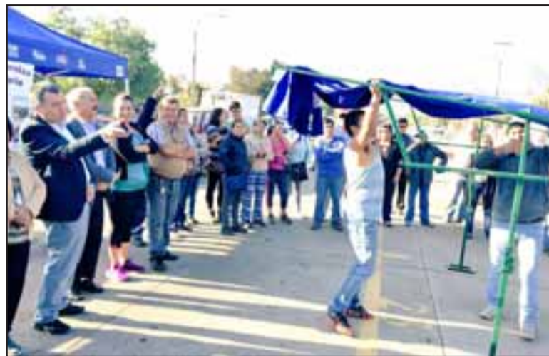
Autoridades en Afema, uno de los lugares donde podrían trasladarse los Chacareros de Diego de Almagro.

En la actualidad son 129 chacareros que trabajan todos los días domingo, más 330 bazares, varios de los cuales son de Santiago.