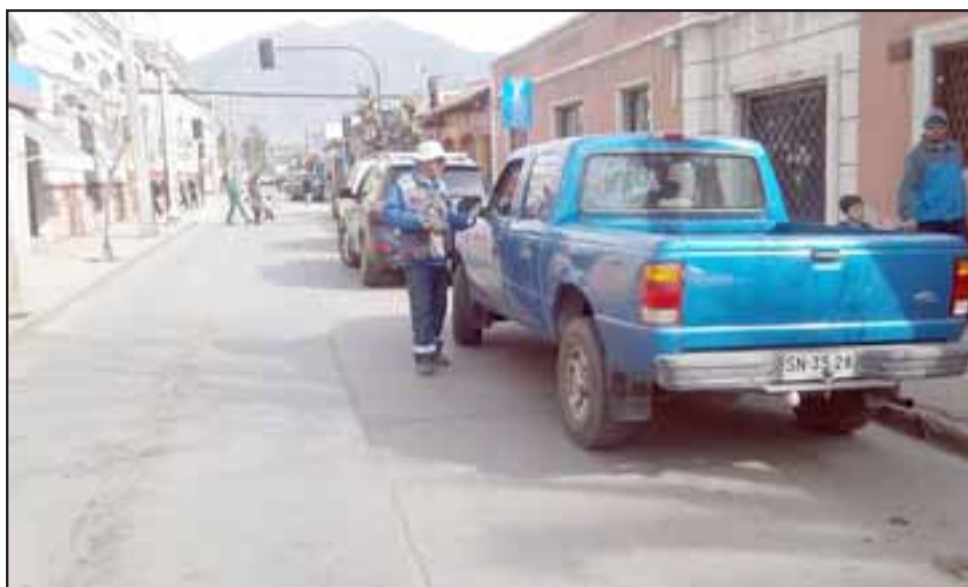
Un operario en plena faena de cobranza de parquímetro.

De todas maneras Jara dijo que las empresas, cuando postularon, sabían de todas estas intervenciones en el centro que iban a provocar un alto impacto, por lo que dentro de sus estudios de costos y beneficios, al momento de hacer la propuesta, debieran haber considerado este factor: “Digo esto porque no es menor, en las mismas bases el contra-