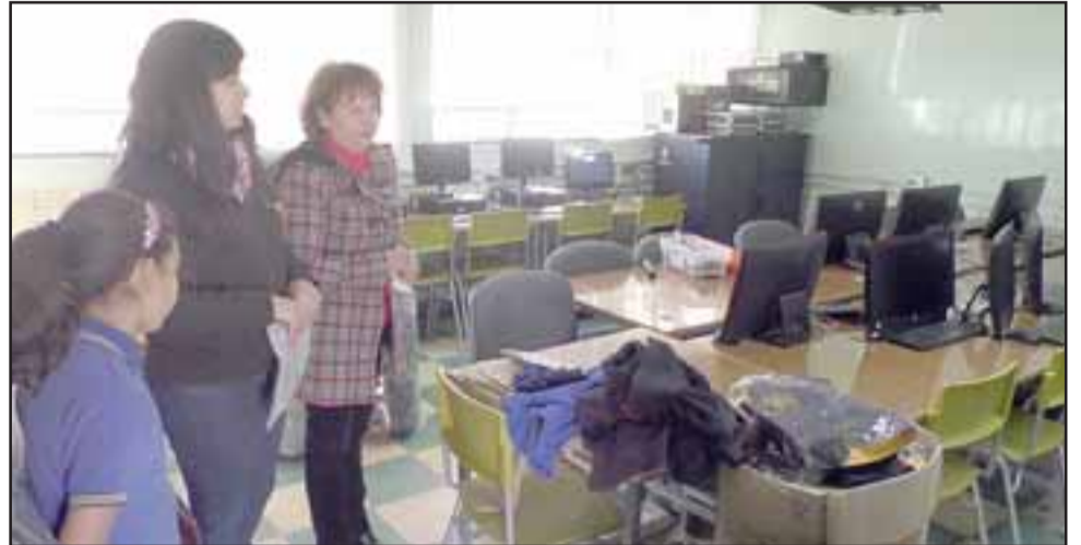
Ya comenzó a funcionar el laboratorio de Computación, el que cuenta con 15 computadores nuevos y que permite que los profesores, de cualquier asignatura, puedan utilizarlos.

Asimismo, en estos días se están cambiando los baños del nivel de pre básica, que se encontraban en malas condiciones. “Con dineros de mantenimiento y con maestros de la Daem que