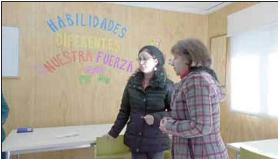
También se habilitó una sala para el trabajo del equipo del Programa de Integración Escolar.

to, que a la fecha suman 109 niños y niñas, lo que permite que los niños asistan abrigados y con toda la indumentaria día a día a clases.