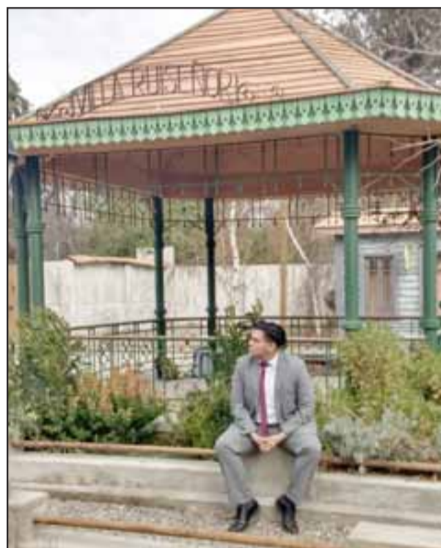
¿CONOCES EL LUGAR? - Esta es la placita de Villa Ruiseñor, pueblo ficticio de la serie 'Perdona nuestros pecados'.

«Considero que el talento individual de cada actor es lo que le puede llevar lejos, no necesariamente los títulos académicos, yo por