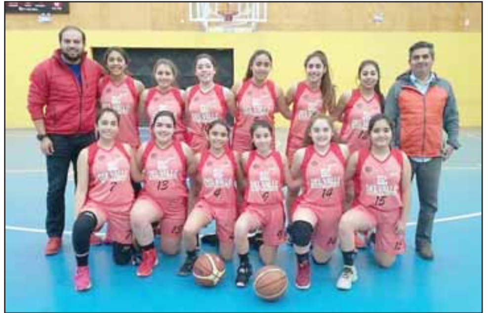
La selección de San Felipe no consiguió clasificar al campeonato nacional federado femenino U15.

El torneo Nacional femenino U15 se realizará próximamente en la ciudad de Punta Arenas en el extremo sur del país.