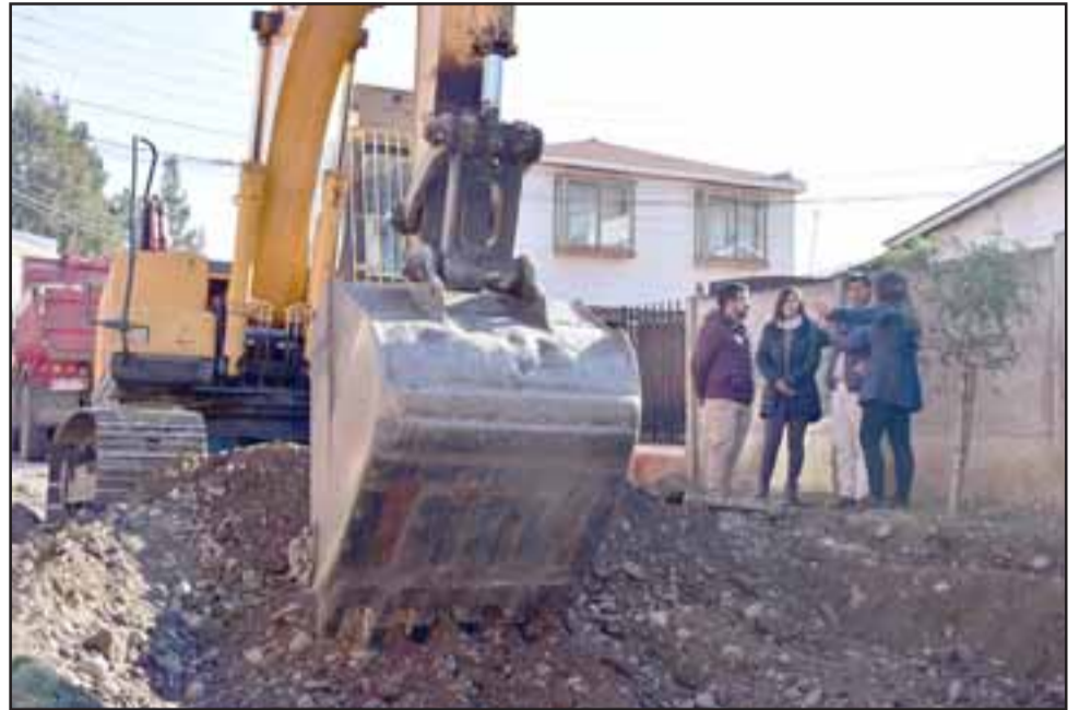
El proyecto de mejoramiento y repavimentación de Villa Padre Hurtado abarca los pasajes Manuel Larrían, Álvaro Lavín, José María Restrepo y Pedro Alvarado.

postularon al programa con la asesoría de la Dirección de Seclac del municipio, equipo que llevó a cabo la postulación y desarrolló un proyecto exclusivo de diseño de repavimentación para cuatro pasajes de la villa que presentaban un deterioro considerable en su pavimento, el que afectaba la vida de las familias del sector. Producto de esto la Municipalidad de Llay Llay de-