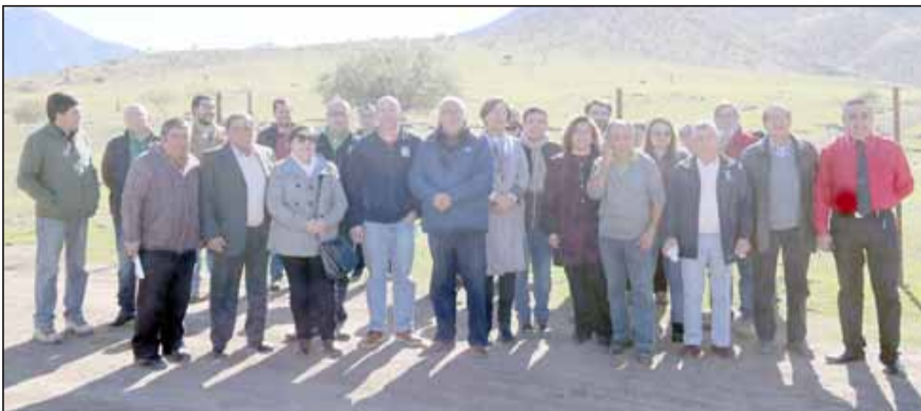
TODOS FELICES.- Alcalde, concejales, dirigentes de la 'Serranía Campo La Quebrada de San Antonio', vecinas y vecinos del cerro El Llano, lucen felices con este acuerdo.

«Estamos muy contentos de poder entregar el Parque Cementerio de Carretas al municipio. Esto va a permitir a este sector tener servicios a la altura de los visitantes. Hoy este sector no cuenta con ba-