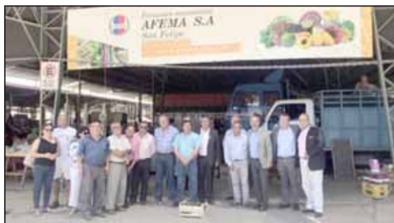
Autoridades entregando toldos a los feriantes.