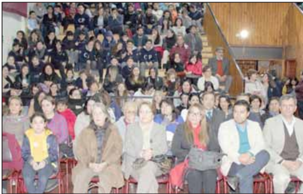
Esta muestra artística estuvo inserta en el marco de las actividades culturales, entre la Municipalidad de Panquehue y el Consejo de la Cultura y las Artes, a través del Área de Cultura y Turismo.

torio que incluye compositores de la música universal desde el siglo XVII en adelante, con énfasis en los finales del siglo XIX y XX, pero da prioridad a la difusión de la música chilena de compositores emergentes y consolidados del ámbito nacional.