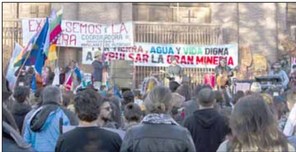
Marcha por la vida de Putaendo que concluyó con acto artístico cultural, donde agrupaciones locales y el músico nacional Joe Vasconcellos entregaron todo su apoyo.

tante que exista una unidad de acción entre los alcaldes para traer mayor cantidad de beneficios para la zona. A partir de esta unidad hoy pudimos conversar con el intendente, manifestarle nuestras preocupaciones y desazón por cómo hemos ido quedando aletargados respecto de lo que se desarrolla en Viña y en Valparaíso, por eso es sumamente importante este diálogo con las autoridades regionales para traer mayores beneficios a la gente que un día con su voto, confío en nosotros», agregó Nelson Venegas, quien además es presidente de la Asociación de Municipalidades Región de Aconcagua.