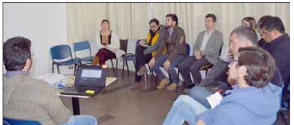
Profesionales de Servicio País presentan estudios para mejorar gestión ambiente en la comuna de Santa María.