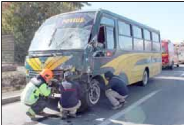
La emergencia se produjo aproximadamente a las 11:40 horas en cruce Los Villares con Callejón Los Placeres.