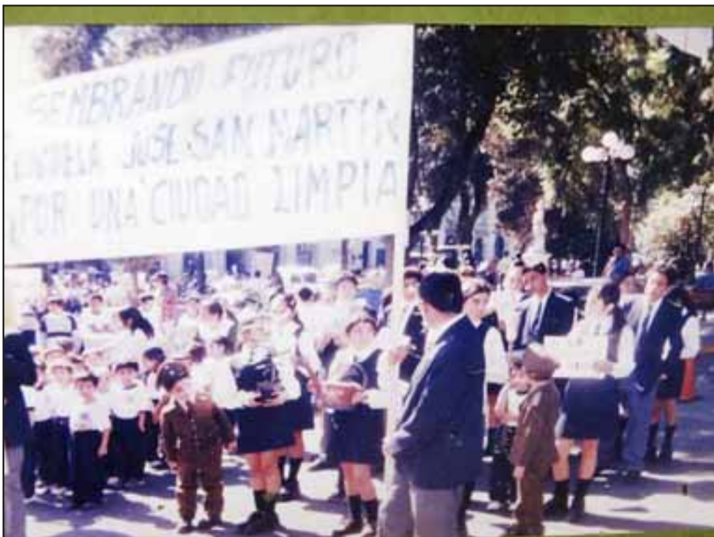
ESCOLARES AL FRENTE.- Aquí vemos una de sus más importantes iniciativas llevadas a la acción, la campaña Sembremos Futuro , en 2002.