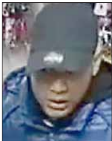
Esta es uno de los hampones, si nuestros lectores lo identifican, no duden en llamar a la Policía.

La afectada indicó que su hermano le indicó que no se trata de delincuentes chilenos, "pueda ser que por su acento sean ecuatorianos o colombianos, no hablaron ningún tipo de grosería, solamen-