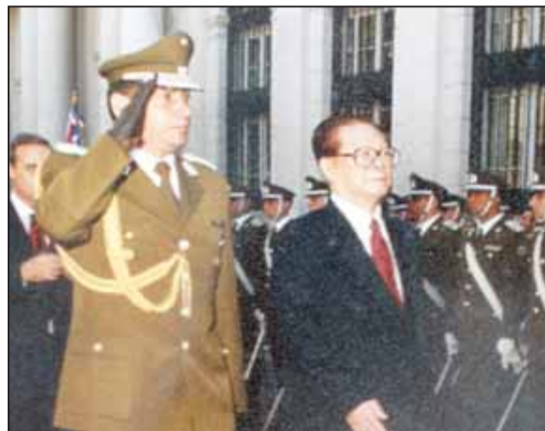
MOMENTO HISTÓRICO.- Aquí lo vemos al lado del presidente de China, Jiang Zeming, cuando éste visitó nuestro país en 2001.