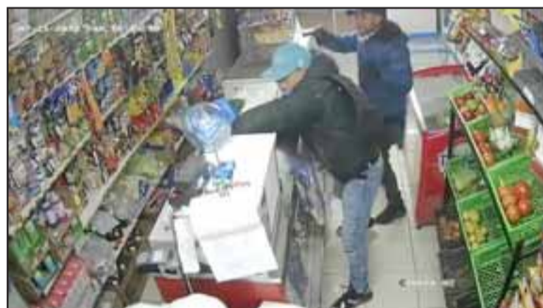
MUY VIOLENTOS.- Encañonando a sus víctimas y con gran violencia actúan estos delincuentes en los locales donde asaltan.

tenemos tres cámaras al interior del local que grabaron los hechos, pero no les importó nada de eso, no se intimidaron para nada.