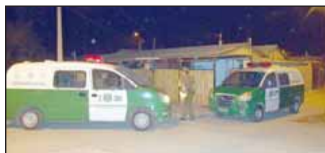
Carabineros adoptó la denuncia de la vecina afectada por delincuentes que invadieron su propiedad mientras ella dormía.

Carabineros no ha logrado establecer la identidad del o los sujetos que habrían cometido este delito, remitiendo los antecedentes del caso a la Fiscalía de San Felipe.