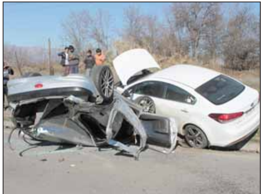
Tras el impacto, el Peugeot colisionó con un automóvil Kia modelo Cerato, patente KR WX 72, que iba en el mismo sentido, volcando el primero y quedando sobre un montículo el segundo.

Asimismo, el jefe bomberil de Rinconada informó que el conductor y dos pasajeros que viajaban en el microbús salvaron ilesos. A raíz de esta emergencia el tránsito se mantuvo suspendido por cerca de media hora. En tanto, Carabineros de Los Andes y Calle Larga quedaron a cargo del procedimiento para establecer las causas de este accidente.