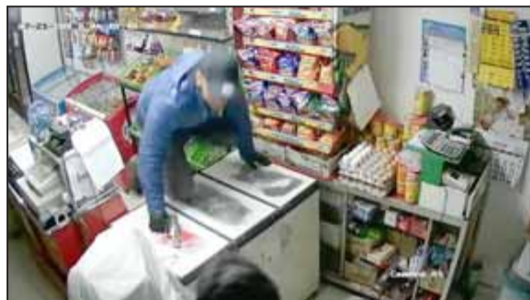
Las cámaras en estos locales registraron cada movimiento de estos sujetos hampones extranjeros.