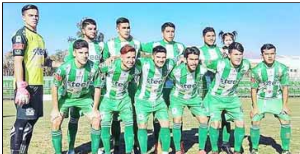
La escuadra andina venció por 2 a 0 a Municipal Santiago en el cotejo del sábado pasado en el Regional de Los Andes.

Con este triunfo Trasandino llegó a los 26 puntos, con lo que seguirá dentro de los cinco primeros lugares en la tabla de colocaciones, aunque el verdadero objetivo para los dirigidos de Ricardo 'Manteca' González es ser uno de los dos mejores en la segunda rueda para poder acceder a la postemporada.