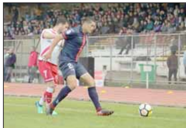
Un triunfo que ilusiona con el retorno a Primera A es el que ayer consiguió el Uní Uní ante Deportes Valdivia.

En el segundo lapso a los aconagüinos no se les hizo muy complicado resistir los embates de un cuadro anfitrión, que conforme avanzaba el tiempo iba otorgando espacios; así cuando llegó la media hora del complemen-