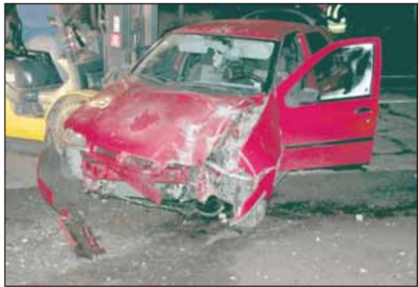
FULMINANTE. - Así quedó el vehículo, el tablero marcador del automóvil quedó marcado 160 kilómetros por hora.

Una vez rescatado el chofer fue entregado a Samu, siendo llevado hasta el Servicio de Urgencia del Hospital San Juan de Dios para su evaluación. Carabineros del Cuadrante 2 quedó a cargo del procedimiento a fin de determinar las causas de este accidente que pudo haber tenido consecuencias más graves.