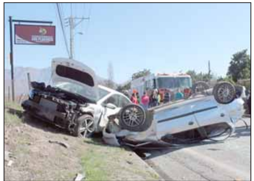
El automóvil Peugeot matrícula XD 21-64, con dos ocupantes en su interior, se desplazaba hacia el oriente, y habría efectuando una maniobra de adelantamiento colisionando al Microbus.