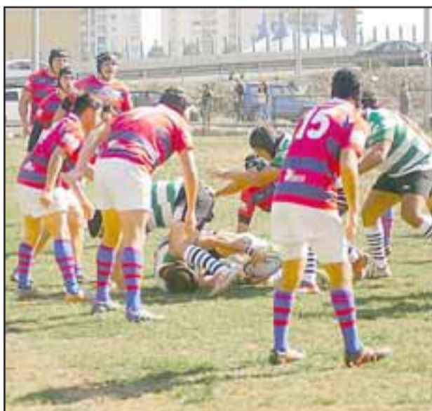
Los Halcones perdieron de forma muy holgada ante Carneros en la ciudad de La Serena.

Con esto los aconagüinos ya no dependen de sí mismos para llegar a la Copa de Oro, ya que deben ganar su próximo juego y esperar que se den algunas combinaciones para poder clasificar.