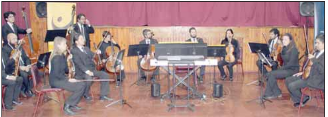
La Orquesta Marga Marga interpretó un repertorio que incluye compositores de la música universal desde el siglo XVII en adelante.

prioriza los conciertos en la región, sus presentaciones incluyen giras y conciertos en el norte y sur de Chile y también el extranjero, participando además en cuen-