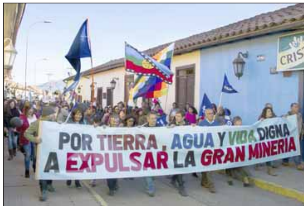
UN CLARITO NO.- Miles de putaendinos salieron a las calles de su comuna para expresar su claro repudio por la Gran Minería en esta región de Aconcagua.

«Hoy estamos aquí unidos para defender la Vida de Putaendo. Hace algunos años defendimos nuestra