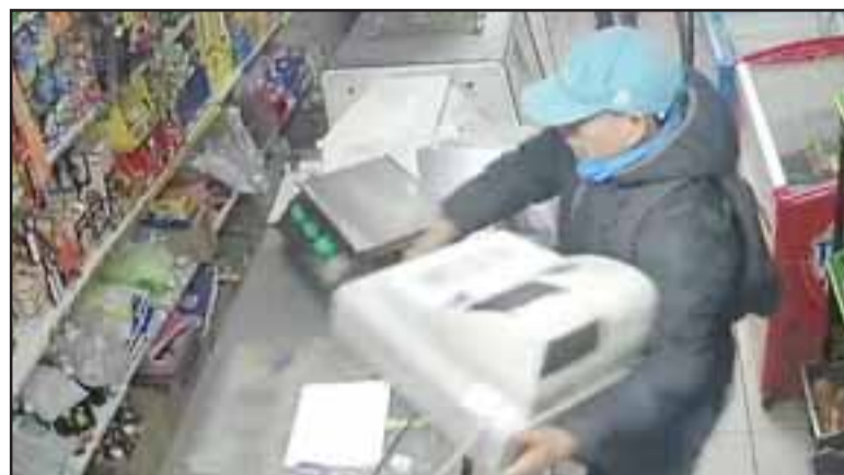
DESCARADOS.- Aquí vemos a estos malvivientes despojando de sus pertenencias a honestos sanfelipeños.