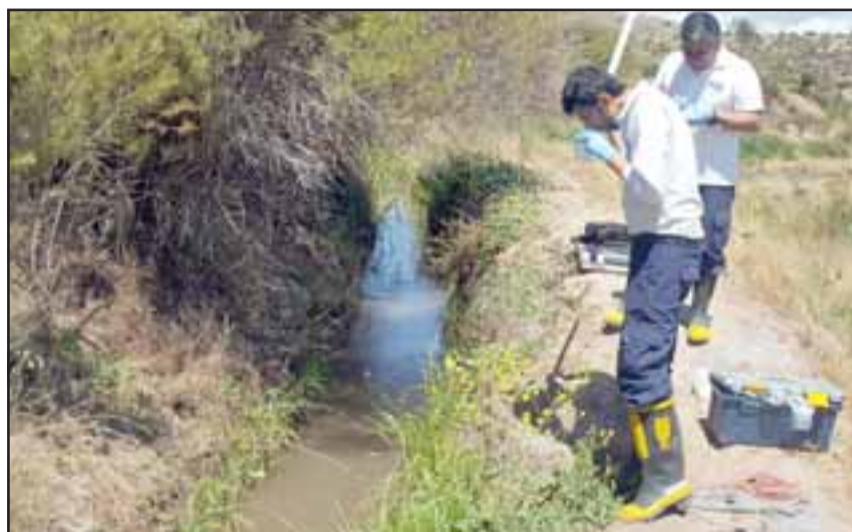
Agentes de la PDI tomaron muestras en su momento del agua, estas están contaminadas.

Después de una disputa judicial y administrativa, Fundación Mi Patrimonio logra tener en sus manos los resultados de este estudio, y con ese antecedente en su poder colocó una querrela