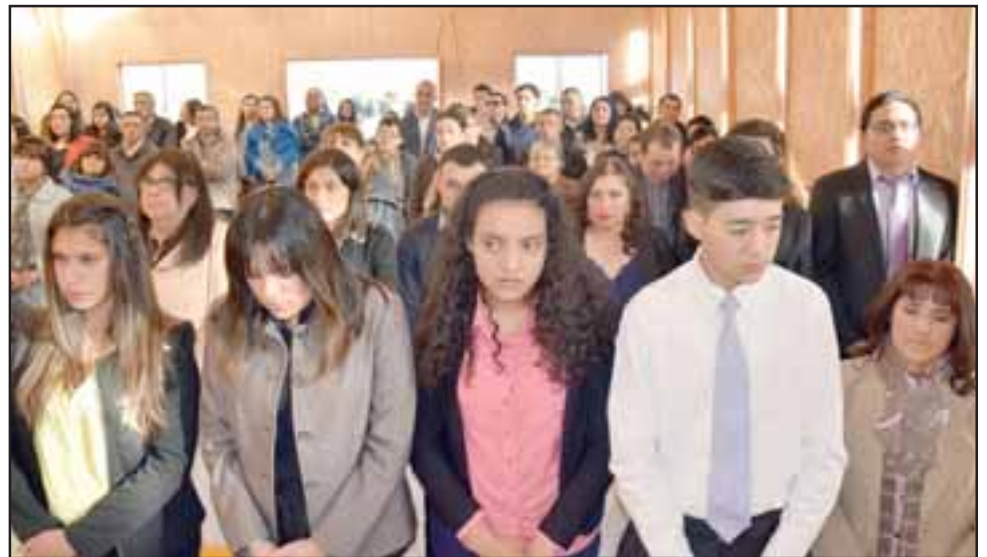
FE Y JUVENTUD. - En total fueron once los jóvenes los que recibieron el importante sacramento por parte de la imposición de manos y ungimiento con aceite por parte del Obispo.