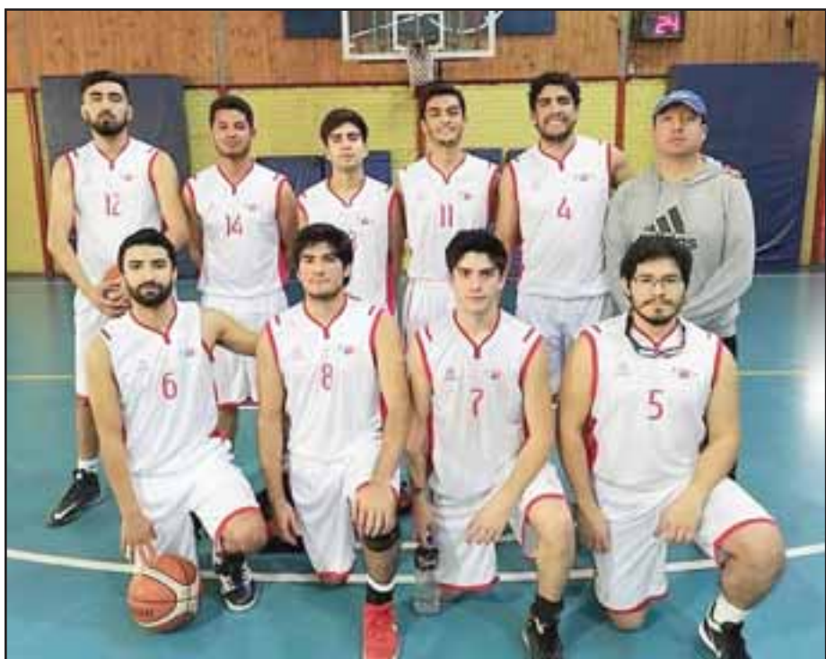
Sonic dio un golpe de calidad al superar a San Felipe Basket.

go. Habrá momentos en que estaremos más cerca o más lejos del objetivo; iremos despacito y en silencio por nuestra meta y desde lugar ilusionarnos. Tengo mucha confianza en la entrega de cada uno de los integrantes de este plantel", afirmó el estratega albirrojo.