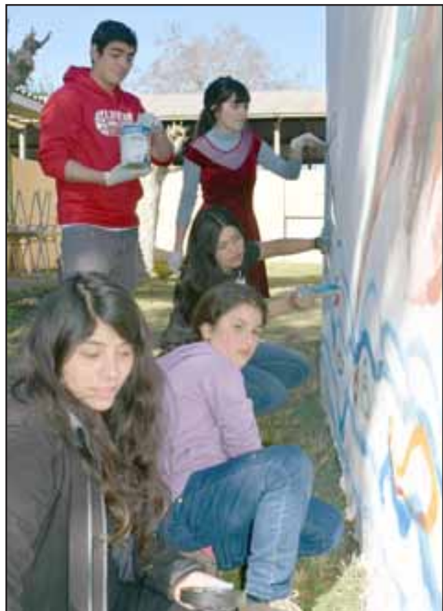
PECESITOS PINTORES.- Ellos son jóvenes de La Casa de los peces, de Valparaíso, embelleciendo las panderetas de la escuela.

nes artísticas de Banda Ficks, el Coro de profesores de San Felipe, hip hop, soul, show de títeres, cuenta cuentos, cueca chora y folklore».