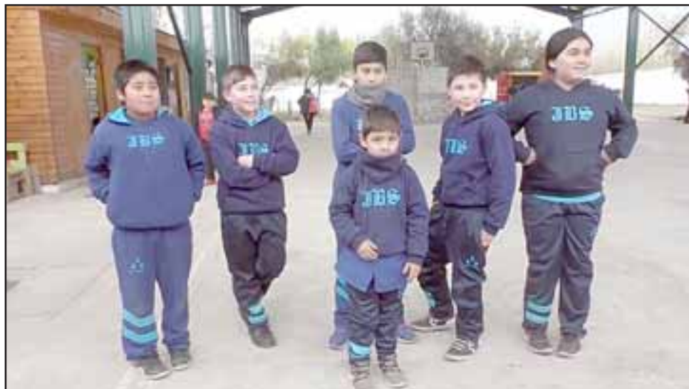
Los alumnos de la Escuela José Bernardo Suárez del sector El Asiento tienen una atractiva y variada oferta de actividades extra programáticas para este segundo semestre.

Asimismo, la oferta programática para este segundo semestre, en el área de Arte y Patrimonio, contempla la realización de un taller de arte y creatividad para adultos y estudiantes.