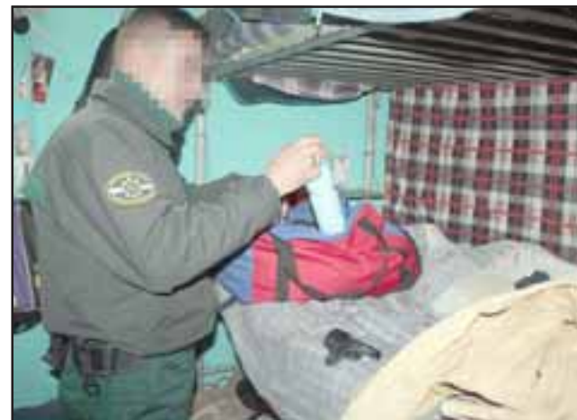
Las cámaras de vigilancia personal de Gendarmería del Centro de Cumplimiento Penitenciario de Los Andes, permitieron identificar a una mujer que ingresó droga al penal, entregándosela a un interno condenado.