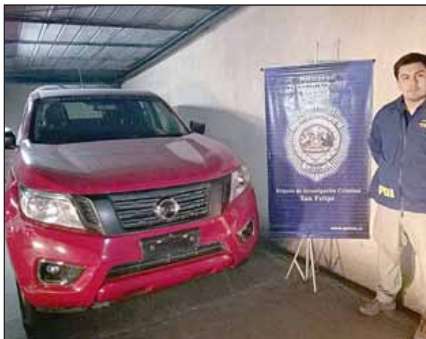
Detectives de la Brigada del Crimen de la Policía de Investigaciones de San Felipe, lograron recuperar esta camioneta marca Nissan, año 2016, que