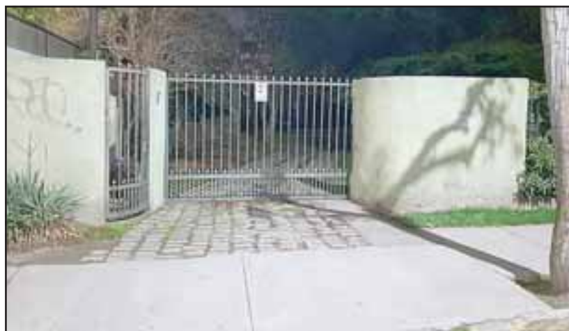
El delito se originó en esta vivienda ubicada en calle Carlos Condell N° 35 de la ciudad de San Felipe, cerca de la medianoche de este domingo.