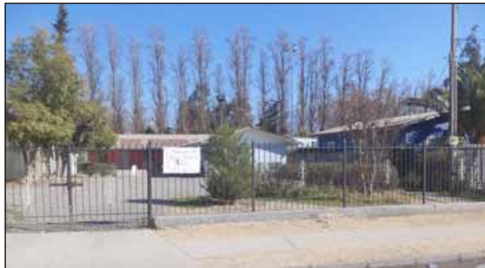
Frontis del centro comunitario ubicado en la calle Justo Estay.