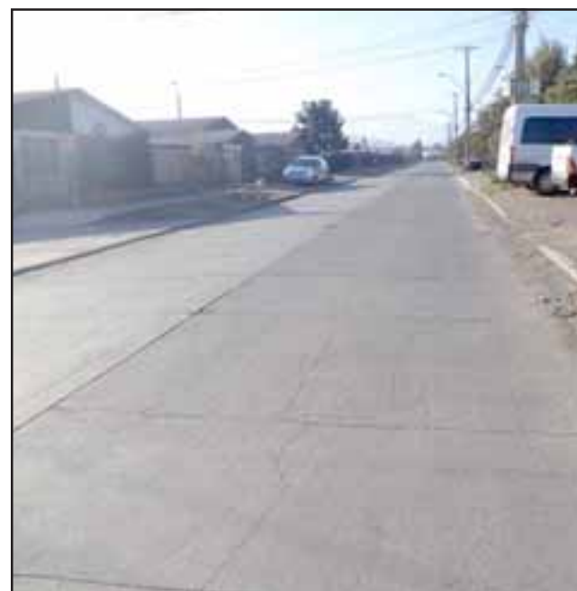
Esta es la avenida Santa Teresa, donde los vecinos piden lomo de toro o mayor fiscalización.

lomos de toro, debiera haber mayor fiscalización: "Yo he llamado varias veces a Carabineros y nunca han llegado en las noches que están corriendo, hace como dos o tres semanas eran como las doce veinte de la noche, llamé a las doce con veinte y tres minutos y nunca llegaron, aquí los buses, los camiones corren nomás, practican el cuarto de milla desde la rotonda frente a una botillería hasta el lomo de toro que hay más abajo".