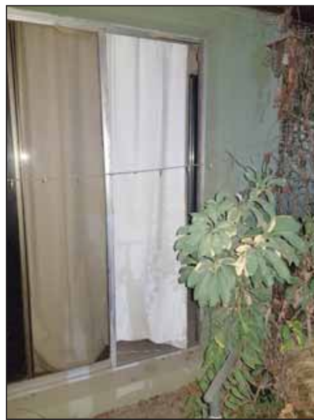
Los imputados habrían ingresado a través de este ventanal del inmueble.