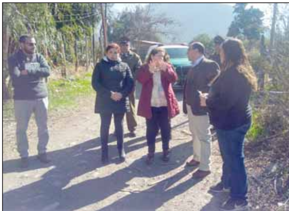
Junto a Carabineros, el jefe provincial dialogó con dirigentes vecinales para ver las soluciones a implementar en el corto y largo plazo.

episodios desagradables de lo que es la delincuencia. Agradecida de la visita del gobernador, porque ade-