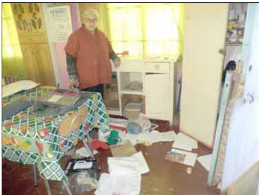
Una integrante del taller femenino nos muestra el desorden al interior de la sede.