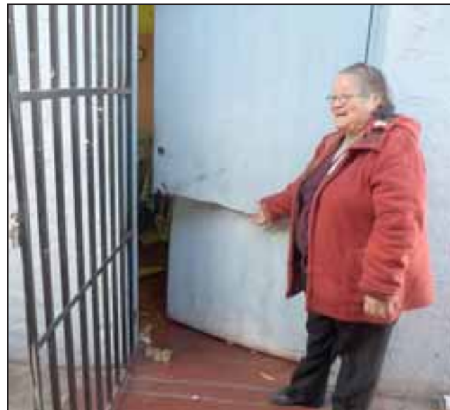
Una integrante del Taller Femenino muestra los daños en la puerta de entrada al taller.