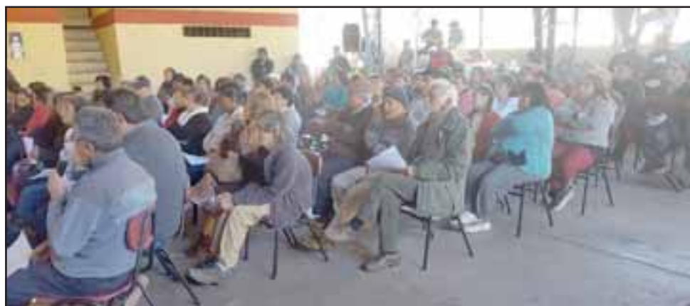
Los vecinos durante asamblea realizada en el sector.