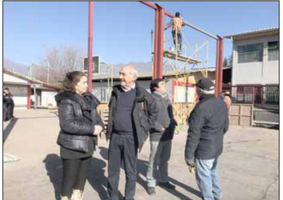
El techo se está construyendo en una estructura metálica que tiene una cubierta de 446 metros cuadrados aproximadamente, que protegerá del sol y la lluvia a los alumnos.

El techo se está construyendo en una estructura metálica, que tiene una cubierta de planta y evacuación de aguas lluvias. “Es una cubierta de 446 metros cuadrados aproximadamente, lo que va a permitir