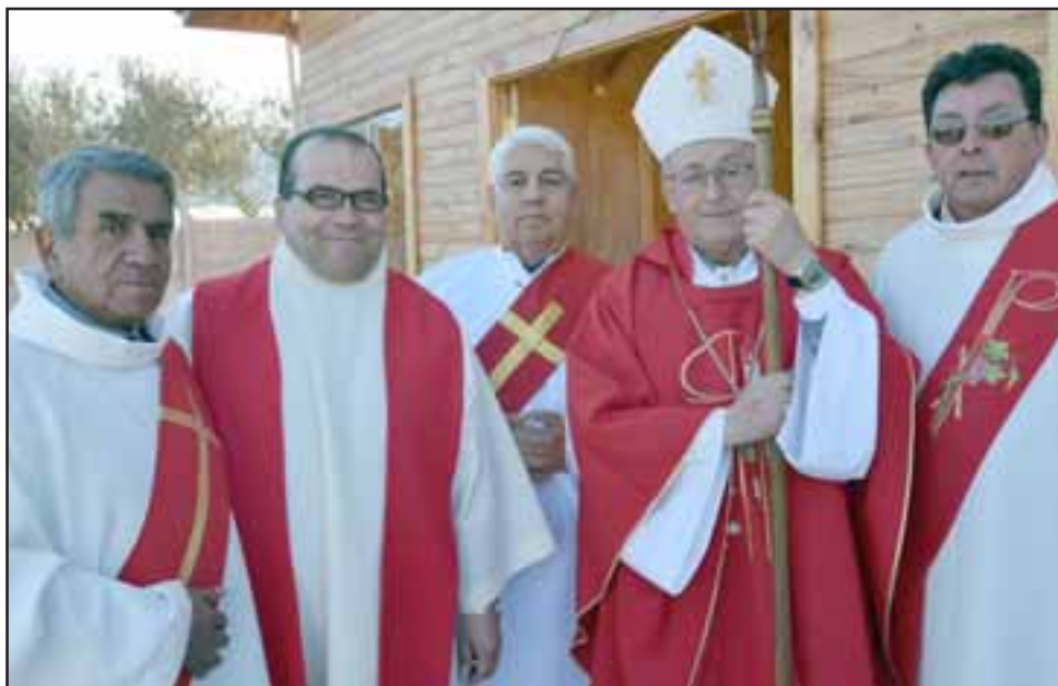
IGLESIA EN TERRENO. - Ellos son parte del equipo humano con el que se desarrollan estas ceremonias, las que usualmente se deberían hacer en la sede parroquial.