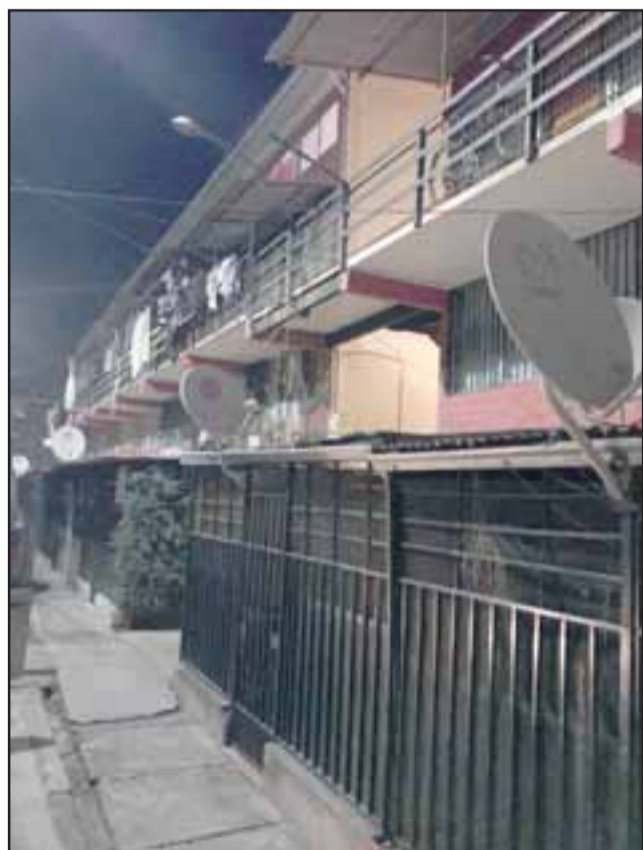
El hecho ocurrió en el Block C de los Departamentos Encón de San Felipe la tarde noche de este martes.