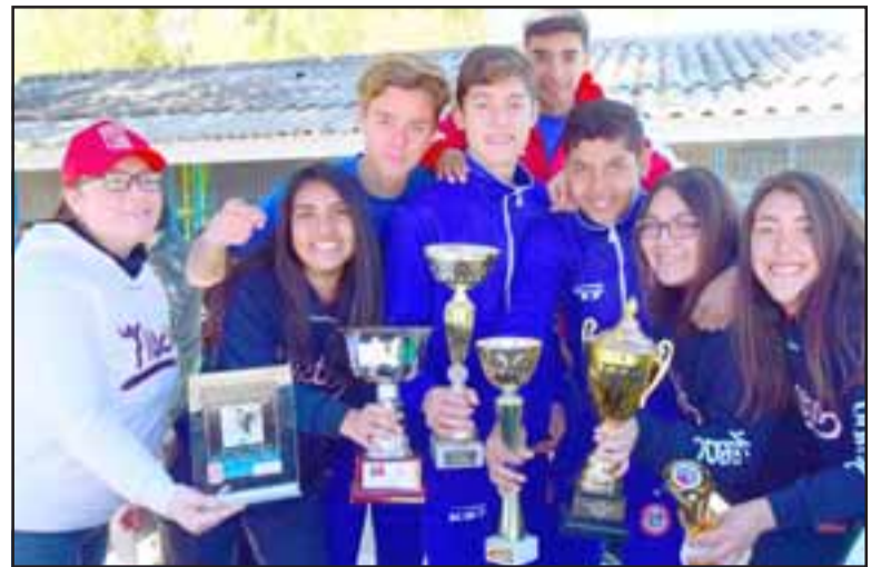
LIGAS MENORES DEL UNÍ. - Ellos son alumnos del Mixto que militan para el Unión San Felipe, y cuentan con un permiso especial para hacer sus entrenamientos.