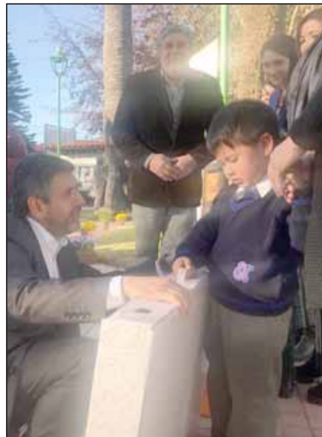
La tarde de ayer miércoles se realizó en el frontis de la Municipalidad de Catemu, la entrega oficial del Rincón del Juego para 65 niños que cursan el prekínder en establecimientos educacionales municipalizados.

El costo de cada Rincón del Juego del año 2017 fue de 14.030 y el 2018 es de 23.022, lo que se traduce en un incremento del 61% de su costo, a objeto de contribuir en el mejoramiento de las condiciones de aprendizaje. Este Rinju se compone de una estructura blanca de cartón per-