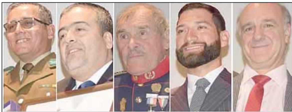
TESOROS VIVIENTES. - Ejemplares mujeres, comerciantes, autoridades y empresarios de nuestra comuna fueron honrados por sus aportes a nuestra comunidad.