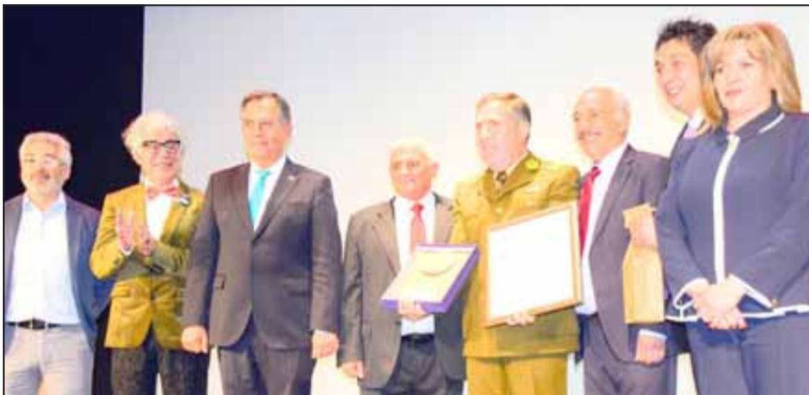
HIJO ILUSTRE. - Las cámaras de Diario El Trabajo tomaron registro del momento en que recibió la distinción Hijo Ilustre de San Felipe, el Director General de Carabineros, Héctor Soto Isla.

Cuando correspondió a la máxima autoridad del organismo policial recibir su distinción, cumplió con tomarse las fotos de rigor, abrazos y besos y una gran sonrisa.