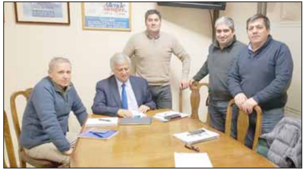
Dirigentes del Sindicato Unión Plantas adelantaron que este viernes podría hacerse efectiva la huelga, a partir de las cero horas, si no se alcanza un acuerdo con la División Andina.

encuentra en mesa de negociaciones, donde se han despejado algunos temas importantes para los trabaja-