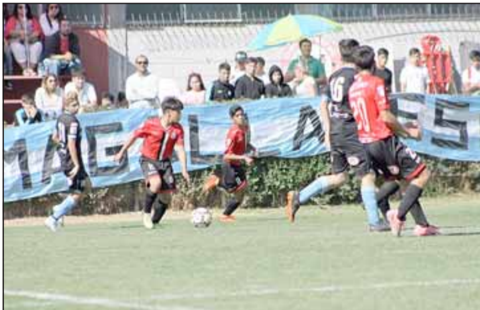
Este sábado las series cadetes del Uní Uní iniciarán su participación en el torneo de Clausura del Fútbol Joven.

NR: La calidad de local variará de acuerdo a las series.