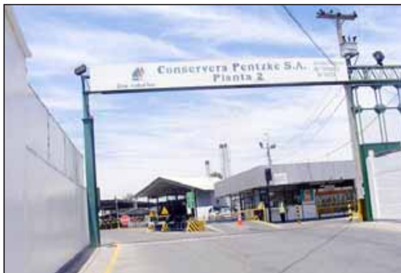
Frontis de la planta 2 de la Conservera Pentzke, ubicada en la avenida Manso de Velasco.

una situación general a nivel país, que ha habido em-