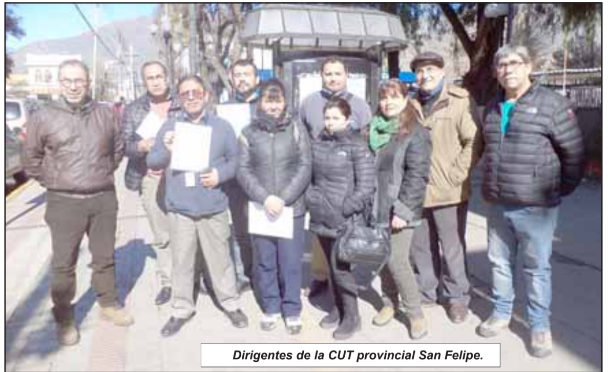
Dirigentes de la CUT provincial San Felipe.

minaciones injustas y arbitrarias que son contrarias a la Constitución Política de la República. La finalidad de este proyecto es flexibilizar y precarizar aún más el mercado laboral. De aprobarse esta ley, los jóvenes estudiantes perderán el derecho a la indemnización por años de servicio, terminarán inapelablemente sus contratos a los 29 años, no tendrán derecho a licencias médicas si son cargas de sus padres, al tiempo que cercena también el derecho constitucional a la protección de la maternidad de las mujeres trabajadoras y verán reducidos sus descansos dominicales y sus jornadas de trabajo frag-