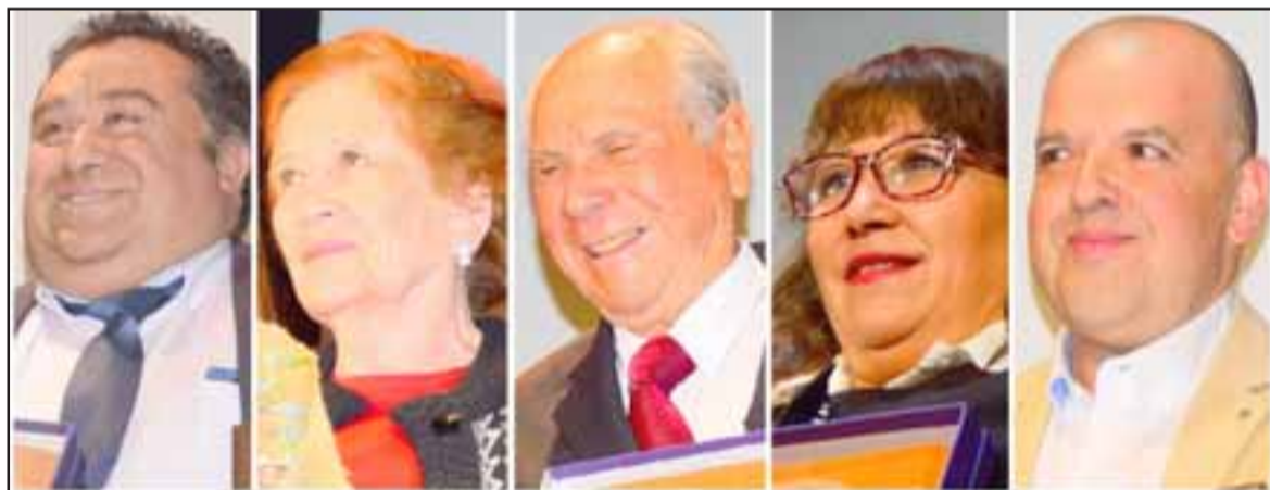
GRANDES SANFELIPEÑOS. - Ellos son parte de los 31 ciudadanos distinguidos este año por el Concejo Municipal de San Felipe.