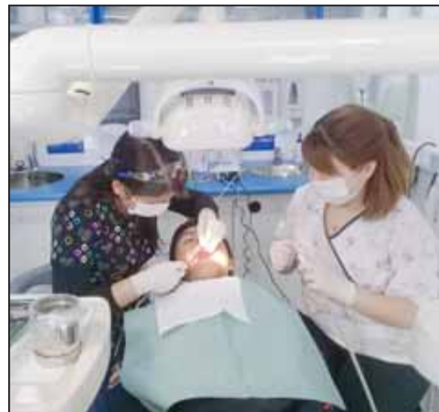
En la Escuela Industrial Guillermo Richards Cuevas se dio inicio a la atención bucal de la Unidad Dental Móvil.