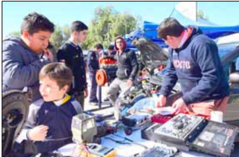
FUTUROS MECÁNICOS. - Los chicos del Mixto también presentaron su mejor carta: Mecánica Automotriz, hubo mucho interés por este tema.