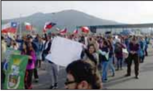
Aconcagua despertó y exigió sus derechos

Más de 200 aconcaguinos se tomaron la ruta