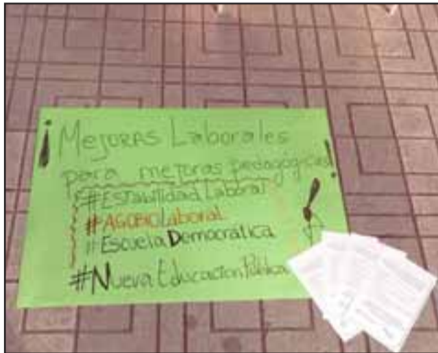
Mejoras laborales otro punto que están pidiendo los profesores.