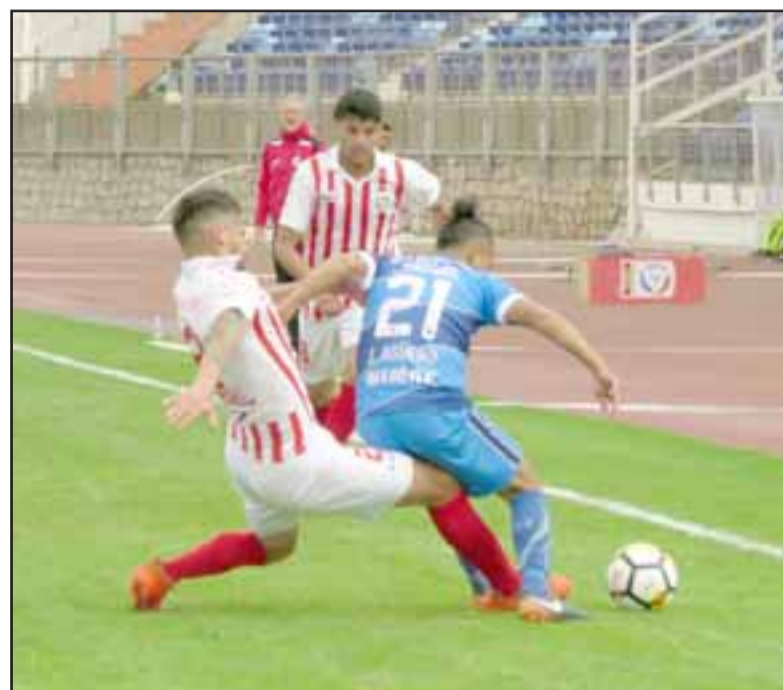
En el histórico Carlos Dittborn Unión San Felipe fue derrotado por San Marcos.