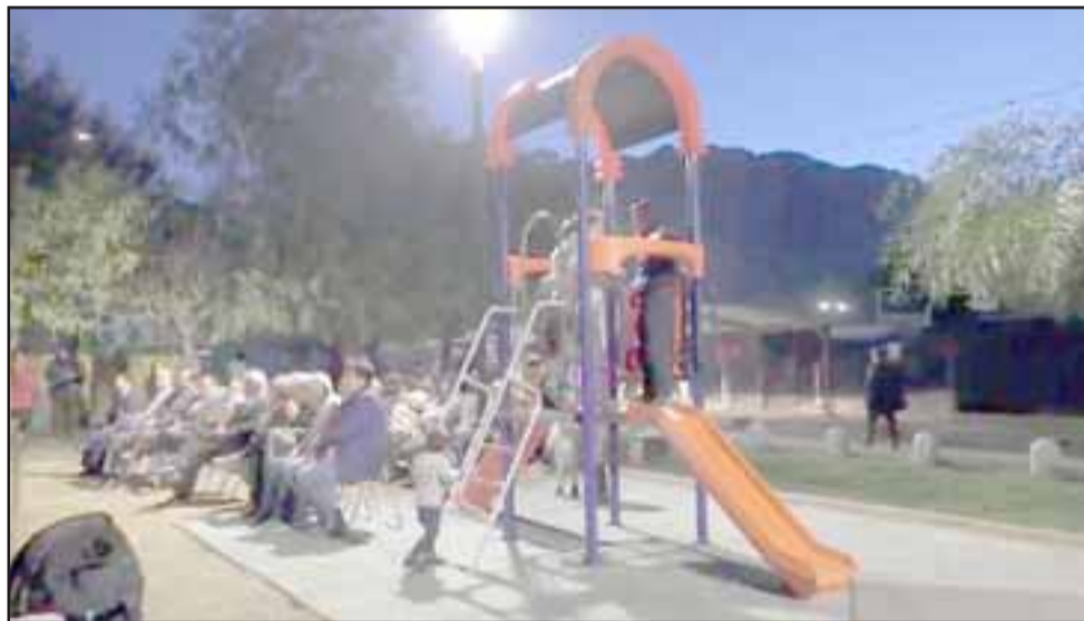
Esta plaza tiene como objetivo aumentar la prevención y seguridad del sector gracias a la recuperación de espacios y la instalación de nuevas luminarias para incentivar su uso durante la noche.

dríguez, afirmó que «estoy muy contento de ver cómo el municipio realiza estas actividades, que permiten fortalecer la seguridad en los barrios y recuperar espacios para todos los vecinos».