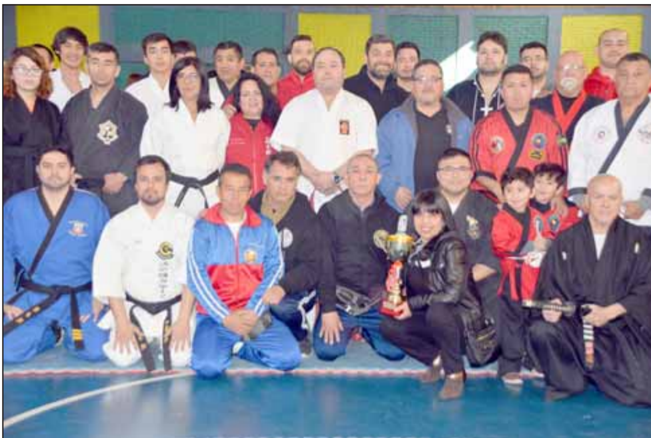
APOYANDO EL DEPORTE.- La gran delegación de maestros en Artes Marciales posó para las cámaras de Diario El Trabajo, mostrando la copa conmemorativa ofrecida a nuestro medio.