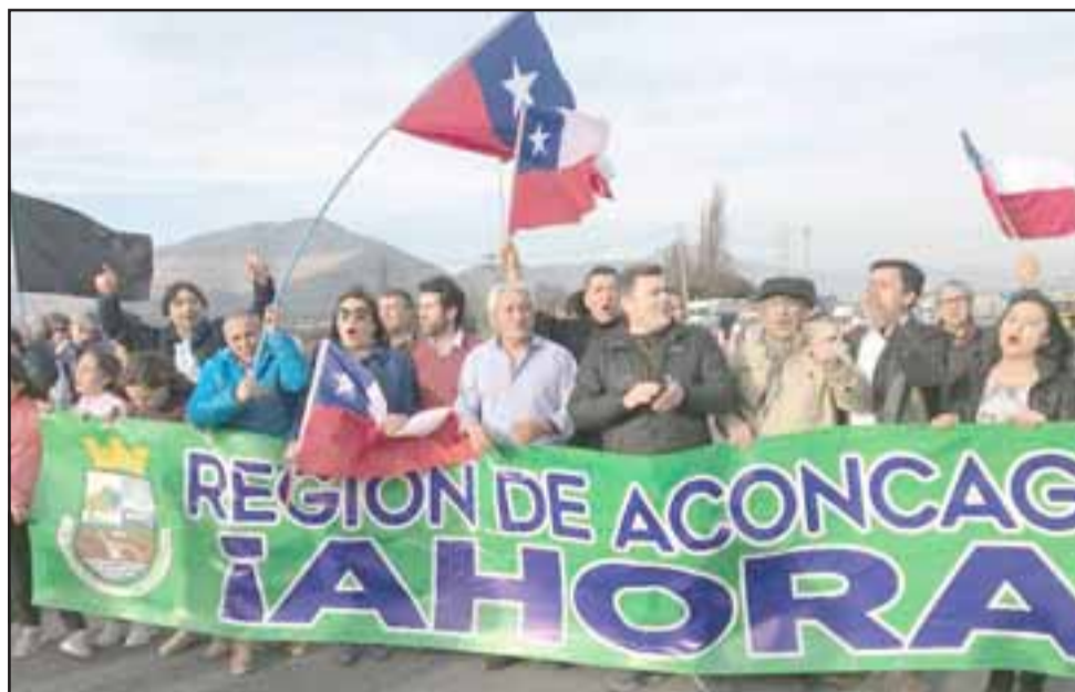
Por cerca de dos horas, alrededor de 200 personas se congregaron en el sector de la Ruta 5 Norte para protestar por alza de 1.400 pesos (ida y vuelta) en la tarifa del Peaje Las Vegas.

En la actividad estuvieron presentes los alcaldes de