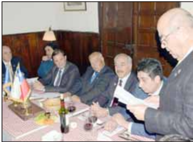
SESIÓN EXTRAORDINARIA. - Un emotivo discurso se escuchó en la sala, de manera extraordinaria la sesión tomó su curso.