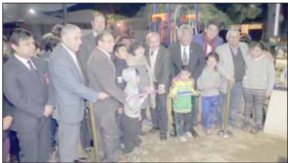
El proyecto denominado La Esperanza se Integra a la ciudad, tuvo un costo de inversión que alcanzó los $25 millones.

La obra, que tuvo un costo de inversión de $25 millones de pesos, fue valorada por los habitantes del sector, quienes agradecieron el trabajo de las autoridades para resolver de