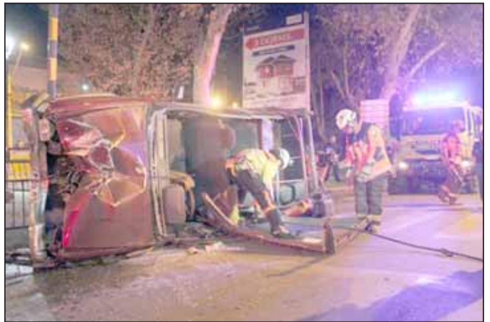
Luego de algunos minutos de trabajo en que incluso debieron cortar el techo del vehículo, el chofer finalmente pudo ser rescatado.