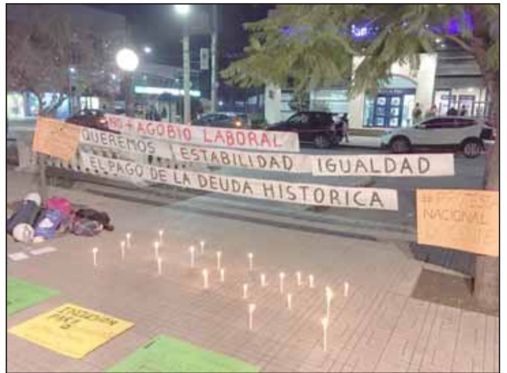
Velas encendidas en la Plaza de Armas de San Felipe fueron encendidas.

La Deuda Histórica de los profesores se originó por