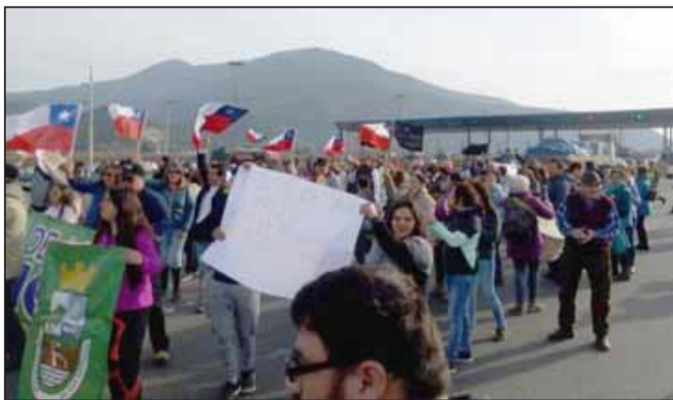
Las Fuerzas Vivas del Valle de Aconcagua lograron hacerse sentir frente a Peaje Las Vegas.