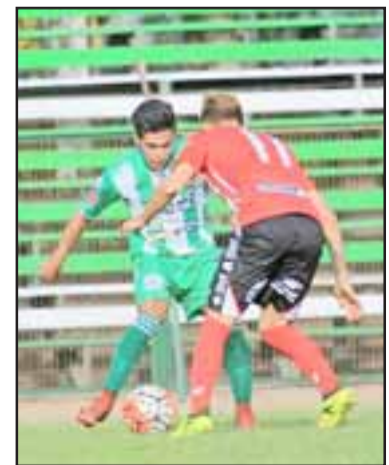
Trasandino consiguió un triunfo muy importante frente al puntero de la Serie de Oro de la Tercera A.