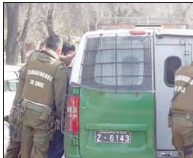
En un amplio operativo de Carabineros los asaltantes fueron capturados en Avenida O'Higgins esquina Navarro en San Felipe, la tarde de este jueves.

Cabe mencionar que este gravoso hecho se suma al ocurrido la noche del miércoles, luego que una banda de inmigrantes asaltara con pistolas a fogeo el Minimarket 'Jumbito', ubicado en Villa El Carmen, logrando un botín de $575.000 en efectivo y un teléfono celular.