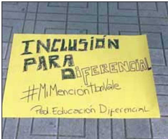
Aquí vemos también algunas frases pidiendo mayor inclusión.

el incumplimiento de la Ley N° 3.551 de 1981, que dispuso un reajuste del sueldo base al sector público, estableciendo en su artículo 40 una 'asignación especial' no imponible para el personal docente dependiente del Ministerio de Educación. Como resultado de la municipalización impuesta a partir del año 1981, la mayoría de los profesores no alcanzaron a recibir el 100% de la asignación, pues al ser traspasados al sector muni-