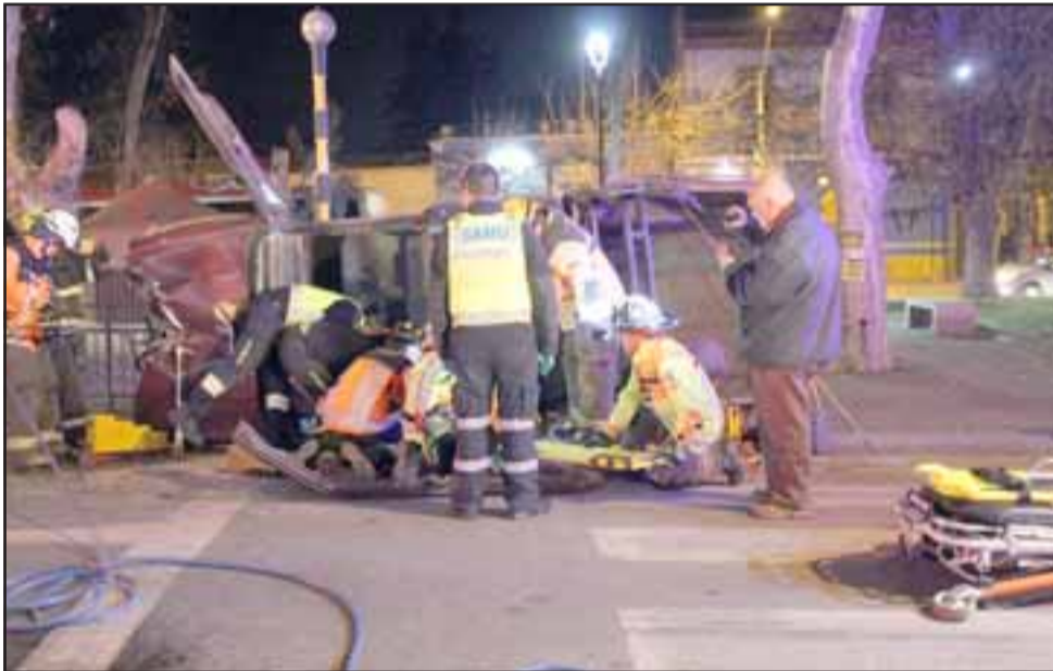
Tras el impacto, que arrancó de su base tanto la barrera, la camioneta volcó de costado, quedando su conductor atrapado en el interior de la cabina.