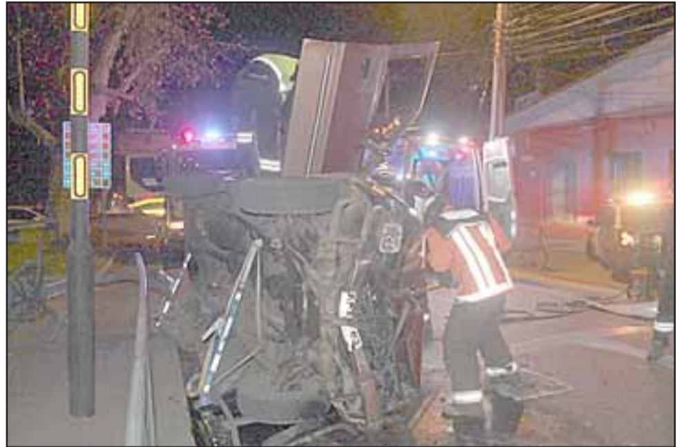
Su conductor y único ocupante quedó atrapado en el interior de la cabina debiendo ser rescatado por Bomberos.

Luego de algunos minutos de trabajo en que incluso debieron cortar el techo del vehículo, el chofer finalmente pudo ser rescatado y derivado hasta el Servicio de Urgencia del Hospital San Juan de Dios para su evaluación médica y realizarle el examen de alcoholemia. En tanto, Carabineros del Cuadrante 1 quedó a cargo del procedimiento a fin de establecer las razones por las que el chofer siguió de largo en la rotonda.