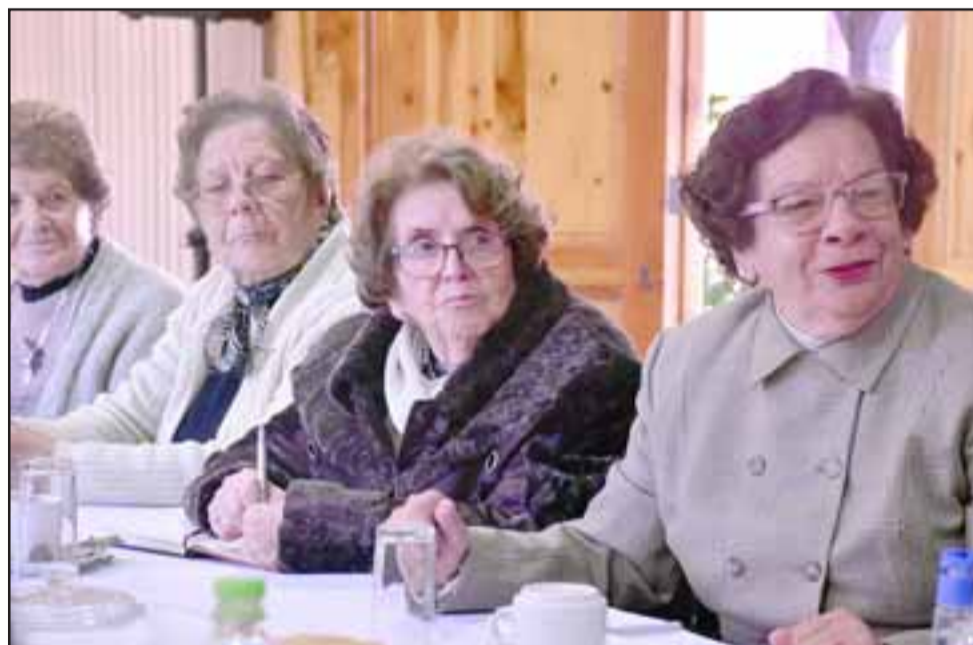
Dirigentes de uniones comunales de adulto mayor conocieron el plan de trabajo esbozado por el recientemente nombrado coordinador regional de Senama.

paraíso concentra uno de los mayores índices de personas mayores de 60 años a nivel país.