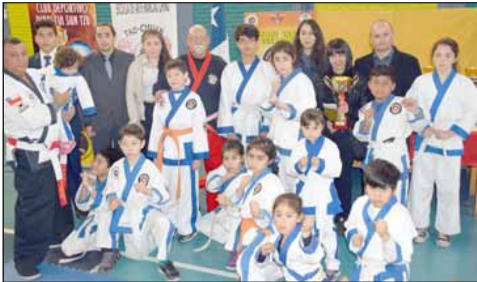
LOS ANFITRIONES.- Ellos son los karatecas anfitriones del Torneo, los chicos del Club Deportivo Marcela Sabaj.

Tal como lo anunciamos, ayer domingo fue una fecha especial para todos aquellos que practican las Artes Marciales en muchas partes de