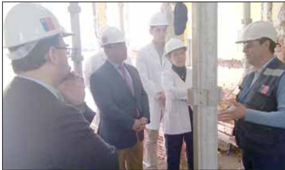
Autoridades provinciales recorrieron la construcción que tiene un avance de un 35%. En la oportunidad, reconocieron a los funcionarios que trabajan en el Hospital hace 15, 20, 30 y 50 años.

trabajo en conjunto con el Ministerio por la inspección técnica de las obras y un trabajo con la empresa para incrementar el porcentaje de avance en la construcción. Se ha llegado a un acuerdo y estamos en un proceso de reprogramación porque tenían una obra de término el 31 de diciembre”, expresó la direc-