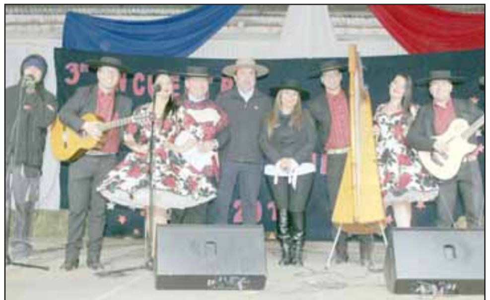
Esta fiesta llena de nuestra música y baile nacional, contó con la participación de agrupaciones provenientes de las regiones Metropolitana, Quinta y Sexta.

«Para nosotros como Ballet Folclórico Parroquial Pangué, el organizar este evento, si bien detrás hay un tema importante como lo es lo económico, lo que nos interesa es poder difundir el folclor, tanto a nivel regional y más a nivel comunal, con el fin de incentivar a la gente de nuestra comuna, en temas de nuestras tradiciones folclóricas y asimis-