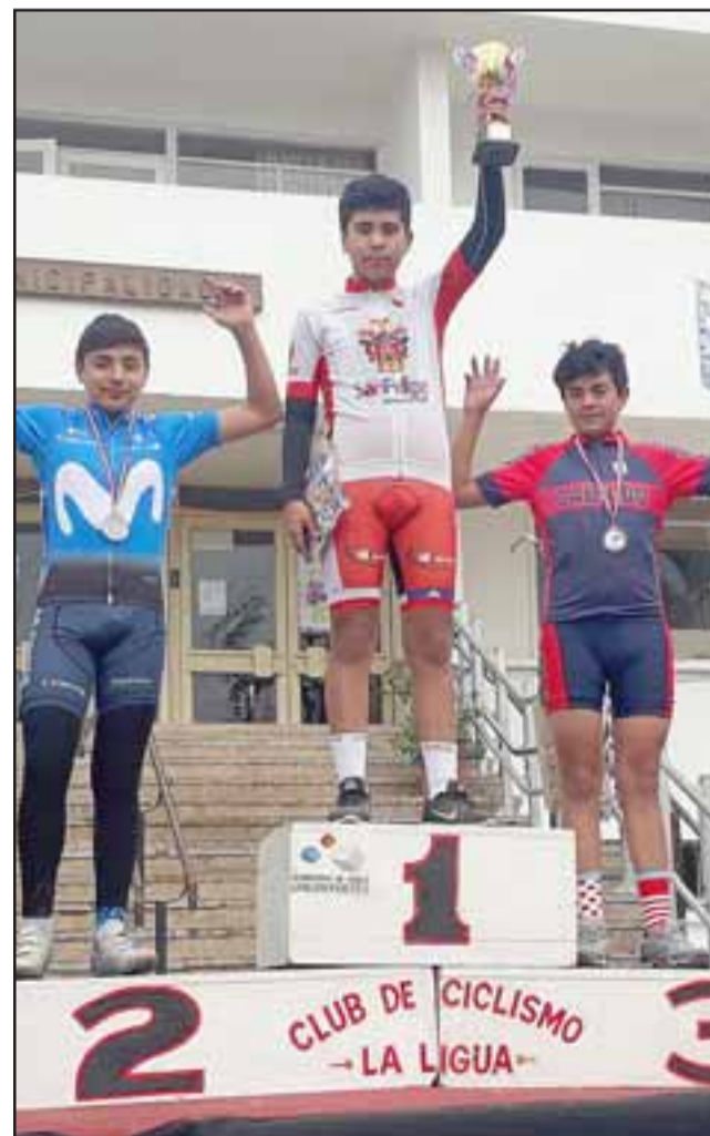
EL MEJOR.- En La Ligua se destacó en el primer lugar de su categoría, imponiéndose a los mejores de la región.