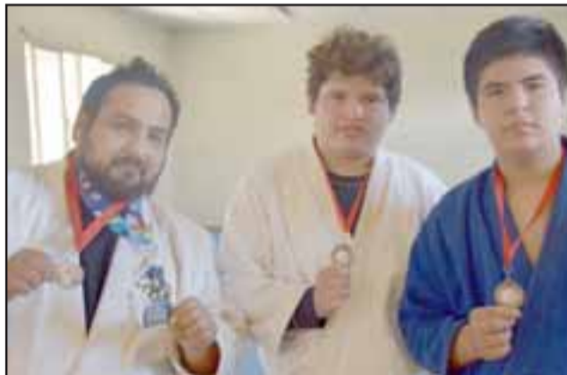
VIENE EL NACIONAL.- Ellos ya han obtenido excelente medallaje en los torneos de Judo, preparándose también para el Nacional de Judo que se disputará en octubre, en nuestra comuna.