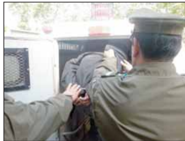
El actual condenado deberá cumplir una pena de tres años y un día de cárcel tras ser enjuiciado por el delito de robo a un local comercial cometido en la comuna de Llay Llay. (Foto Archivo).