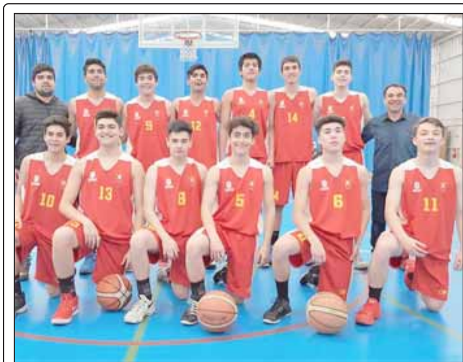
La selección U17 de San Felipe se impuso como visitante a su similar del Marga Marga.