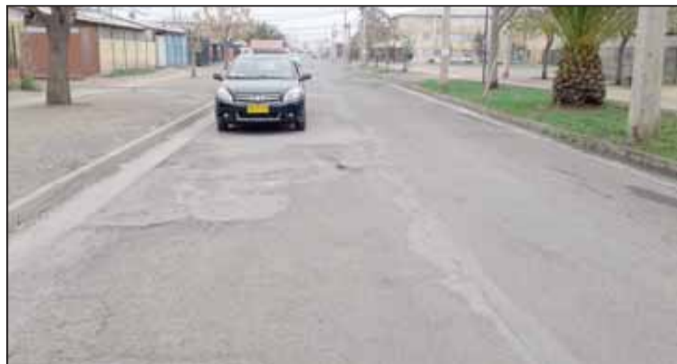
Cráteres de gran magnitud se convierten en verdaderas trampas mortales cuando la lluvia los cubre de agua.