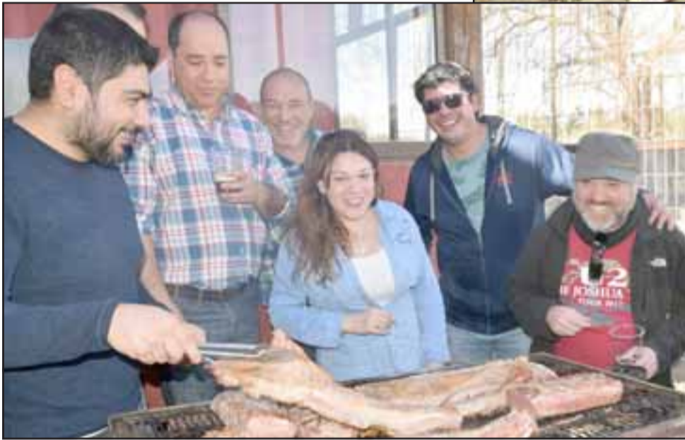
EL ASADO PRIMERO.- De lado quedaron las herramientas, maquinarias y químicos con los que estos mineros se ganan la vida.