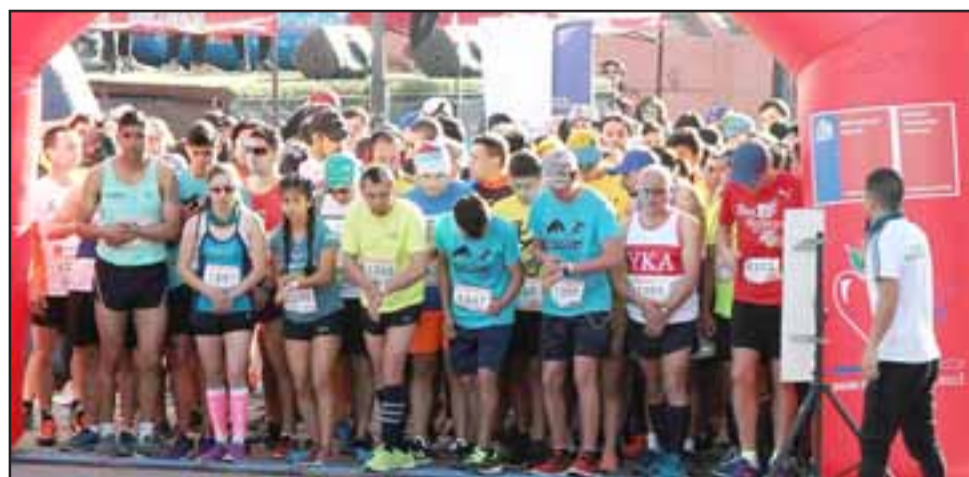
Cientos fueron los runners que dieron vida a la Corrida en Rinconada de Los Andes.