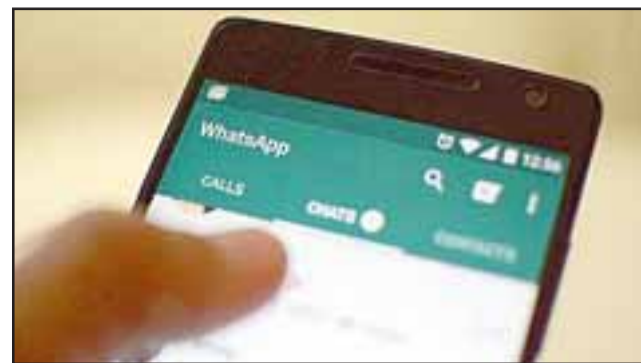
El entonces imputado comunicó a la víctima la sustracción del vehículo y el dinero vía whatsapp. (Foto Referencial).

El Ministerio Público acusó al imputado por el