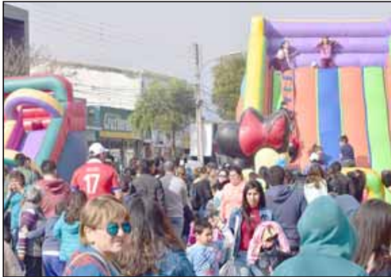
Juegos inflables, pintacaritas, globoflexia en zancos, personajes de dibujos animados infantiles y baile entretenido fueron los principales atractivos de la tarde de fiesta comunal.

nuestra comuna felices, disfrutando al máximo esta celebración en honor a la inocencia y el amor por la diversión sana. Este tipo de instancias que logran reunir a las familias de nuestra comuna son las que nos empujan a seguir trabajando con más ganas por el desarrollo de nuestra comuna y su gente", concluyó el edil.