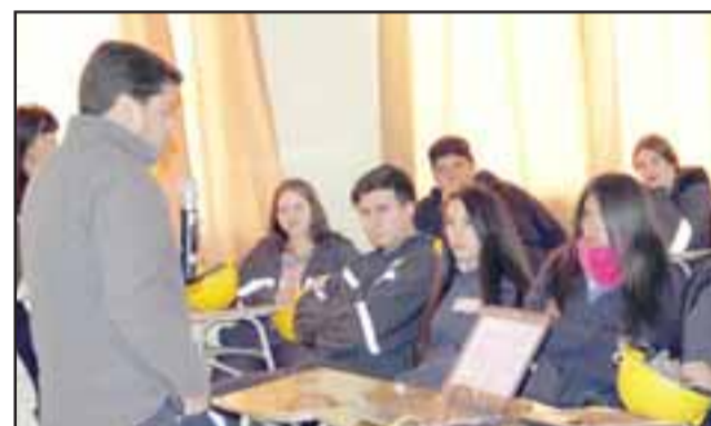
Segundo año consecutivo del Programa Andina Más Cerca en el liceo de Calle Larga.