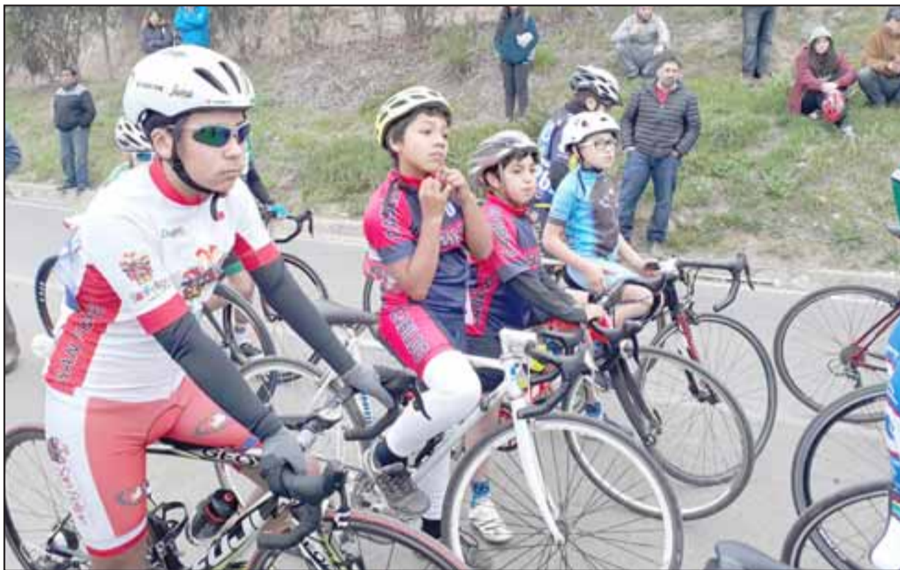
EN SUS MARCAS.- Aquí vemos a 'La Bala' Silva minutos antes de dispararse rumbo a la Meta, un niño sanfelipeño que ya está marcando su propio camino en el competitivo mundo del ciclismo.

«Quiero mejorar en los juegos escolares de septiembre, los que se disputarán en Isla de Maipo, en Santiago, ahí representaré a mi escuela, soy el único de Aconcagua, los otros tres clasificados son de Cabildo, por el momento me financia la familia, espero hacer un buen papel, pues tengo claro que la mejor región irá al Sudamericano 2018 (...) Agradezco también a mi familia, al Club de Ciclismo de San Felipe, al departa-