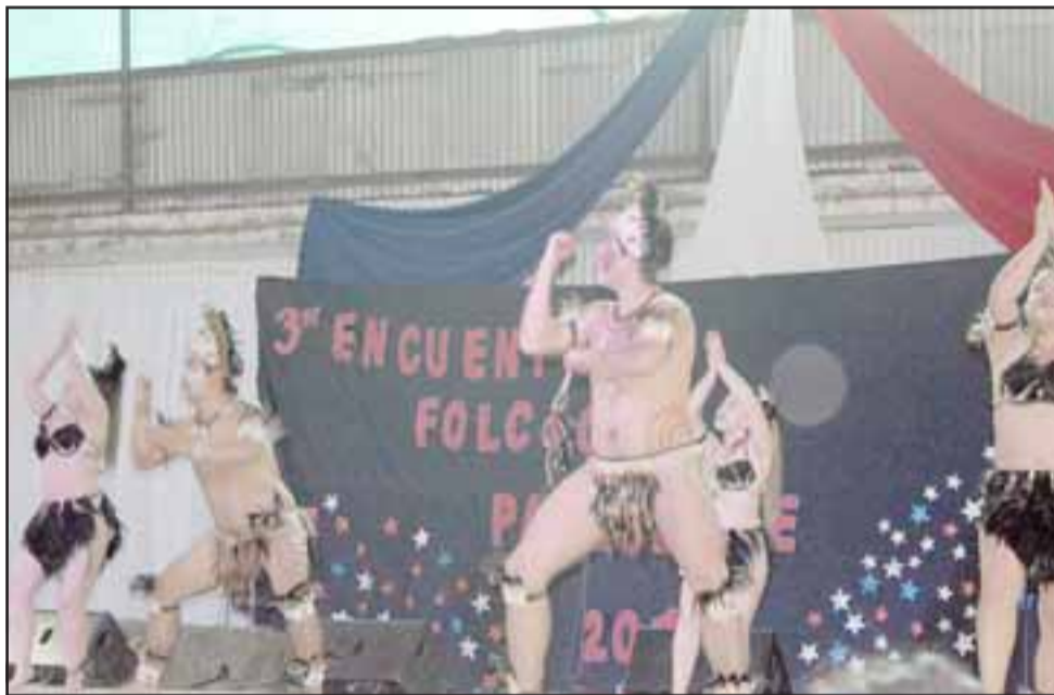
Una fiesta popular llena de cultura, música y bailes criollos constituyó el Tercer Encuentro Folclórico Panquehue 2018.

mo dar a conocer que en Panquehue se vive el folclor».