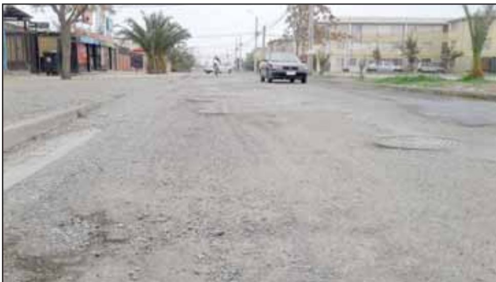
El daño de la calzada es de tal magnitud que los vehículos deben cambiarse a la pista contraria para circular, lo que ocasiona un grave peligro y ha causado ya varios accidentes.