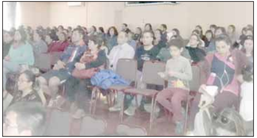
A la actividad, que se realizó la semana recién pasada en el Teatro Municipal de San Felipe, asistieron autoridades, directivos, docentes, y padres y apoderados, quienes realizaron un interesante trabajo de análisis sobre la influencia del adulto en la personalidad de los niños.

“Están participando todos los docentes jefes de primer ciclo básico, educadoras de párvulo, los directores, los equipos de gestión y los equipos invitados y la comunidad escolar. Es muy importante la participación de los padres, e hicimos mucho hincapié en que pudieran asistir, porque son nuevas las estrategias de