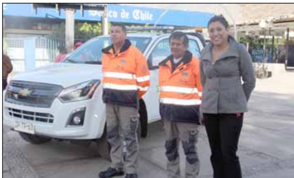
Funcionarios del Departamento de Seguridad Pública posan junto a una de las flamantes nuevas camionetas adquiridas para apoyar la labor policial.