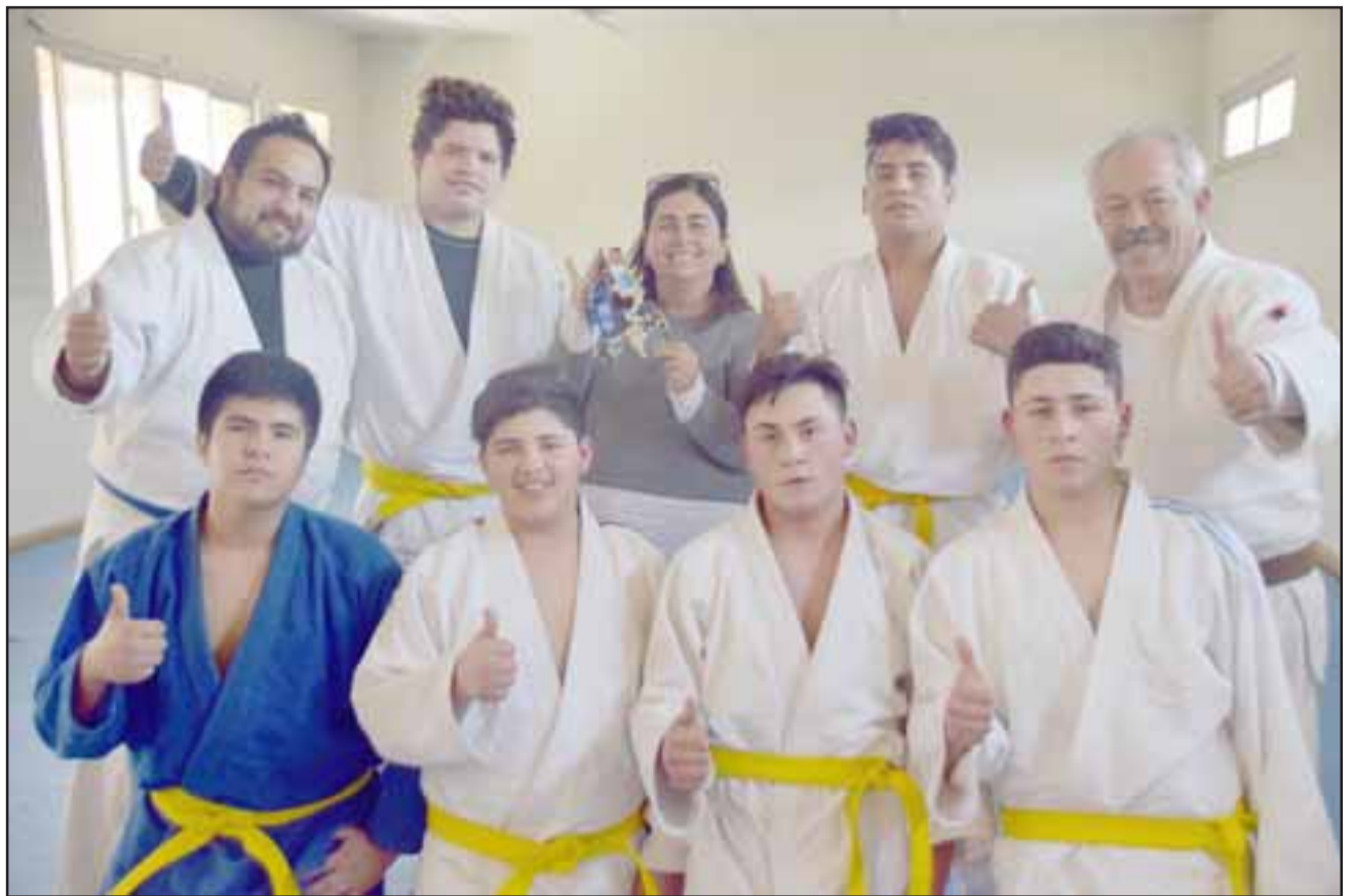
¿TE GUSTA EL JUDO?.- Ellos son parte del grupo que compete en Judo en nombre de la Escuela Assunta Pallota, de Curimón.

Según el profesor, la escuela de Judo apenas tiene un año de haberse inaugurado, pero aún así ya varios de sus muchachos, así como él mismo, han logrado importantes avances en el medallaje: «Logramos un tercer lugar en el Na-