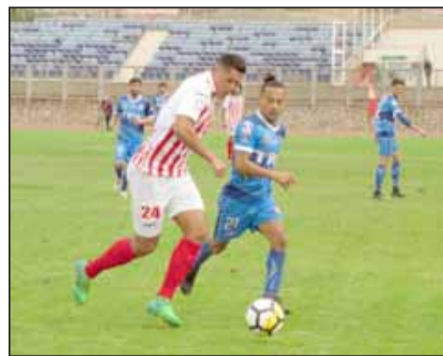
El próximo sábado Unión San Felipe buscará dejar en el olvido el traspié sufrido ante San Marcos.