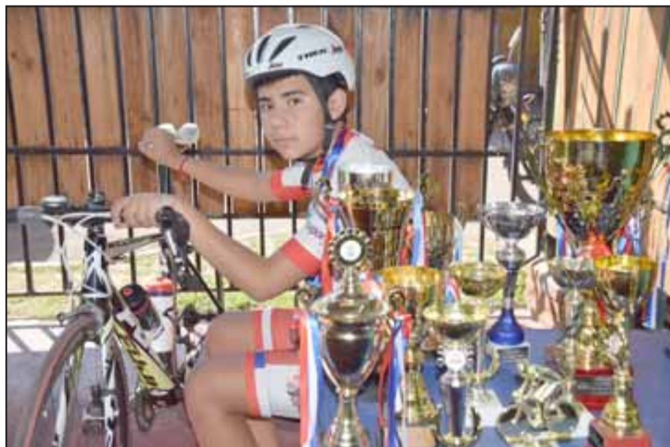
EL NACIONAL LO ESPERA.- Este joven deportista es entrenado por su padre, quien también hizo de las suyas, pero en Mountain Bike.