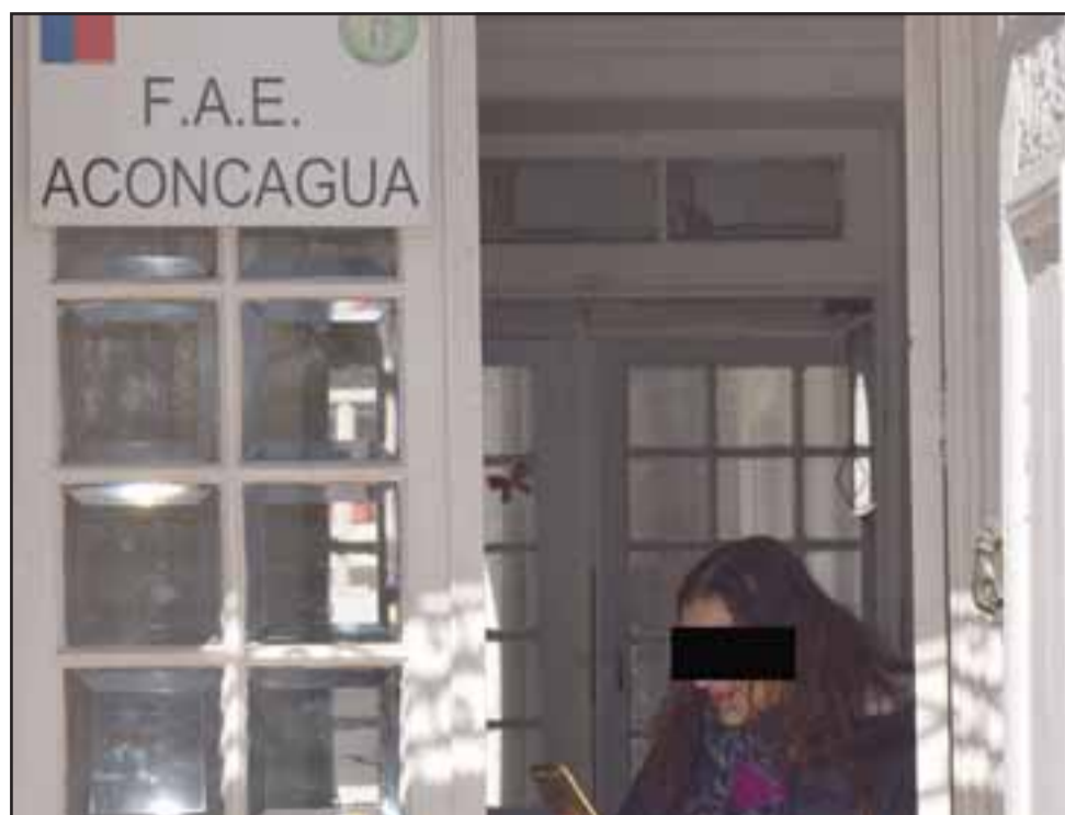
FAE EN SILENCIO. - Diario El Trabajo buscó respuestas en la oficina del FAE Aconcagua, pero la respuesta fue más que tajante: «Nosotros no tenemos por qué responder a ningún Diario, sólo rendimos cuenta al Tribunal y al Sename».

Finalmente y entendiendo que no contamos con todos los elementos de juicio de esta historia en virtud del hermetismo de las autoridades a cargo, como medio de comunicación consideramos que, a lo menos, existen dudas razonables para pensar que los derechos del niño pudieran estar siendo vulnerados por las entidades llamadas pre-