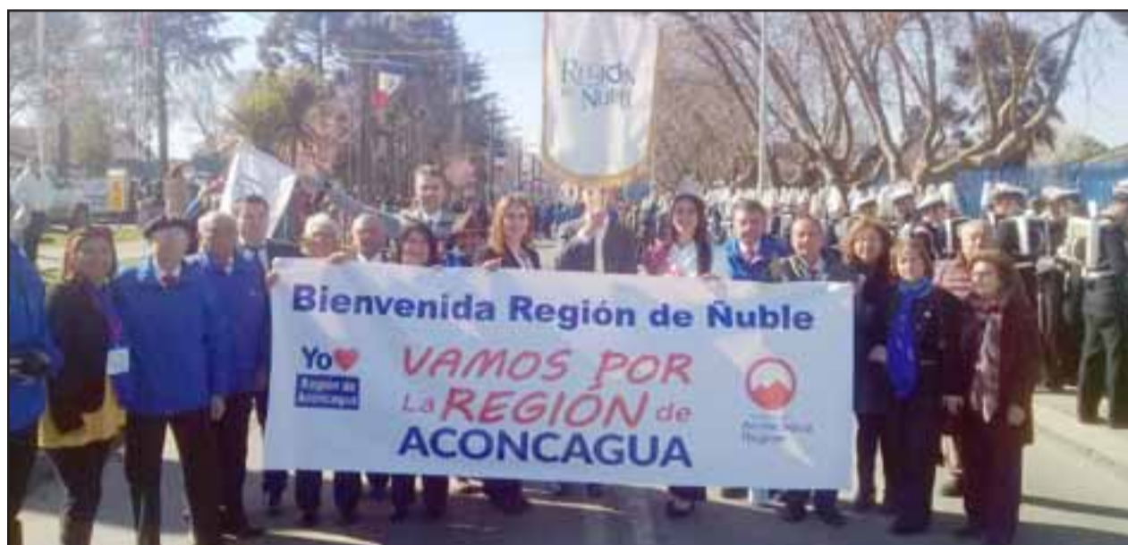
Frente a autoridades y público asistente, se desplegó el lienzo que señalaba ‘Bienvenida Región de Ñuble, ahora vamos por la Región de Aconcagua’.

cipar en el histórico desfile que contó con la presencia del Presidente de la República, Sebastián Piñera; el ministro de Defensa, Alberto Espina; parlamentarios y alcaldes de la nueva región.