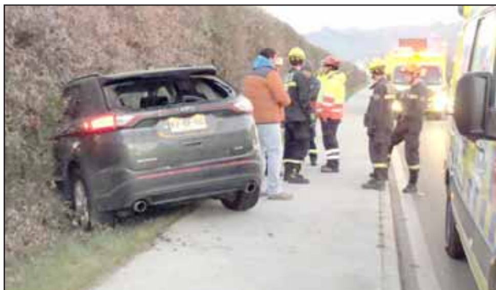
El accidente ocurrió cerca de las 08:30 de la mañana de ayer martes en calle Chercán Tapia de San Felipe.

tente KF BF - 30, por causas que se desconocen habría perdido el control de su vehículo, saliéndose de la pista hasta chocar contra los arbustos.