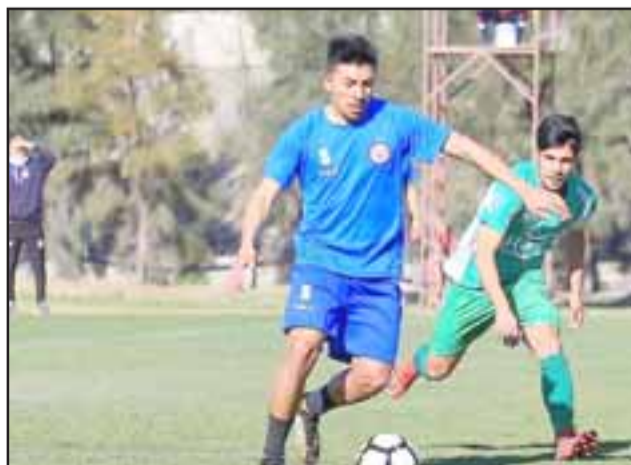
Definitivamente para el mediodía del sábado próximo fue reprogramado el partido entre Magallanes y el Uní Uní.

La medida se debió a que el ente rector del balompié profesional chileno atendió un requerimiento de Magallanes para modificar el horario y día del encuentro que está inserto dentro de la fecha 21ª del campeonato de la serie B chilena.