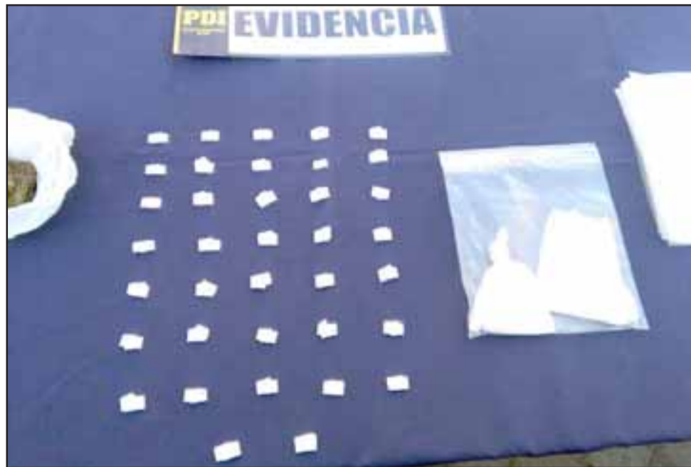
Oficiales de la Biro detuvieron además a una mujer por Infracción a la Ley de Drogas y un hombre que mantenía cinco órdenes de aprehensión pendiente.

“Con esta información se coordinó con el Ministerio Público dos órdenes de entrada y registro, logrando desbaratar además un punto de venta de droga en el taller mecánico de uno de