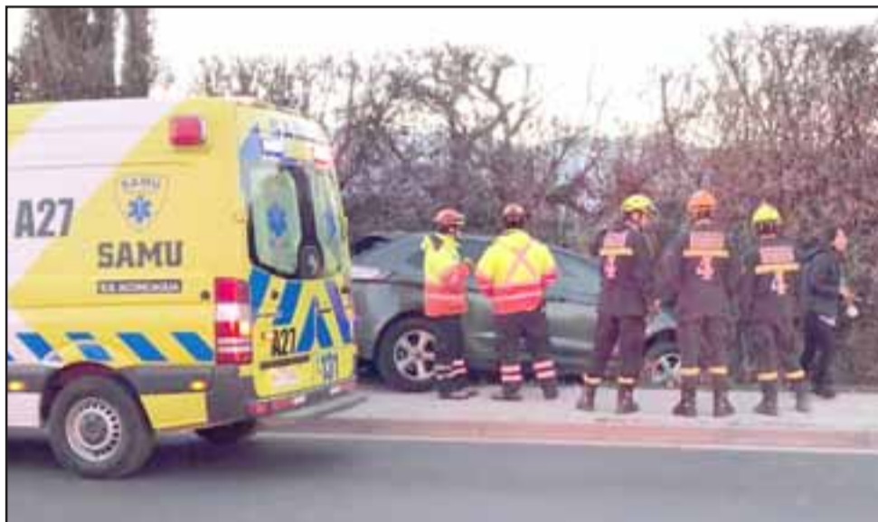
Personal del Samu y Bomberos concurren al accidente donde resultaron lesionadas una madre y su pequeña hija.

A raíz del violento impacto la conductora de iniciales M.F.A.M. , resultó con lesiones en su cabeza, las que fueron diagnosticadas como menos graves, debiendo ser asistidas por los paramédicos del Samu, quienes concurren al lugar de los hechos.