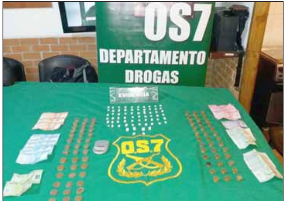
El operativo efectuado por el OS7 de Carabineros en el domicilio de la actual sentenciada, incautó envoltorios de pasta base, clorhidrato de cocaína y dinero en efectivo desde el domicilio ubicado en la comuna de Putaendo.

En medio del allanamiento efectuado por los funcionarios policiales, des-