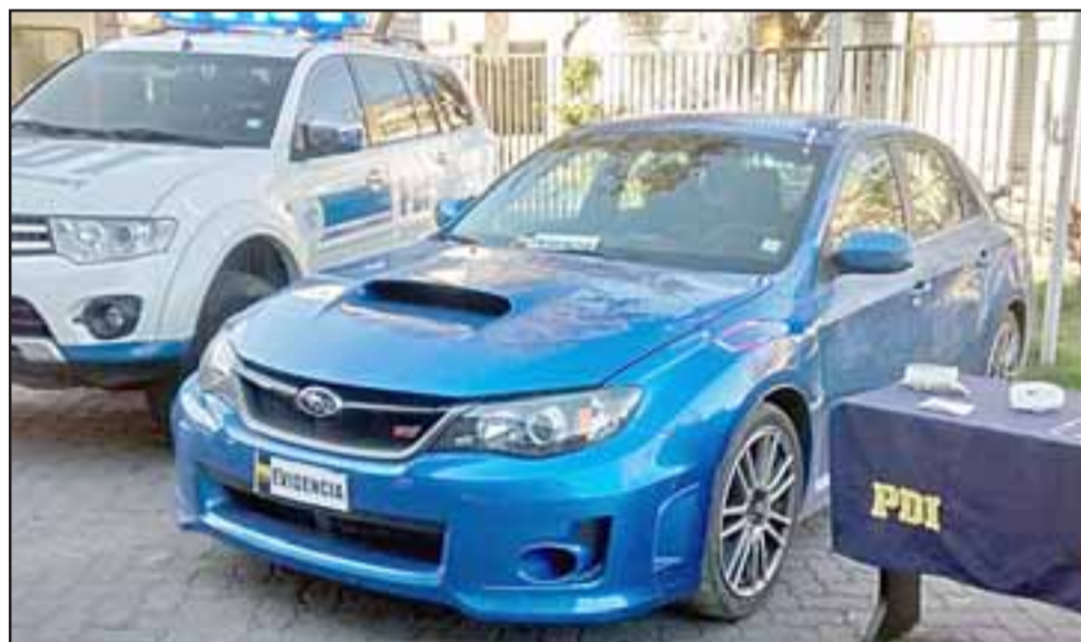
El Subaru Impreza se presume sería comercializado en la ciudad de Santiago y su valor alcanza aproximadamente a los 22 millones de pesos.

los sujetos que conducía este auto robado en el sector de Pocuro, además de ubicar un segundo móvil correspondiente a un Nissan V 16, también por encargo por robo desde el mes de junio”, detalló el jefe de la Biro.