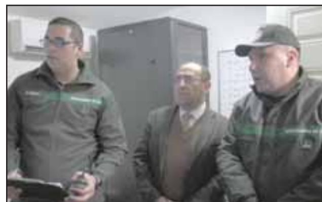
La autoridad provincial junto al alcalde del CCP presenciando el operativo realizado por funcionarios de Gendarmería en el recinto penitenciario que tuvo en su puesta en escena toma de rehenes.

puesta de las instituciones que nos apoyan para brindar la seguridad del establecimiento. De acuerdo a este protocolo y los tiempos San Felipe está preparado para enfrentar este tipo de situaciones”.