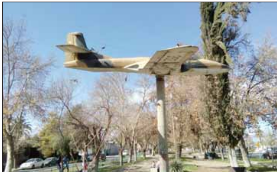
Este es el avión ubicado actualmente en la avenida O'Higgins que será trasladado al Club Aéreo de San Felipe.

Según el alcalde, el club aéreo pretender unirlo con otro avión que tienen en el lugar.