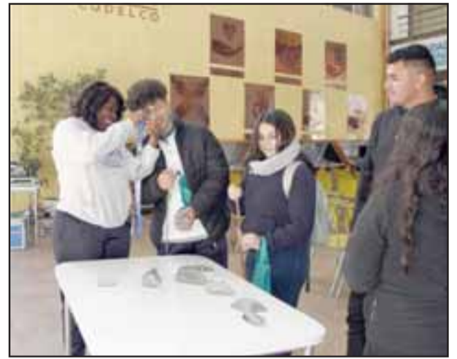
Visita de alumnos del Liceo Manuel Marín Fritis se enmarca en el Programa Andina Más Cerca.

su formación. «Para los chicos de Electricidad es importante venir, porque aprenden de dónde se obtiene el producto que ellos ocupan para su labor; y en administración para ver la posibilidad de futuras prácticas profesionales. Es valioso en otros ámbitos también, el entorno les enriquece en su vocabulario y en su comportamiento. Para nosotros esta visita es bien importante, es una valiosa oportunidad».