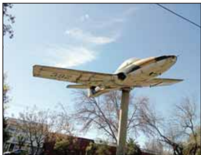
El avión se instaló hace unos 20 años y su estado actual es bastante lastimoso debido a la falta de mantención.