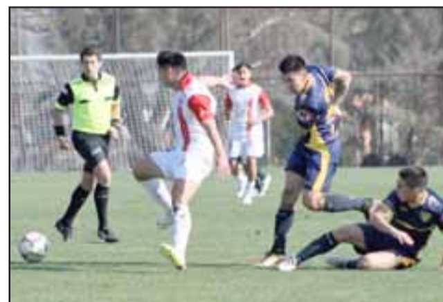
Solo un triunfo cosecharon los cadetes de Unión San Felipe en sus duelos contra Barnechea.