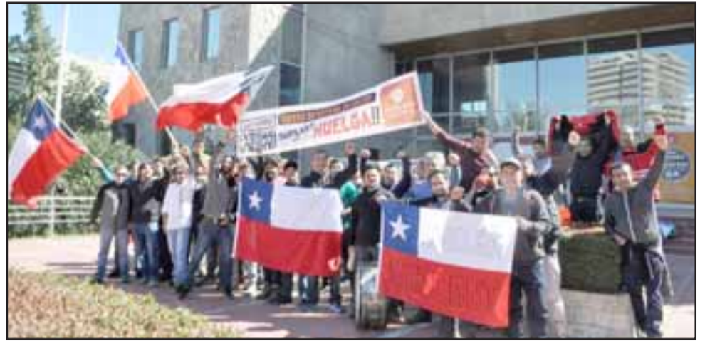
Con una toma del edificio institucional de Andina se inició la huelga indefinida del Sindicato de Trabajadores Unión Planta.

Remarcó que los 83 trabajadores que componen el sindicato están adheridos a la huelga, "y esta es la primera muestra de desagrado, ya que tenemos el Camino Internacional, el camino industrial e incluso el