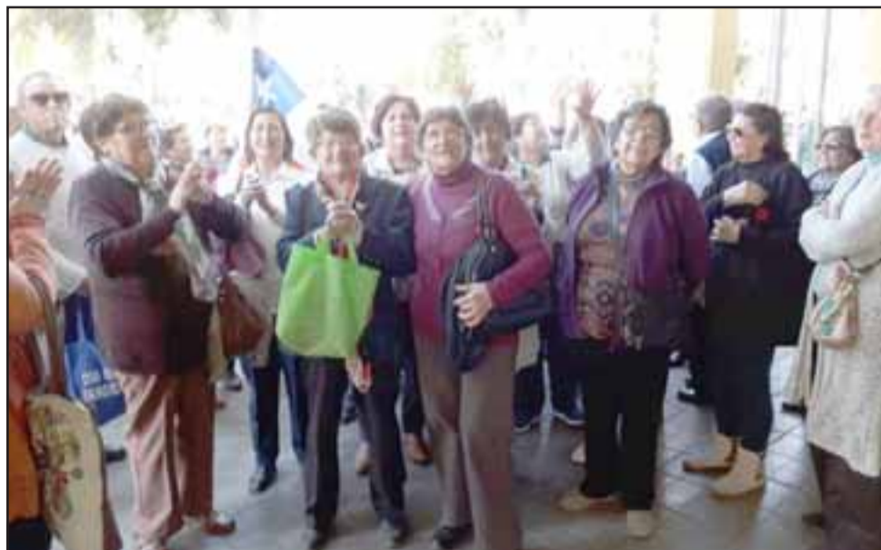
Los adultos mayores se manifestaron la tarde de este lunes frente a la Municipalidad de San Felipe.

Además aclaró que siempre las puertas del centro del adulto mayor han estado abiertas para todos los dirigentes y organizaciones, «porque quiero especificar algo muy puntual, quiero que los adultos mayores entiendan, porque me contaron que una de las razones era que yo había prohibido que las organizaciones funcionaran o se reunieran en el Ayecam... eso es una falsedad enorme... jamás. Quiero explicar otro tema que quiero que los adultos mayores tengan claro, es que en el Ayecam existe una oficina exclusivamente para la unión comunal de esa oficina, tienen llaves los dirigentes de la Unión Comunal, ellos llegan en horario de oficina, atienden a todos sus dirigentes, solucionan sus problemas, nosotros los estamos apoyando en todo lo que es administrativo, si