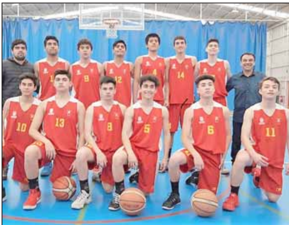
El combinado menor de 17 de San Felipe sorteó con éxito su primer obstáculo hacia el Nacional de la categoría.