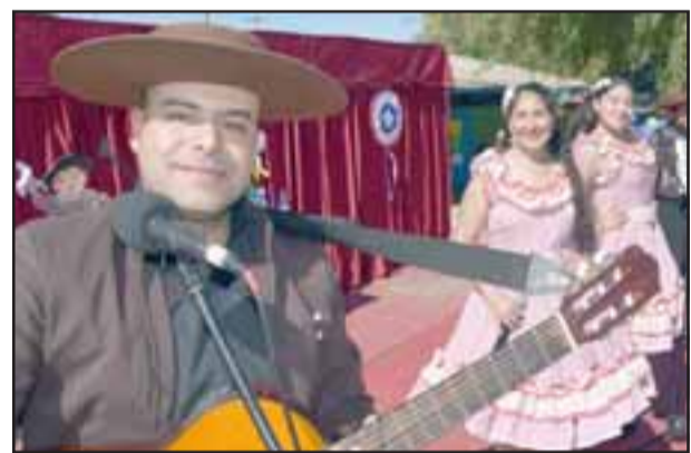
LOS DEL CENTRO. - Aquí tenemos a varios de los músicos del Ballet de Cueca Central, quienes entregaron todo para alegría de los niños.