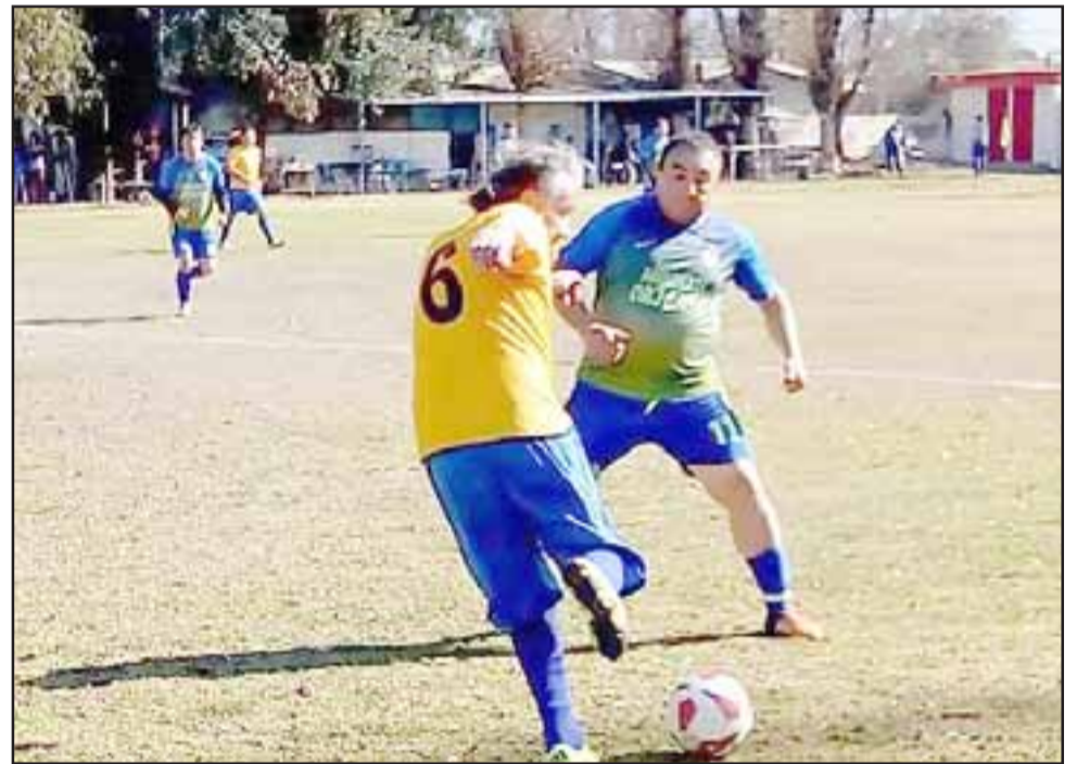
Intensa y muy atractiva fue la jornada número dos del Clausura de la Liga Vecinal.