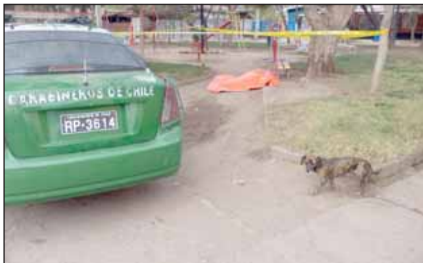
Carabineros, PDI y SML en el lugar donde fue encontrado el cuerpo sin vida de Iván Aquiles Salinas Pizarro.