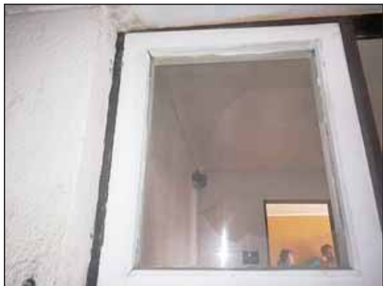
El vidrio de este ventanal fue destruido para lograr ingresar al domicilio.