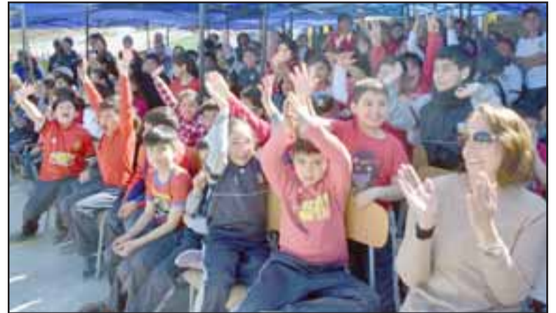
ELLOS APLUDEN. - Los estudiantes son quienes más han disfrutado de esta agenda semanal de actividades para celebrar el 175º aniversario de la escuela.