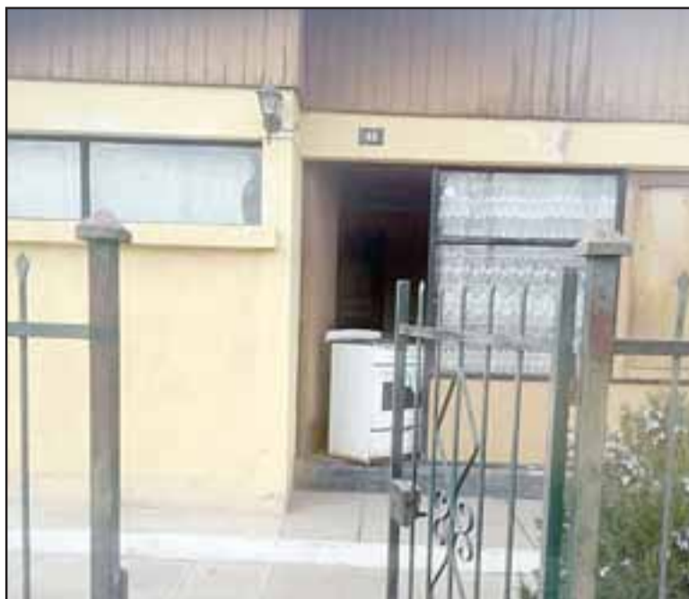
Una mujer habría arrastrado esta lavadora para ser robada desde un domicilio de la población San Felipe.