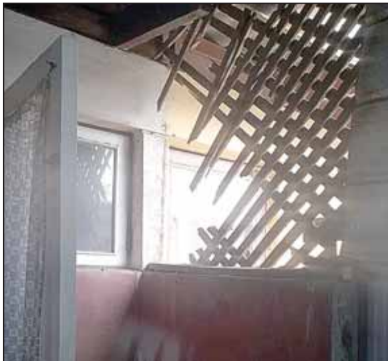
Los antisociales destruyeron esta protección de madera.