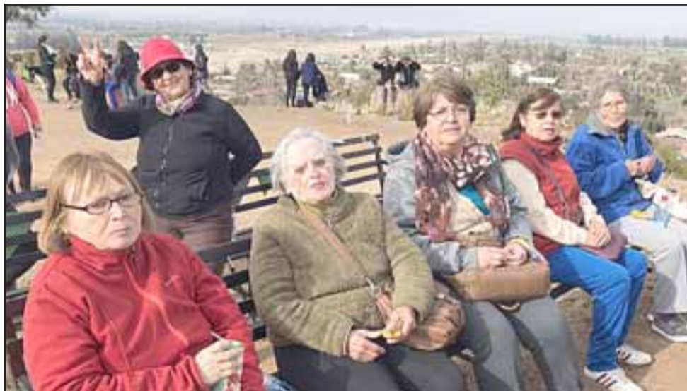
Adultos mayores también participaron de la caminata, además de la comunidad de El Asiento, beneficiarios del Cescosf Padre Hugo Cornelissen, la oficina de la Discapacidad y los alumnos de las escuelas rurales del sector.

Cesfam Segismundo Iturra, la comunidad de El Asiento, beneficiarios del Cescosf Padre Hugo Cornelissen, la oficina de la Discapacidad y los alumnos de las escuelas rurales del sector, contempló un recorrido por el sector de El Asiento, terminando en el cerro La Cruz, donde los participantes también realizaron actividad física.