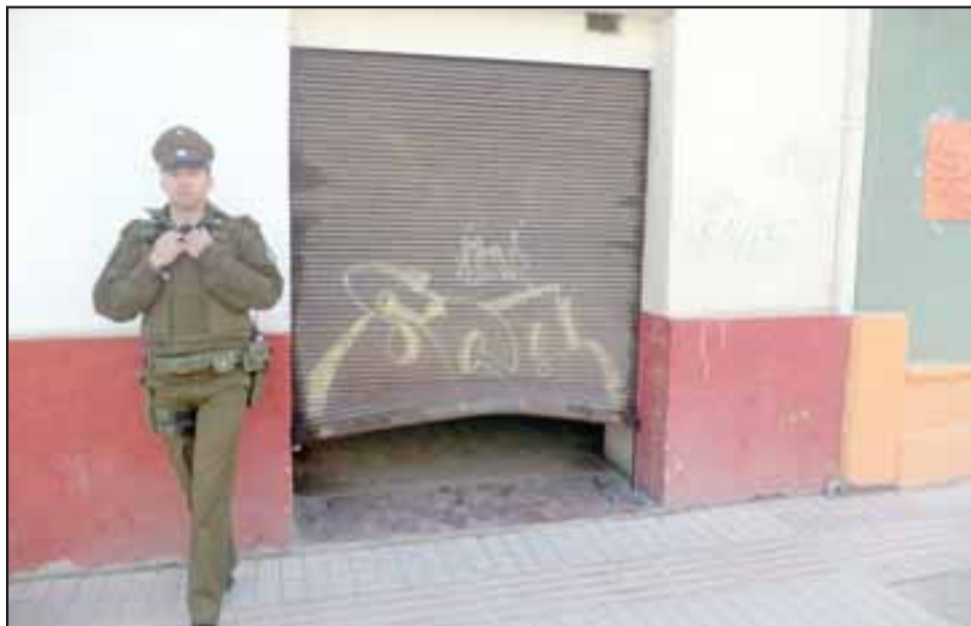
Carabineros en el lugar, se puede apreciar la cortina reventada.

Entre los negocios de esta calle que han sido robados, está el servicio técnico ubicado al llegar a la avenida Yungay, la sede de la Cruz Roja, una tienda de