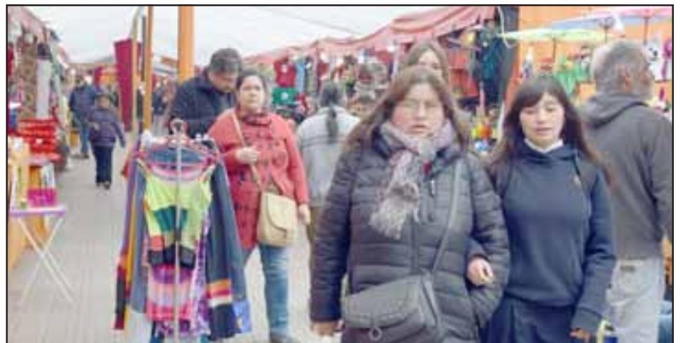
ÚLTIMAS SEMANAS.- Muchas son las ofertas y variada mercadería en los stands de la Plaza de Armas de San Felipe al alcance de los aconcaquiños.

poder acceder a productos peruanos, bolivianos, nacionales y chinos, es una feria internacional en la que también los artesanos sanfelipeños y de otras comunas del valle, pueden promocionar su bello trabajo.