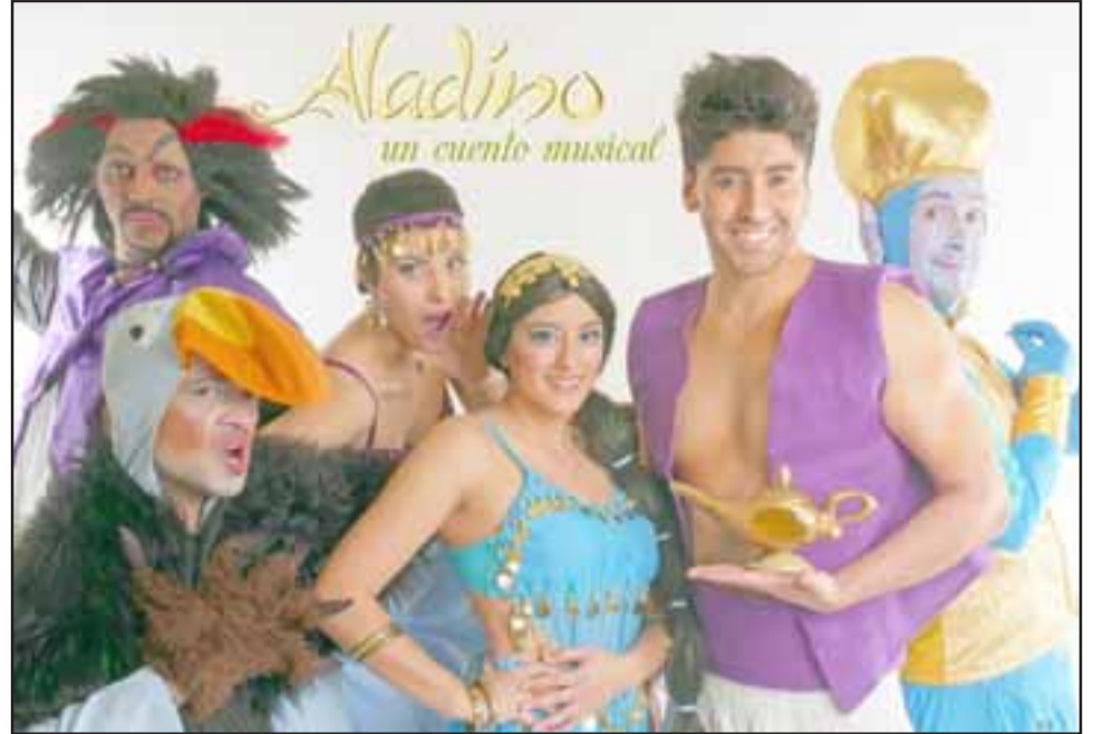
Elenco de Aladino, un cuento musical que será del agrado de grandes y chicos.

Asimismo, Alarcón destacó la itinerancia que ha logrado la obra por varias ciudades del país, «además de formar parte de diversos elencos que han realizado las más variadas producciones musicales de Disney en nuestro país, lo que les ha permitido inclusive recorrer desde los lugares más recónditos de Chile como Putre, Azapa, Pisagua, hasta los principales teatros municipales y la fiesta de Kidzapalooza», finalizó.