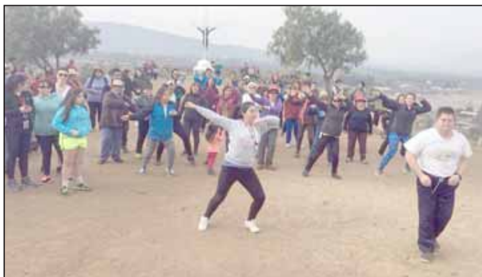
La actividad contempló un recorrido por el sector de El Asiento, terminando en el cerro La Cruz, donde los participantes también realizaron actividad física.

La caminata, que reunió a adultos mayores de los programas Vida Sana del