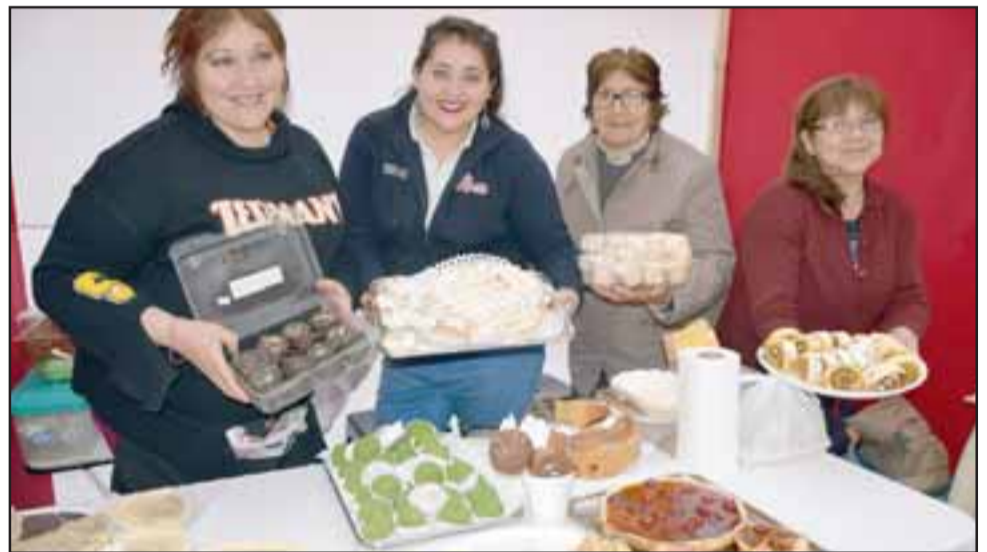
RICOS PASTELES.- Estas vecinas son excelentes pasteleras del Taller Santa Elisa, fabrican sus ricos pasteles y los venden en esta feria comunal.