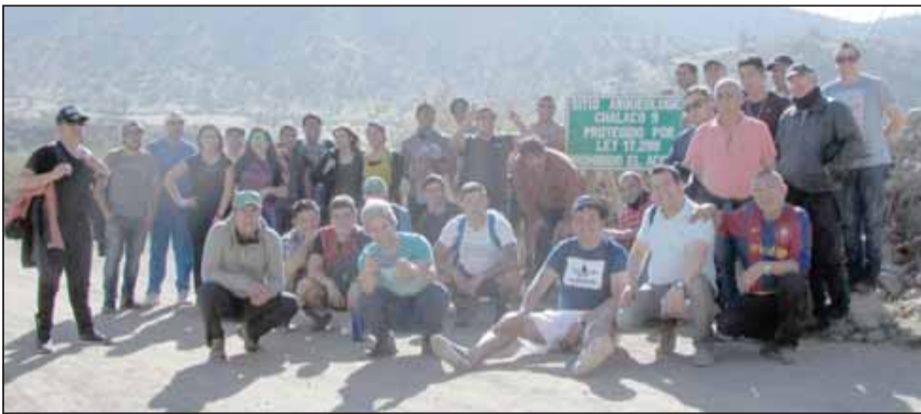
Los internos también visitaron el monumento histórico nacional Corrales del Chalaco, para que pudieran disfrutar de la cultura, en condiciones de igualdad y no discriminación.

Para este año, y debido a la significativa cantidad de población de la tercera edad se tiene pensado celebrar el día del Adulto Mayor en el centro putaendino. De igual forma, en los próximos días comenzarán las charlas para los funcionarios y usuarios sobre derechos de grupos migrantes.