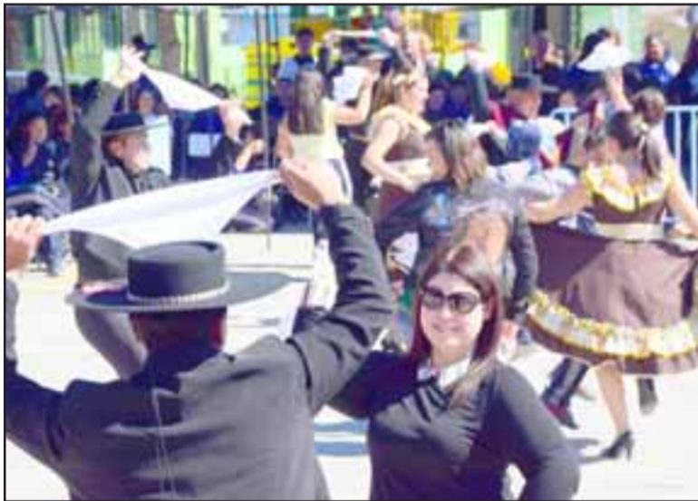
TODOS A BAILAR. - También los adultos, en este caso profesores y auxiliares, disfrutaron su pie de cueca.