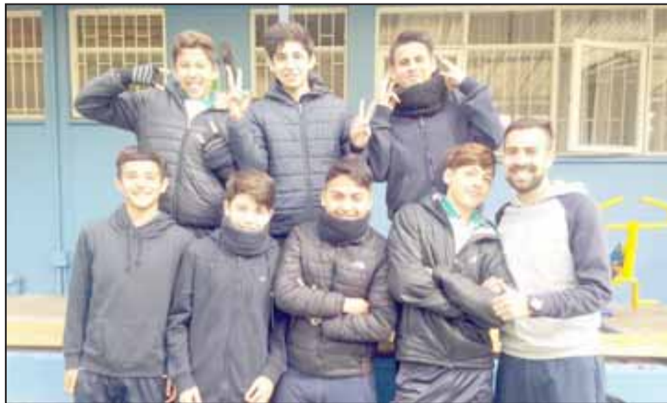
Este es el equipo de futsal Sub 14 del Liceo Manuel Marín Fritis, que es finalista regional de los Juegos Escolares IND 2018.