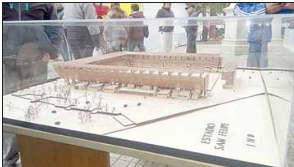
Esta es la recordada maqueta del estadio.