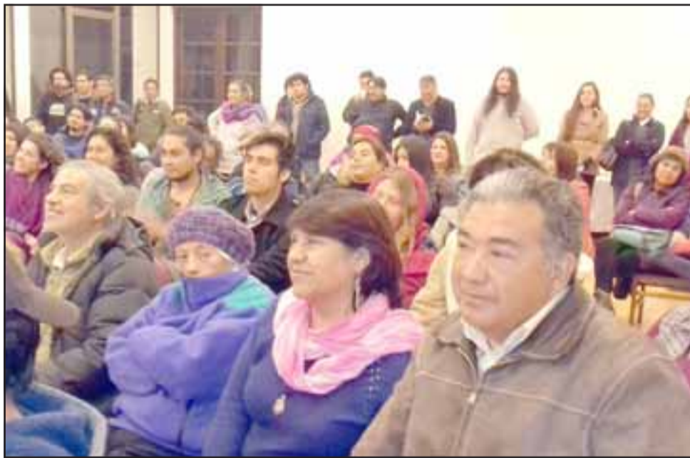
El espaldarazo que los sanfelipeños dieron a este joven escritor es evidente, la sala estaba a lleno total.

Los interesados en obtener ejemplares de esta obra, pueden llamar al autor: 959236166.