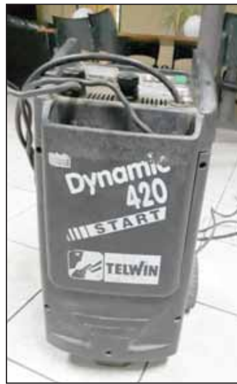
Personal de Carabineros logró recuperar el cargador de batería perteneciente a la Automotora Cordillera ubicada en avenida Chacabuco N° 991 en San Felipe.

Incautan 35 gramos de pasta base de cocaína: