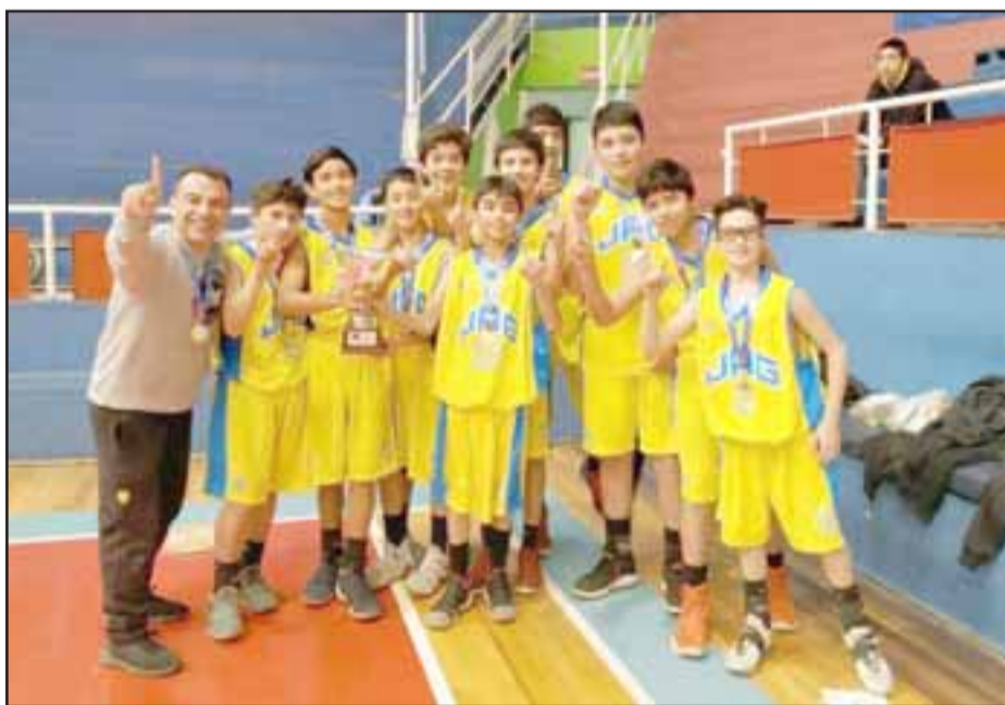
Por quinto año consecutivo el colegio José Agustín Gómez se alzó como el mejor de la Quinta Región en la serie U14 del básquetbol escolar.

U17: Santiago Morning 7 – Unión San Felipe 0 U19: Santiago Morning 3 – Unión San Felipe 3