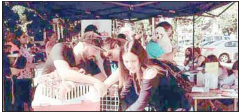
No brindar agua y comida a diario a las mascotas, es una forma de maltrato.

Tras realizar las visitas, los profesionales buscan que los vecinos trabajen en conjunto para alcanzar acuerdos para mejorar la situación del animal. «Nosotros trabajamos con la voluntad de ambas partes.