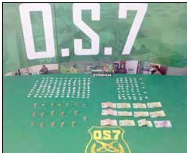
Un total de 173 envoltorios de pasta base de cocaína y dinero en efectivo fueron incautados por personal del OS7 de Carabineros desde un domicilio ubicado en la Villa Sol Naciente de San Felipe.

Un total de 173 envoltorios de pasta base de cocaína fueron incautados por personal de Carabineros del OS7 Aconcagua desde el interior de un domicilio ubicado en la Villa Sol Naciente, siendo detenida una joven de 21 años de edad por el delito de microtráfico de drogas.