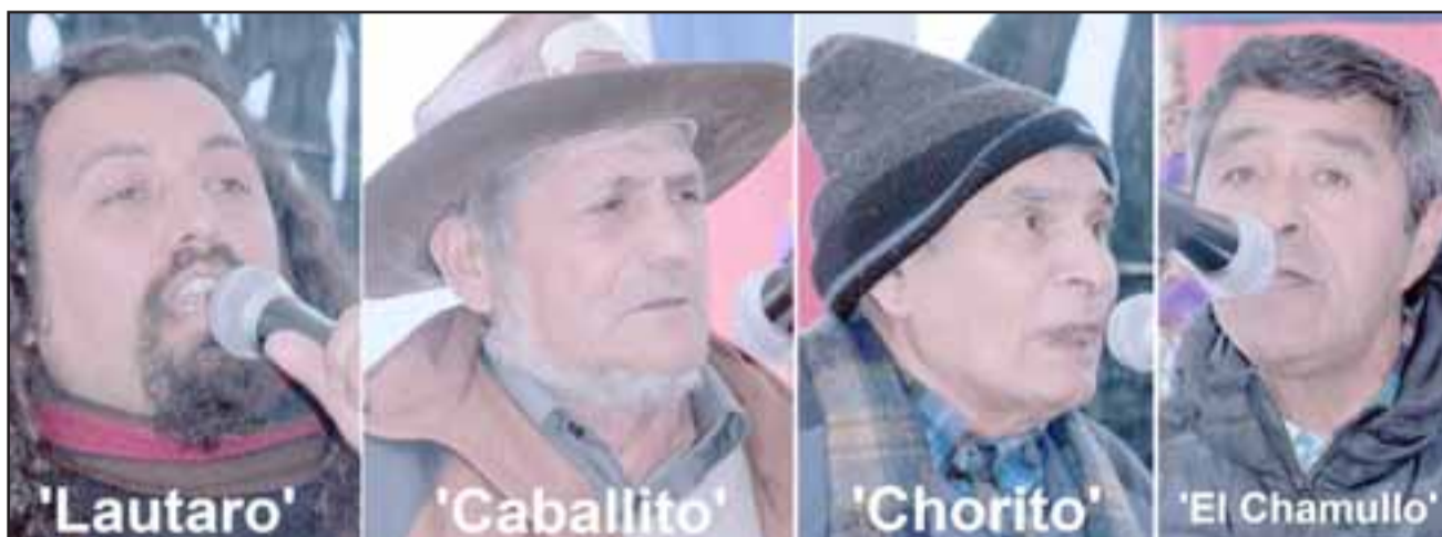
NUESTROS PAYADORES.- Ellos son algunos de los más conocidos payadores aconcaquiños que estarán haciendo de las suyas mañana jueves y el viernes.