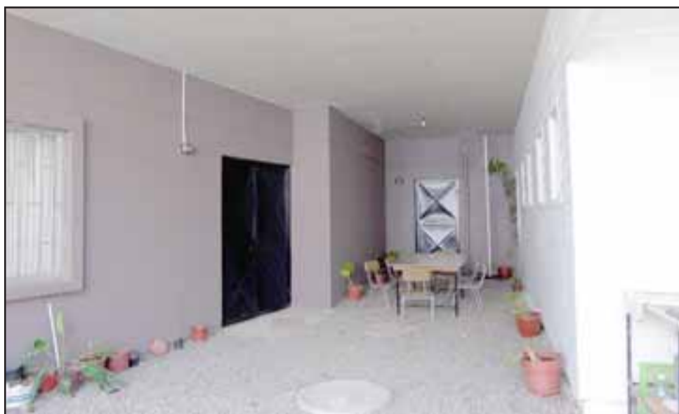
En la Unco Los Andes se mejoró el patio para el desarrollo de actividades comunitarias. En las sedes de Rinconada, Calle Larga y San Esteban, también se ejecutaron mejoras.

sostuvo que «esta iniciativa de Codelco ha sido muy satisfactoria para las cuatro comunas y, a la vez, para los vecinos quienes son dirigentes u otras agrupaciones que utilizan este lugar».