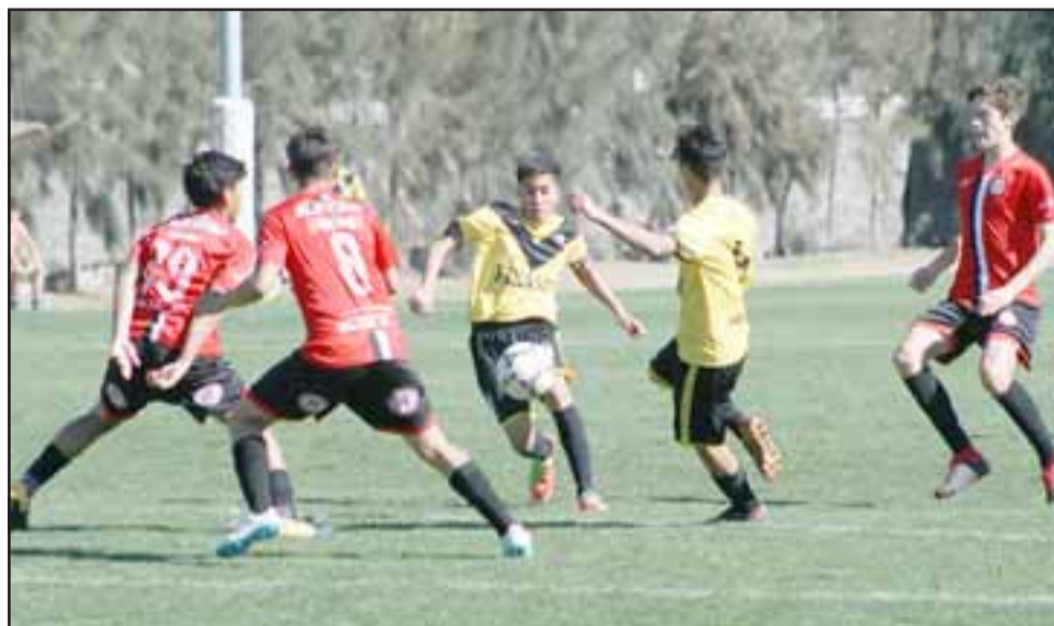
Los cadetes de Unión San Felipe fueron claramente superados por sus similares de Santiago Morning.

Durante la jornada anterior las series U15 y U16 no pudieron hacer pesar su condición de locales frente a los microbuseros, mientras que los juveniles (U17 y U19), debieron trasladarse hasta la comuna de Conchalí para desafiar a un ocasional rival que les hizo pasar