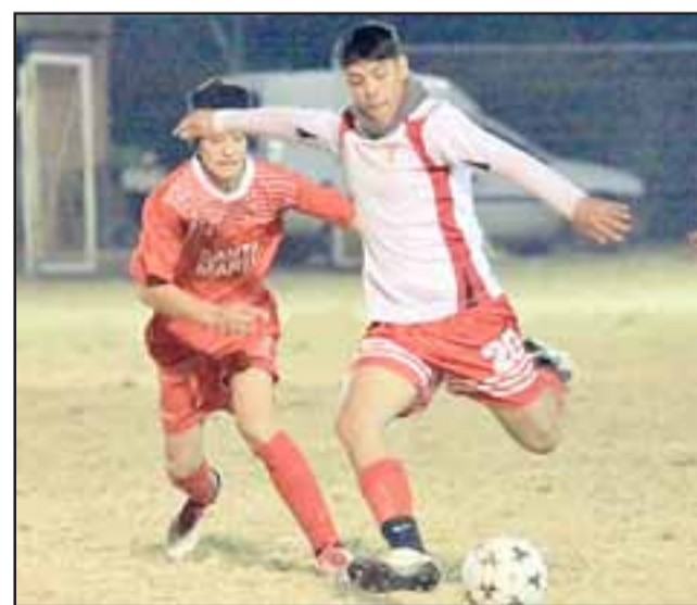
El fin de semana volvió a jugarse el torneo Regional de selecciones U17.

Catemu 1 – Rinconada 3; Calle Larga 9 – Llay Llay 0; Rural Llay Llay 1 – San Esteban 1; Santa María 0 – Panquehue 3; Los Andes 0 – San Felipe 2; Putaendo 2