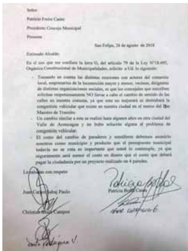
La carta firmada por los cinco ediles que piden no aplicar el plan maestro de gestión de tránsito.

cómo está colapsado el centro de la ciudad, ahora recuerden que la calle Merced es la única que está inscrita en el Diario Oficial de nuestro país como una calle de servicio, y hoy la vamos a dejar como nada, hoy día estamos poniendo en riesgo lo que es la infraestructura