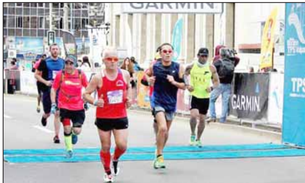
El fondista sanfelipeño recibió una invitación especial para correr en la próxima edición de la famosa TPS en Valparaíso.

El fondista está optimista para el 9 de septiembre, y descarta que sienta presión para ese día debido a que "el ser invitado especial me sube los bonos y me eleva el nivel, entonces no tengo presión; sí mucha motivación", culminó.