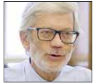
Juan Andrés Fontaine, ministro de Obras Públicas.

"En relación al Embalse Catemu, es importante señalar que como política para potenciar los distintos procesos de licitación, disminuir los riesgos asociados a estos y agilizar dichos procesos, hemos resuelto que las tra-