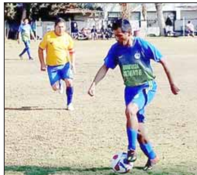
Tres fechas fueron suficientes para que la Liga Vecinal tuviera un líder exclusivo.

Unión Esfuerzo 0 – Andacollo 0; Tsunami 1 – Villa Los Álamos 0; Aconcagua 1 – Barcelona 0; Santos 2 – Resto del Mundo 1; Hernán Pérez Quijanes 3 – Unión Esperanza 2; Carlos Barrera 5 – Pedro Aguirre Cerda 0; Los Amigos 6 – Villa Argelia 2.