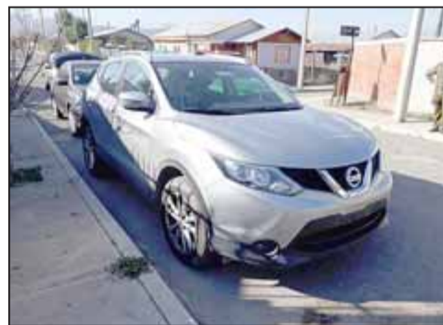
El vehículo fue periculado por personal de la SIP de Carabineros de San Felipe, tras ser abandonado sin sus placas patentes por los delincuentes en el sector Quebrada Herrera de San Felipe.

Asimismo durante la mañana de ayer miércoles, vecinos del sector Quebrada Herrera se contactaron con la autoridad comunal para informar que un vehículo de similares características se encontraba estacionado, sin sus placas patentes, en la vía pública en el sector