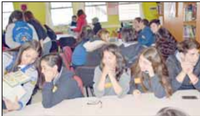
ESPEJO REVELADOR.- Dentro de esa caja cada niño pudo conocer la imagen de la persona más maravillosa del mundo.

'ME RÍO CONTIGO PERO NO DE TI'.- Ellos son los niños que ayer participaron activamente en este conversatorio sobre Bullying, Autoestima e Inclusión social.