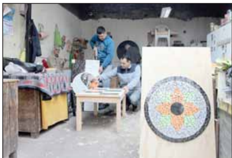
La iniciativa ha sido respaldada por el jefe del CCP, quien impulsó la conversión de la antigua central de alimentación en un nuevo taller de mosaicos.

En la actualidad se está habilitando el espacio y se espera que el taller comience a funcionar a fines del mes de octubre. Los reclusos que podrán inscribirse en esta temática serán quienes, además de contar con un plan de intervención individual, sean propuestos por el área laboral.