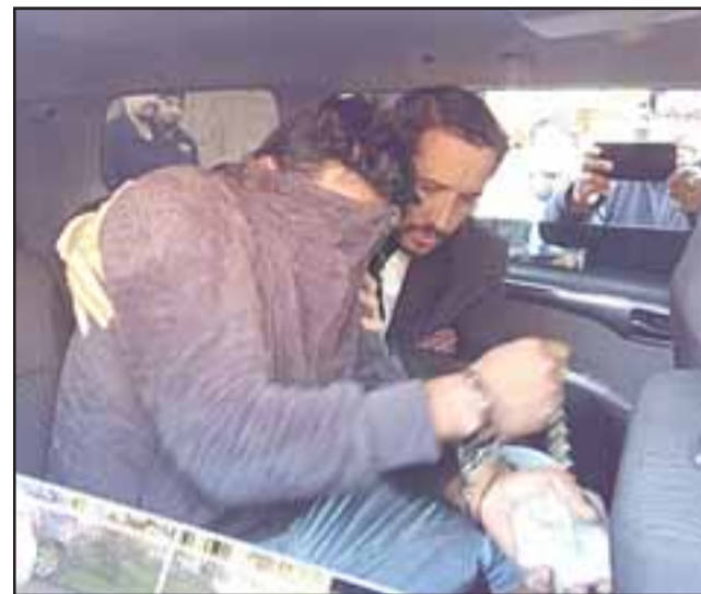
El imputado apodado 'El Melete' fue capturado por la Brigada de la Policía de Investigaciones de Los Andes.

El oficial policial detalló que tras obtener una orden judicial de entrada y registro a dos inmuebles, fue hallado el imputado, incautándose más de medio kilo de