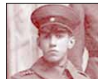
Padre San Alberto Hurtado realizando su servicio militar Regimiento Yungay, 1920.

En la actualidad, para ser parte de la Reserva, ya sea en el Ejército, en la Armada o en la Fuerza Aérea, es necesario inscribirse en la unidad militar, naval o aérea más cercana al domicilio. El número y adiestramiento de los reservistas de cada unidad dependerán de las necesidades que tenga cada institución. Los reservistas mantienen una especial vinculación con las instituciones de las Fuerzas Armadas, y entre ellos mantienen vivo el espíritu militar, camaradería y camaradería.