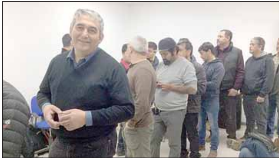
En forma unánime los trabajadores votaron por mantener la huelga.

Finalmente destacó que después de este rechazo de los trabajadores de Suplant, la empresa tiene cinco días para realizar una nueva oferta, la que deberá ser votada por la asamblea, mien-