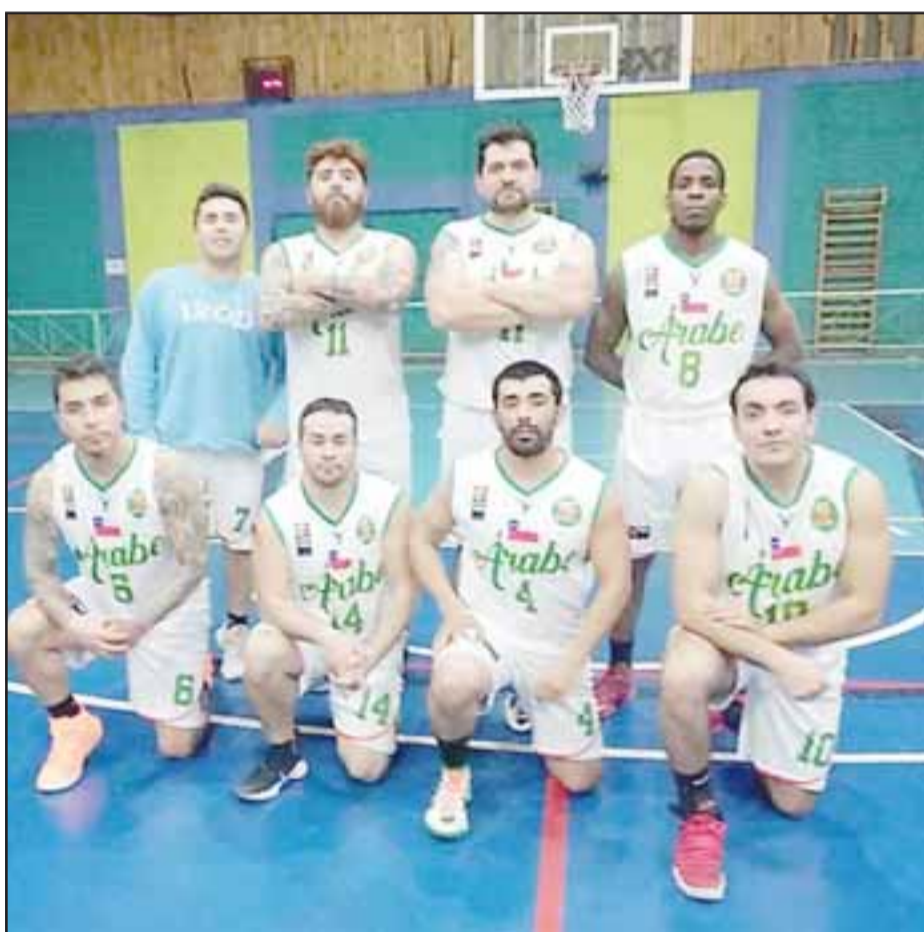
El quinteto del Árabe A aseguró el quinto lugar del torneo de Apertura de Abar.