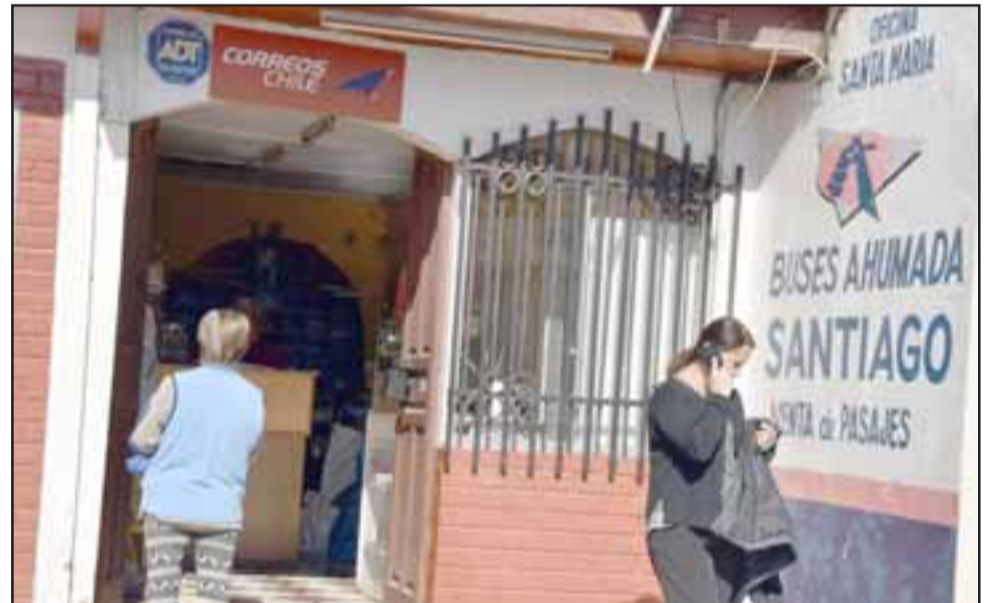
CASI UN DÍA NORMAL.- Pese a este nuevo robo, la sucursal abrió sus puertas y no interrumpió sus horarios de atención al público.