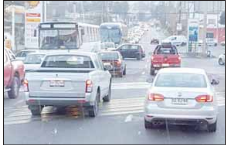
Así estaba el Puente El Rey ayer en la mañana (cedida).

A decir de los conductores, los puntos más críticos fueron Avenida Yungay con O'Higgins, O'Higgins con Maipú, Las Heras con Manso de Velasco, y la misma entrada del Puente El Rey, entre otros.