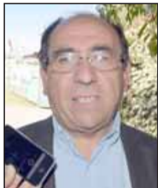
Claudio Rodríguez, gobernador de San Felipe.

da del Departamento Social y Adulto Mayor de Gobernación, Olga Cáceres : «Esta es la Final Provincial, el campeonato. La comuna de Tomé es la sede oficial del Campeonato, este evento tiene la particularidad de ser organizado por la institucionalidad pública en los niveles regionales (intendencias), provinciales (gubernaciones) y comunales (municipios), como estrategia de vinculación territorial del tema Adulto Mayor en nuestro país, sin embargo, las gobernaciones no disponemos de presupues-