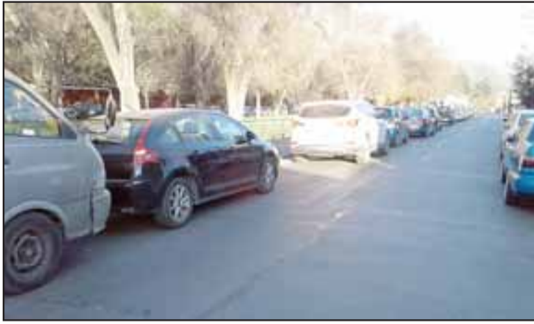
Gran cantidad de vehículos por avenida O'Higgins generando un gran taco para alcanzar la Avenida Maipú.