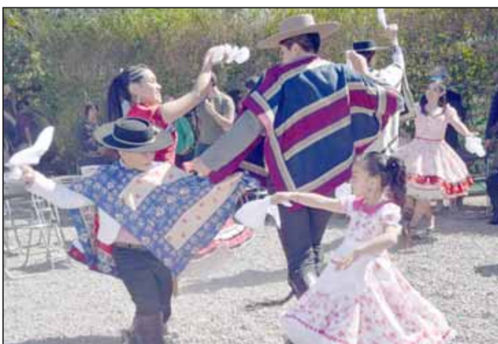
TAMBIÉN CUECA.- Los niños también presentaron su ofrenda folclórica durante el acto oficial.