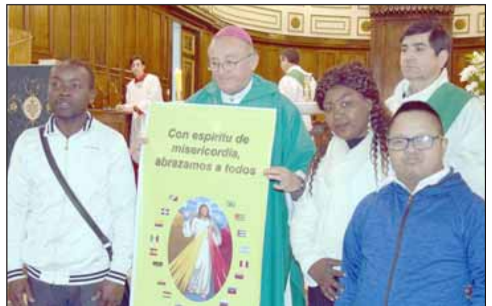
OBISPADO PRESENTE. - Es importante destacar que la celebración fue preparada por los integrantes de la pastoral de migrantes y motivada por ellos, quienes son de diferentes nacionalidades que viven en el Valle de Aconcagua.