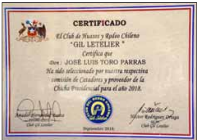
RECORD NACIONAL.- Este es el documento que recibió Toro este año, el que certifica la calidad de su producto y el uso que se dará al mismo.