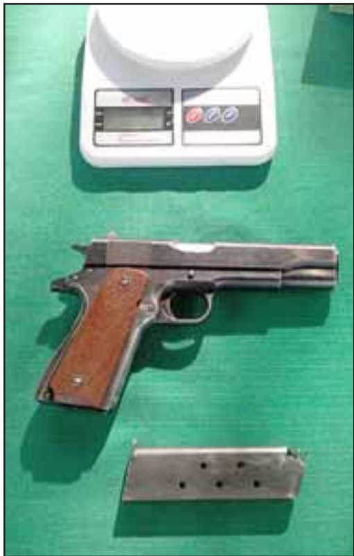
Además se incautó una pistola calibre 45 con sus respectivas municiones.