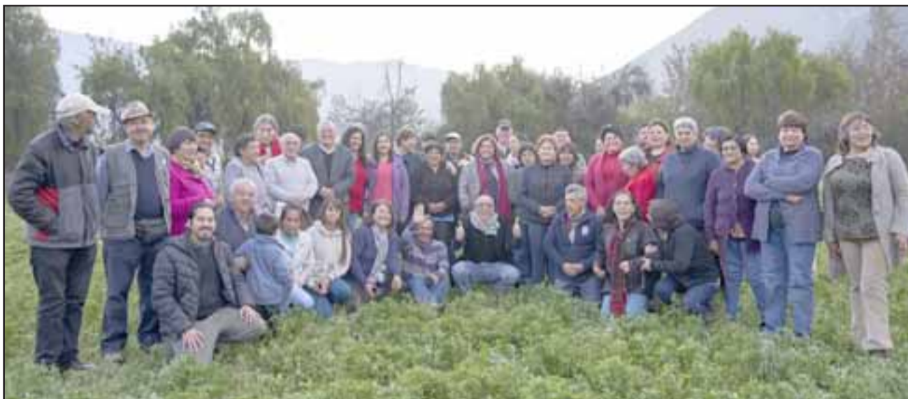
El municipio ya compró un terreno para seguir con el compromiso de generar espacios públicos en todo el territorio comunal, donde los vecinos pidieron que se construya una plaza en este lugar.

Por su parte, los vecinos agradecieron la instancia