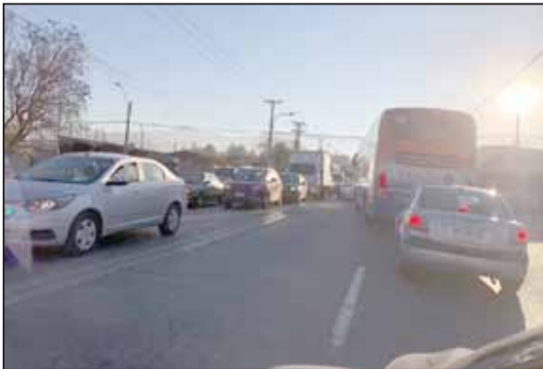
Gran congestión vehicular se apreciaba en la avenida Manso de Velasco ayer en la mañana (cedida).

Totalmente colapsado amaneció San Felipe la mañana de ayer lunes por el cierre del Puente Tres Esquinas el viernes en la tarde, debido a trabajos que realizará la concesionaria de la Autopista y que se extenderán hasta el 31 de octubre.