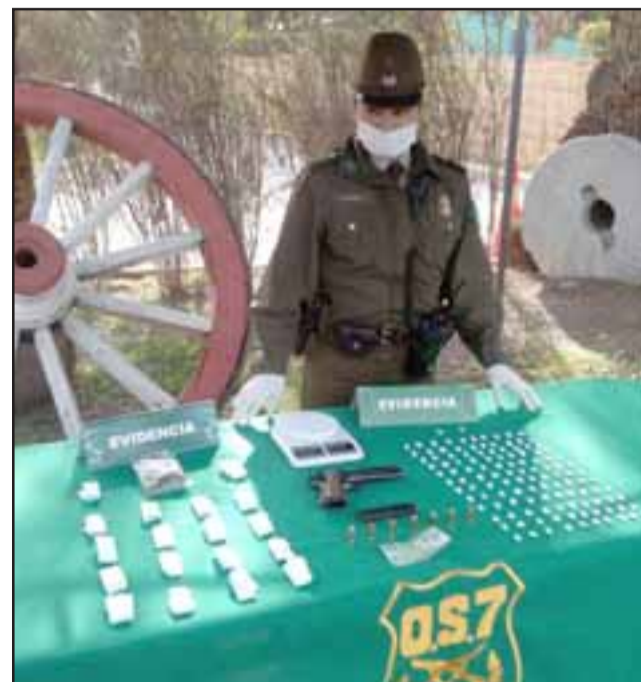
Personal del OS7 de Carabineros de San Felipe decomisó pasta base de cocaína y marihuana elaborada desde un domicilio de la Villa Juan Pablo II de San Felipe.