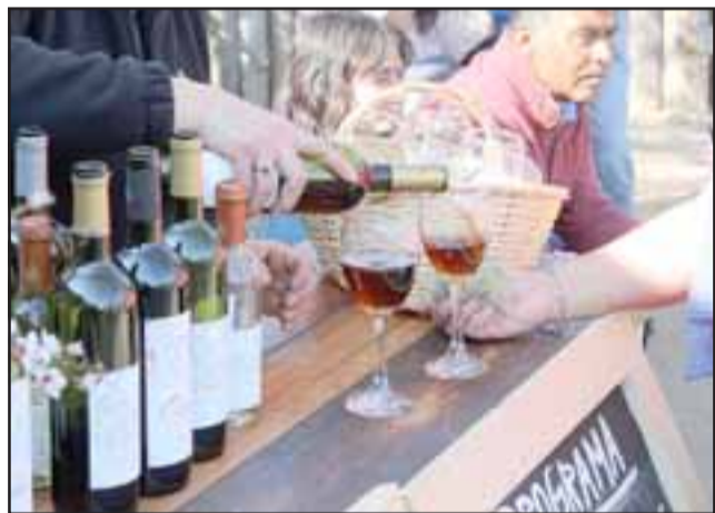
Los visitantes también pudieron probar los distintos vinos que se producen en la zona.

día como el Día Nacional del Vino fue firmado en la Viña Cousiño Macul y se logró gracias al impulso de