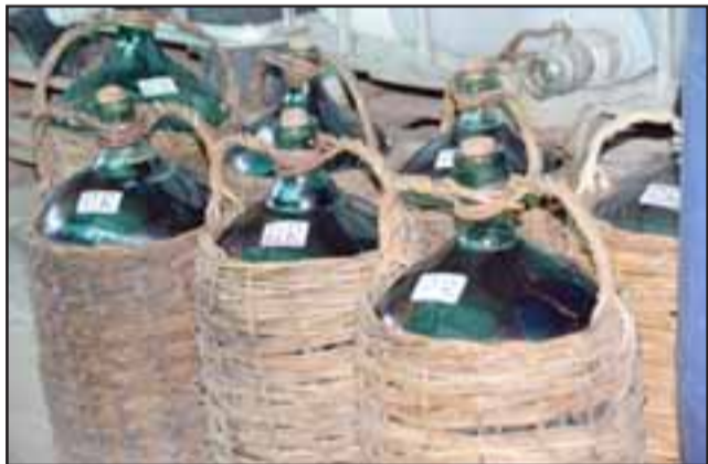
LA MEJOR CHICHA.- Estas son las garrafas que ayer viajaron a Santiago, llenas todas de la mejor chicha del País.