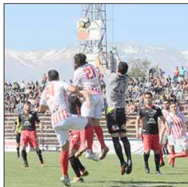
Otro duro enfrentamiento, tal como lo fue con Ñublense, espera este sábado a Unión San Felipe.