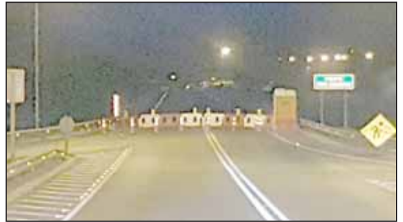
Para muchos una sorpresa el Puente cerrado ayer en la mañana. Esto será hasta el 31 de octubre.