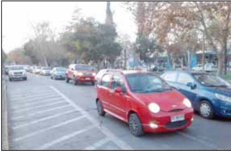
Gran cantidad de vehículos bajando por la Avenida O'Higgins, con vehículos estacionados que dificultaron el difícil tránsito.