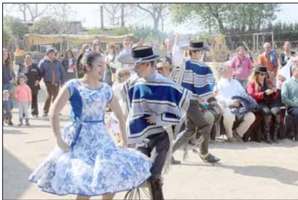
En la oportunidad se contó con la participación de varios grupos folclóricos de Panquehue, que al son de nuestra música chilena presentaron varios cuadros criollos.

El Día Nacional del Vino se celebra un 4 de septiembre, para rendir homenaje al vino de Chile y así reconocer su importancia. El decreto que designa este