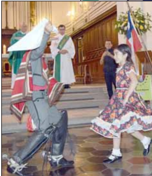
LA CUECA PRESENTE. - Estos pequeñitos también bailaron su pie de cueca frente a la Virgen del Carmen este domingo.