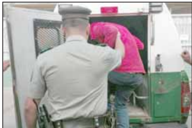
Los detenidos fueron derivados hasta Tribunales para ser formalizados por el delito de receptación.