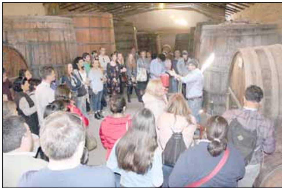
Con visitas guiadas a las bodegas de la Viña Sánchez se contó la historia de uno de los viñateros más antiguos del valle de Aconcagua.