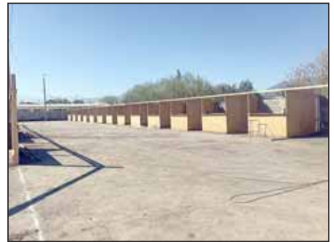
En plena construcción los puestos que se están preparando para las fiestas patrias en Rinconada.