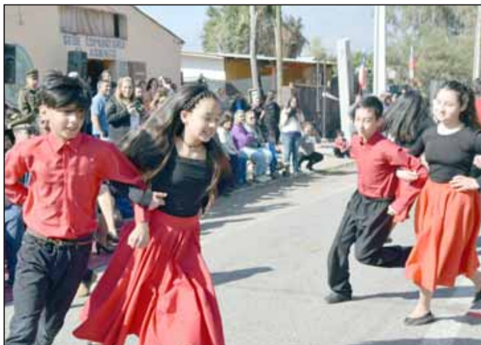
TREMENDA PRESENTACIÓN.- Estos chicos se robaron el show con su Cacharpaya, bailaron, alegraron al público y gustaron también.