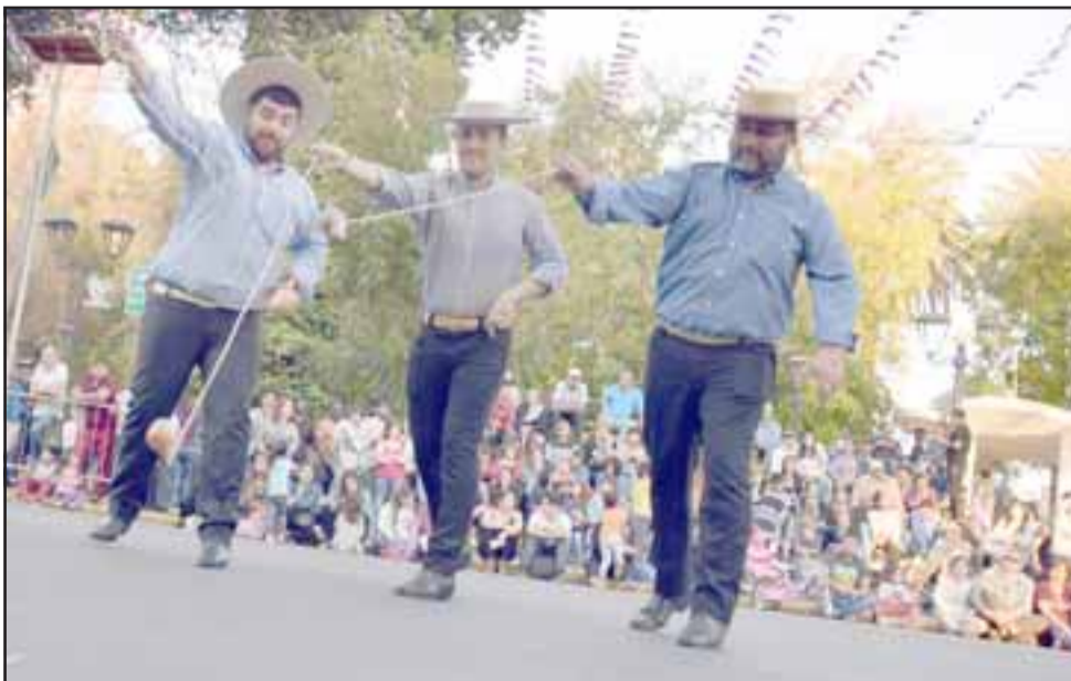
NIÑOS OTRA VEZ. - Los Roblerinos de Linares no sólo llegaron a cantar, también hicieron una buena exposición de Trompos en plena vía pública.