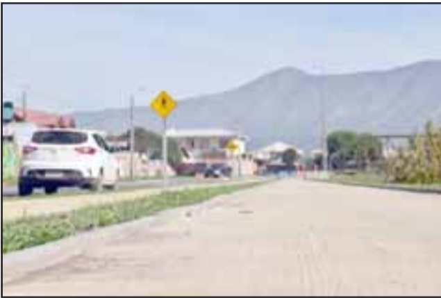
El proyecto de pavimentación contempló la mejora de la calle, la creación de calzadas más amplias para los peatones y una ciclovia.