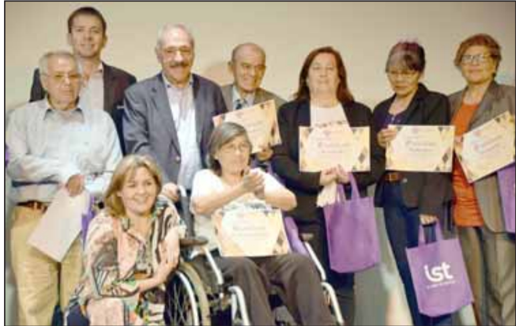
CIERRE 2018.- Fueron 60 los dirigentes certificados este sábado en el Teatro Municipal de nuestra comuna.