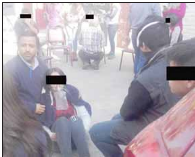
Alumnos debieron ser evacuados del Liceo Panquehue durante la mañana de este viernes, tras la nube tóxica que afectó a Panquehue.