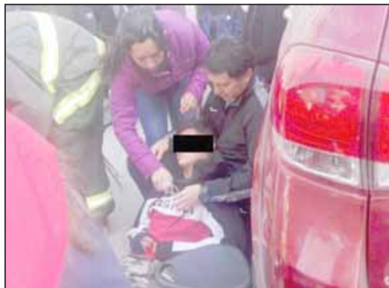
En su mayoría adolescentes presentaban síntomas de intoxicación, debiendo ser derivados hasta distintos centros asistenciales.

dema de la PDI, la que ha iniciado el proceso investigativo para llegar a determinar la fuente, las causas, los responsables para entonces poder determinar las distintas responsabilidades que pudieran caberle a esas personas. Por lo pronto también tanto la Municipalidad y la Gobernación vamos a presentar una querrela contra quienes resulten responsables, pues lo que principalmente nos preocupa es la seguridad de las personas, la tranquilidad y en eso hemos puesto nuestro foco de atención”, enfatizó el Gobernador de San Felipe.