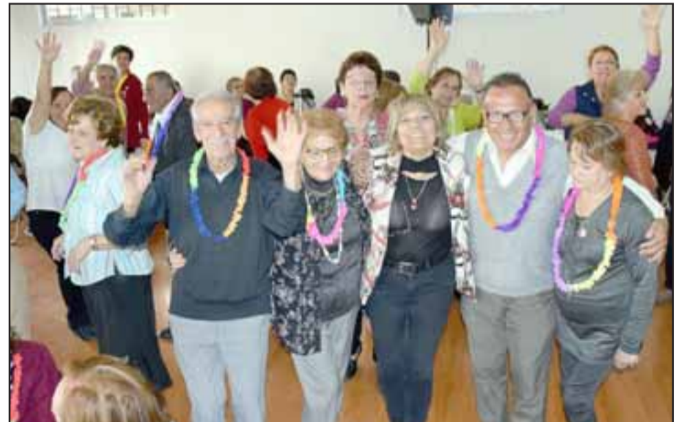
ESTOS LOLITOS. - En el otro extremo de la vida, puntualmente en el Centro Adulto Mayor Ayecán, estos vecinos celebraron también su tradicional 'Pasamos Agosto'.