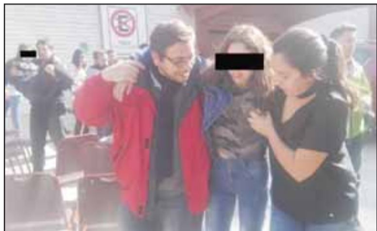
Pacientes fueron derivados hasta los hospitales de Llay Llay, San Felipe, Cefsam de Panquehue e IST.