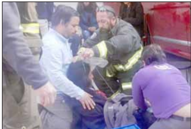
Al menos dos profesores y administrativos presentaron síntomas de intoxicación debiendo ser asistidos por paramédicos.

“Durante la jornada se registraron 65 personas que se vieron afectadas con síntomas de intoxicación, ya todo el resto ha sido dado de alta en los distintos centros. Todavía no hemos determinararlo con claridad sobre el origen, lo que sí puedo señalar en particular es que está aquí la Bi-