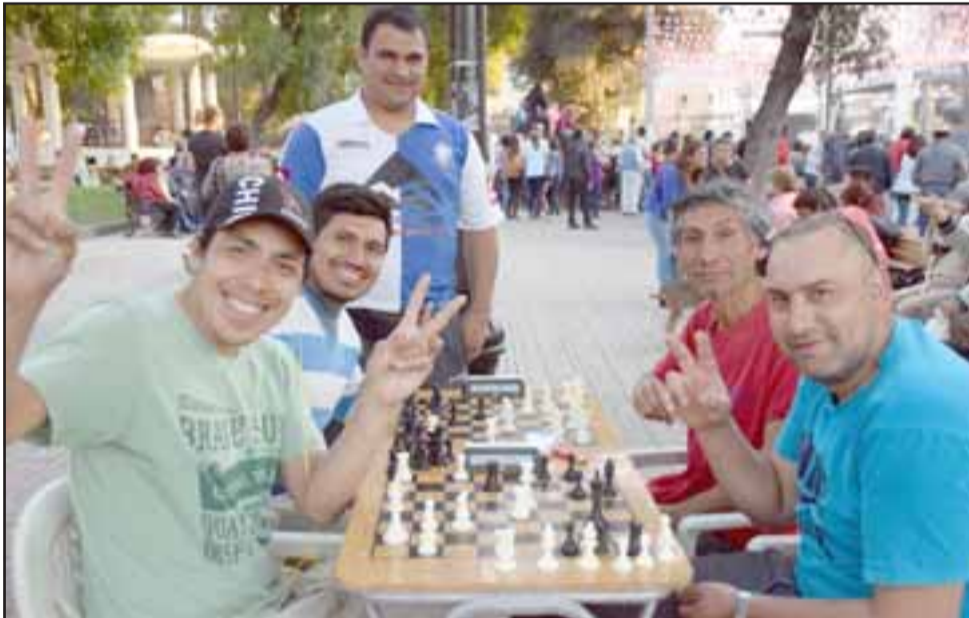
AJEDREZ TAMBIÉN. - También hubo gran movimiento en las mesas de ajedrez que se instalaron en la Plaza de Armas, varios hicieron fila para esperar su turno y participar.