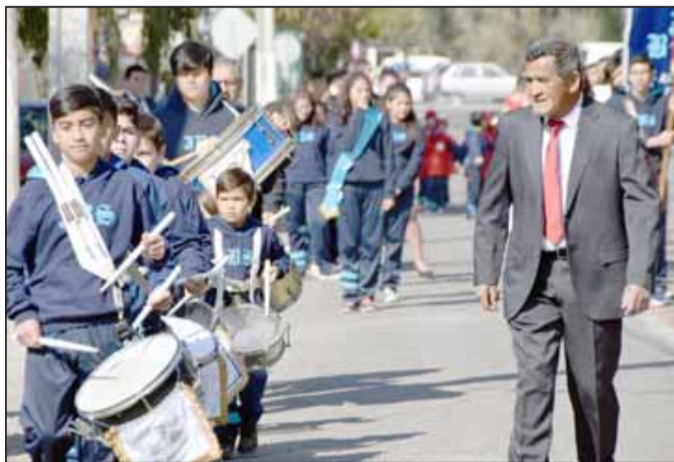
CON BANDA DE GUERRA.- Aquí tenemos la flamante Banda de Guerra escolar de El Asiento, niños y jóvenes artistas que ya se hacen sentir en la comunidad.