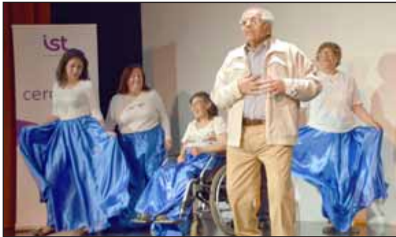
TAMBIÉN ACTORES.- También humo humoradas musicales a cargo del tercer curso de la Escuela del Dirigente, improvisados actores que hicieron de las suyas.