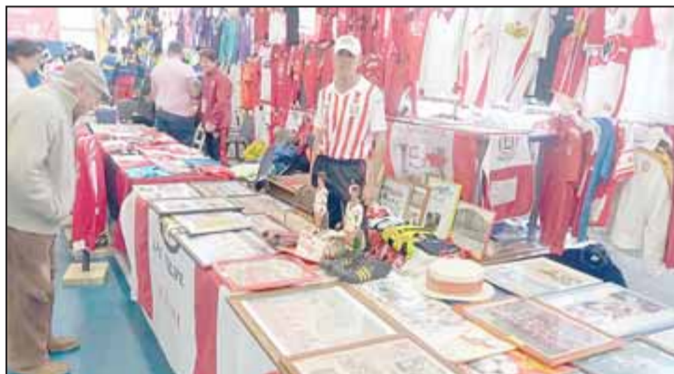
Acá lo vemos durante el encuentro junto a su colección de Unión San Felipe.