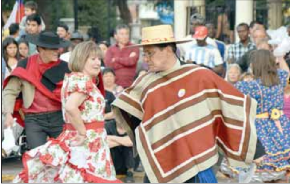
Y SE ARMÓ LA FIESTA. - Experimentados folcloristas de nuestra comuna se unieron a los demás en este primer banquete folclórico.