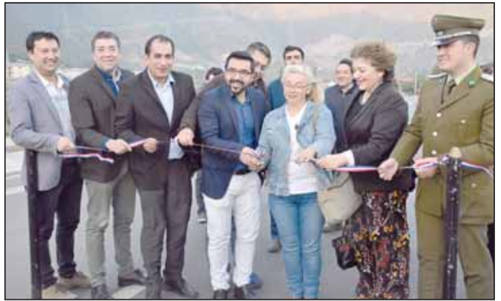
Esta iniciativa fue financiada por el Gobierno Regional de Valparaíso a través del Fondo Nacional de Desarrollo Regional (FNDR) por un monto cercano a los 380 millones de pesos.

Un proyecto que fue diseñado y postulado a través de la dirección de Secplac de Llay Llay y posteriormente fiscalizado por la Dirección de Obras Municipales durante el periodo en el que se desarrollaron los trabajos de pavimentación, el que incluyó veredas reforzadas, badén, zarpas, soleras tipo A, ciclopista, solerillas, cámaras de inspección, sumidero tipo Serviu y obras de evacuación de aguas lluvias,