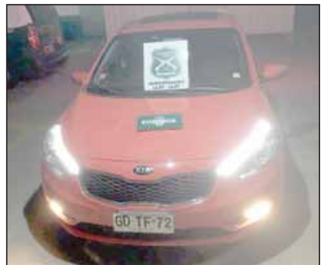
Carabineros de la Subcomisaría de Llay Llay recuperó el vehículo sustraído por el hijo de la denunciante en horas de la tarde noche del pasado martes.