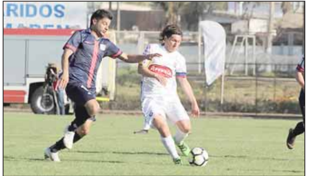
Ante un opaco pero efectivo Melipilla el Uní Uní volvió a mostrar los mismos ripsios de actuaciones anteriores.

La tarde del sábado la propuesta albirroja no fue tan distinta, aunque tuvo matices a raíz que por largos pasajes del primer lapso llevó el ritmo del juego, eso si sin la más mínima cuota de profundidad, cosa que se explica en que la zona media del campo de juego fue habitada o cubierta por tres volantes centrales (Pio, Levipán y Collao), los que si