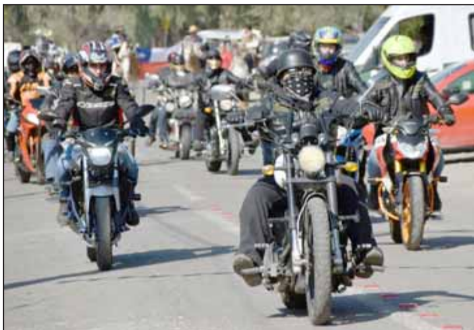
DRAGONS CHOPPER.- Ellos nunca faltan, son los motoqueros regalones con esta comunidad, siempre presente y siempre imponentes.