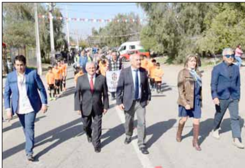
POR VEZ PRIMERA.- Por primera vez el Concejo Municipal de San Felipe desfiló en esta comunidad, un verdadero espaldarazo para la gestión de la junta vecinal de esa comunidad.