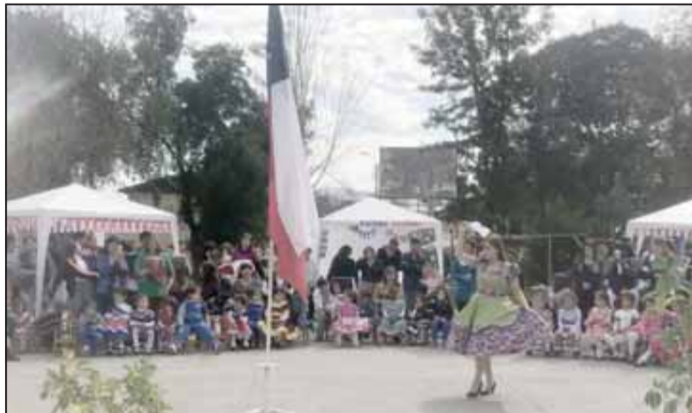
Recordando nuestras tradiciones, la comunidad educativa del jardín infantil Los Pingüinitos realizó la celebración de Fiestas Patrias.