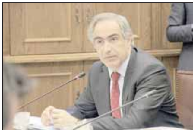
El senador Francisco Chahuán planteó al Ministro de Agricultura decretar zona de emergencia agrícola en el Valle del Aconcagua.

El parlamentario se comunicó con el Ministro Walker y le solicitó formalmente decretar zona de emergencia agrícola para todo el Valle del Aconcagua: "La escasez hídrica se ha tornado demasiado compleja, principalmente