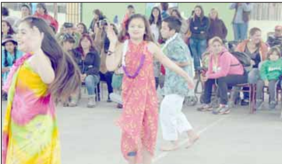
Aquí tenemos también a estas niñas, quienes lograron con delicadeza cosechar muchos aplausos de los apoderados.