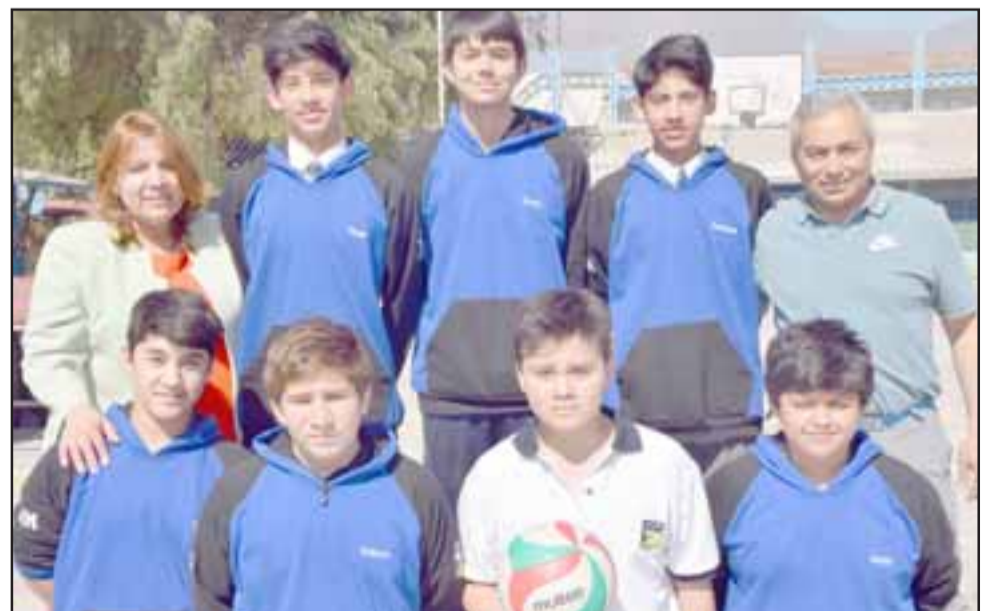
Aquí tenemos a los chicos del Vóley U14 masculino, quienes nos representarán en el Nacional en Valparaíso.