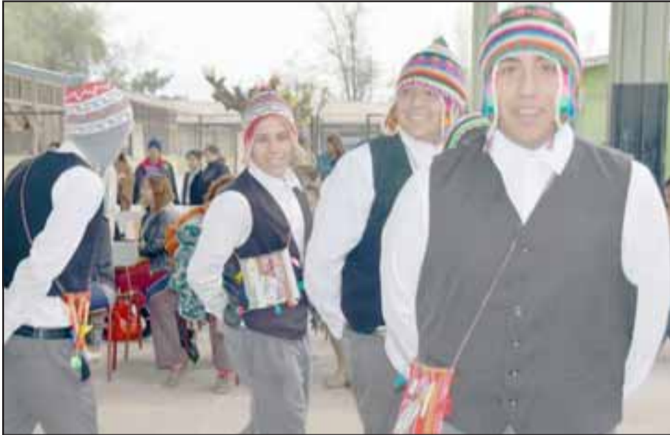
Estos jóvenes hicieron de las suyas bailando cacharpaya, debieron ensayar durante varios meses.

ofrecer a los alumnos una amplia lista de talleres y proyectos tanto dentro como fuera del liceo.