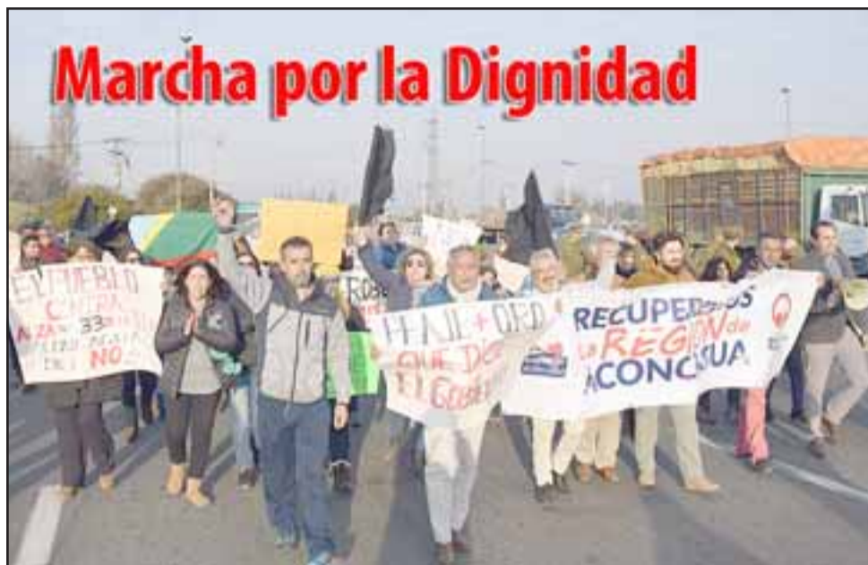
Las marchas por la dignidad realizadas en agosto surtieron un efecto solo parcial, ya que la solución planteada por las autoridades resultó totalmente confusa, no resuelve nada en lo inmediato y deja la duda sobre futuros nuevos cobros a lo largo de la ruta a la costa.

otros problemas que tiene aquí la provincia y que son relevantes, por ejemplo buscamos una alternativa con todo este tema del peaje por la ruta cinco antigua, se dice que efectivamente era una alternativa a la ruta cinco actual que todos conocemos, y la verdad que no lo es porque está en muy mal