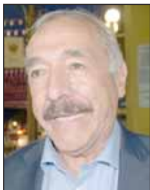
Patricio Freire , alcalde de San Felipe.