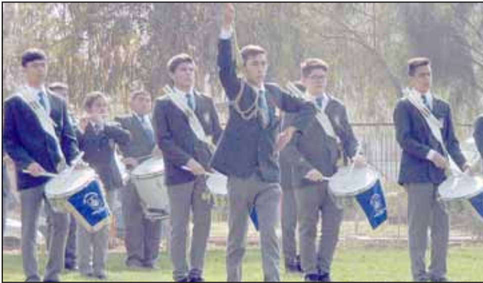
LOS MEJORES.- En la Escuela Industrial de San Felipe, se desarrolló el pasado sábado el 2º Concurso interregional de bandas 2018.

La logística la aseguró el plantel industrialino, con el compromiso alegre de sus estudiantes y apoderados, quienes fueron excelentes anfitriones para todas las visitas. Importante también fue el apoyo desinteresado de la Cruz Roja, pues no faltaron los pequeños que sucumbieron ante el nerviosismo y el cansancio que les significó la performance.