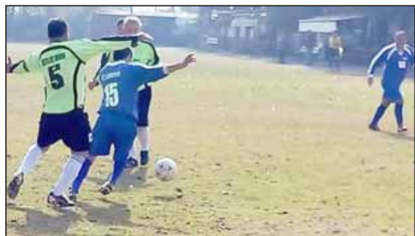
Una jornada con una sorpresa mayor fue la que se vivió en el Clausura de la Liga Vecinal.

Los Amigos 0 – Tsunami 0; Andacollo 1 – Hernán Pérez Quijanes 0; Santos 2 – Barcelona 0; Villa Argelia 2 – Aconcagua 0; Pedro Aguirre Cerda 2 – Unión Esperanza 0; Unión Esfuerzo 4 – Resto del Mundo 1; Villa Los Álamos 4 – Carlos Barrera 1.