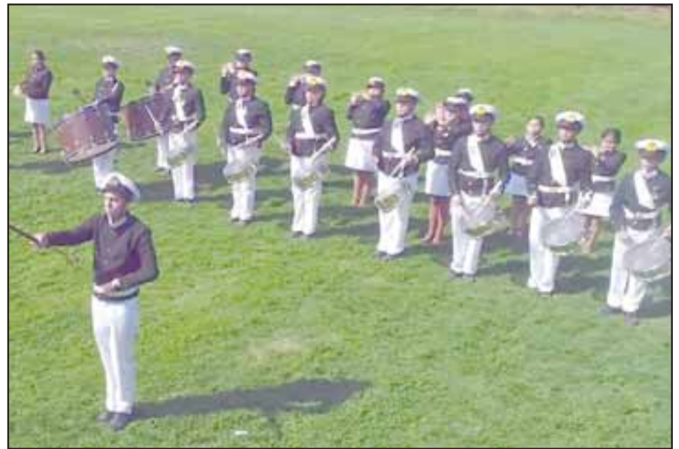
BANDA INDUSTRIAL.- Aquí tenemos la Banda anfitriona, haciendo de las suyas en plena competencia.