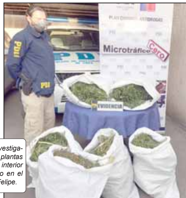
Personal de la Policía de Investigaciones incautó un total de 10 plantas de cannabis sativa desde el interior del inmueble del sentenciado en el sector de Bucalemu en San Felipe.

Tribunal Oral en Lo Penal de San Felipe: