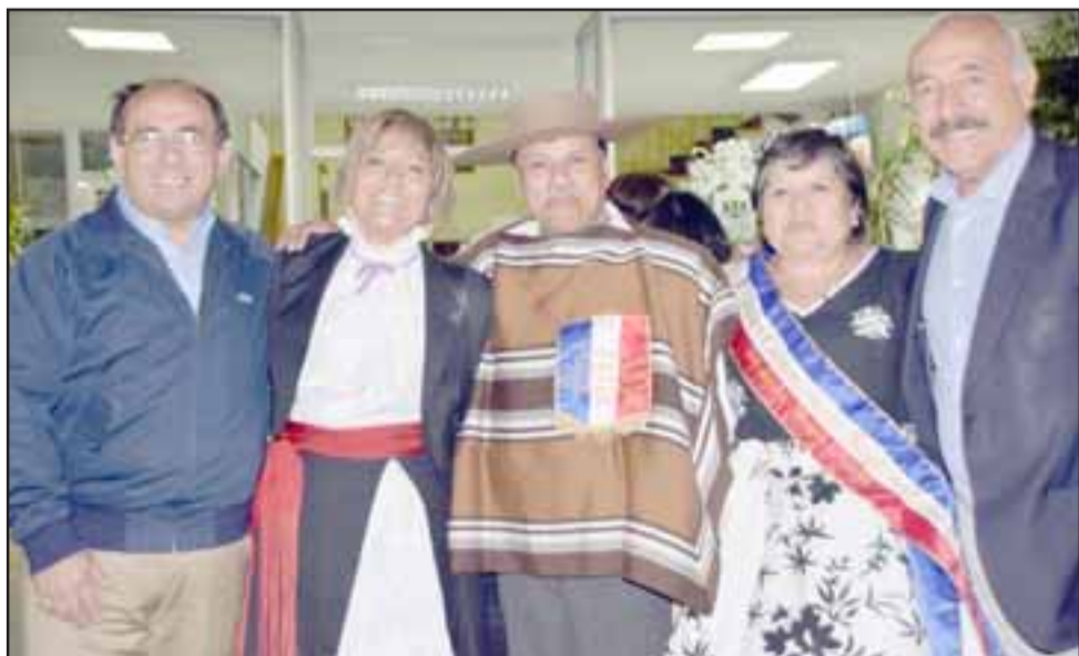
CAMPEONES DE LUJO.- Ellos son los campeones de cueca que estarán en el Nacional por la V Región los días 29 y 30 de septiembre de este año en la ciudad de Tomé.