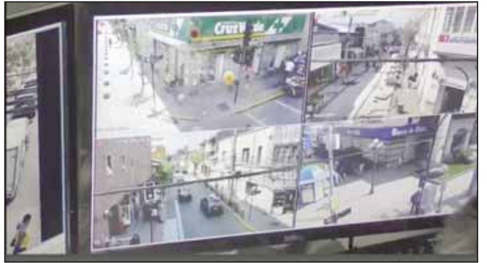
Las cámaras de vigilancia demostraron su efectividad con ocasión del intento de reventar el cajero automático del Servi Estado.

Añadió que el resultado, hasta ahora, es positivo; «sumado a una capacitación que se realizó a los funcionarios que las operan con el fin que aprovechen