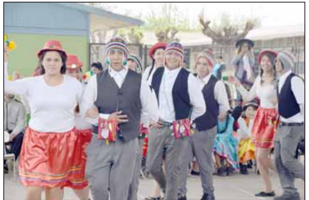
Así fue el cierre de la actividad en el Liceo de San Felipe, los jóvenes con mucha gracias se despidieron del público familiar.