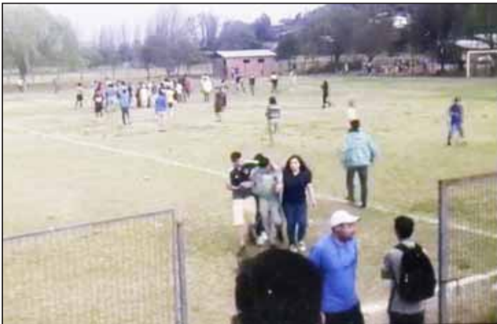
Integrantes de los clubes Húsares y Boca protagonizaron bochornosos incidentes que les costaron seis meses de suspensión; misma suerte que corrió Juventud Santa María.

Los vergonzosos hechos de violencia en el que algunos de sus integrantes se vieron envueltos durante las últimas semanas, provocaron que la Asociación de Fútbol de Santa María, con el aval de Arfa Quinta Región, determinara aplicar una sanción de seis meses de suspensión a los clubes: Juventud Santa María, Húsares y Boca Juniors.