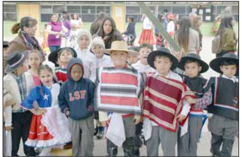
Los más pequeñitos con ansias esperaron su turno de bailar, también en este centro educativo los niños haitianos ya aprendieron a bailar nuestra Danza Nacional.