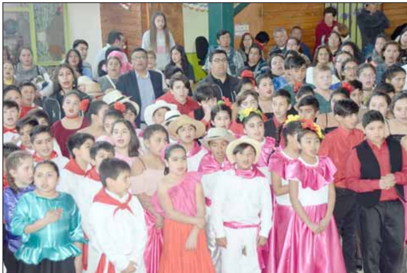
ELLOS SON LOS DUEÑOS.- Ellos son parte de los niños que a partir de este lunes darán uso al nuevo patio techado en su escuela.

pios y ellos definen en qué desarrollarse, y yo me alegro de que el alcalde Freire hiciera eco de una solicitud que le hice en su momento, de poder techar los patios de colegios de nuestra comuna, como lo hicimos en Catemu y ahora lo logramos con esta modalidad. El precio aproximado de cada techumbre es de $65 millones cada uno, pues las canchas tienen casi la misma dimensión, ya techamos varios colegios y faltan otros», dijo el Core Reyes a Diario El Trabajo .