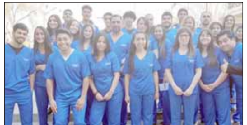
Kinesiología, con 31 estudiantes, la carrera más numerosa y con participación masculina y femenina, posan para El Trabajo.

sin dudas creemos que lo lograremos, siempre pensando en conformar una mejor institución para nuestros estudiantes, sus familias y todos quienes