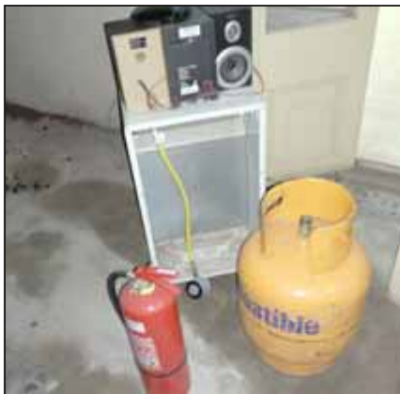
Carabineros encontró estas especies apiladas por el sujeto que fue detenido en el lugar de los hechos en calle Traslaviña N° 172 de San Felipe.