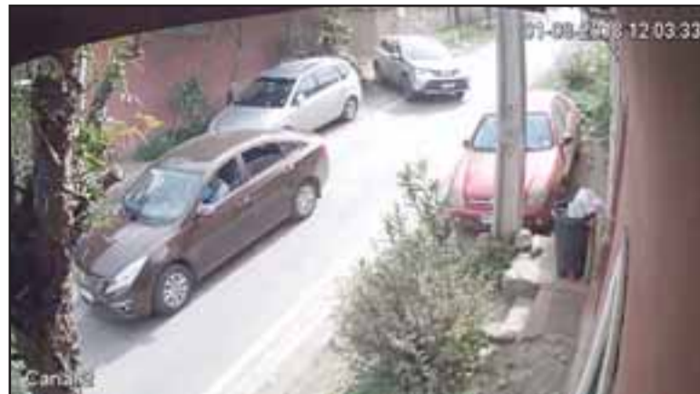
El vehículo al costado izquierdo utilizado por los antisociales luego de cometer el robo el pasado 1 de agosto de este año en calle Brasil de Putaendo.

Cabe señalar que Carabineros continúa con las diligencias