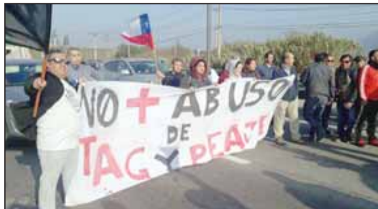
La gente colgando lienzos con leyendas alusivas a la manifestación.

do lo mismo o más para movilizarse dentro de la región.