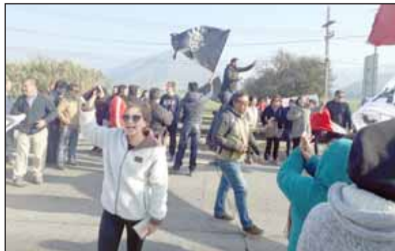
Las personas manifestando durante la tarde del viernes.