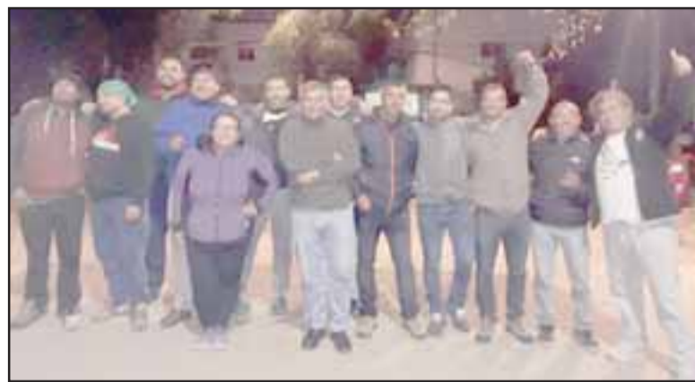
Acá están los que se han denominado los guerreros integrantes del Movimiento Social en Defensa de Llay Llay y de No + Abuso de Tag y Peajes.

- Sí, nosotros vamos a seguir movilizados, este movimiento no va a parar y no va a ser solamente por el peaje, nosotros estamos cansados de este abuso que tiene el Estado con respecto a los ciudadanos comunes, ya que las concesionarias tienen que terminar sus contratos ahora y ya sabemos que van a defender los contratos de concesión. En sesenta días más se baja el peaje, pero nos van a colocar pórticos, somos los que más vamos a sufrir, bajaron un peaje para colocar más pórticos y al final la gente va a estar pagan-