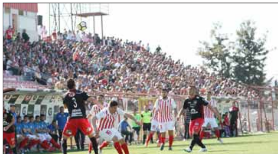
La idea es que este domingo lleguen como mínimo 1500 espectadores al coloso de la Avenida Maipú. La imagen corresponde al pleito con Ñublense donde llegaron más de 2.000.