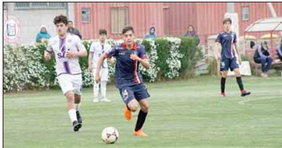
Tres triunfos y un empate fue el botín que obtuvieron las series cadetes del Uní Uní ante San Antonio.