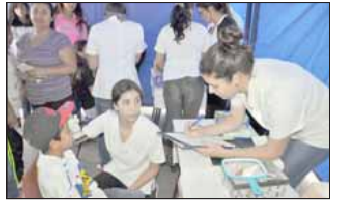
OPERATIVO SOCIAL.- Mascotas, niños, jóvenes, adultos y abuelitos tendrán su atención gratuita este sábado 29 de septiembre en la Juan Pablo II. (Referencial)