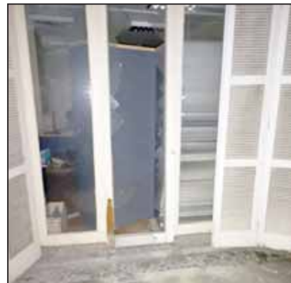
El ladrón habría destruido este ventanal para acceder a las dependencias de la Corporación de Asistencia Judicial de San Felipe.