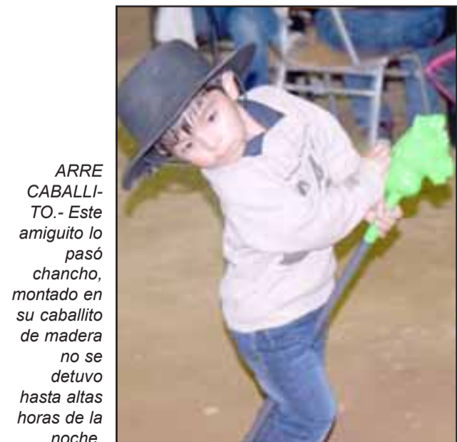
ARRE CABALLITO.- Este amiguito lo pasó chanco, montado en su caballito de madera no se detuvo hasta altas horas de la noche.