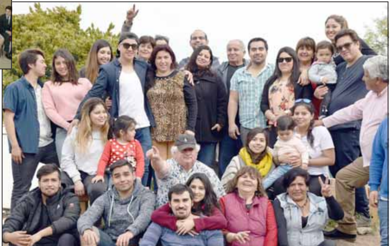
FIESTAS Y ASADOS.- Otros, en El Asiento, también aprovecharon estas fiestas para reencontrarse una vez más.