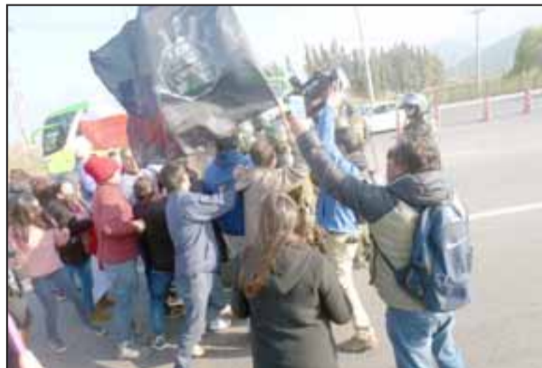
Los prensa nacional registró el enfrentamiento con Carabineros.