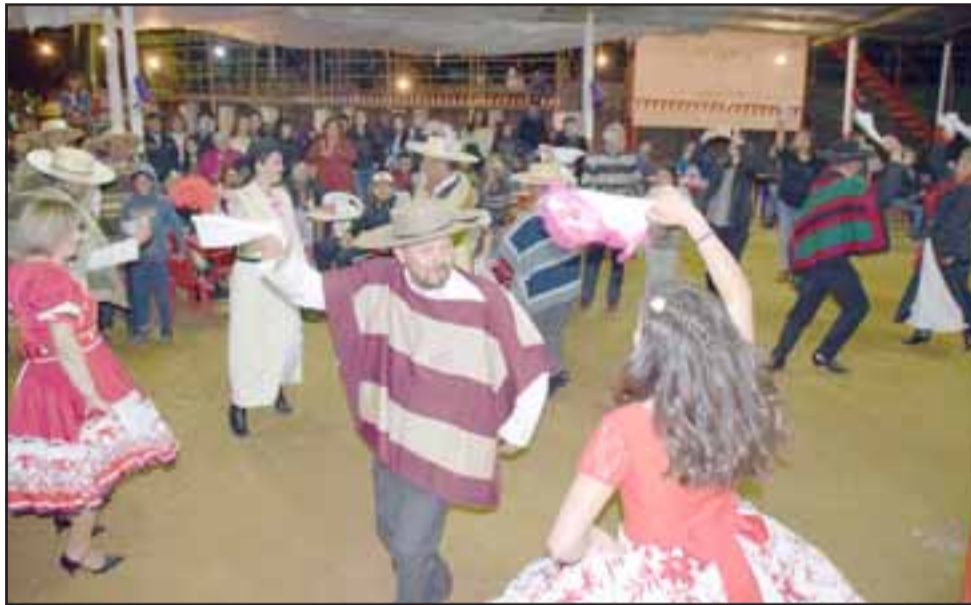
TREMENDO CARNAVAL.- Intensa fue la jornada en Bellavista, lugar en donde se concentró la acción en estas Fiestas Patrias, ya que el desfile principal del 18 fue cancelado a raíz del mal clima.