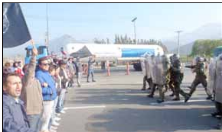
Los manifestantes frente a frente con Carabineros.