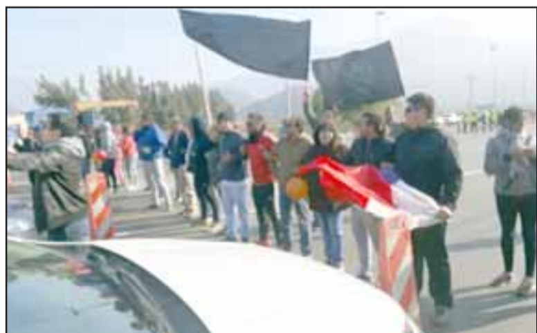
Las personas en uno de los cortes de tránsito que realizaban cada cinco minutos.