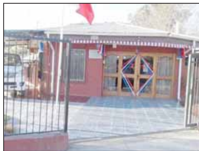
Frontis de la Oficina del APR Algarrobal, lugar del asalto.

Se realizó la denuncia ante Carabineros por este hecho que es primera vez que les sucede algo así.