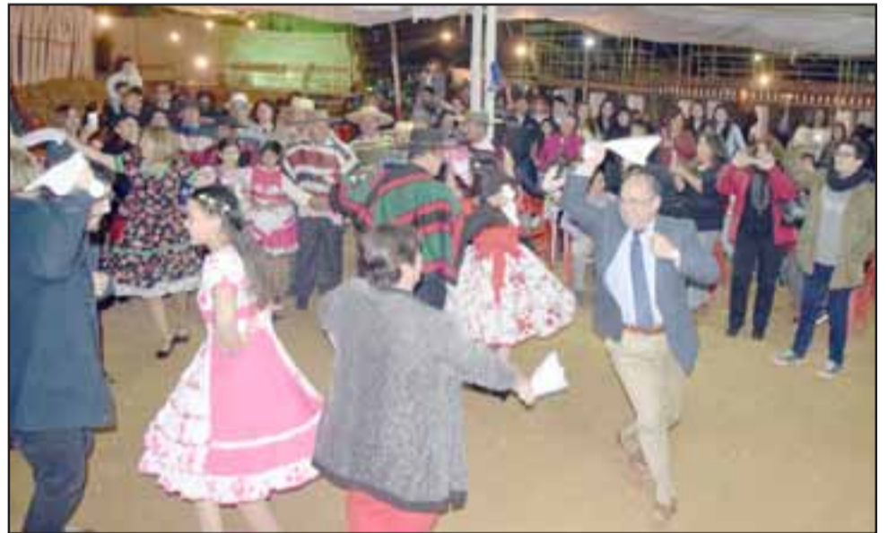
NADIE SE RESISTIÓ.- Hasta el gobernador Claudio Rodríguez subió a la gran ola del Folklore nacional para bailar su pie de cueca en esta Ramada oficial.