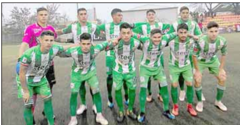
Como visitante el cuadro Albiverde volvió al triunfo y recuperó la ilusión de llegar a postemporada.

Este domingo 23 de septiembre y cuando ya las festividades patrias sean solo un lindo recuerdo, Trasandino recibirá en el Regional de Los Andes al Real San Joaquín, un equipo que en papel aparece como perfectamente ganable, por lo que, de no suceder ninguna sorpresa, es muy probable que 'El Cóndor' andino siga tomando altura.