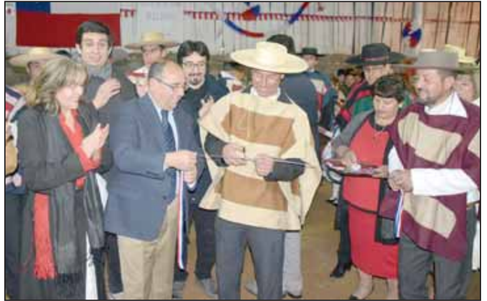
Así arrancaron.- Este es el momento en que la Ramada Oficial de las Fiestas Patrias de San Felipe fue inaugurada en la medialuna del Club de Huasos de Bellavista.