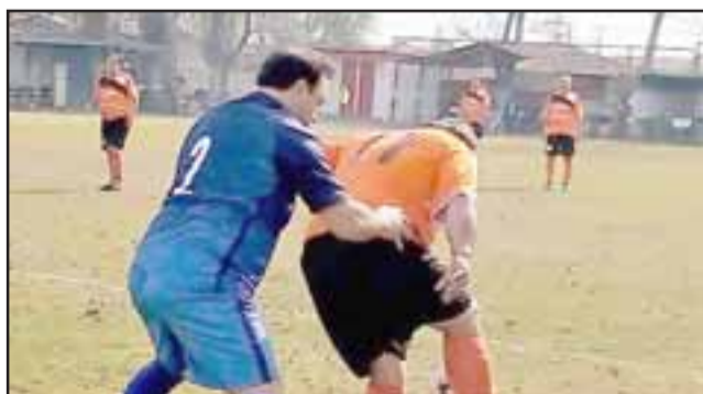
Este domingo se jugará la sexta fecha del Clausura de la Liga Vecinal.

Programación fecha 6 a 9:30 Resto del Mundo – Carlos Barrera; 11:00 Aconcagua – Santos; 12:15 Villa Los Álamos – Hernán Pérez Quijanes; 13:50 Villa Argelia – Unión Esperanza; 15:10 Andacollo – Pedro Aguirre Cerda; 16:30 Los Amigos – Unión Esfuerzo; 17:40 Barcelona – Tsunami.