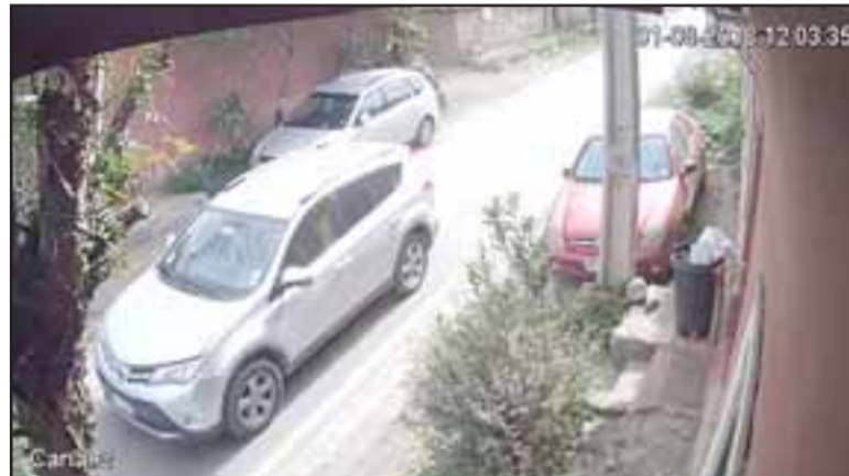
Se aprecia a uno de los sujetos conduciendo el automóvil de color gris de propiedad de los dueños de la vivienda afectada.

para establecer la participación violento asalto a mano armada de los otros involucrados en este Pablo Salinas Saldías