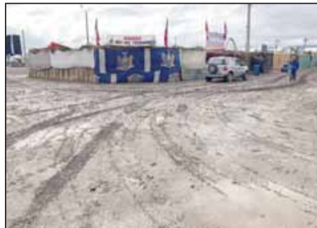
Un gran barrial se formó con los 10 milímetros de lluvia que habían caído hasta el martes 18 de septiembre, lo que obligó a postergar las celebraciones hasta este fin de semana.

Colegio Santa María de Aconcagua de la Comuna de Santa María, Provincia de San Felipe