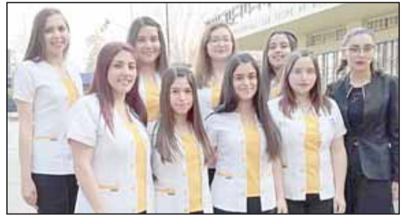
Las alumnas de Fonoaudiología, ocho en total, vistiendo sus uniformes clínicos.

“Nuestra naturaleza está dada por ser un factor de movilidad social, no sólo con los programas de pregrado, si no también con los de continuidad de estudios. Hoy estamos enfocados en lograr la acreditación institucional y