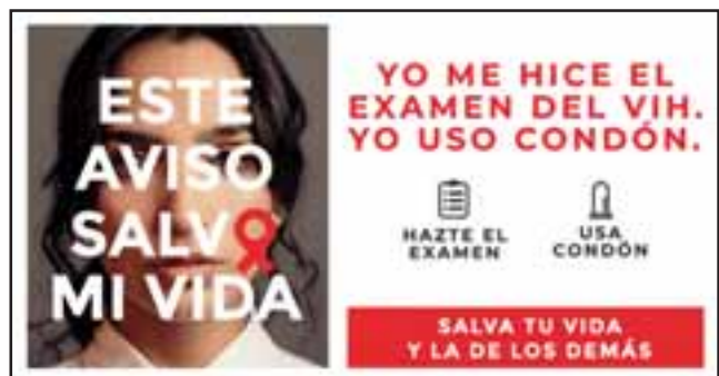
Algunos de los afiches de la campaña 2018, que llama a practicarse el examen.

Los 490 casos pesquisados hasta el momento corresponden al 2017, pues se está a la espera del informe final del ISP correspondiente al 2018.