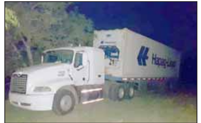
El camión fue robado por al menos seis antisociales armados en la comuna de Maipú, siendo hallado gracias al GPS en la comuna de Santa María.

dos otros dos sujetos de iniciales M.T.O. domiciliado en la comuna de Los Andes, y F.A. domiciliado en la comuna de Santa María.