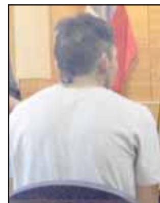
El violento delincuente protagonizó al menos tres asaltos a mano armada en un par de horas mientras se desplazaba por la Avenida San Rafael.

El sujeto mantiene en carpeta algunos anteceden-