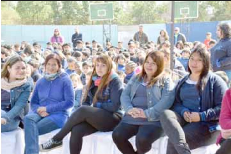
MUY COMPROMETIDAS.- Ellas son parte del gran equipo educativo que mantiene en funcionamiento todo el cuerpo docente de la escuela, al fondo, los regalones de casa.