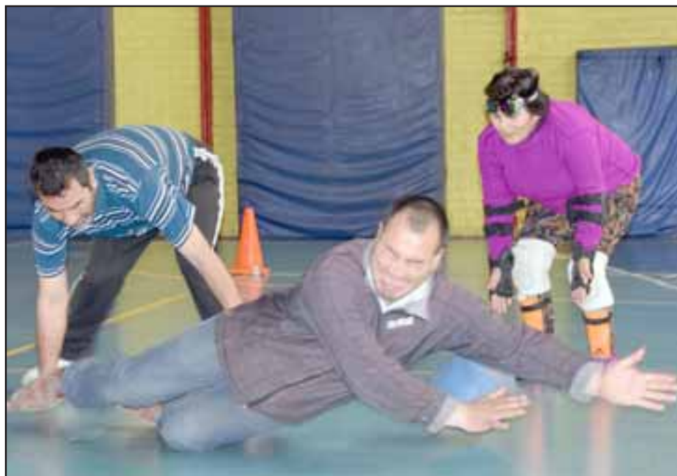
Las cámaras de Diario El Trabajo registraron este golazo, atrás, otros ciegos también intentando detener el cañonazo.