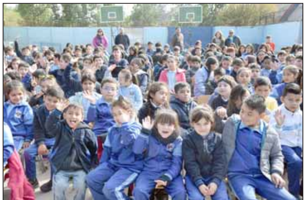
LA SANGRE DE LA ESCUELA.- Estos pequeñitos son la razón de estos profesionales de la educación en la escuela que funcionará en ese edificio hasta fines de 2019.