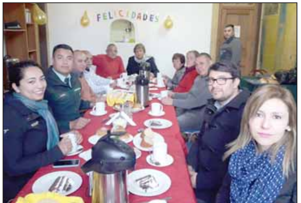
Culminadas las labores de mejora del mobiliario, y durante horas de la tarde, el personal de Gendarmería y los usuarios compartieron con los residentes una onca con karaoke.

«Es provechoso, tanto para los usuarios como para nosotros, que ellos sean capaces de participar en comunidad e interesarse en estas actividades».