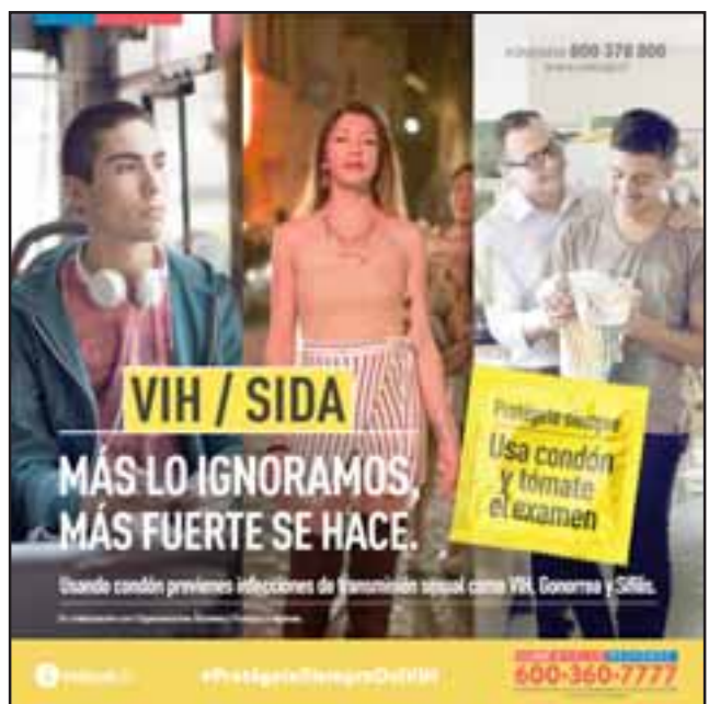
Ya el año pasado se advirtió un aumento a nivel nacional del VIH y la campaña se enfocó precisamente a no olvidar que se trata de una enfermedad grave.