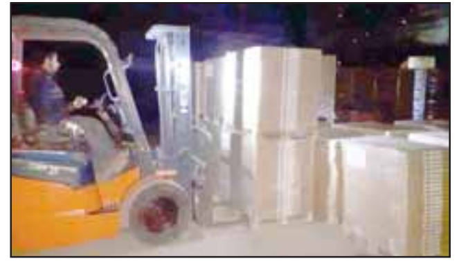
El cargamento robado fue avaluado por la empresa en $72.000.000.

Las diligencias continuaron a cargo de la Sección de Investigación Policial SIP de Carabineros de San Felipe, para indagar más antecedentes de lo ocurrido, siendo deteni-