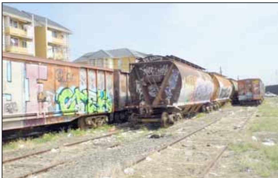
El antisocial se ocultó debajo de unos vagones de tren en desuso, desde donde debió ser sacado por Carabineros.

Las víctimas productos de las agresiones resultaron con heridas leves.