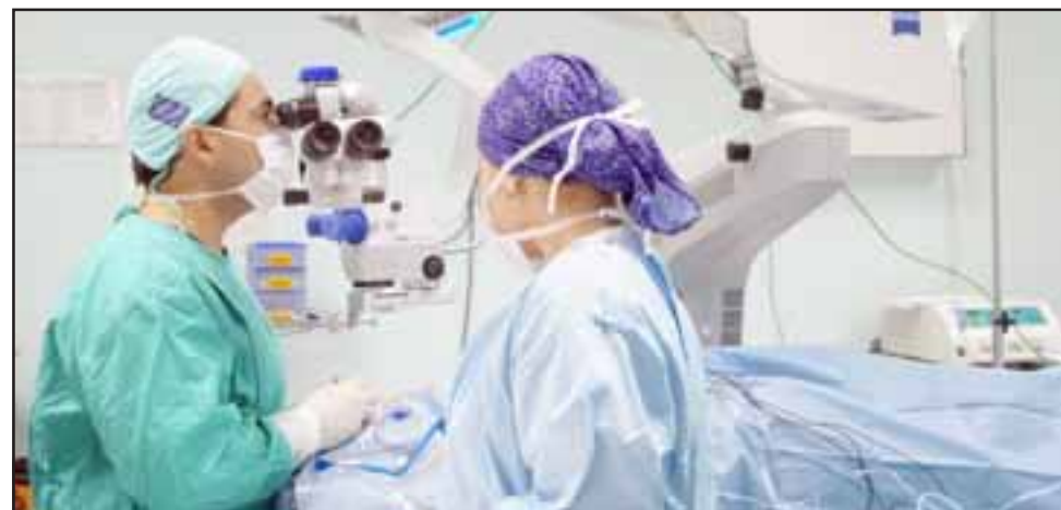
La reducción de lista de espera fue posible gracias a los recursos adicionales del Ministerio, lo que permitió realizar más de 300 intervenciones adicionales en horarios fuera de los programados.