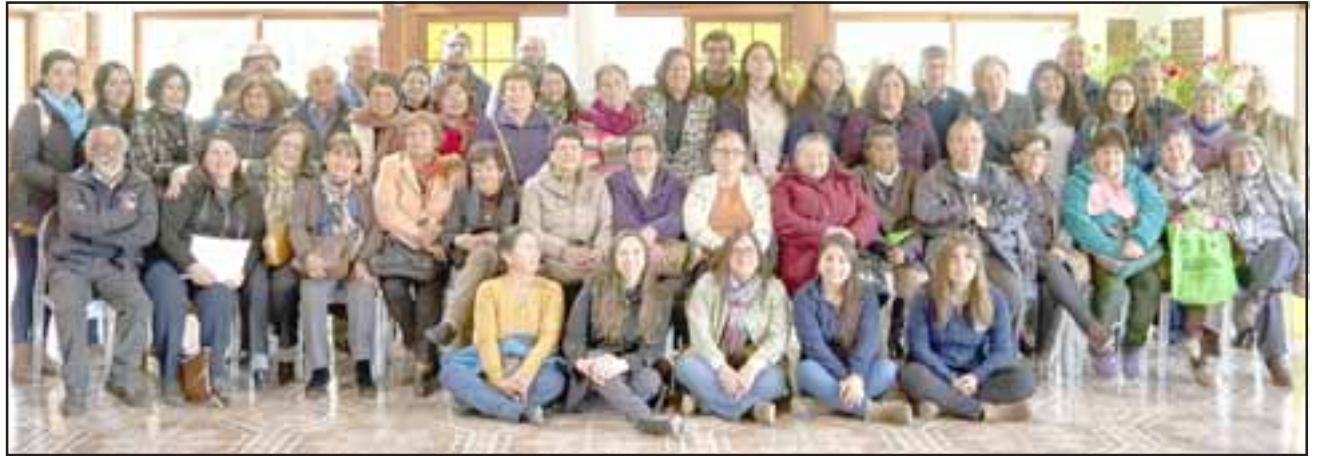
LA GRAN COMITIVA.- Ellos son parte de los adultos mayores que dieron Fuerza y Vigor al conversatorio Gerópolis, en Putaendo.

TODO ENTRE AMIGOS.- También los participantes disfrutaron de un refrigerio en camaradería.