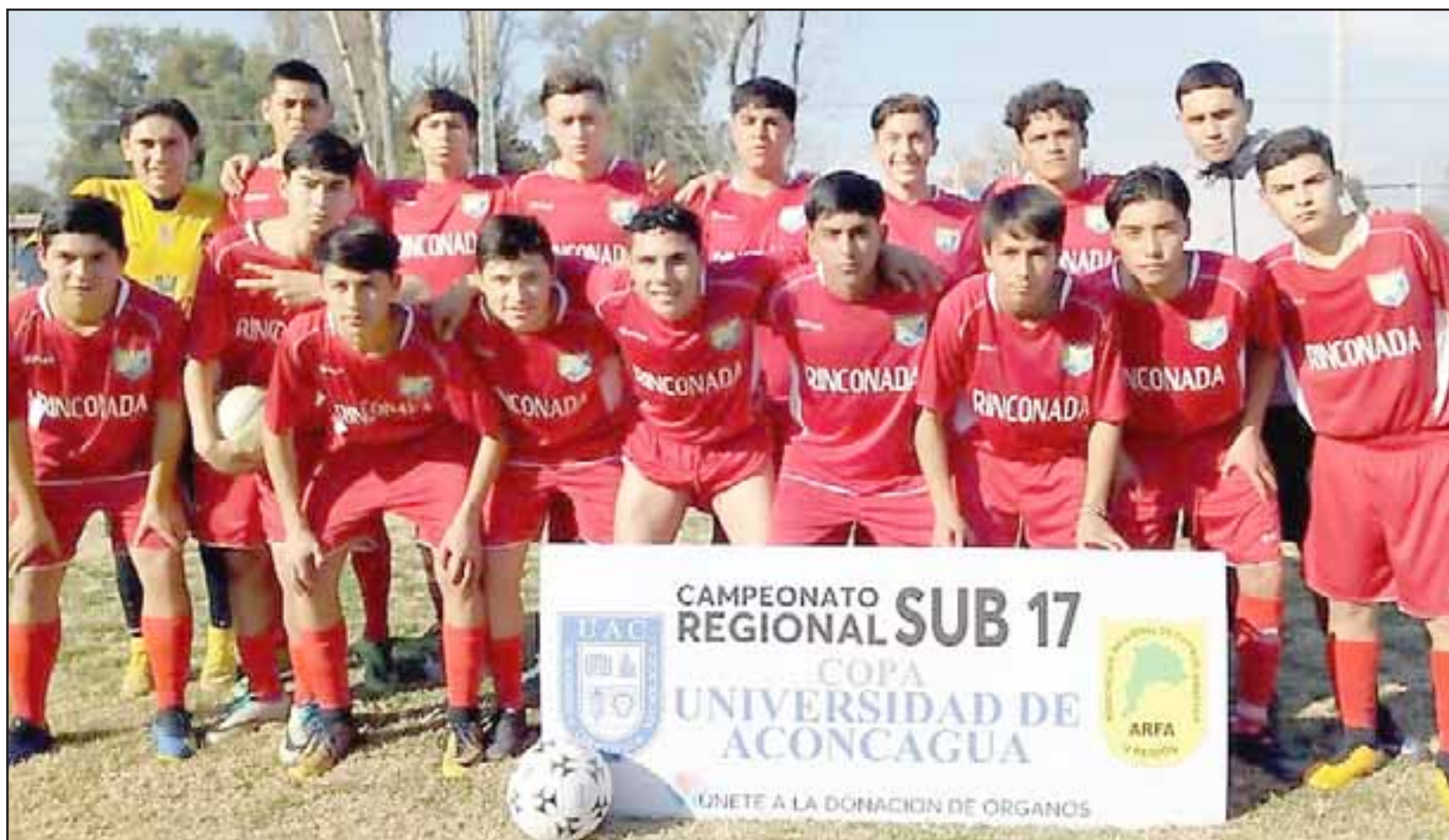
La selección de Rinconada quedó muy bien aspectada para seguir en carrera en el Regional de Fútbol U17 Copa Universidad de Aconcagua.

Putando 4 - Quintero 2; Rural Llay Llay 0 - Rinconada 3; Catemu 1 - Hijuelas 3; Nogales 2 - Panquehue 0.