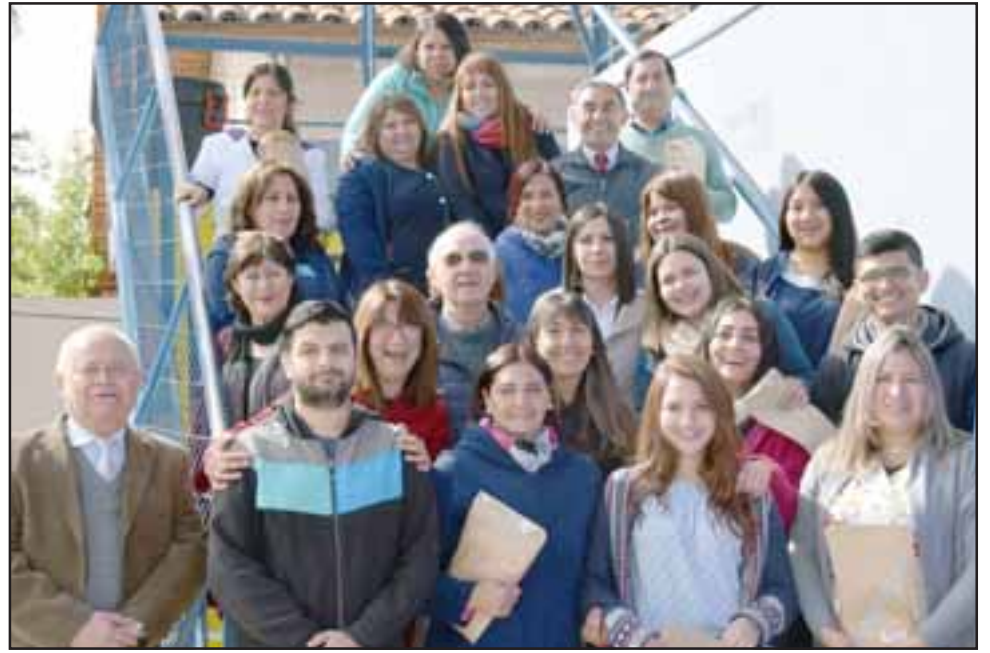
ASISTIENDO LA VIDA.- Aquí tenemos a los Asistentes de la Educación que laboran en la Escuela Buen Pastor, todos ellos marcan la gran diferencia en esta casa de estudios.