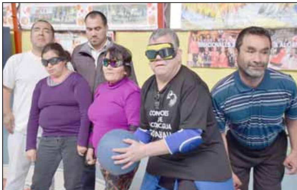
CÓNDORES DE VERDAD. - Aquí tenemos a los deportistas del Club Deportivo Cóndores de Aconcagua, entrenando ayer de cara a la Semifinal del sábado.