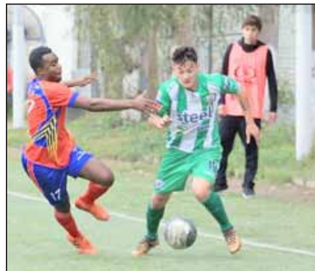
Frente a uno de los equipos más modestos de la competencia, Trasandino cargará con la tarea de estirar su buen momento actual.

Ovalle – Osorno; Lautaro – Linares; Limache – Salamanca; Rengo – Rancagua Sur; Municipal Santiago – Real San Joaquín; Mejillones – Macul; Trasandino –