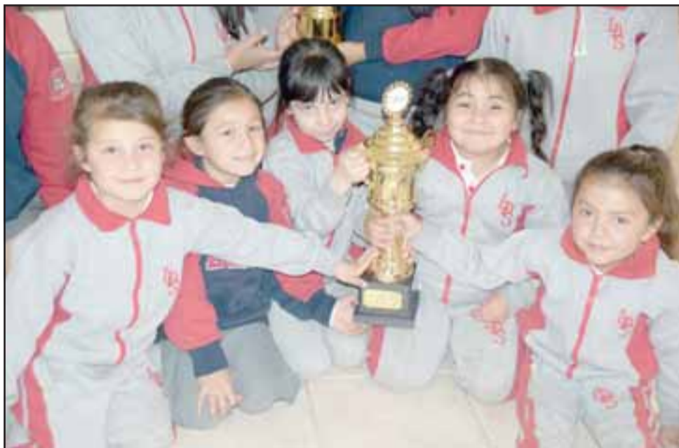
SON FANTÁSTICAS.- Ellas son las más pequeñitas, también han logrado grandes avances en esta disciplina deportiva.

lomena en categoría Tiny Mini ganó en Hip hop, la Julio Tejedor ganó en Mini Pom pom. Esta Actividad, el Regional, se realizó en el Teatro Teletón de Santiago, y al ganar en este Regional ahora las niñas podrán competir por el título en el Nacional del 4 de noviembre, en