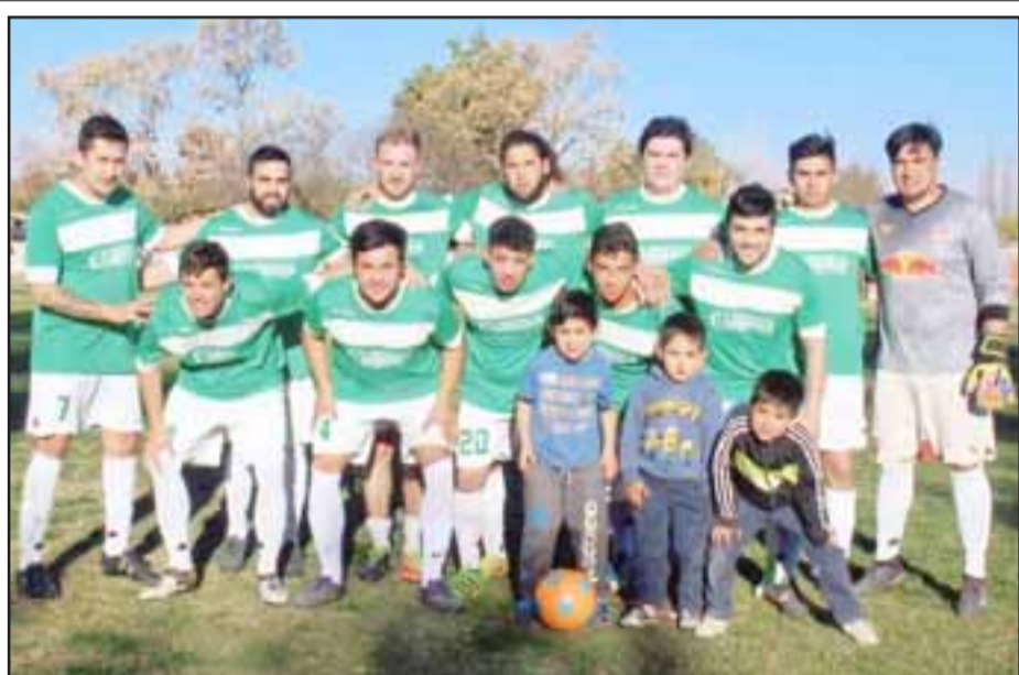
Serie de Honor del club Deportivo Las Cadenas.