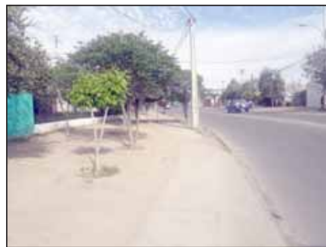
En este sector de la avenida se produjo el asalto

La víctima señala en Carabineros que recuerda algunas características de su agresor. Se trataría de una persona alta, moreno, pelo corto color negro, vestía polerón azul con capucha y jeans del mismo color, también portaba una mochila color morado y se movilizaba en una bicicleta.