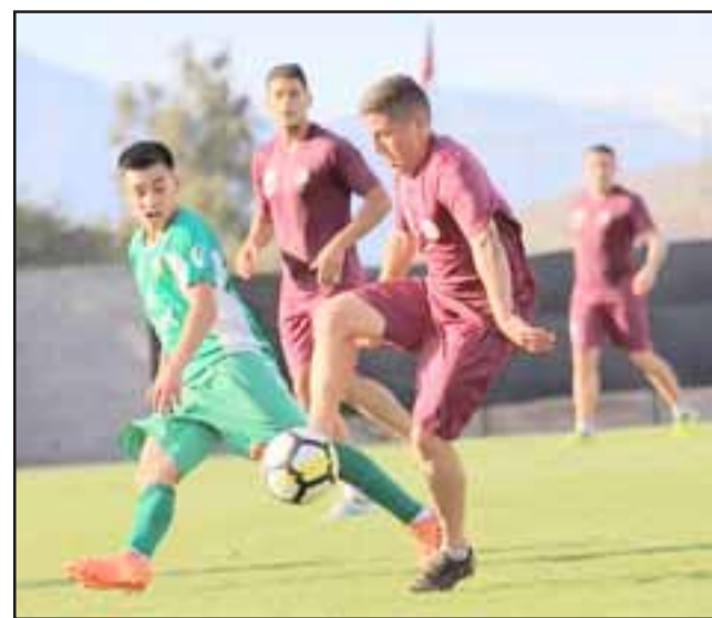
Por más que enfrente a un equipo muy sólido y candidato al título, Unión San Felipe está obligado a ganar.