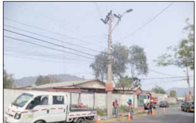
Personal de Chilquinta trabajando en el lugar del incidente que dejó sin energía por varias horas a más de 2.400 clientes.

Desde Chilquinta señalaron que la reparación se prolongó más del tiempo estimado porque chocaron el tirante de un poste, quedando esparcidos en el suelo elementos quebrados.