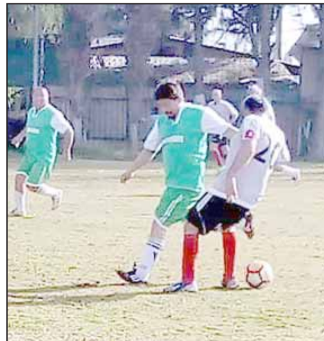
En la fecha de la Liga Vecinal sobresale el duelo que a última hora sostendrán los escoltas del puntero.