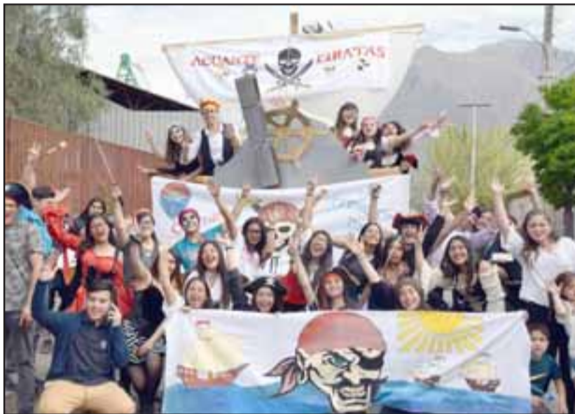
SEMANA FRANCISCANA.- Pero no sólo se trató de recorrer las calles con estos carros alegóricos, también se hicieron acciones solidarias, como visitas a hogares de ancianos y visitas hospitalarias.

¿PIRATAS EN ACONCAGUA? Los piratas de 'Enfermería' también desfilaron ayer en San Felipe, las personas no entendían por qué tanta fiesta.