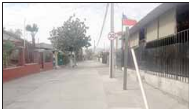
Por este pasaje huyó la víctima para buscar refugio con sus familiares, según testigos que la escucharon gritar.

Todos los antecedentes fueron puestos en conocimiento del Ministerio Público que dirigirá la investigación con el fin de dar con el paradero del autor de este delito.