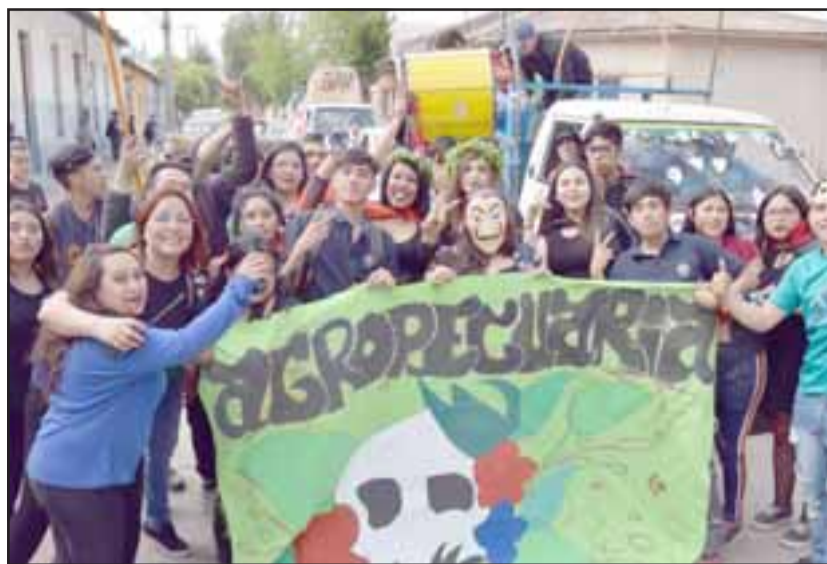
AGROPECUARIA.- Aquí tenemos a los chicos de la Alianza de la carrera Agropecuaria, mostrando a las cámaras de Diario El Trabajo su propuesta artística.

tos carros alegóricos, también se hicieron acciones solidarias, como visitas a hogares de ancianos y visitas hospitalarias. Las actividades culminan hoy viernes con la realización de una peña folclórica a partir de las 20:00 horas en el propio colegio.