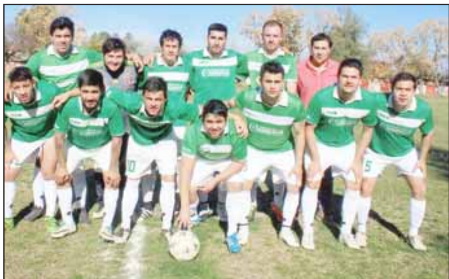
Segunda serie del club Deportivo Las Cadenas.

Como ya se ha hecho común, el encargado y responsable de tomar estas imágenes, fue nuestro amigo Roberto ‘Fotógrafo Vacuna’ Valdivia , el que durante las últimas semanas ha recorrido una a una las canchas de Santa María.