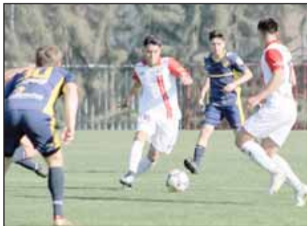
Los equipos juveniles de Unión San Felipe tendrán como rivales este fin de semana a sus similares de Colchagua.

Programación sábado 6 de octubre, Estadio Municipal de