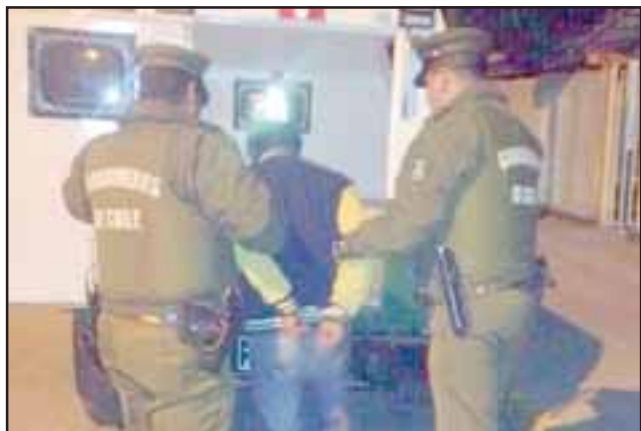
El imputado fue detenido por Carabineros en calle Encón de San Felipe tras la sustracción de un televisor Led.