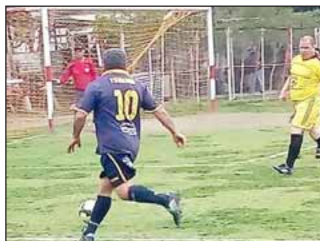
A medida que avanza la competencia en Parrasía, la lucha por la cima del torneo se está tornando cada vez más atractiva.

Santos 1 - Tsunami 1; Villa Los Álamos 1 - Unión Esperanza 0; Los Amigos 2 - Pedro Aguirre Cerda 0; Aconcagua 2 - Carlos Barrera 0; Unión Esfuerzo 3 - Villa Argelia 1; Hernán Pérez Quijanes 4 - Barcelona 3; Andacollo 8 - Resto del Mundo 0.