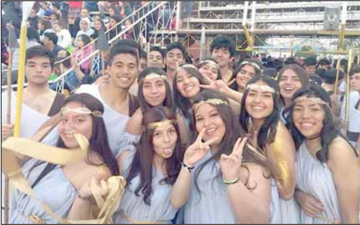
Alumnos del colegio felices de participar en una nueva versión de la revista de gimnasia 2018.