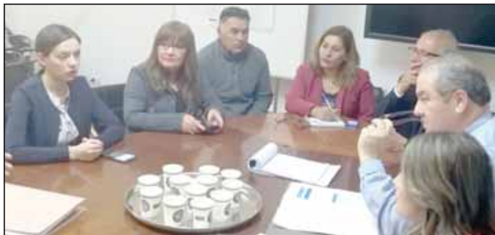
Autoridades de Aconcagua se reunieron con el Subsecretario de Redes para pedir un centro de quimioterapia que funcione en San Felipe, consiguiendo el compromiso de la autoridad de instalar al menos uno de mediana complejidad para que un porcentaje de pacientes pueda tratarse en el hospital San Camilo.

Para la diputada Camila Flores, "es de suma importancia que se pueda habilitar una instalación médica que permita tratar a todos los habitantes del Valle. No es razonable convivir con este centralismo, incluso regional, que obliga a los pacientes que sufren de esta enfermedad desplazarse grandes distancias para recibir sus tratamientos en Valparaíso. Se trata de un requerimiento de primera necesidad, porque buscamos contar también con médicos especializados en oncología, que ayude a que las personas que sufren de cáncer