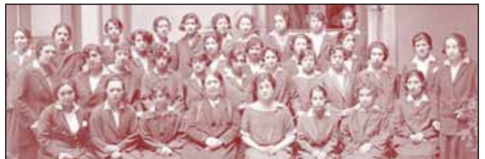
Memoria Chilena (1925). Alumnas de la Escuela Normal Nº 1, Santiago.