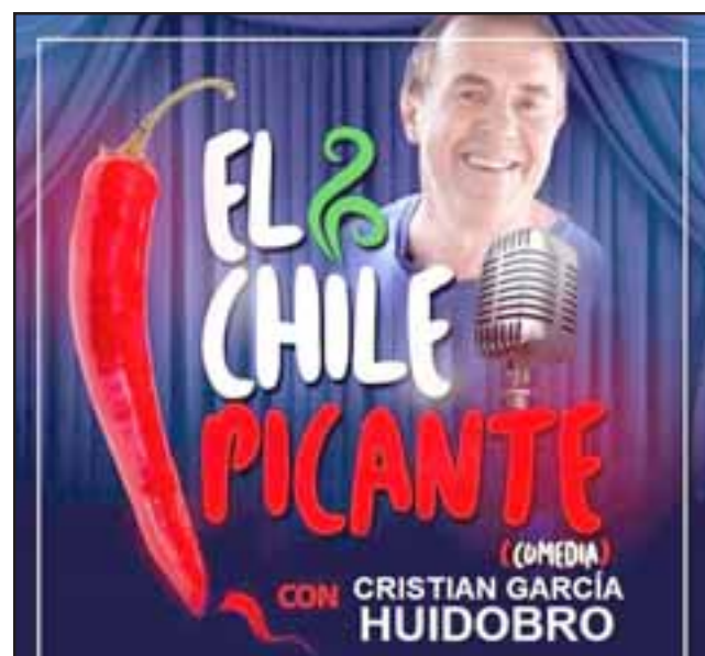
IMPERDIBLE.- Humor del nuestro, del bueno y para toda la familia con esta nueva propuesta del Café Concert a la chilena.