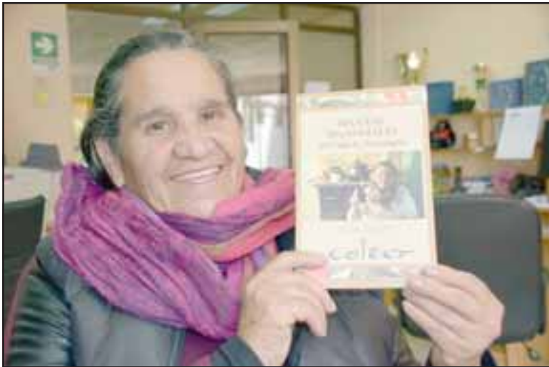
BUENA CUCHARA. - La escritora aconcaguina visitó ayer miércoles nuestra Sala de Redacción, para mostrarnos su nueva obra.