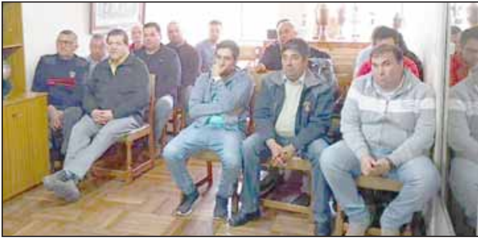
Voluntarios de la Primera Compañía de Bomberos de Llay Llay estaban felices con la buena noticia entregada en la oportunidad.

unión de trabajo con el fin de informar a bomberos sobre el rápido avance en la fase de diseño, el que está siendo desarrollado por la Dirección de Secplac del municipio para posteriormente ser presentado durante el año 2019 al Fondo Nacional de Desarrollo Regional (FNDR) para su aprobación.