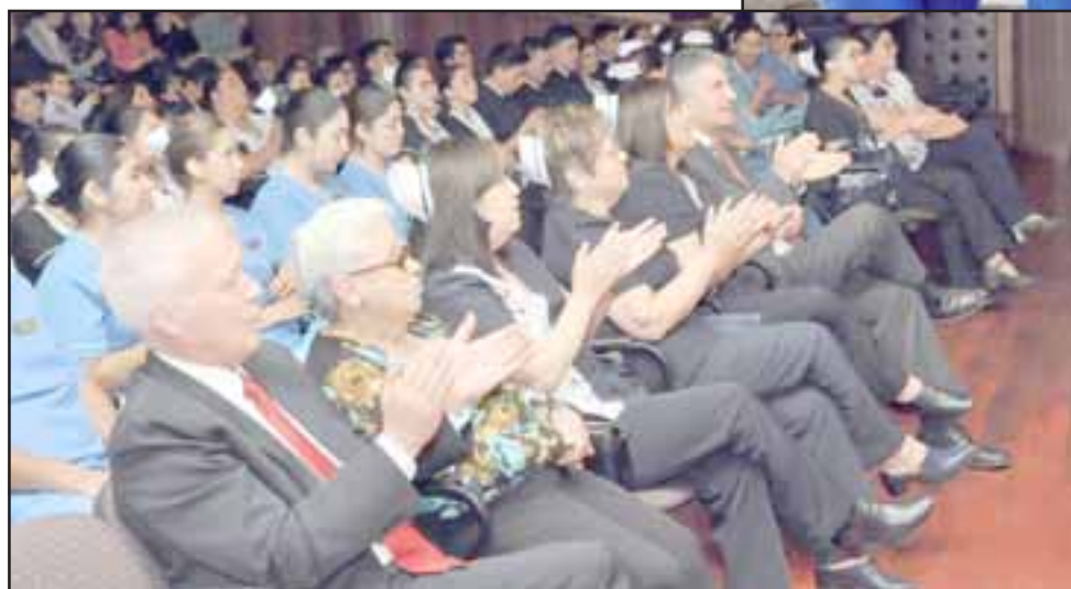
Familiares de los estudiantes y autoridades universitarias repletaron el Teatro Municipal, donde se vivieron momentos de mucha emoción.