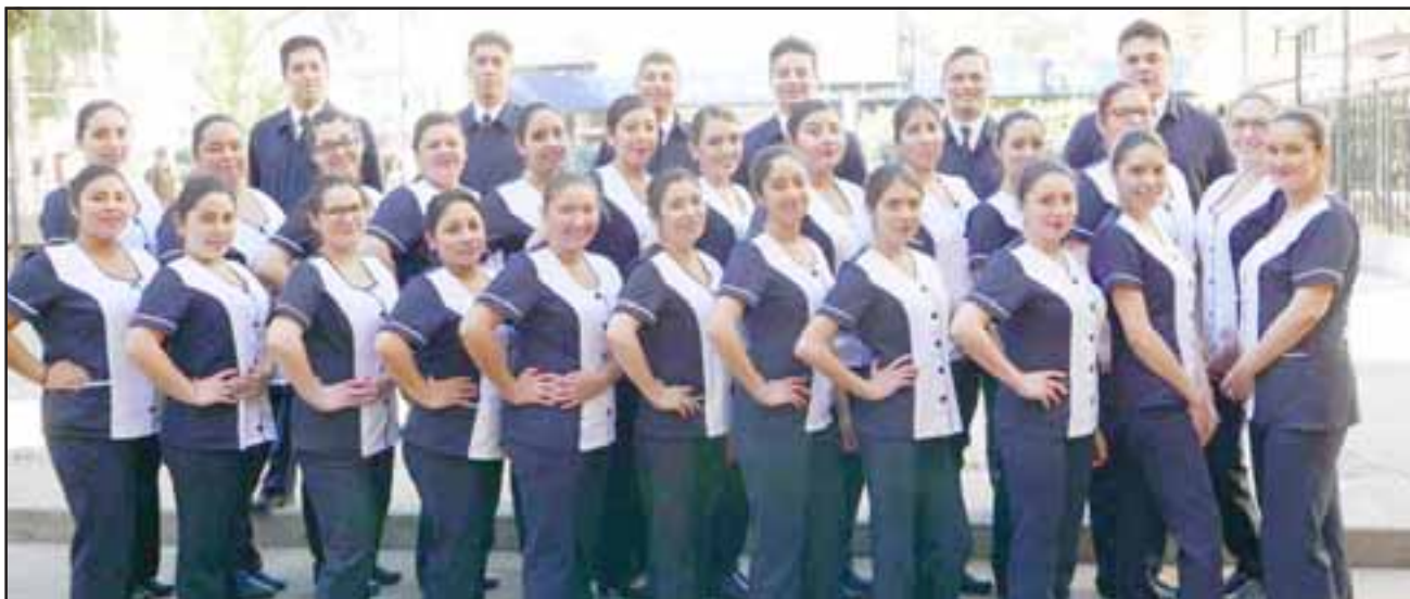
Fueron 29 estudiantes de enfermería y 16 de Técnico en Enfermería de Nivel Superior (TENS) que recibieron de manos de sus docentes y de titulados de generaciones anteriores, las piochas que los distinguen como enfermeros (as) y técnicos en formación