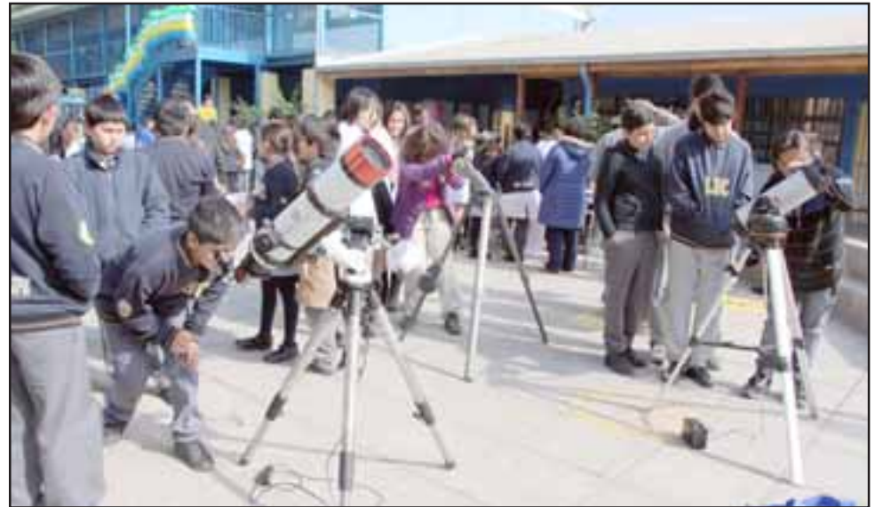
Este año la feria contó con un domo astronómico y varios telescopios, generando bastante interés de los estudiantes.

«Nos acompaña la Universidad de Valparaíso, nos abrimos a las humanidades con la presencia de una socióloga y tenemos el Observatorio Astronómico Pucuro y la idea es que los chicos puedan tener un trabajo científico», sostuvo el docente.