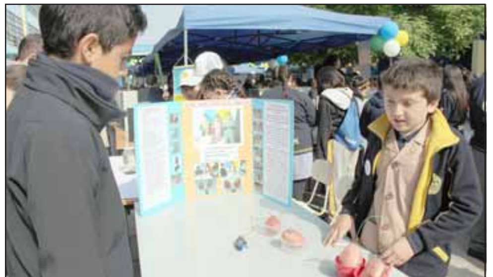
Los alumnos pudieron mostrar y explicar distintos experimentos a los cursos que visitaron la iniciativa durante toda la mañana.