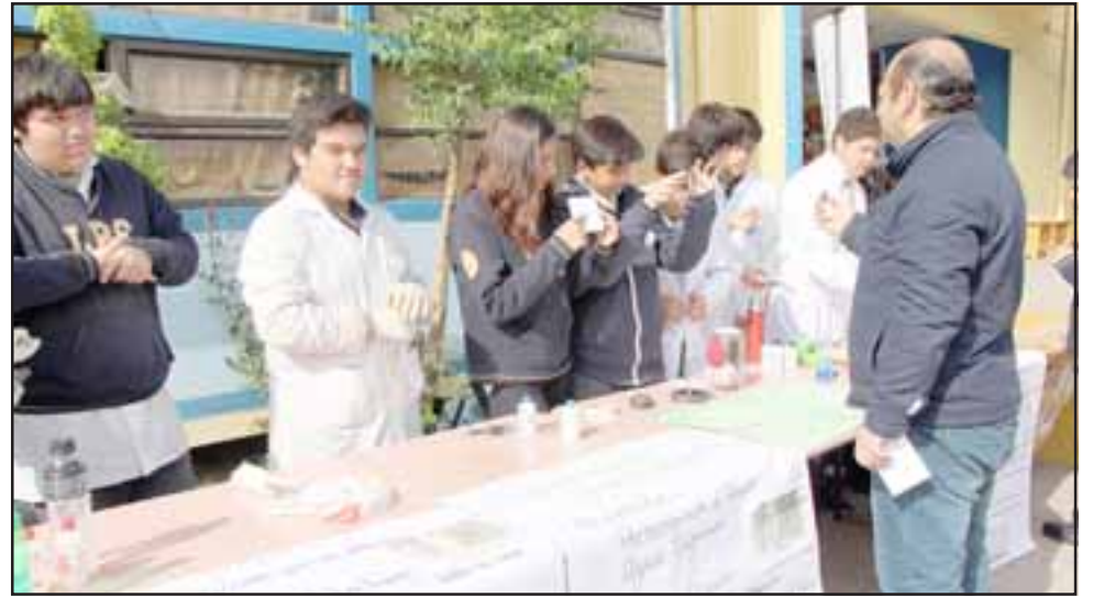
La V Feria Científica se realizó el viernes pasado en el Liceo Cordillera, donde los alumnos presentaron los trabajos científicos que han realizado durante el año.

«Hay chicos que tienen experimentos que son geniales y eso nos deja tranquilos, porque en Chile podemos tener niños que van