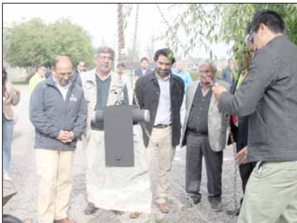
El día de su aniversario 62º, Unión San Felipe puso la primera piedra de lo que será su edificio del fútbol joven.

Camarines, gimnasio, comedor, sala de reuniones y terraza, tendrá el coloso que pronto se comenzará a construir y que debería estar listo para inaugurarse en un plazo de tiempo de seis a ocho meses.