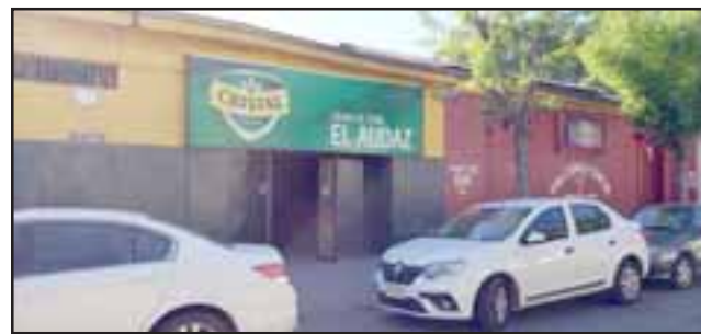
El salón de pool 'El Audaz' se ubica en calle Portus N° 69 en San Felipe. Desde este lugar fue detenido un sujeto de 34 años de edad por el delito de robo en lugar no habitado en grado de frustrado.

El imputado fue identificado con las iniciales A.E.L.A. , de 34 años de edad, quien fue derivado hasta el Juzgado de Garantía de San Felipe por el deli-