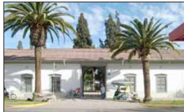
Frontis del Cementerio Municipal de San Felipe, recinto que se estaría ampliando ya que se encuentra actualmente colapsado, y donde se estudia la instalación de un crematorio.

Por los plazos indicó que ellos creen que el momento más oportuno es cuando el plano regulador esté a firme: “Una vez que el plano regulador esté aprobado, eso se estima que debe ser seis a ocho meses más, nosotros estamos en condiciones de comenzar las gestio-