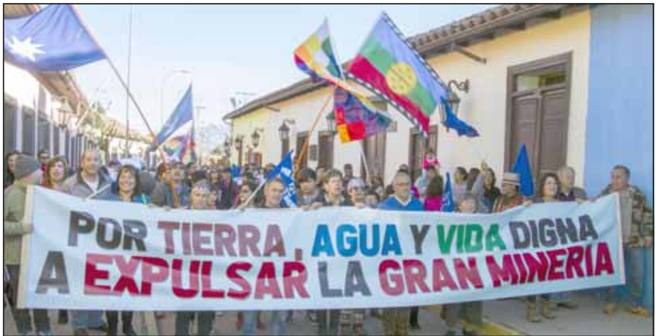
Para el SEA no importa la voz disidente de miles de persona que se oponen a la gran minería en Putaendo.

“Estos grandes proyectos requieren dar cuenta de las miradas de las comunidades locales, porque somos nosotros los que deberemos enfrentar la destrucción del río Rocín, la pérdida de flora y fauna nativa, la contaminación del agua y la disminución de la capacidad de almacenamiento del Embalse Chacrillas. Nosotros, nuestros hijos y nietos seguiremos viviendo aquí, mientras los inversio-