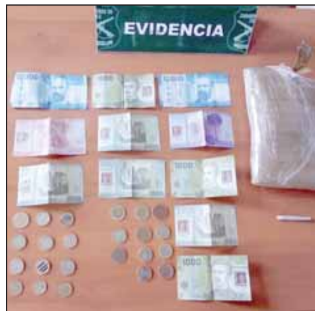
Personal de la SIP de Carabineros de San Felipe incautó más de un kilo de marihuana prensada y dinero en efectivo.

Carabineros aún no determina identidades de sujetos: