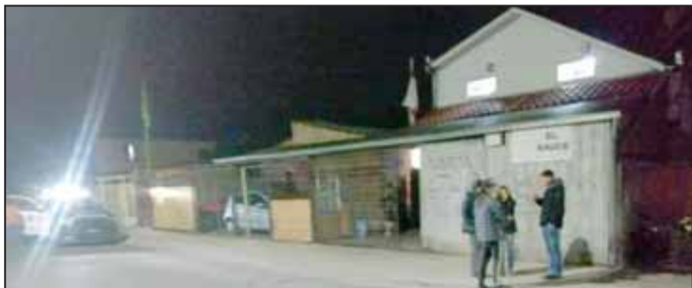
Delincuentes efectuaron el robo de dinero y daños al interior de una botillería ubicada en la Avenida Las Palmas de Llay Llay.

Daños a la propiedad y el robo de una cantidad indeterminada de dinero efectuaron desconocidos al interior de una botillería ubicada en la avenida Las Palmas de Llay Llay.