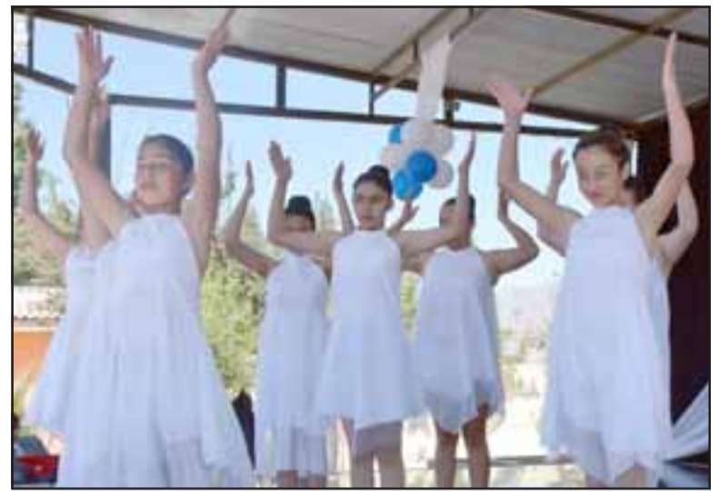
DANZA Y CANDOR.- Estas bellas niñas ofrecieron su mejor danza artística a los presentes en el aniversario de su escuela.

Hubo música y de la buena a cargo de los niños de la escuela, así como bellas danzas a cargo de las damitas de los talleres de expresión corporal. Durante la jornada también se entregaron algunos reconocimientos especiales a estudiantes y profesores.