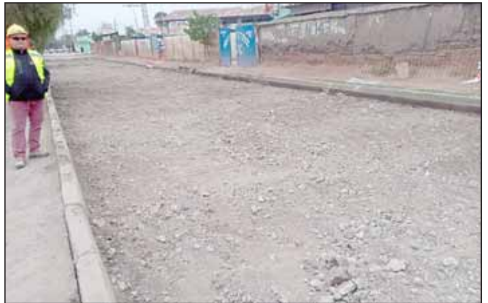
La obra tendrá una duración aproximada de 280 días y contempla también el pintado de pasos de cebra y la instalación de reductores de velocidad o 'Lomos de Toro', pero no incluye las veredas.

calle Potrerillos y en estos días comenzamos con lo que dice relación con los pavimentos asfálticos en el damero central; también se está terminando la primera etapa de calle Rancagua, por lo que no hemos desplegado en muchos puntos de nuestra ciudad y nuestra área operativa municipal a cargo de la subdirección de operaciones comienza el lunes el trabajo de algunos eventos emblemáticos, que son algunos paños de hormigón que vamos a reparar y también continuar con lo que es señalética de tránsito y reductores de velocidad", informó el jefe comunal.