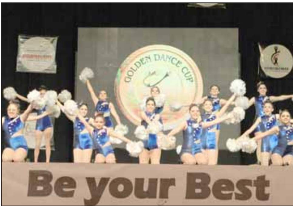
EXCELENCIA.- Aquí vemos a estas jovencitas sanfelipeñas brillando como grandes luminarias en Colombia.

nales. Posteriormente a este campeonato logramos viajar a la ciudad de Cartagena, en donde participamos en un intercambio realizado en el Colegio Nuestra Señora del Rosario, en donde mostramos nuestro trabajo artístico, además compartimos con los equipos de dicha ciudad. Una experiencia inolvidable que quedó grabada en el corazón de este grupo de alumnas, quienes gracias a su trabajo, es-