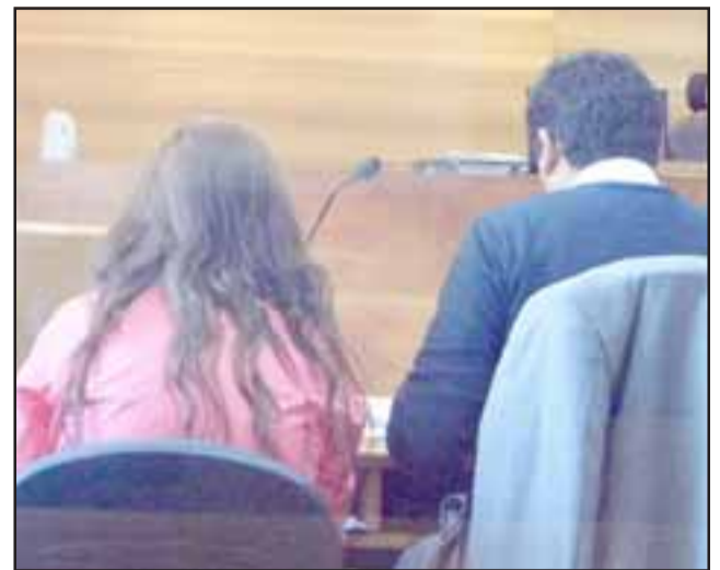
La mujer de 30 años de edad, oriunda de San Felipe, logró burlar los controles externos, pero fue detectada por las cámaras en plena entrega del dinero y la droga.