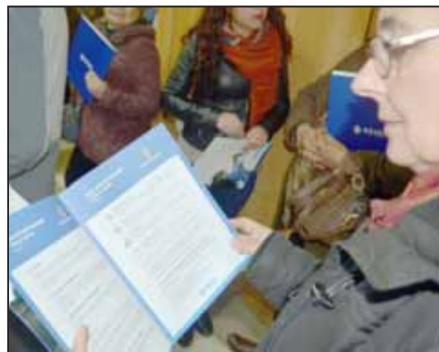
En el caso del Valle del Aconcagua, 18 organizaciones resultaron seleccionadas, 7 más que en la pasada versión.

Cada agrupación recibirá hasta $2 millones para el desarrollo de sus proyectos, que deberán ejecutarse entre noviembre de este año y marzo de 2019. Los ganadores fueron notificados directamente, además, el listado de las iniciativas seleccionadas se encuentra publicado en www.esval.cl .