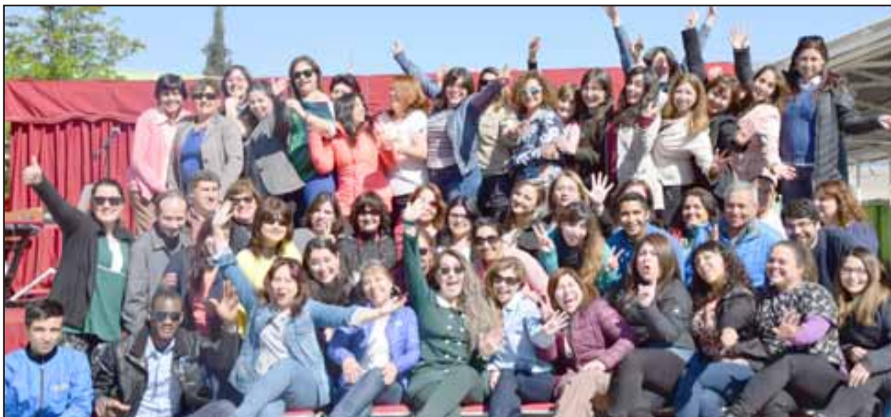
GRACIAS PROFESORES.- Aquí vemos a gran parte de los 75 profesores de la Escuela José de San Martín, celebrando en grande el agasajo que la Escuela les ofreció esta semana.

instaurado originalmente en 1943, como Día del Maestro, y era celebrado cada 14 de junio; poco tiempo después la fecha fue reemplazada por el 11 de septiembre, en recuerdo del fallecimiento de Domingo Faustino Sarmiento,