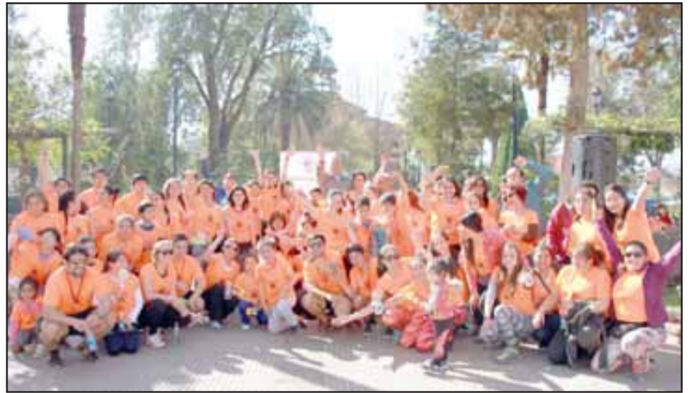
La cita es este sábado a partir de las 10 de la mañana en la Plaza Prat de Putaendo, donde se espera llegue gran cantidad de participantes. (Foto referencial).

Quienes participen, realizarán un trayecto que comienza en la Plaza Prat. Luego se avanzará por calle San Martín hacia el norte, virando por la Avenida Alessandri y por la Avenida Alejandrina Carvajal hasta el fin de esta última arteria. Después se doblará por calle Weggener y, por último, calle Comercio