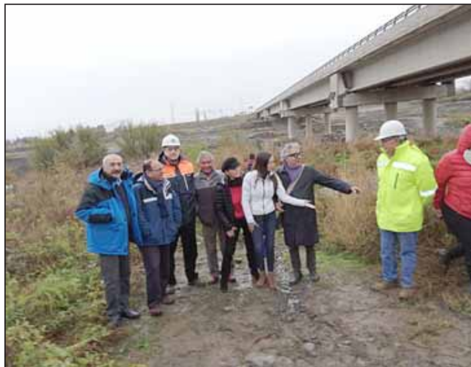
En junio de este año diversas autoridades inspeccionaron las bases del puente.