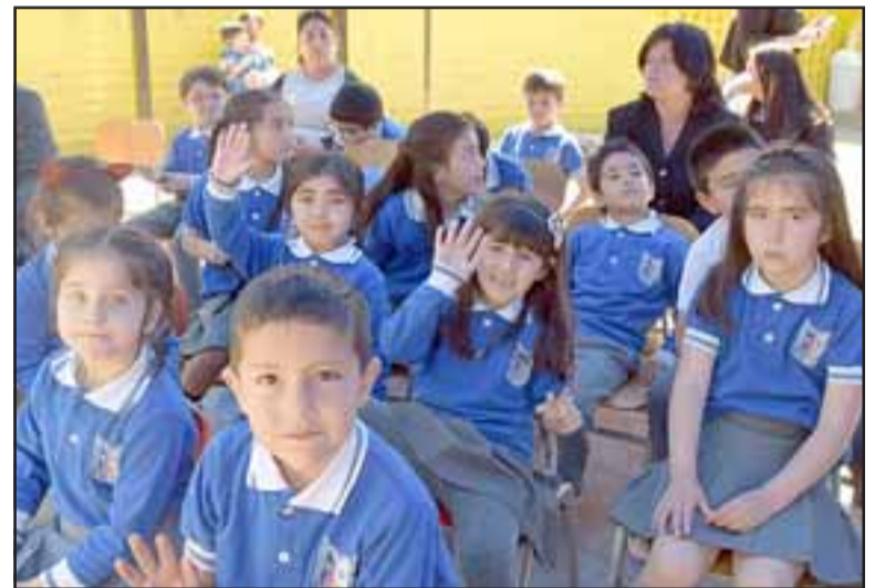
UN AÑO MÁS.- Peques y grandes participaron de la gala de aniversario en el patio principal de su escuela.