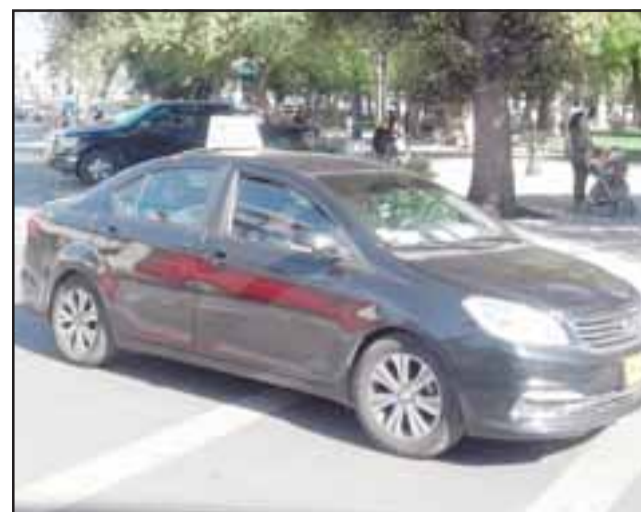
Desde las 21:00 horas el pasaje en colectivo costará $ 600, lo mismo los días domingos y festivos.

- Mira, sobre los estudiantes, hay líneas que no quieren nada con ellos, pero