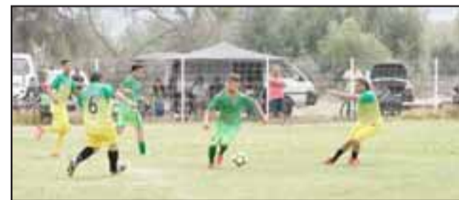
Intensa y muy agitado será el fin de semana en el fútbol amateur aconcagüino.