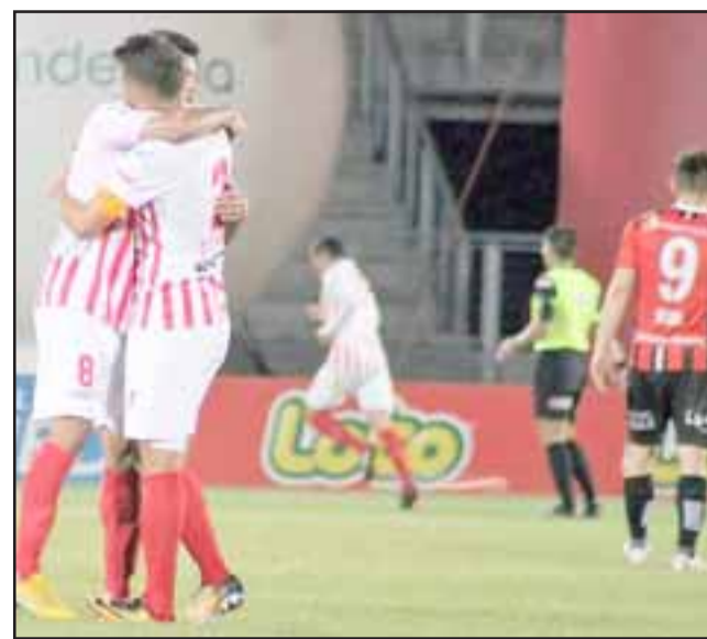
Al mediodía del domingo el Uní Uní buscará una nueva victoria que lo siga aproximando más a la liguilla del ascenso.