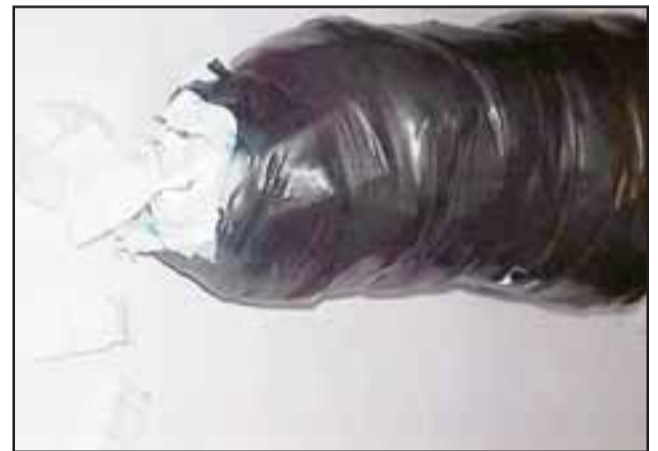
En un ovoide vaginal confeccionado con látex fue ingresada la droga y el dinero al penal andino.