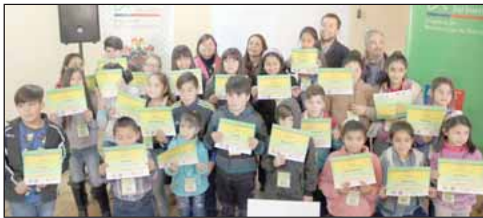
En estos tres años han sido numerosas las actividades sociales que se han desarrollado en el lugar, tales como el taller de mini reporteros que certificó a varios niños del sector.