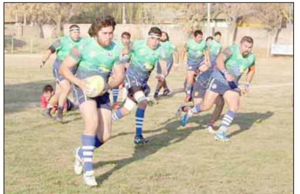
Este sábado se jugarán las semifinales de la Copa de Plata de Arusa.

segundo y tercero en la etapa regular de la Copa de Plata.