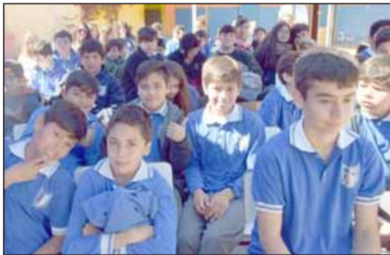
LOS ESTUDIANTES.- Aquí tenemos la fuerza y vitalidad de la Escuela Artística República Argentina.