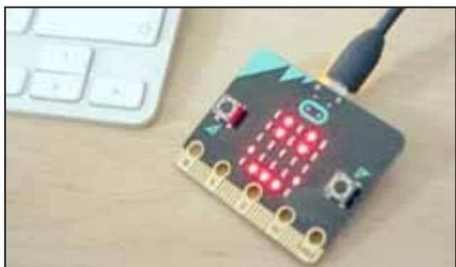
Micro Bit nació como una colaboración entre la BBC y varias compañías tecnológicas para enseñar a niños -y sobre todo niñas- del Reino Unido a programar.

Council busca fomentar las Habilidades del Siglo 21 - creatividad, pensamiento crítico, alfabetización digital, entre otras- a través del uso de nuevas tecnologías como la programación y codificación en estudiantes de educación básica.