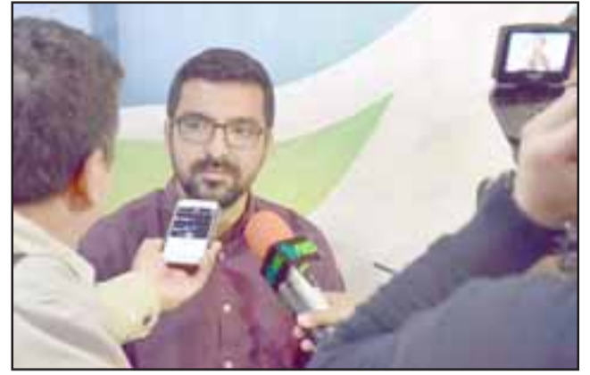
La mañana de ayer el alcalde Edgardo González convocó a un punto de prensa para realizar un balance de la gestión municipal en el marco de los dos años de su elección, gestión que se ha destacado por su fuerte inversión en materia social, deportiva y de infraestructura.

tos, lo que sin duda es motivo de orgullo, ya que es fruto del trabajo en equipo de la Municipalidad, el alcalde, concejales, consejeros regionales, etc. Es decir, aquí hay voluntades colectivas que han tenido un fruto importante en la inversión significativa que está transformándole la cara a la comuna de Llay Llay”, concluyó el edil.