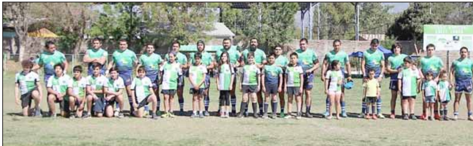
Los Halcones no pudieron superar su llave de semifinal de la Copa de Plata.

En la otra llave de semifinales de la Copa de Plata de Arusa, Old Gabs superó 29 a 14 a Carneros.