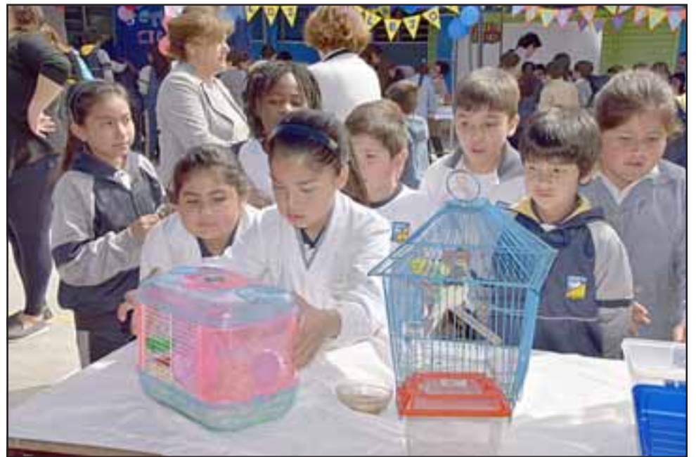
LOCOS POR LA CIENCIA. - Decenas de experimentos científicos escolares realizaron estos niños en la Escuela José de San Martín.

Gran revuelo estudiantil es el que se generó durante casi todo el día lectivo en la Escuela José de San Martín, durante la Feria científica 'El año de los porqué' , en la que participaron no solamente los 1.190 alumnos de la escuela, sino también que a la jornada se unieron otros niños invitados de otras casas de estudio. Las cámaras de Diario El Trabajo hicieron un recorrido por