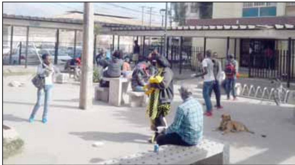
Ciudadanos haitianos en el frontis de la Gobernación de San Felipe, donde cinco de ellos se regresan a Haití y otros 20 pidieron los formularios para la eventualidad de tener que regresar.

- Hombres, mujeres y niños, también pudiera ocurrir, porque en el fondo uno de los requisitos es que si hay un grupo familiar, el que retorna es el grupo familiar completo, no uno sólo miembro del grupo familiar, por eso es importante que la decisión sea libre y voluntaria, y eso queda ratificado a través de una declaración notarial, donde se le explica con detalles en qué consiste esta operación de retorno humanitario que está facilitando nuestro país, de forma que nadie se sienta engañado para tomar el vuelo de regreso hasta su país, además es súper importante que entiendan que no podrán retornar a nuestro país hasta un periodo de nueve años, porque la idea que está detrás es que Chile está incurriendo en gastos para poder hacer esta facilitación y por lo mismo no