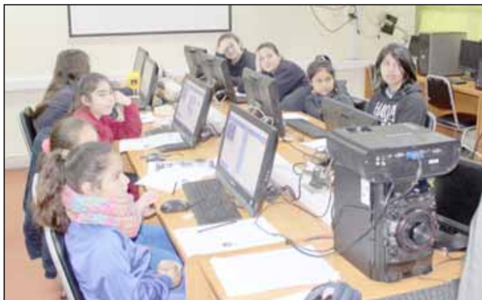
Alumnos de cinco colegios de básica de Panquehue trabajan en el área computacional a través del moderno dispositivo del tamaño de una tarjeta de crédito.

«Yo creo que hay que darle oportunidades a los niños de las escuelas de