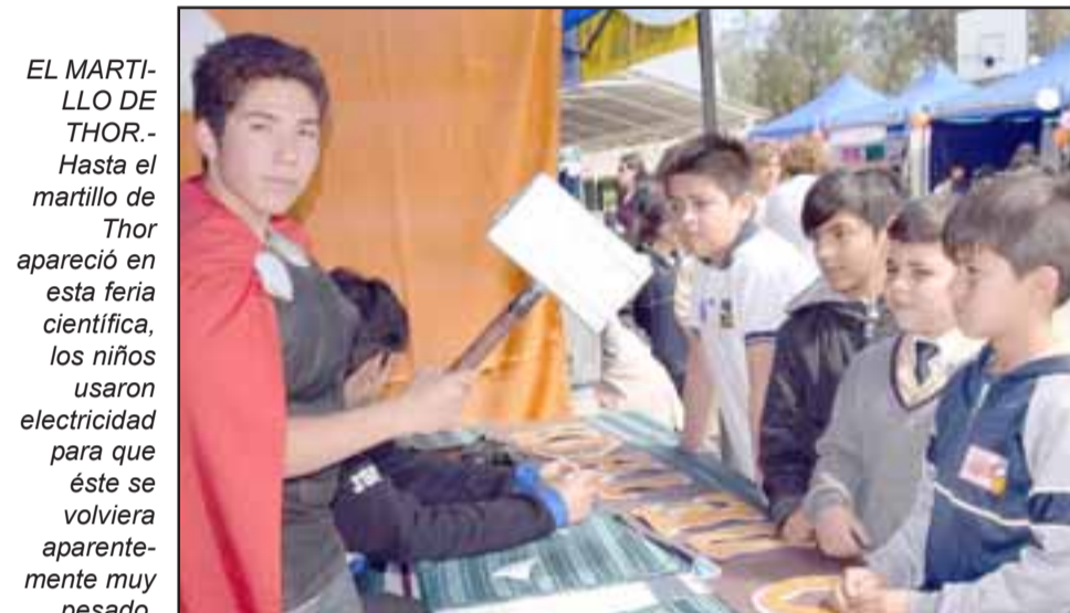
EL MARTILLO DE THOR. - Hasta el martillo de Thor apareció en esta feria científica, los niños usaron electricidad para que éste se volviera aparentemente muy pesado.

los stands instalados en el patio principal de la escuela, nos encontramos con muchos proyectos hechos por los propios niños, programas digitales, el martillo de Thor, experimentos eléctricos y de eficiencia energética.