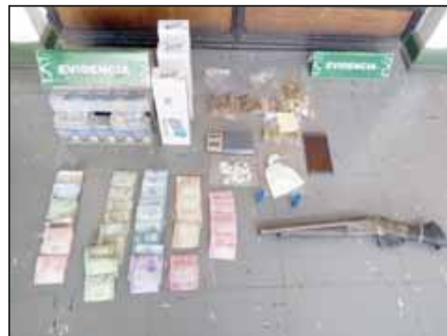
Personal de la SIP de Carabineros de San Felipe incautó un arma de fuego, municiones, drogas y cigarrillos de contrabando desde la Villa Departamental.

Sin embargo, el segundo protagonista además de la menor de edad, fueron de-