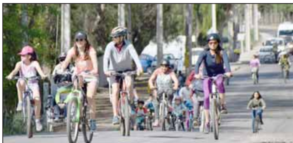
TODOS CORREN.- Se corrió en la 9K para los más animados, y 6K para aquellas familias que llegaron con niños pequeños y quizás no podían correr la más grande.

sotros lo que buscamos es mejorar la calidad de vida de las personas, sobretodo en el tema de la obesidad en la comuna, según el Plan de Salud Comunal, cerca de un 60% de cánceres los genera la obesidad en la población, según las estadísticas que nos reportaron desde el Hospital San Camilo, los últimos decesos tienen que