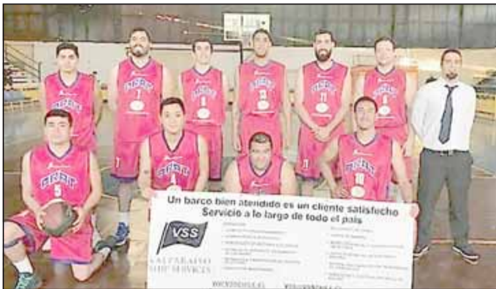
El Prat tuvo una presentación 'redonda' al ganar sus dos partidos del fin de semana recién pasado.