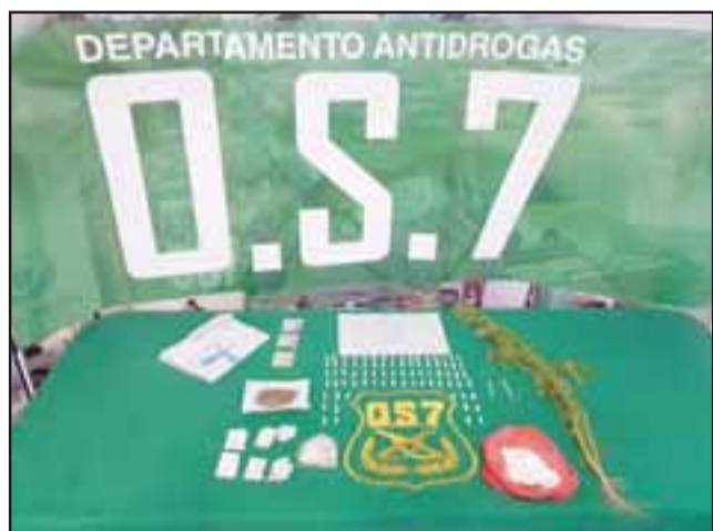
Personal del OS7 de Carabineros Aconcagua incautó pasta base de cocaína y marihuana desde un domicilio ubicado en la Villa Gabriela Mistral de Catemu.

Un decomiso consistente en 76 gramos de pasta base de cocaína, seis gramos de marihuana elaborada y una planta de cannabis sativa, fue el resultado de las diligencias efectuadas por el OS7 de Carabineros Aconcagua al interior de una vivienda ubicada en la Villa Gabriela Mistral de Catemu, siendo detenidas dos personas apodadas 'El Yoyo' y 'La Macarena' y un tercero que mantenía una orden vigente.