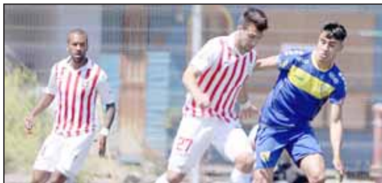
El próximo sábado Unión San Felipe buscará dejar en el olvido la derrota de la fecha pasada ante el AC Barnechea.