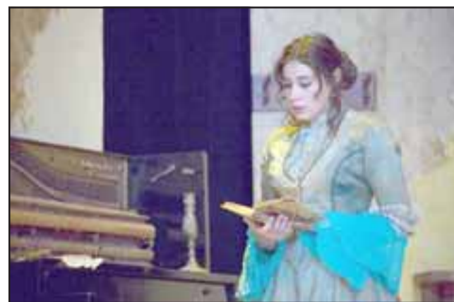
La gran obra que remeció al siglo XIX se presenta en el Teatro Nacional Chileno de la Facultad de Artes de la Universidad de Chile, entre el 18 de octubre y el 24 de noviembre, con funciones de miércoles a sábado a las 20:00 horas.

Hoy es el Teatro Nacional Chileno, en su histórico recinto de Morandé 25, donde cobrará vida la obra del sanfelipeño Caldera,