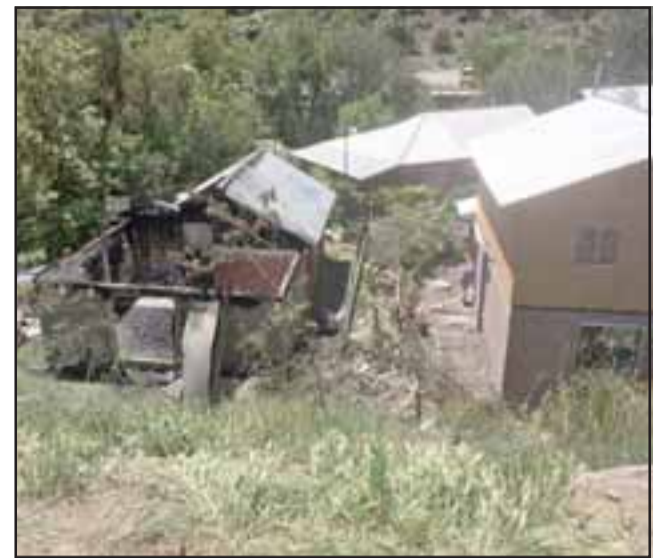
Fiscalía inició una investigación por estos hechos ocurridos al interior de un inmueble en la localidad de Río Blanco, el que resultó totalmente destruido por el fuego.