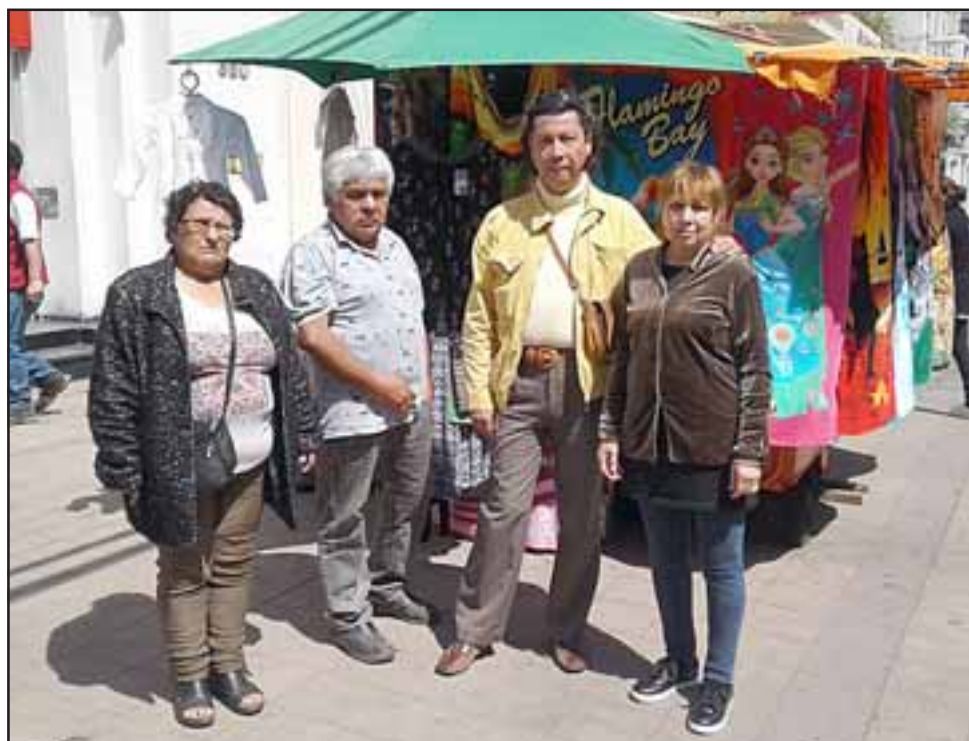
Los Comerciantes dueños de carros.

- Claro, si el carro es algo tradicional y ya no está dando para subsistir, francamente en dos meses más nos vamos a comer todo el capital, yo vivo con mi pareja, tenemos hijos estudiando, en la casa se gastan