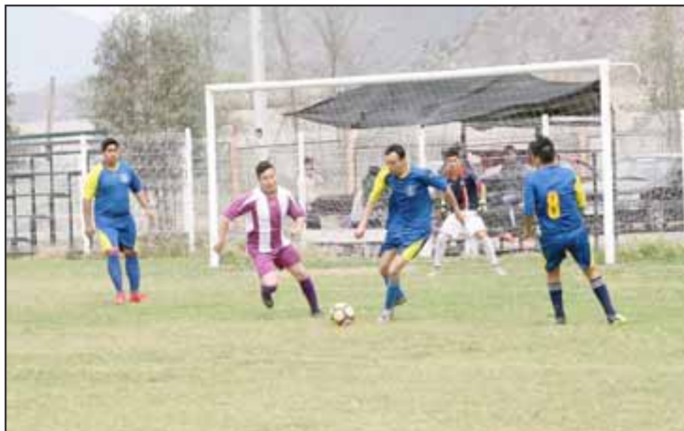
El fútbol aficionado sanfelipeño por ahora no tiene subvención municipal.