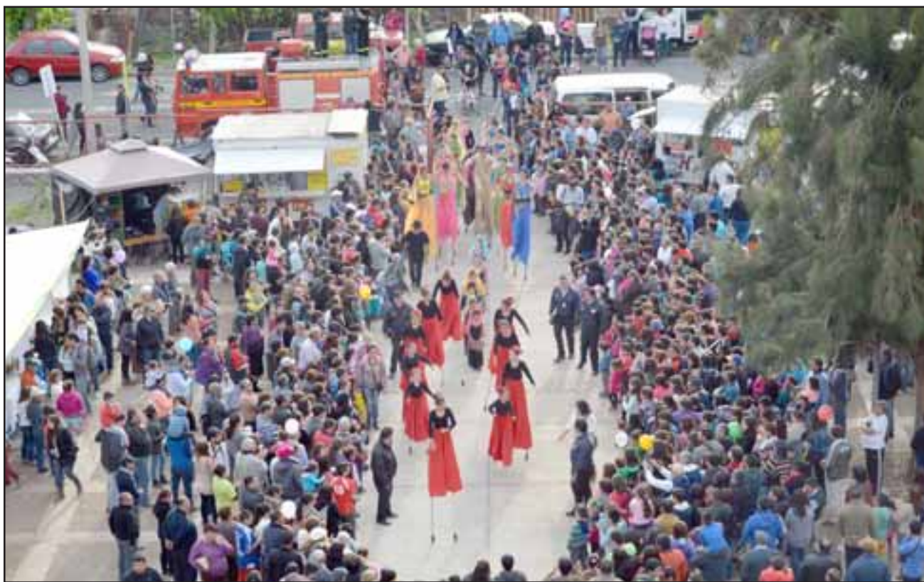
FERIA DEL OLIVO 2018.- Miles de personas son las que se esperan durante este fin de semana en Santa Filomena.