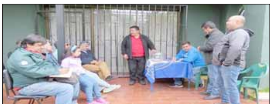
En el sorteo realizado en Viña del Mar, se determinó que Santa María deberá medirse con su similar de Santa Inés.

chas, ya que en este país reina la burocracia”, culminó.