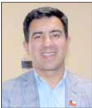
Sergio Salazar, gobernador de Los Andes.

LOS ANDES.- Solo con el apoyo de la fuerza pública, específicamente Carabineros, fue posible finalmente dar cumplimiento a la orden judicial de retiro del caballo que había sido maltratado en la comuna de Calle Larga.