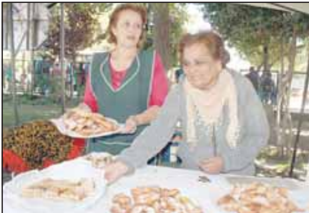
BUEN SABOR.- Ellas son reposteras, preparan ricos pasteos y también ganan su dinerito con este oficio.