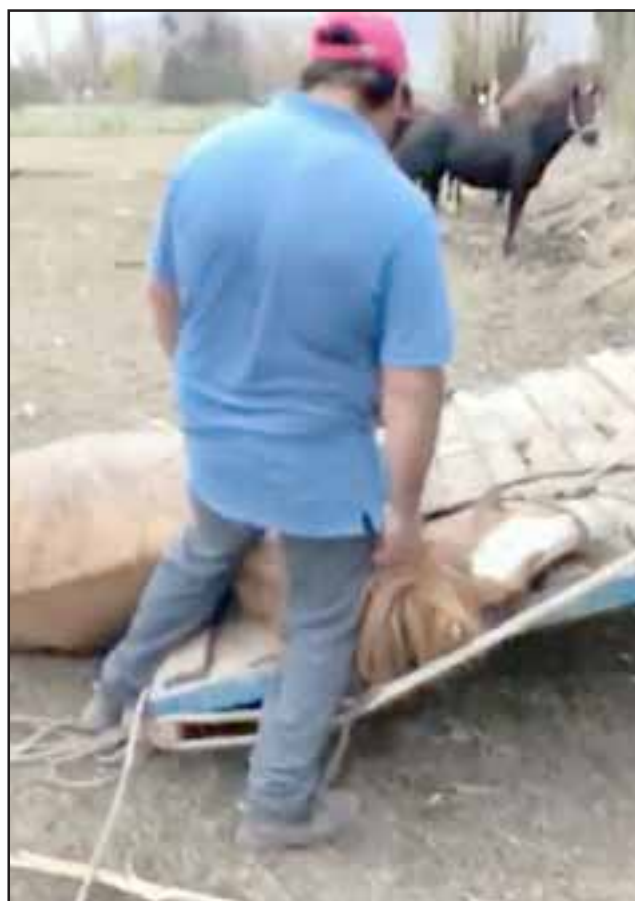
El caso se remonta a junio de este, cuando el animal fue golpeado para forzarlo a subir a un camión.

Salazar señaló que el dueño de la yegua tiene otros siete animales, pero