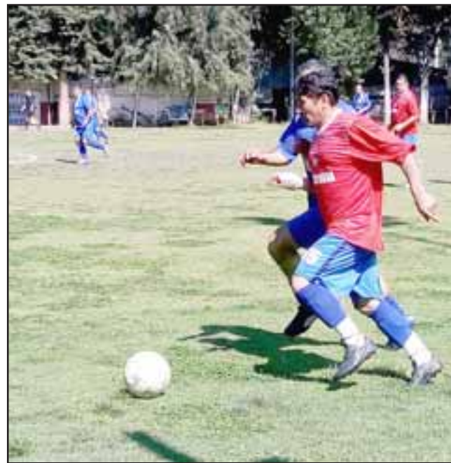
Jugadas ya diez fechas de la competencia dominical de la Liga Vecinal, siete son los equipos que hacen diferencias en la cancha Parrasía.

Un peldaño más abajo aparecen Santos, Los Amigos y el hasta ahora sorprendente Unión Esfuerzo,