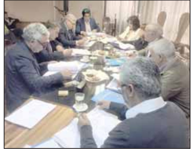
Los recursos alcanzan los 250 millones de pesos y es el inicio de un trabajo que permitirá posteriormente realizar las obras de mejoramiento que necesitan todos los establecimientos municipales de la comuna de San Felipe.

«Lo que busca este diagnóstico es poner en regla o bajo norma los