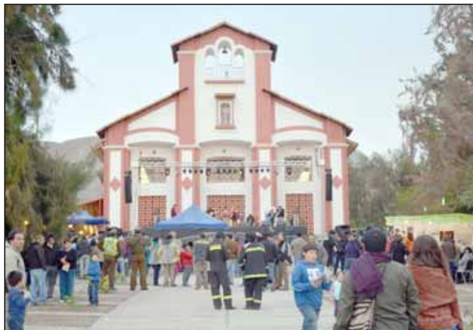
IMPERDIBLE.- Muchos productos artesanales, artistas locales y de fuera, así como alimentos de producción local es lo que ofrecerá esta 4ª la Feria del Olivo 2018.