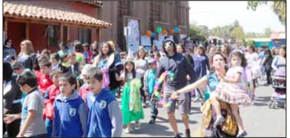
Este es el gran desfile que desarrollaron en el centro de la comuna, la actividad organizada por la Oficina de Protección de Derechos de la Infancia (OPD) y la Municipalidad de Putaendo.

El segundo 'Carnaval del Buen Trato' fue el resultado de una labor constante. Durante agosto y septiembre el equipo de la OPD, la Unidad de Convivencia Escolar del Daem y el Programa Habilidades Para la Vida (Que lo ejecuta el Cesfam de Putaendo), realizaron Talleres del Buen Trato con los primeros y segundos básicos de los diferentes establecimientos educacionales. De esta forma, los estudiantes reflexionaron y aprendieron