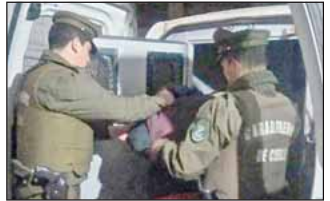
Carabineros efectuó la fiscalización vehicular el pasado 22 de abril del 2017, incautando las especies reportadas por robo en Los Andes.

Pese a las pruebas rendidas en juicio oral a cargo del Fiscal Rodrigo Zapata Cuéllar, los jueces se pronunciaron en su veredicto que existirían dudas razonables respecto a la imputación de cargos contra el acusado, resolviendo absolverlo de este delito.