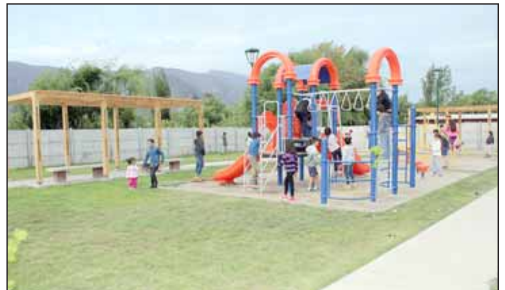
Los niños son los más felices con el nuevo espacio que les permitirá jugar y disfrutar en un lugar seguro y confortable.

de vida de las familias. Esta Villa inaugurada en el 2016, no contaba con un lugar de esparcimiento, por lo tanto será de gran utilidad».