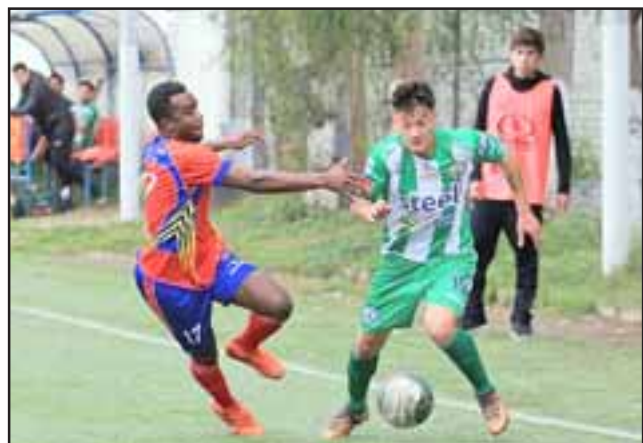
Los andinos ahora tienen pocas chances de clasificar a la liguilla del ascenso.