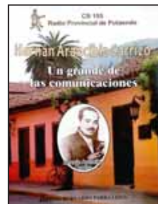
INTERESANTE OBRA.- Esta es la portada del libro ' Hernán Arancibia Carrizo, un grande de las comunicaciones '.