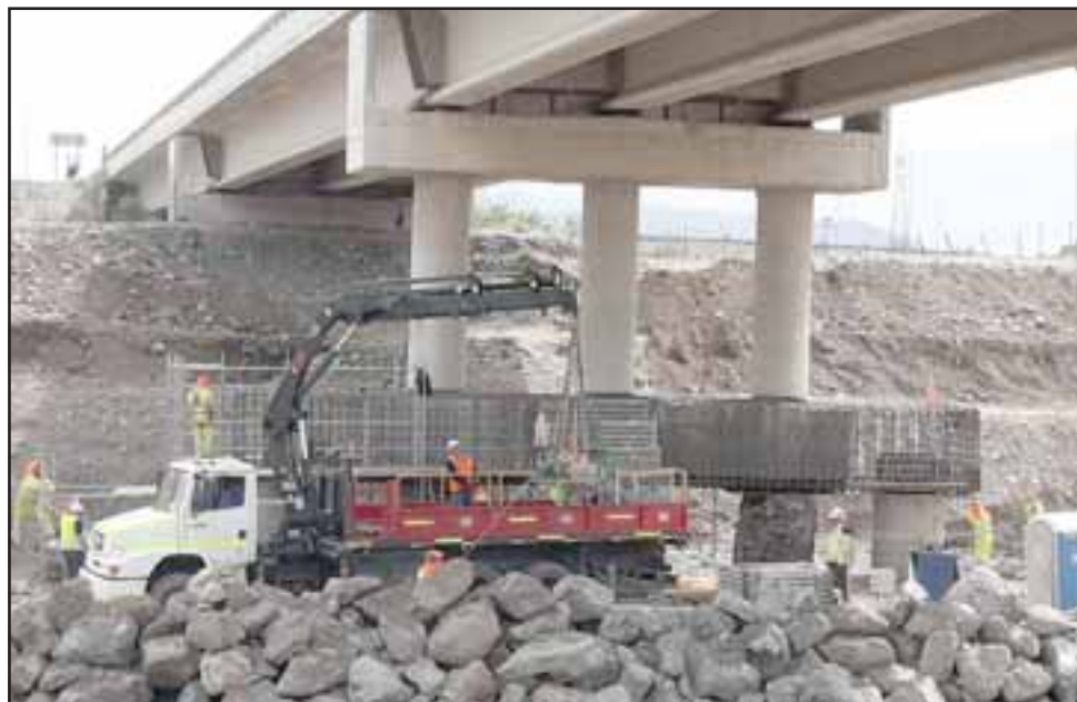
Trabajadores de la empresa trabajando en el lugar donde se instalaron los nuevos pilotes para reforzar la estructura.

Los trabajos se están realizando a raíz que el puente se dañó: «La cepa, la base del puente, se socavó por un desvío que hubo en el río por una explotación de áridos, ese es un tema que está manejando la DOH, este socavamiento adelgazó en el fondo las bases del puente y eso empezó a generar un proble-