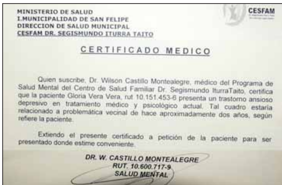
ANGUSTIA EXTREMA.- Este es uno de los dictámenes médicos en los que se certifica el estrés extremo que sufre esta vecina a causa del problema vecinal que enfrenta en Villa Esplendor.