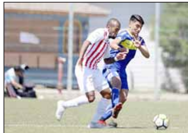
Este sábado los aconcgüinos están obligados a ganar a Cobresal.