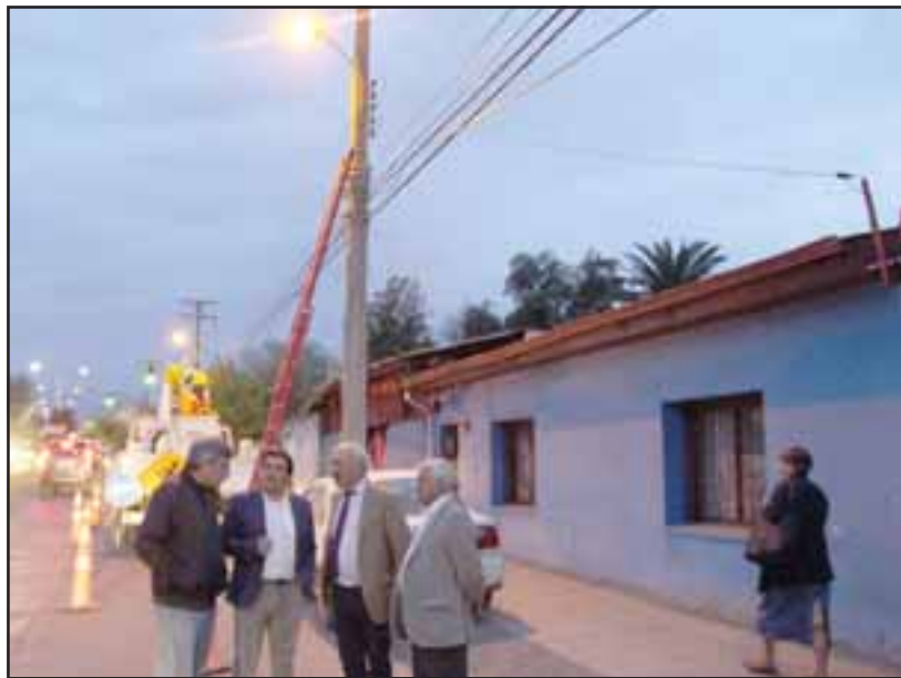
Autoridades presentes en el cambio de luminarias que en esta cuarta y última etapa se está desarrollando principalmente en las avenidas como Tocornal, Miraflores y Yungay.

blico es cercano al 70% de su consumo total de energía.