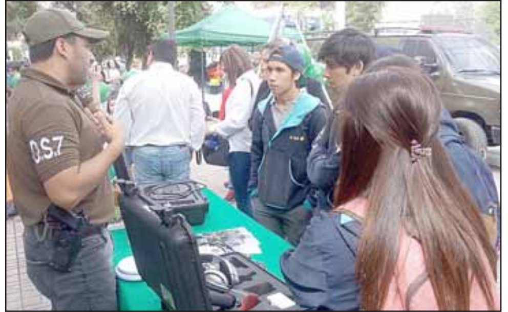
Cerca de 500 estudiantes que asistieron a la muestra, pudieron conocer directamente el trabajo que realiza el OS7 en el combate contra el narcotráfico.