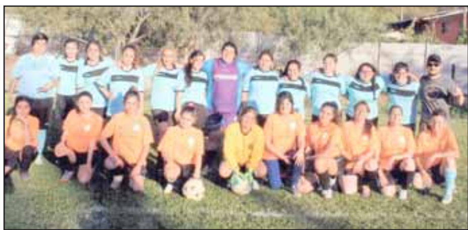
Estas entusiastas chicas son parte de la rama femenina del club O'Higgins de Las Coimas.