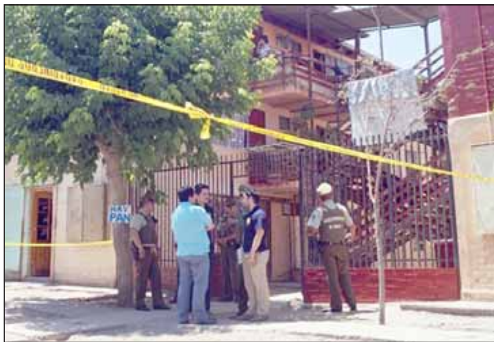
OTRA VEZ.- Una vez más la Villa San Alberto es escenario de un violento crimen que vuelve a afectar a ciudadanos de origen colombiano. (Foto archivo).

Tampoco el jefe de Homicidios de la PDI dio a conocer detalles de la víctima, no se conoce por el momento si el colombiano J.H.C. estaba en nuestro país en calidad de turista, si era un camionero o bien un residente permanente en Chile, lo cierto del reporte policial es que bien fue-