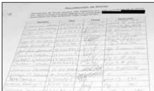
PIDEN SOLUCIÓN.- Aquí vemos parte de la gran lista de firmas de vecinos, quienes solicitan a las autoridades una solución al conflicto.