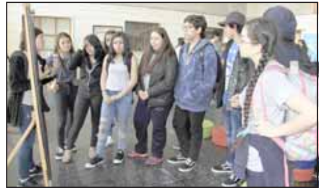
La exposición ya ha sido vista por más de 4 mil personas en la región.

en la cultura y las artes. Queremos invitar a los alumnos del sector municipal y de los otros sectores sin distinción».