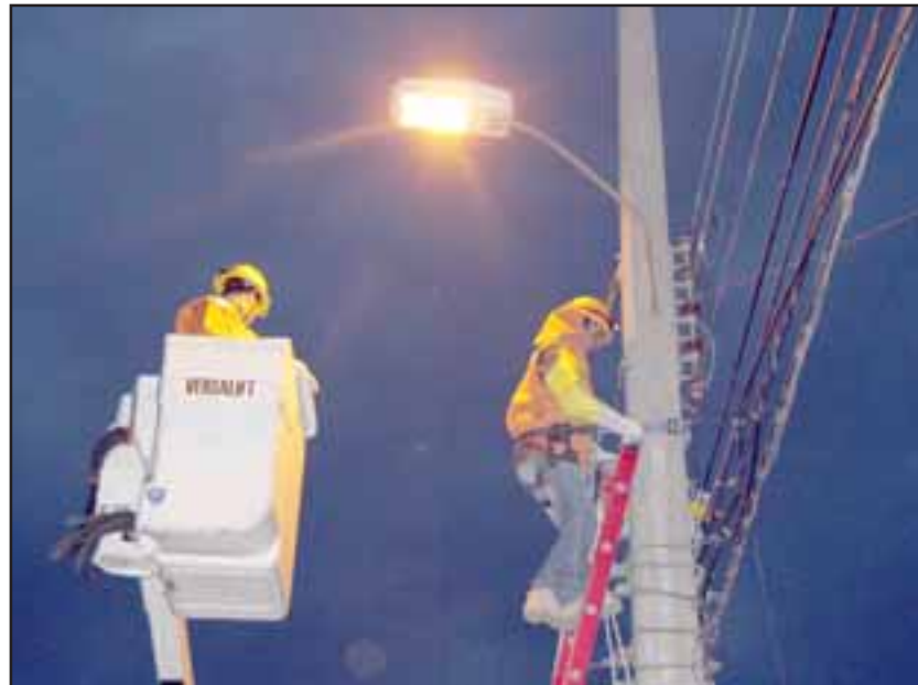
Trabajadores en pleno proceso de cambio de focos de esta cuarta etapa que contempla reemplazar 1.639 luminarias viales con diferentes potencias.

Lo anterior adquiere relevancia si se considera que en Chile el consumo energético de un municipio por concepto de alumbrado pú-