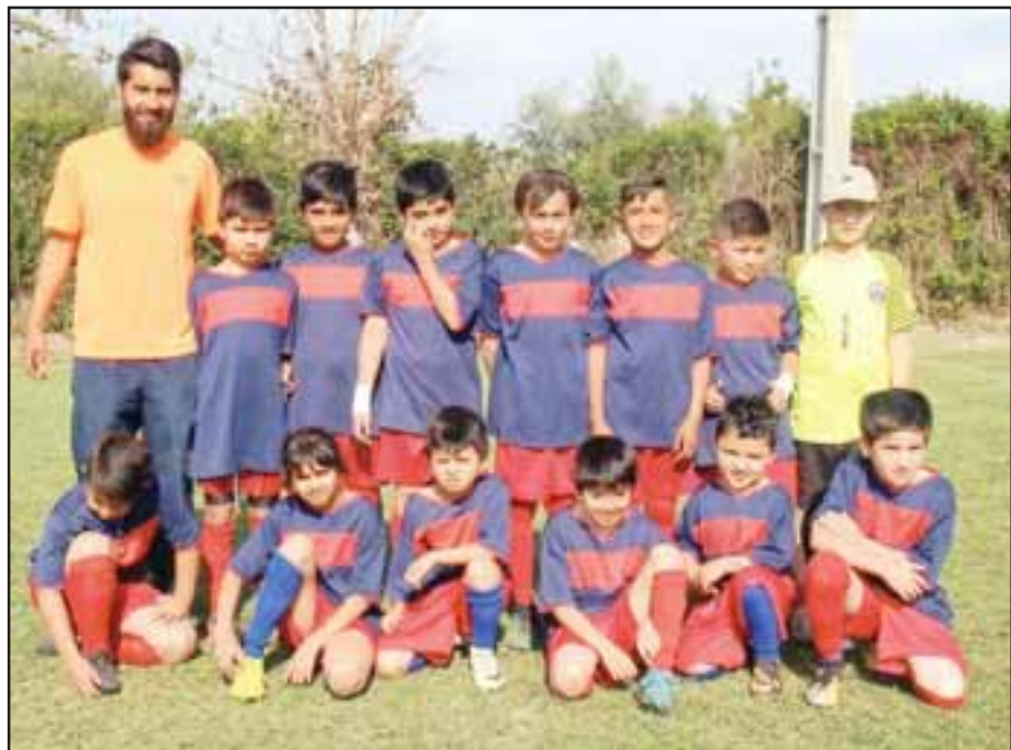
Estos son los niños que integran el equipo más pequeño del club El Tambo.

Como es costumbre hace ya largos años, las imágenes de estos deportistas fueron proporcionadas por nuestro amigo y colaborador: Roberto 'Fotógrafo Vacuna' Valdivia.