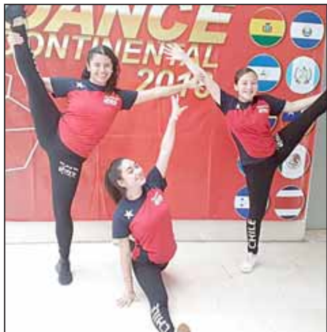
Algunas de las integrantes femeninas muestran sus habilidades en el arte de la danza.

mundiales, ya empezamos a generar actividades casi todos los meses para tener siempre fondos para este tipo de actividades: bingos, galas, rifas y desde un tiempo a esta hora empresas han sido nuestros auspiciadores, que eso nos ayudó bastante a conformar y reunir todos los fondos que necesitábamos.