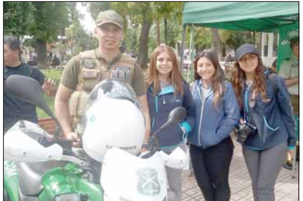
Las comisarías de San Felipe y Los Andes se hicieron presentes con muestras de vehículos Dodge y motos todo terreno.