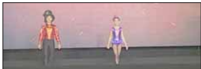
Una de las parejas terminando su actuación en el Continental de Danza realizado en Panamá.