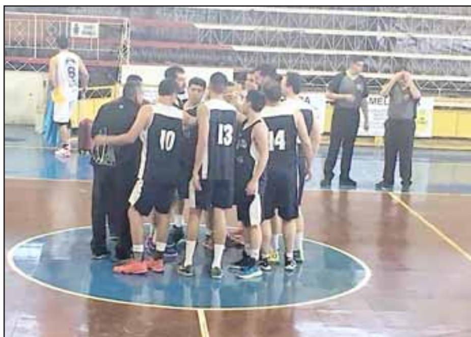
El quinteto pratino buscará sumar su tercer triunfo consecutivo.

12:30 horas: Santa Inés (Viña del Mar) – Santa María