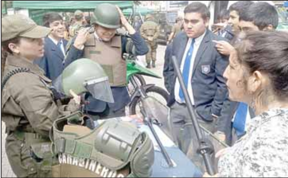
La sección de control del orden público permitió a los visitantes vestir cascos balísticos, escudos de protección y chalecos antibalas.

ros señaló que esta feria - abierta al público-, se enmarca en el programa de actividades nacionales que desarrolla su Departamento de Reclutamiento y Selección, para celebrar el Día del Postulante a la institución uniformada.