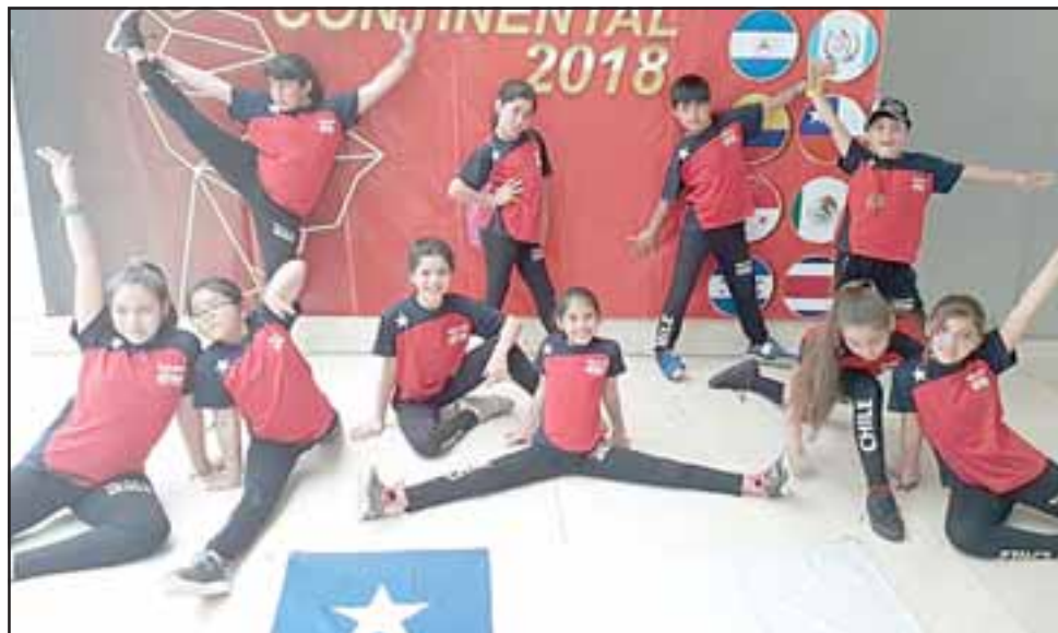
Integrantes de la Academia de Danza 'Media Punta' posando para los fotógrafos junto a la bandera nacional.

- Claro, porque es una forma extraña para este tipo de deportes, poder reunir los recursos casi tiene que salir del bolsillo de cada una, desde el año pasado que fuimos a Orlando y salimos campeones, también