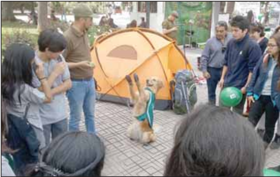
El perro antidrogas se convirtió en la estrella del evento, despertando muestras de admiración y cariño entre el numeroso público que presenció la muestra.