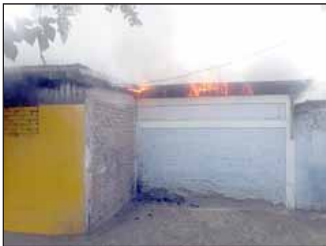
El fuego se originó en forma intencional y afectó los camarines que colindan con la piscina del Estadio Fiscal.

Un incendio intencional a decir de bomberos, afectó a los camarines del Estadio Fiscal de San Felipe. El siniestro se produjo el día sábado pasadas las siete de la tarde.