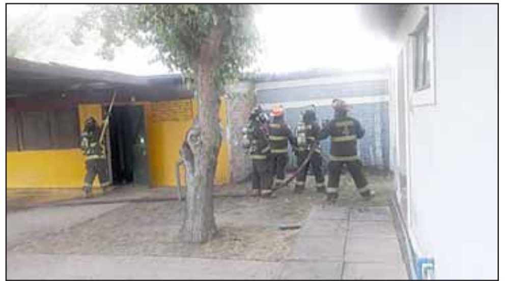
Alrededor de 35 voluntarios de Bomberos debieron trabajar arduamente para controlar el incendio.