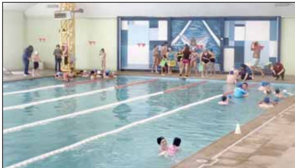
Alrededor de 60 alumnos de la Escuela Especial Sagrado Corazón participan del programa de hidroterapia, lo que les permite permanecer durante una hora a la semana practicando natación.

"Esta es una actividad nueva para los niños, porque no todos podían hacerlo por su cuenta y este es el cuarto año que postulamos, ahora como Sagrado Corazón. Haber postulado este año fue un gran logro, porque fueron muchos los grupos que participaron y quedamos entre ellos, así que gracias a Anglo Ame-