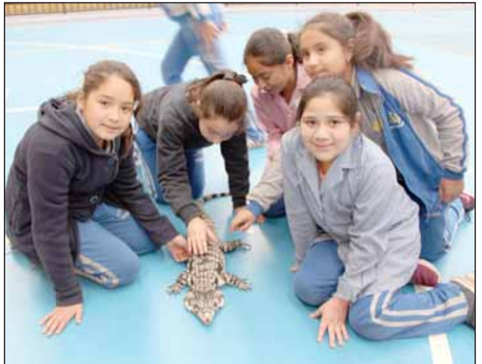
Las especies fueron ubicadas en el gimnasio del liceo, hasta donde llegaron las alumnas divididas en grupos para conocer de cerca y tocar a este reptil, además de la serpiente pitón, el loro y una inmensa tortuga.