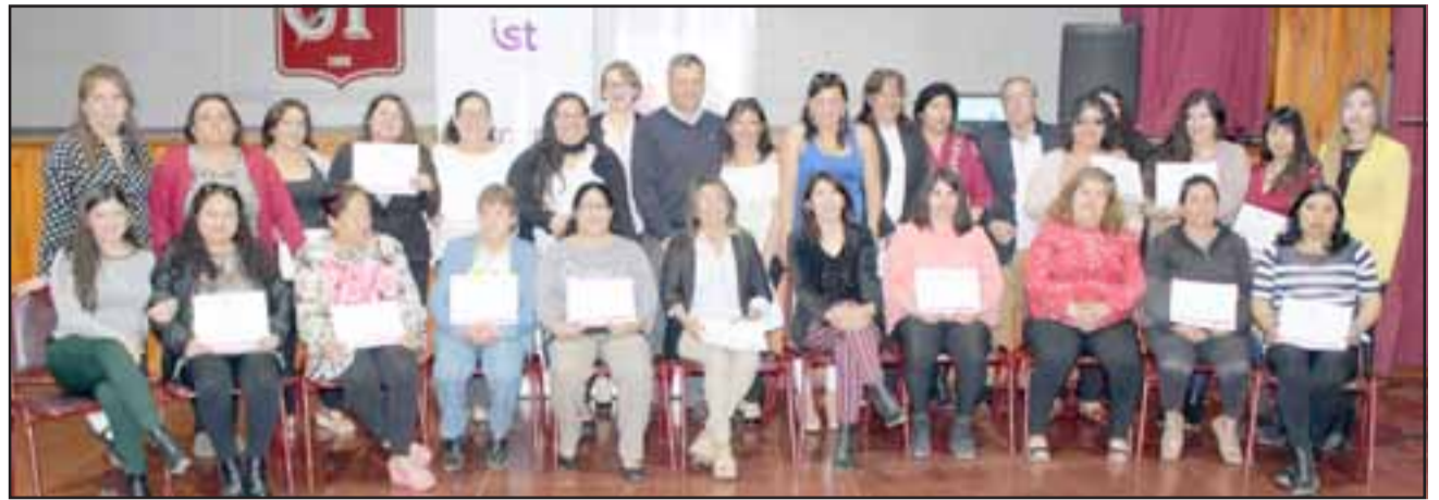
En total fueron 28 las mujeres certificadas en el curso de manipulación de alimentos impartido por el Instituto de Seguridad del Trabajo a instancia del programa Mujeres Jefas de Hogar de Panquehue.

«El curso consistió en la realización de nueve horas de capacitación, donde estuvo un ingeniero en alimentos que les enseñó las técnicas básicas como los conceptos legales de la manipulación de alimentos, con los cuales ellas se pueden desarrollar en una actividad de caracterís-