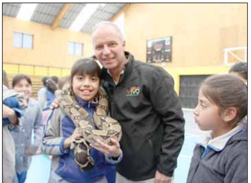
Los animales son educados con una técnica que se llama 'impronta', por lo que están acostumbrados a que los niños los toquen y son absolutamente inofensivos.