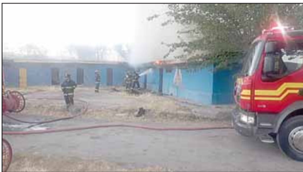
Hasta el lugar debieron concurrir voluntarios de las compañías Primera, Cuarta y Quinta.

habían visto a unas personas en ese sector. En el lugar había acumulación de colchones, ropa de gente que duerme en esos camarines, a ratos vieron una gran cantidad de humo, llamaron a bomberos y efectivamente la posibilidad de que cien por ciento que haya sido intencional no se descarta, ya que los camarines no tenían corriente, así es que es muy probable que haya sido intencional», señaló.