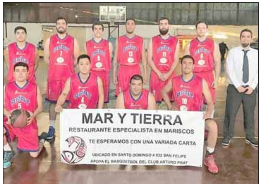
De a poco los pratinos comienzan a mejorar en el torneo correspondiente a la serie B de la Liga Nacional de Básquetbol.