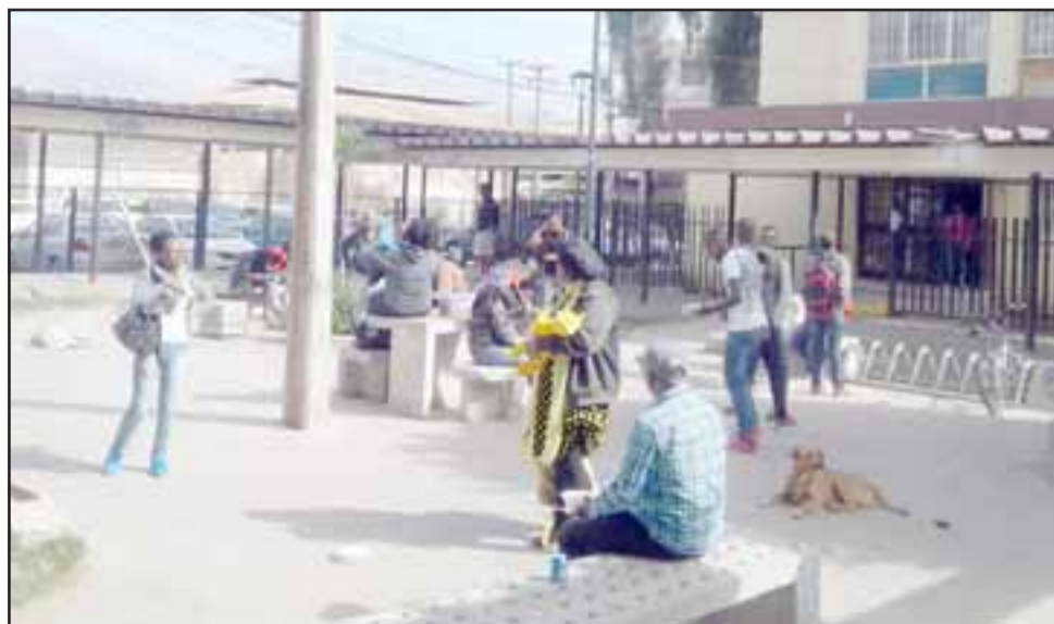
Hasta el momento sesenta ciudadanos haitianos han solicitado regresar a su país, acogidos a los beneficios de la denominada ‘Operación Retorno’.

A nivel general, entre las causas principales para volver a su país, está la falta de trabajo en Chile, lo que no cumplió con sus expectativas que tenían cuando decidieron venirse a nuestro país.