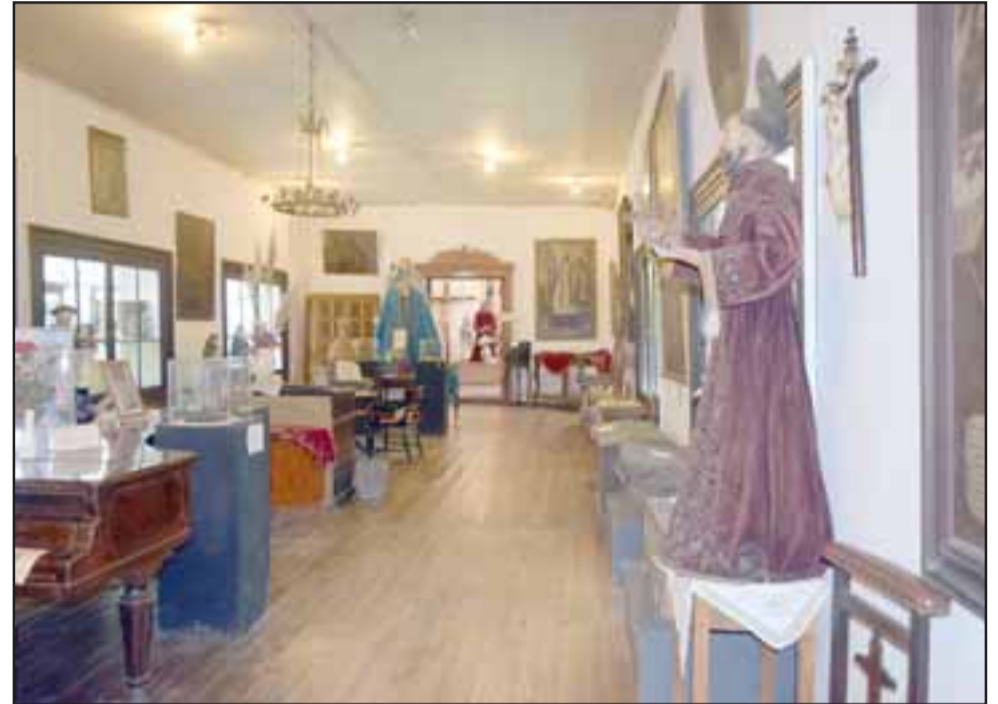
El Museo de Curimón y su templo son un monumento nacional de gran valor patrimonial que sufrió severos daños tras el terremoto de 2010.