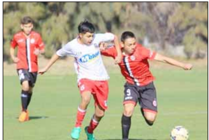
Poco productivo fue el regreso de las series cadetes de Unión San Felipe al torneo de Fútbol Joven de la ANFP.

U19: Unión San Felipe 3 - Unión La Calera 4