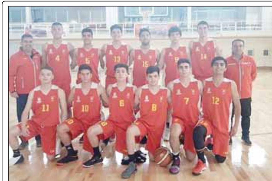
La selección masculina menor de 17 años de San Felipe terminó penúltima en el nacional de la categoría realizado en Punta Arenas.