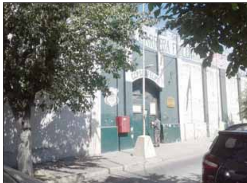
El frontis de la cárcel de San Felipe lucía ayer con un enorme lienzo en la parte superior relativo al paro.

Consultado sobre los motivos del paro, dijo que fundamentalmente es la carrera funcionaria del personal; "ya que esta no existe, dentro de Gendarmería de Chile tenemos gente con más de veinte años de servicio y son todavía cabos primero, lo mismo pasa con la planta uno de oficiales y para qué vamos a decir de la olvidada planta tres, que