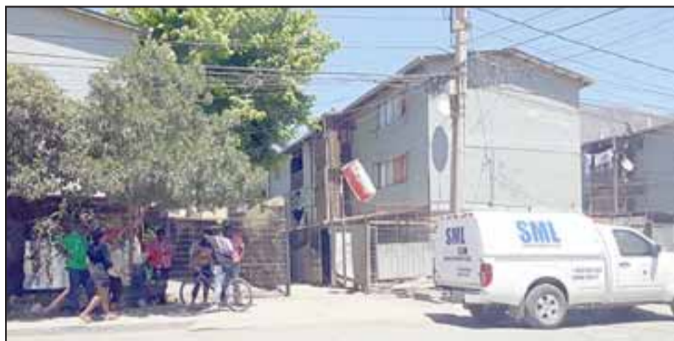
En horas de la mañana de ayer lunes el cuerpo de la ciudadana haitiana de 36 años de edad fue levantado por el Servicio Médico Legal de San Felipe para la práctica de la autopsia de rigor.