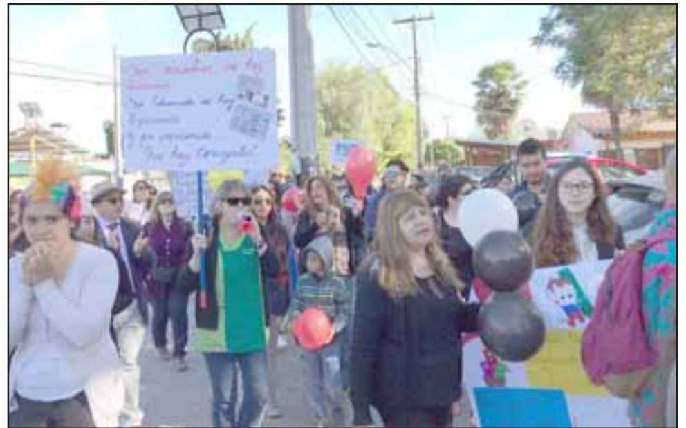
Los docentes realizaron una inédita protesta en el frontis del edificio consistorial contra los concejales que rechazaron la modificación presupuestaria.

Por su parte, el alcalde Pedro Caballería, apoyó la protesta de los docentes que