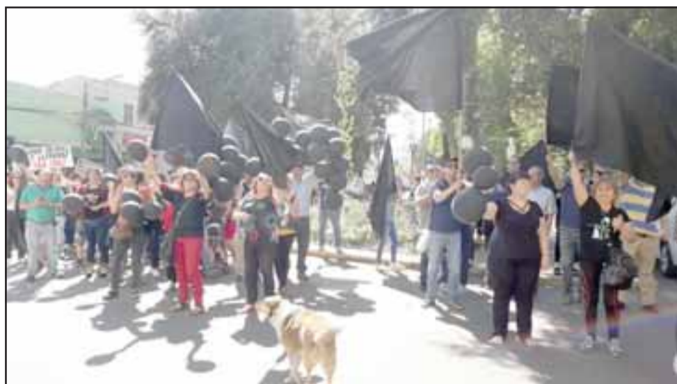
Los comerciantes se apostaron frente a la municipalidad de San Felipe.

Otros que dieron su parecer por lo perjudicial que ha sido este proyecto para ellos, fueron los transportistas escolares, quienes dijeron que en el colegio Alonso de Ercilla de calle Prat "no tenemos donde estacionarnos porque nos quitaron la señalización que dice