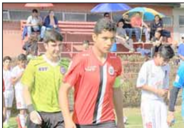
El jugador perteneciente a las canteras de Unión San Felipe, es parte del actual microciclo de entrenamientos de la selección U17.

Los trabajos de entrenamiento del combinado nacional se exten-