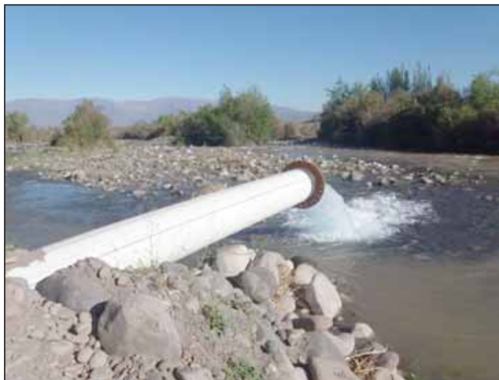
Andina aportó durante el fin de semana del orden de 500 litros por segundo de agua a la cuenca, desde sus pozos ubicados en la Primera Sección del Río Aconcagua.

gundo es de tabiquería de madera, lo que significó una inversión de más de $650 millones por parte del Ministerio de Vivienda y Urbanismo.