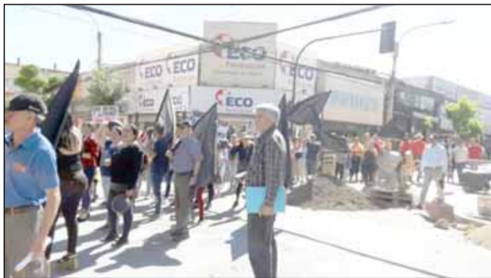
Los comerciantes marcharon por calle Prat hacia la municipalidad de San Felipe.

No hubo personas detenidas y luego todos se retiraron del lugar.