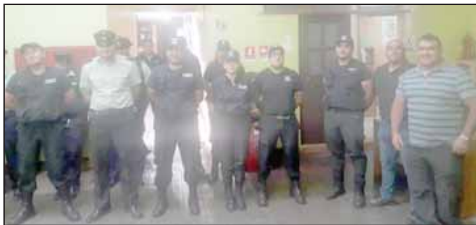
Personal del penal de San Felipe formado al interior de la cárcel.

en señalar que el problema no es con los usuarios sino que es una problemática a nivel país que involucra a Gendarmería.