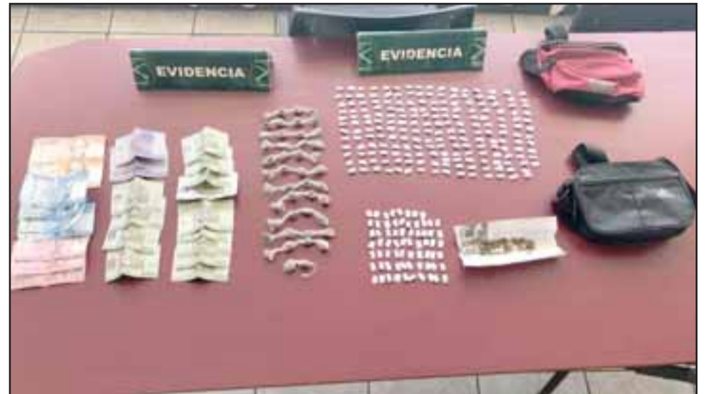
Personal de la SIP de Carabineros incautó papelillos de pasta base, bolsas de marihuana y dinero en efectivo en poder del imputado de 21 años de edad.

Según la información policial, mientras el conductor fue sometido a un control de identidad, los funcionarios policiales efectuaron una revisión dentro del móvil, descubriéndose que dentro de un banano, el imputado mantenía un total de 260 envoltorios de pasta