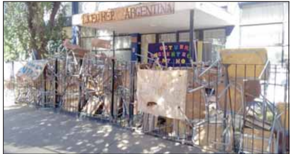
EN TOMA.- Así amaneció ayer el frontis del Liceo República Argentina, luego que los alumnos decidieran tomarse el establecimiento en rechazo al traslado a la Escuela España.

Enfatizó que no es culpa del liceo que la escuela España tenga capacidad para 600 alumnos y estén dando matrícula para más