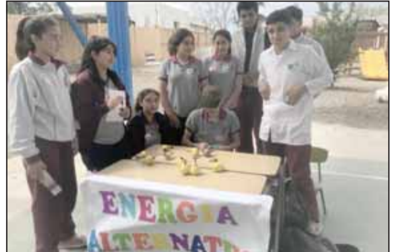
El uso de energías alternativas, a partir de papas o limones, fue uno de los tantos experimentos presentados en la feria.

Durante la feria los alumnos mostraron proyectos relacionados con el agua, la electricidad y el universo, entre otros temas, destacando el amplio manejo de la información en cada una de las áreas.