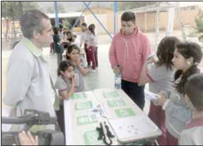
Esta es la primera feria científica que realiza la escuela y la evaluación es sumamente positiva, ya que los niños estudiaron sobre todos los experimentos.