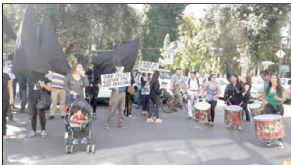
Hasta con batucadas se realizó la marcha contra las ciclovías.

transporte escolar, no tenemos cómo, al lado izquierdo están las ciclovías ¿cómo nos estacionamos? ¿Cómo sacamos los niños? eso es-