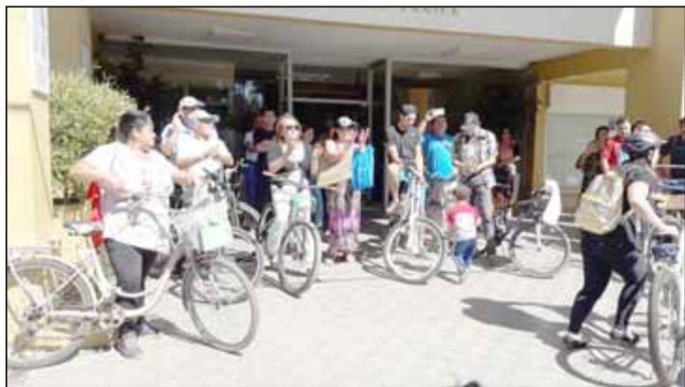
Un grupo de ciclistas que defiende las ciclovías también estuvo presente en el frontis de la municipalidad de San Felipe.