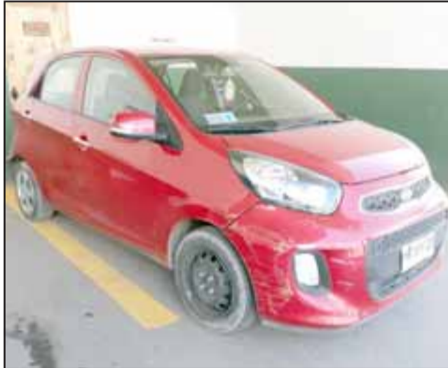
El vehículo incautado mantenía encargo por robo desde la comuna de Colina en la región Metropolitana.

base y 46 bolsas de marihuana elaborada, además de $146.000 en dinero en efectivo.