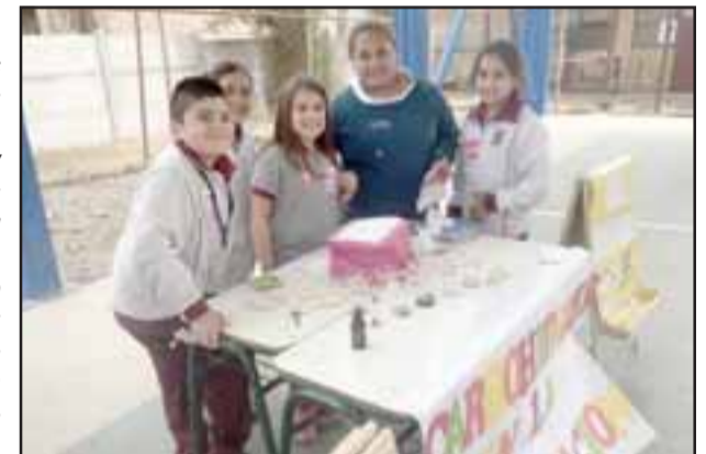
Estos pequeños posan felices y sonrientes frente a su trabajo relacionado con los carbohidratos en la alimentación.