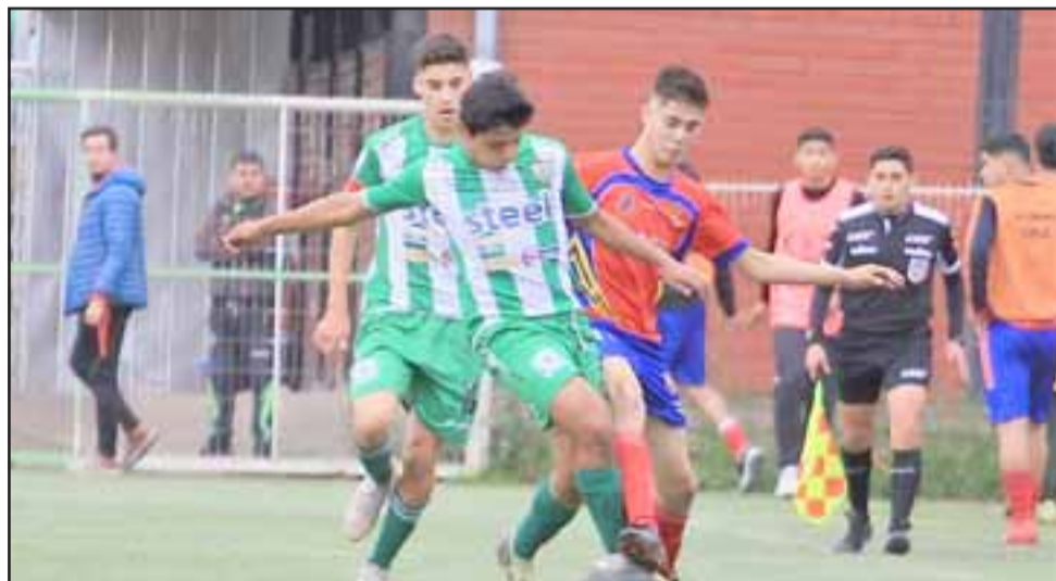
Trasandino no pudo dar con su objetivo de llegar a la liguilla de la Tercera A.