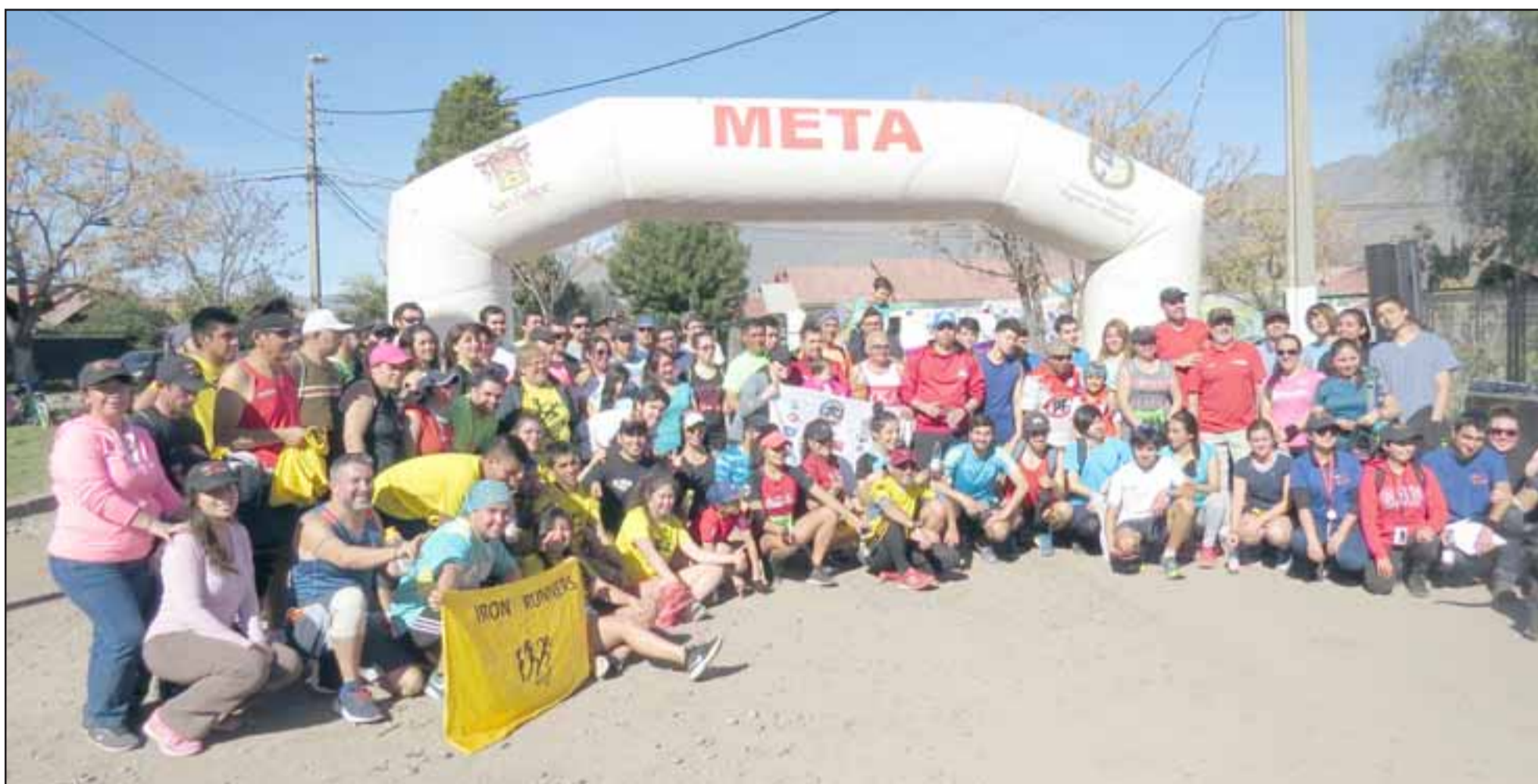
Corredores juntos después de finalizada una de las tantas maratones que han realizado, las que convocan a gran cantidad de participantes.