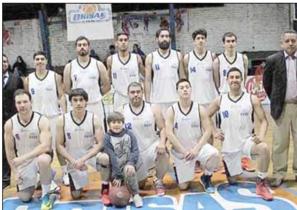
Un duro apronte espera mañana al Prat en la décima fecha del torneo B de la Liga Nacional.