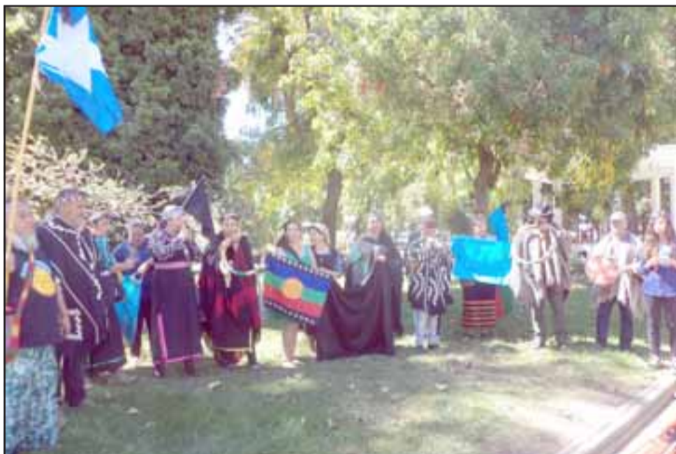
Los mapuches en la plaza de armas antes de iniciar el camino a la gobernación.

Luego, para terminar la actividad, el grupo de mapuches dio una vuelta por la plaza de armas de la ciudad de San Felipe.