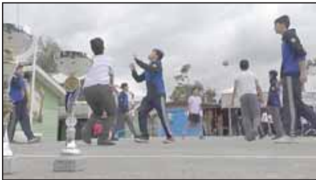
Los alumnos deben responder en lo académico para poder asistir a los entrenamientos, lo que favorece además su disciplina.

“Los logros deportivos también traen la motivación por participar en esta actividad, en el taller de voleibol tenemos 30 niñitos y ahora se incorporaron las damas y hoy en día debe haber unas 20 niñitas y en un futuro no muy lejano esperamos tener un representativo de damas también”, aseguró González.