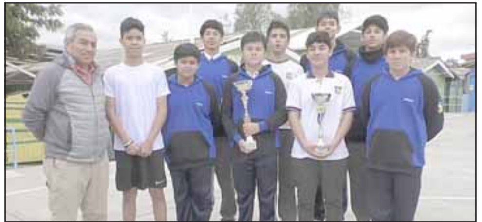
Con bastante éxito culminó el año la selección Sub 14 de voleibol de la Escuela José de San Martín.

“Ha sido muy bueno este año en realidad, es un trabajo bastante exigente,