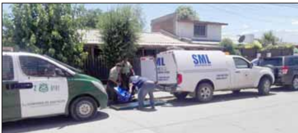
El cuerpo de la fallecida fue levantado por personal del Servicio Médico Legal para la autopsia de rigor que determine científicamente la causa de muerte.