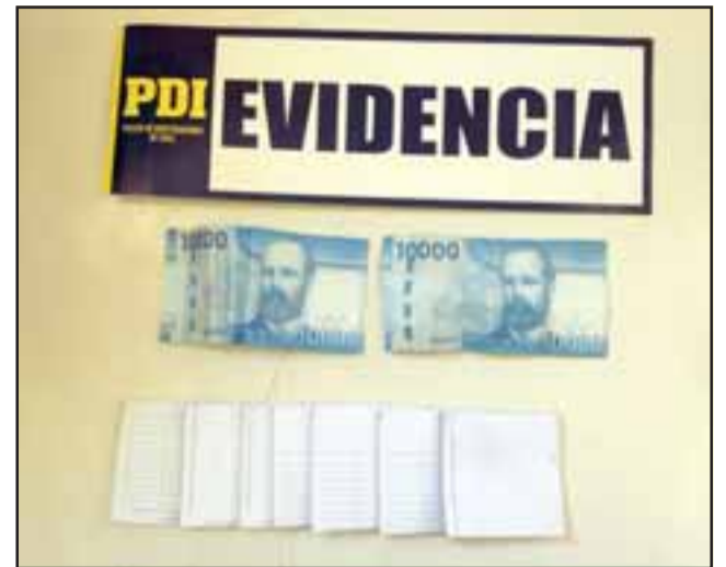
Los delincuentes embaucaron a la mujer diciéndole que habían ganado un premio, debiendo la víctima dejar una garantía en dinero y joyas para cobrar el boleto.

Añadió que con los antecedentes aportados por la víctima, al menos uno de los timadores sería extranjero por su acento, "y la otra te-