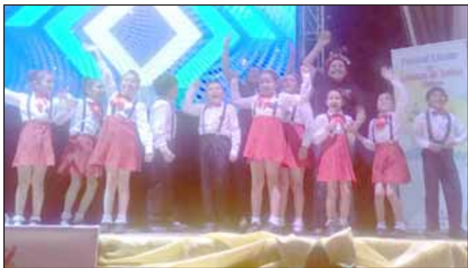
FESTIVALENSE.- El Tercero B del Liceo Cordillera ganó la segunda versión del Festivalense, el Festival en Lengua de Señas de la educación municipal de San Felipe.

teniendo que es la primera vez que la sede comunitaria sufre este tipo de robos, sin que hasta el momento se establezca la identidad de los autores del hecho.