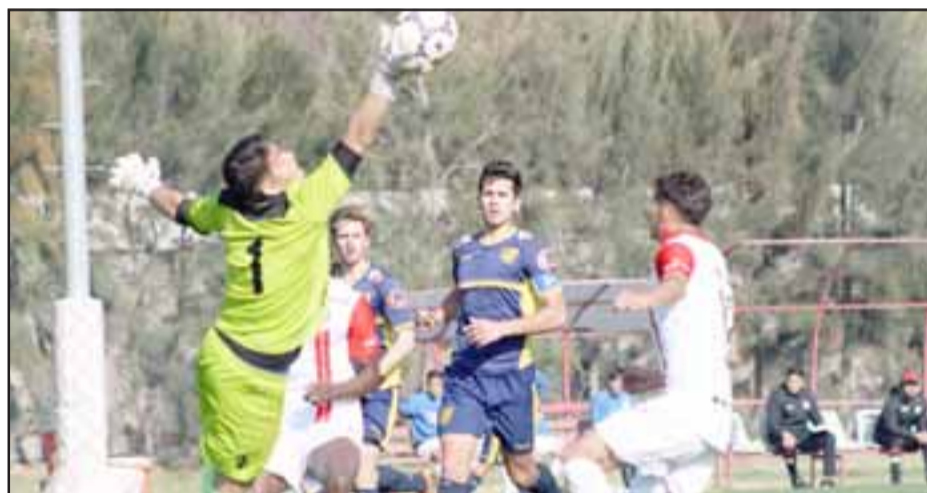
Los cuatro equipos juveniles de Unión San Felipe cerrarán su año midiéndose con sus similares de Santiago Morning.