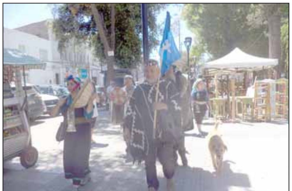
Los mapuches caminaron pacíficamente por la plaza de armas de San Felipe.