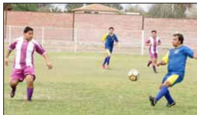
Este domingo se jugarán los partidos pendientes del torneo de la Asociación de Fútbol Amateur de San Felipe

Los juegos entre Juventud La Troya y Ulises Vera, se disputarán en cancha de los primeros, mientras que el de Mario Inostroza con Unión Delicias se jugarán en Curimón.