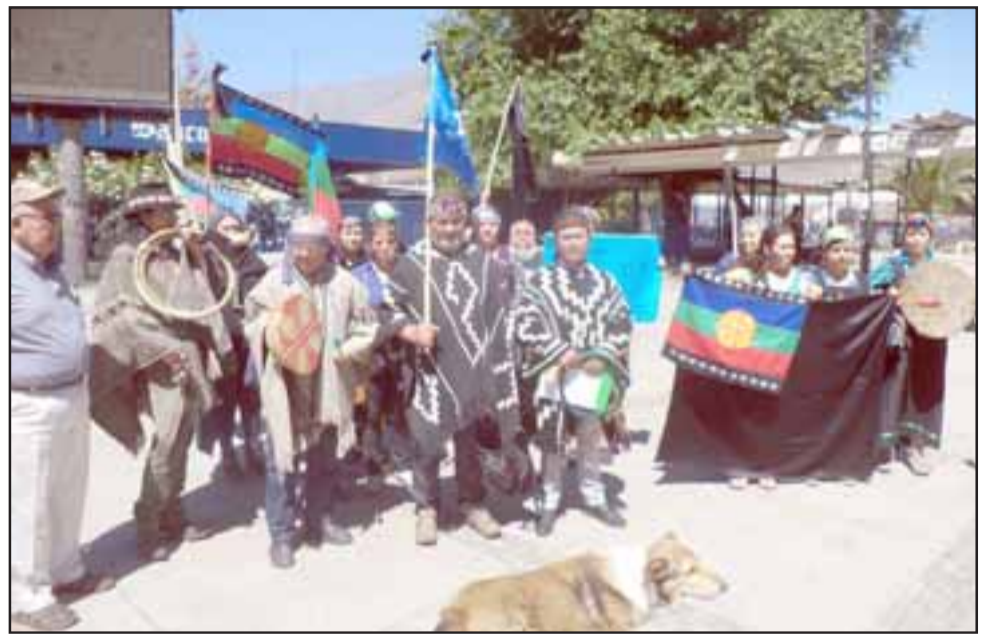
El grupo de mapuches en la plaza cívica antes de entregar la carta en la gobernación.

«Critizamos a los medios de Televisión Nacional, quienes no han proporcionado noticias verídicas, dando pie a especulaciones,