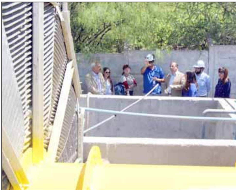
Se espera que el lunes 26 de noviembre se entregue la obra y los primeros días de diciembre ya esté funcionando.

do que nos garantiza la empresa que está ejecutando los trabajos».