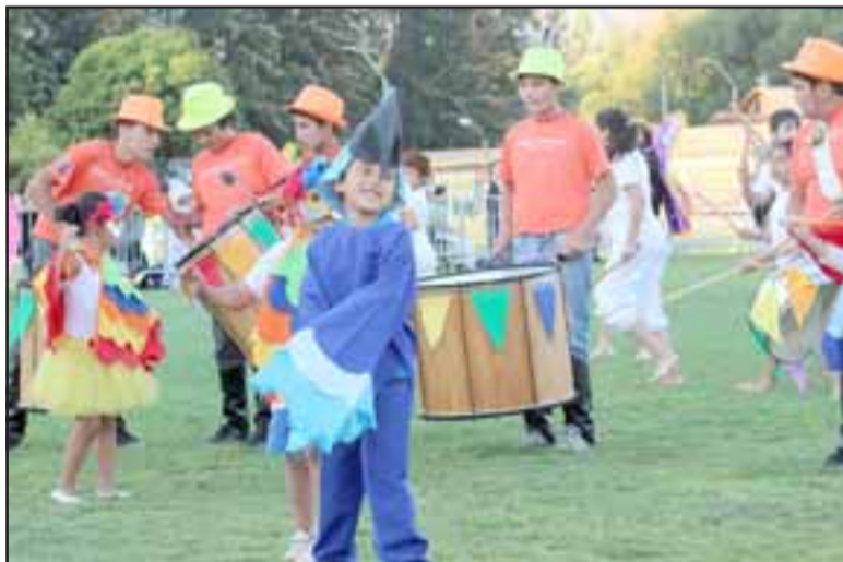
Alumnos de la escuela Fray Camilo Henríquez y el origen de la fiesta de Río de Janeiro.