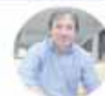
Lucas Palacios Subsecretario Ministerio de Obras Públicas