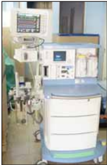
Uno de los nuevos equipos que llegaron al Hospital San Camilo.

CUANDO LAS OPORTUNIDADES SE TRANSFORMAN EN PANORAMAS