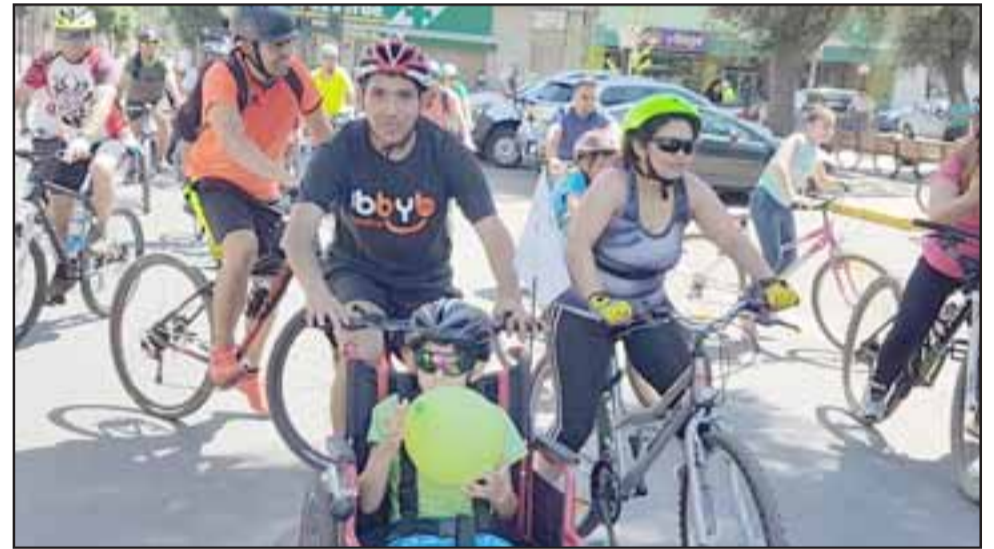
Una de las bicisillas que participó de la cicletada familiar.