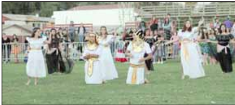
El Colegio Panquehue presentó un cuadro artístico denominado Unión Continental.