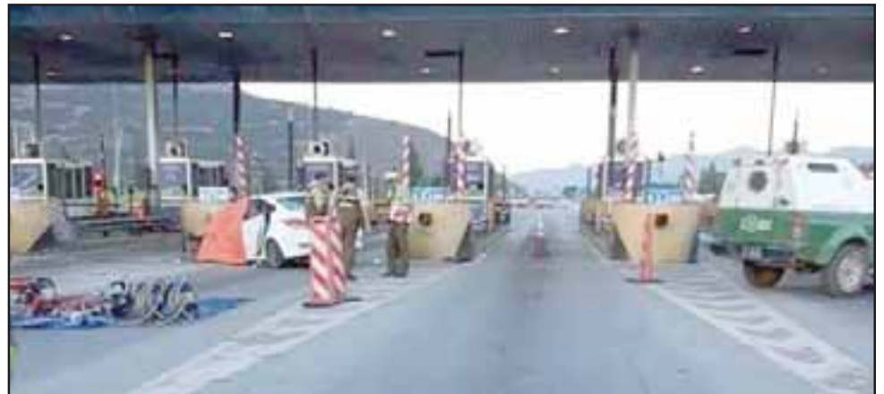
El accidente ocurrió a primeras horas de la mañana de ayer domingo en el Peaje Las Vegas de Llay Llay.

El fatal accidente ocurrió casi simultáneamente al ocurrido en la comuna de Santa María (ver nota aparte), a eso de las 06:15 horas de la mañana de ayer domingo, en circunstancias