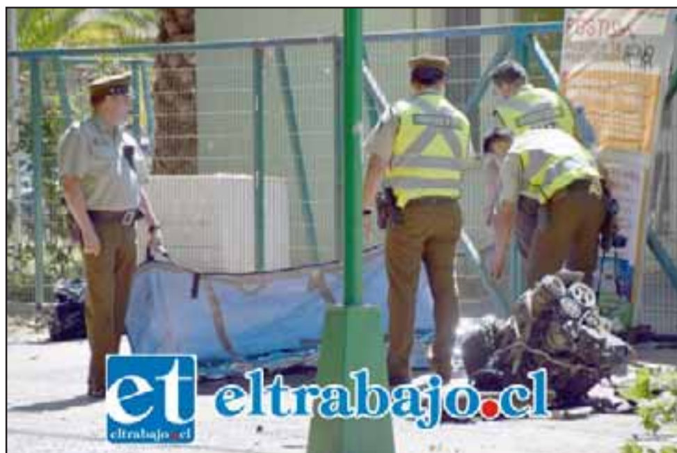
Personal de la Siat de Carabineros efectuando las pericias en el sitio del suceso para determinar las causas basales del accidente. A un costado, como mudo testigo, el motor del vehículo que se desprendió del chasis debido al violento impacto.