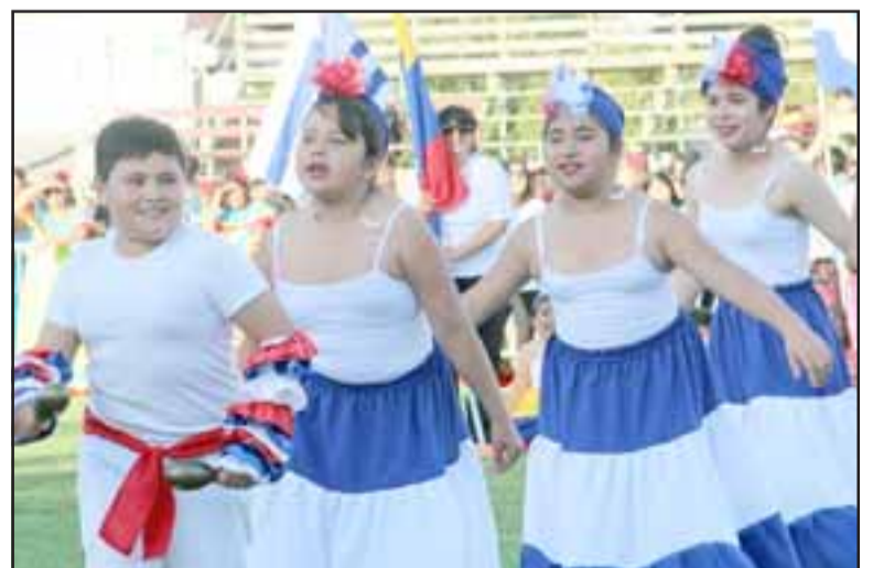
La escuela Independencia con la música y bailes de Latinoamérica.