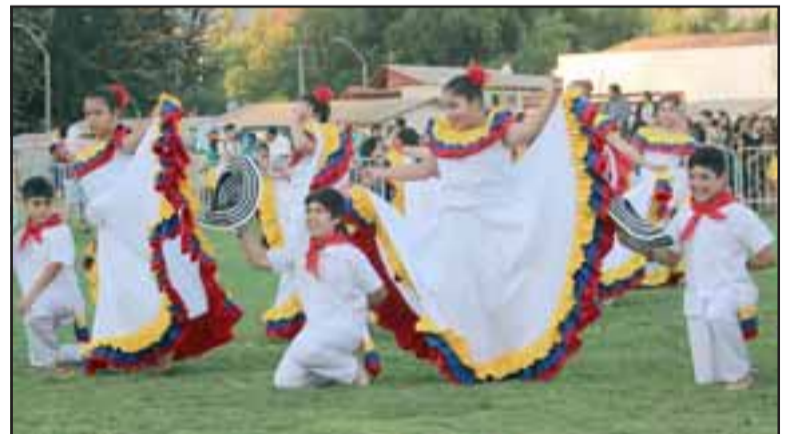
La escuela Emilia Lobos Reyes presentó bailes de países hermanos como Brasil, Colombia, México y Chile.

Finalmente el Colegio Panquehue realizó la presentación de un cuadro artístico denominado Unión Continental.