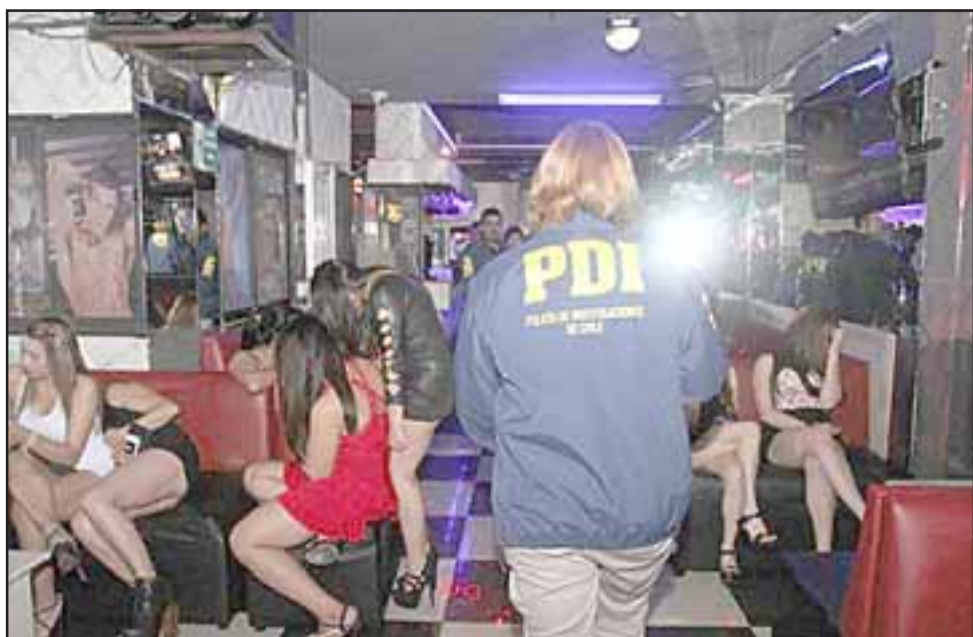
En este procedimiento, la policía civil detectó un total de 57 personas de diferentes nacionalidades, de las cuales 8 registraban antecedentes policiales. (Foto referencial).