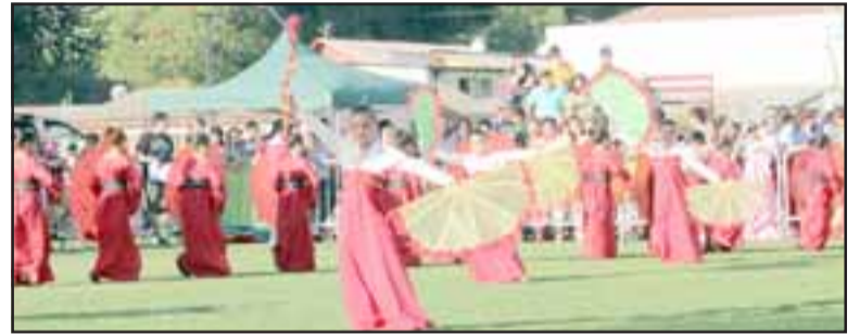
Escuela Viña Errázuriz y el enigmático continente asiático.

En tanto la escuela Fray Camilo Henríquez compartió el origen de la fiesta de Río de Ja-