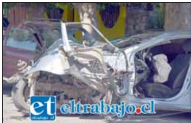
El Hyundai resultó prácticamente desintegrado en su parte delantera debido a la violencia del impacto.