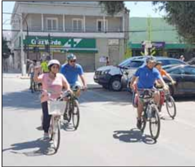
Ciclistas entusiasmados tras llegar a la Plaza de Armas.