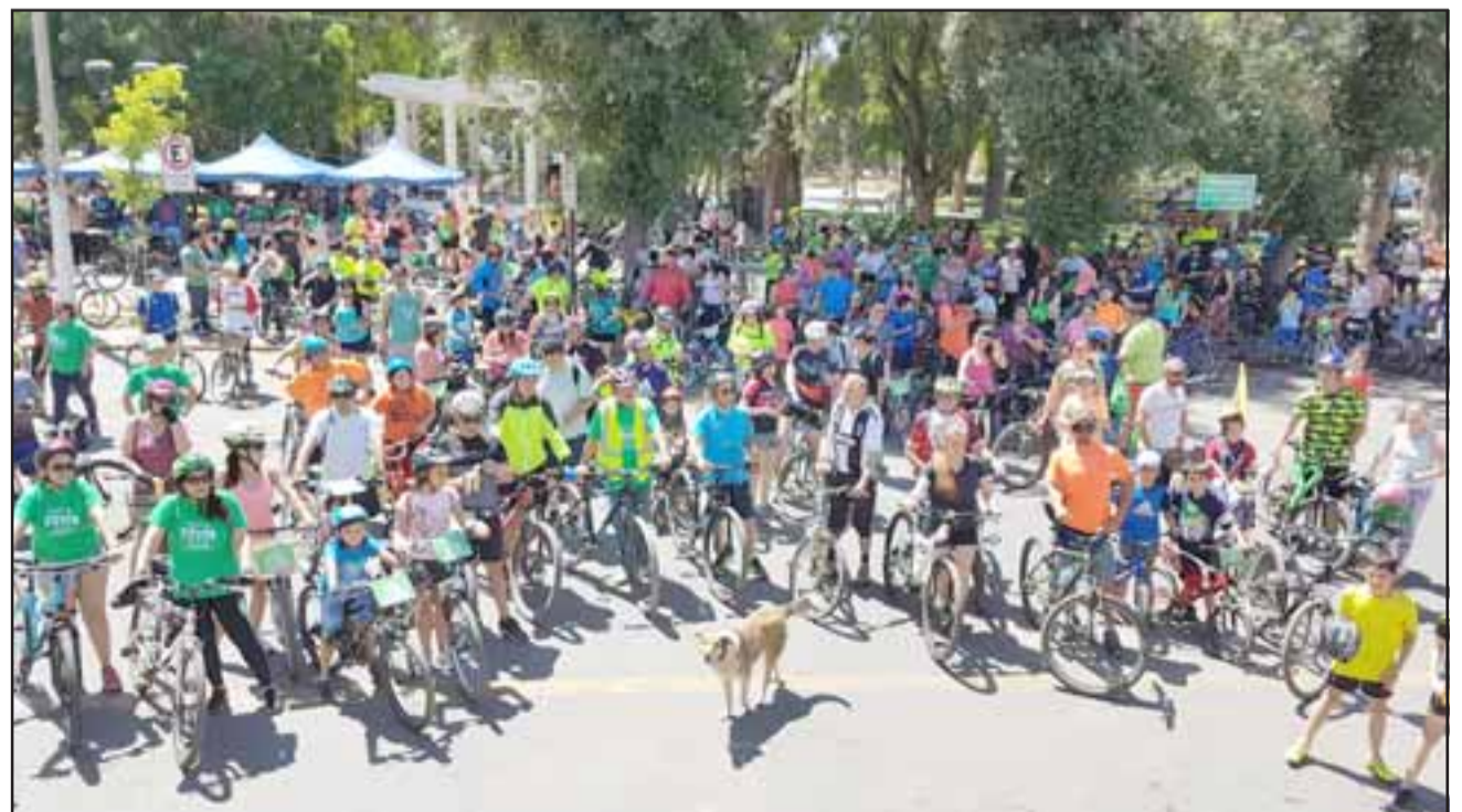
La Plaza de Armas se llenó de colorido con la llegada de los cerca de 500 ciclistas que participaron del evento.