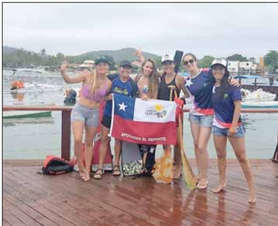
La Aconcaquina fue sexta en la carrera por equipos en el Sudamericano de Brasil.