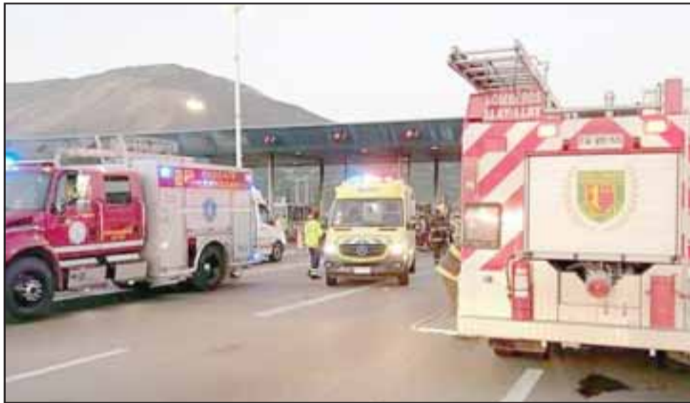
Tras el accidente de tránsito falleció una adolescente de 16 años de edad domiciliada en la comuna de San Bernardo en Santiago.

que el vehículo placa patente HB YJ – 40 circulaba por la ruta 5 Norte en dirección al norte con cuatro ocupantes en su interior, la joven víctima y tres personas adultas.