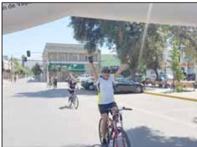
Uno de los primeros ciclistas que llegó al punto de meta en la Plaza de Armas.