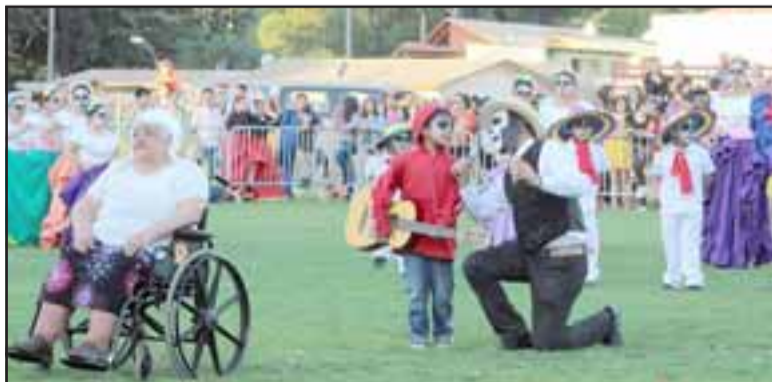
Estudiantes, docentes, padres y apoderados de la escuela Jorge Barros prepararon un musical de la película Coco.

pues involucra la individualidad de la persona con todo su entorno para establecer y consolidar una variada y diversa relación social.