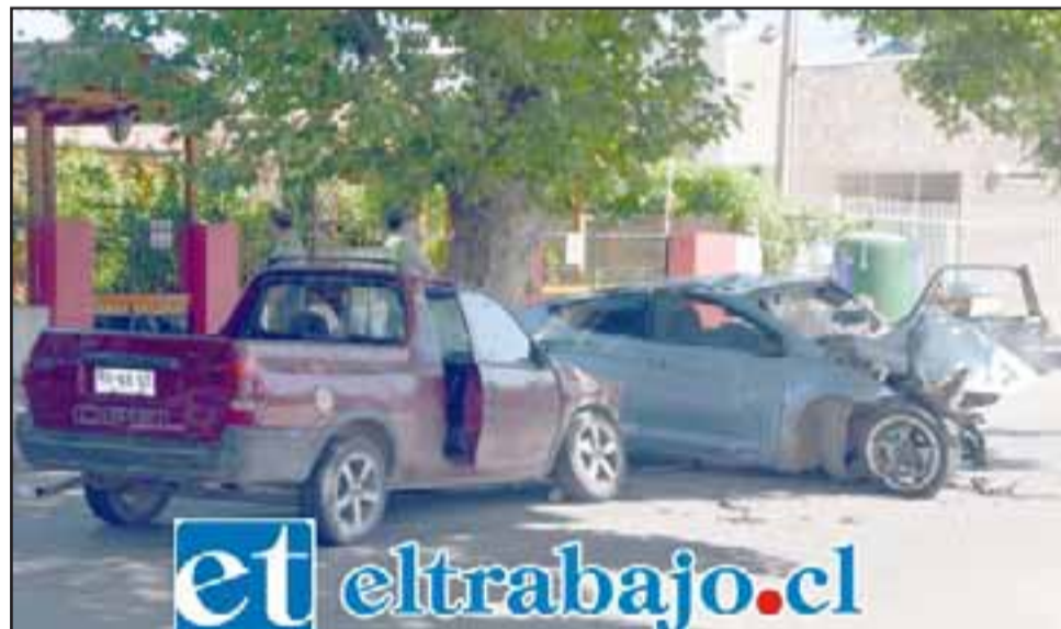
Los vehículos quedaron en este estado tras el violento accidente de tránsito ocurrido en la madrugada de ayer domingo.