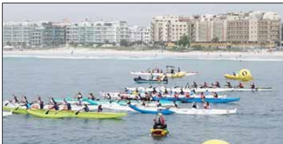
El Sudamericano de Canoa Polinésica tuvo lugar en Cabo Frío en Brasil.