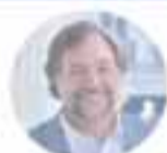
Pedro Pablo Errázuriz Presidente Empresa de Ferrocarriles del Estado