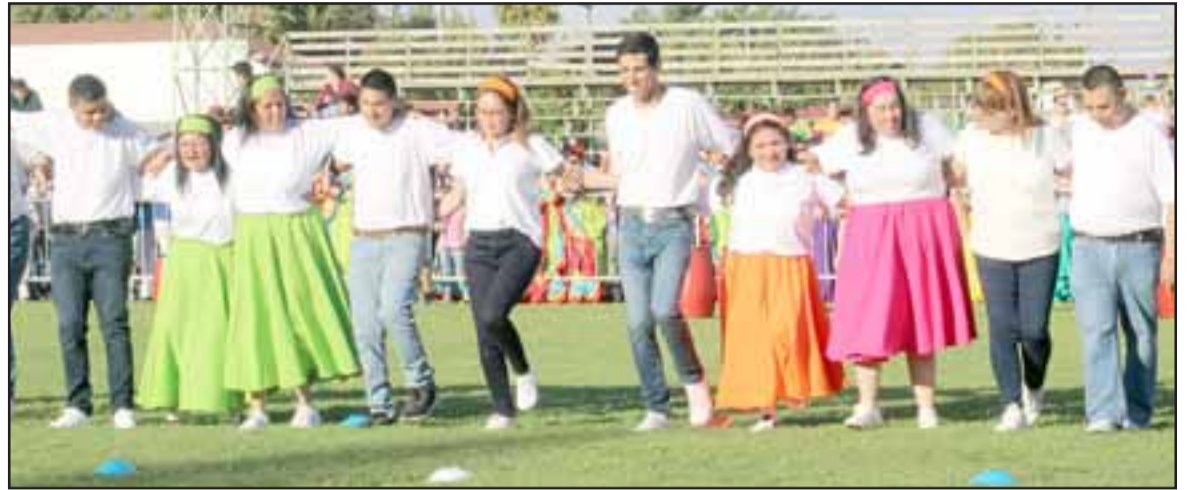
La agrupación 'Yo Vivo' presentó un mix de la película Grease (Brillantina).