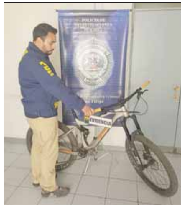
Un avalúo superior a los dos millones 300 mil pesos tiene la bicicleta recuperada por la PDI San Felipe, la que fue robada junto con otras especies desde una tienda deportiva en Las Condes.

Con estas diligencias, la policía civil incautó la bicicleta, que se encontraba dentro de las únicas en su tipo en nuestro país, para realizar su posterior