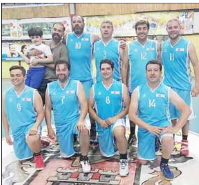
La experiencia es el gran aval del IAC para el Clausura de Abar.

Un domingo en el cual la balanza se inclinó en un 100% hacia el lado de los equipos con mayor tradición en los cestos sanfelipeños, fue el saldo que dejó la segunda jornada del torneo Abar, en una cita que de manera íntegra se disputó en el gimnasio Samuel Tapia Guerrero.