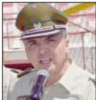
Mayor de Carabineros Héctor Soto Moeller , comisario de San Felipe.

mente conocido en el país y su prestigio superó nuestras fronteras. Comenzó a recibir elogios en Argentina, Perú, Colombia y Venezuela, entre otros. En 1955 actuó en el Cow Palace, California, Estados Unidos. En todas sus presentaciones, el Cuadro Verde rinde homenaje al caballo, su fiel amigo y compañero de tantas jornadas, en memoria de aquellos que ya