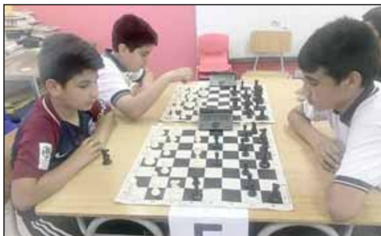
El ajedrez favorece el ejercicio y desarrollo de aptitudes mentales como concentración, memoria asociativa, cognitiva, selectiva y visual y abstracción y razonamiento.