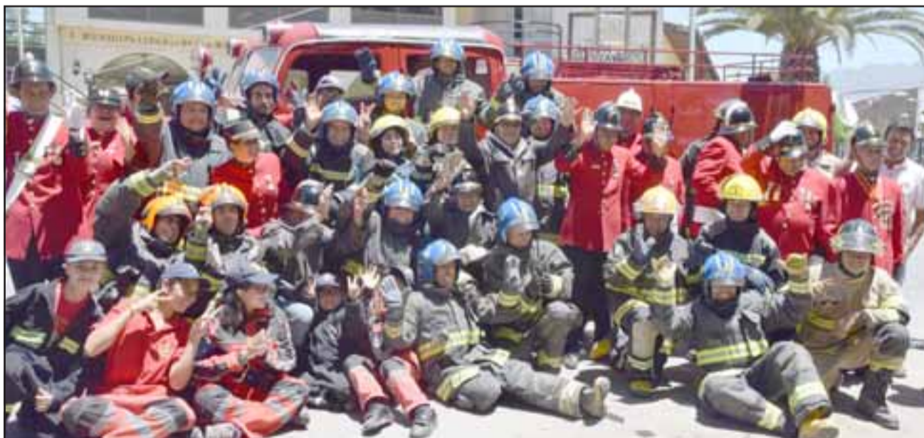
HIJOS DE LA MECHE.- Ellos son parte de la gran familia bomberil de la Primera Compañía de Bomberos de Santa María, celebrando con alegría el regreso de su amada unidad móvil.