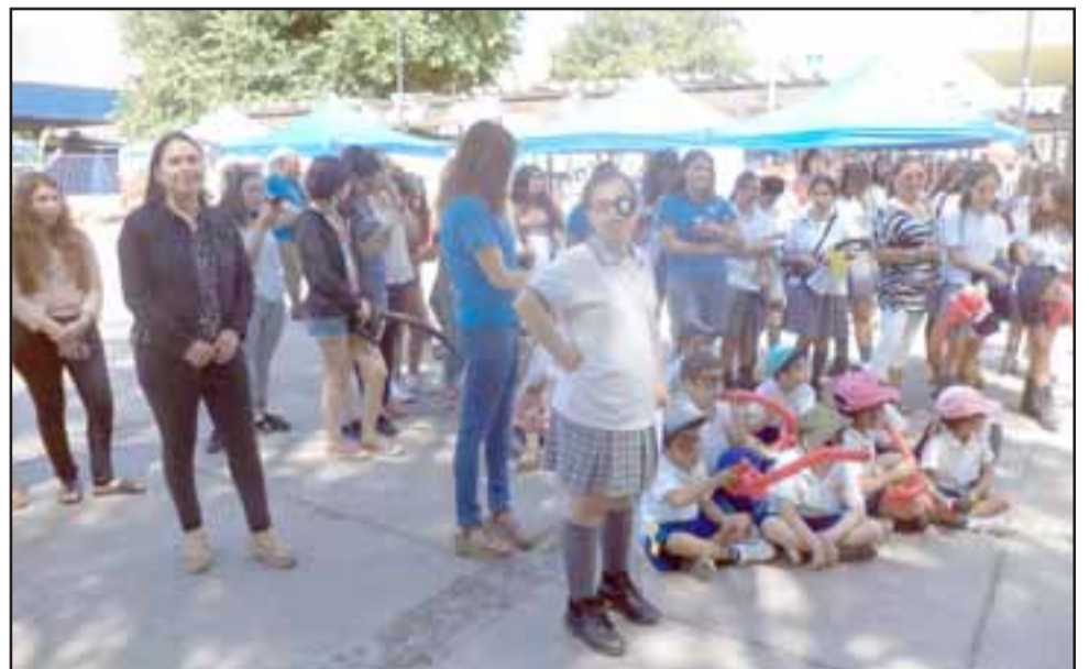
Las alumnas de distintos establecimientos de educación participaron de la feria sobre los derechos de las personas con discapacidad.

Se les dio a conocer los derechos que los cubre. Entre éstos está el derecho al respeto, al acceso a participar de los diferentes entornos, a la salud, educación, al transporte, a hacer efectivo su derecho de sufragio, a la recreación.