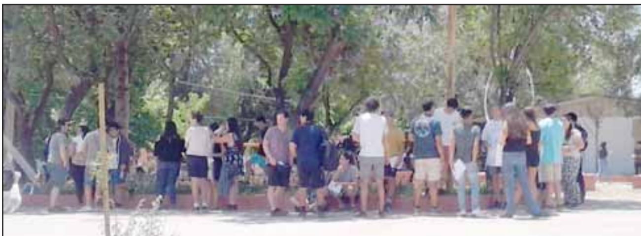
Jóvenes esperando en las afueras del Liceo Corina Urbina para rendir la prueba de Ciencia.

La prueba comienza luego que todos los alumnos