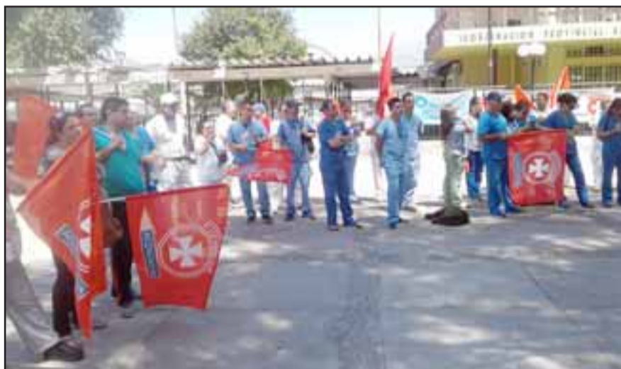
Parte de los trabajadores presentes en la actividad.