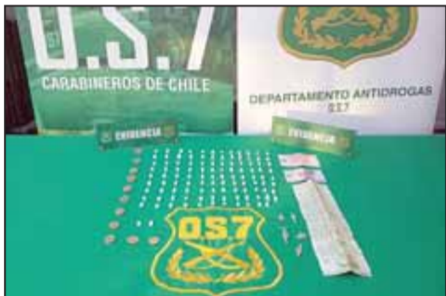
Personal del OS7 de Carabineros Aconcagua incautó un total de 107 papelillos de pasta base de cocaína desde un domicilio ubicado en la avenida Circunvalación Santa Teresa de San Felipe.

Dos sujetos fueron detenidos por personal de la sección OS7 de Carabineros Aconcagua, tras un allanamiento efectuado al interior de una vivienda ubicada en la avenida Circunvalación Santa Teresa de San Felipe, desde donde se incautó pasta base de cocaína, quedando uno de ellos en prisión preventiva.