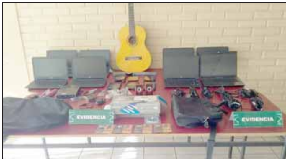
Carabineros logró recuperar la totalidad de las especies tecnológicas de propiedad de la Universidad de Playa Ancha sede San Felipe, avaluadas en seis millones de pesos.

Los detenidos fueron identificados con las iniciales H.E.M.G. de 28 años de edad, quien cuenta con un amplio prontuario delictual por diversos delitos de robo