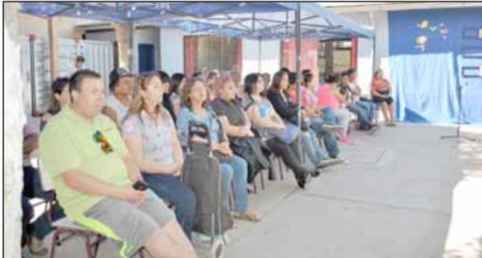
'Yo aprendí a leer' fue denominada esta actividad, que tuvo un carácter familiar y que da inicio al proceso lector de los alumnos de primer año básico.

en distintos niveles, la lectura, por tanto, el trabajo desde ahora está enfocado en el proceso de comprensión lectora.