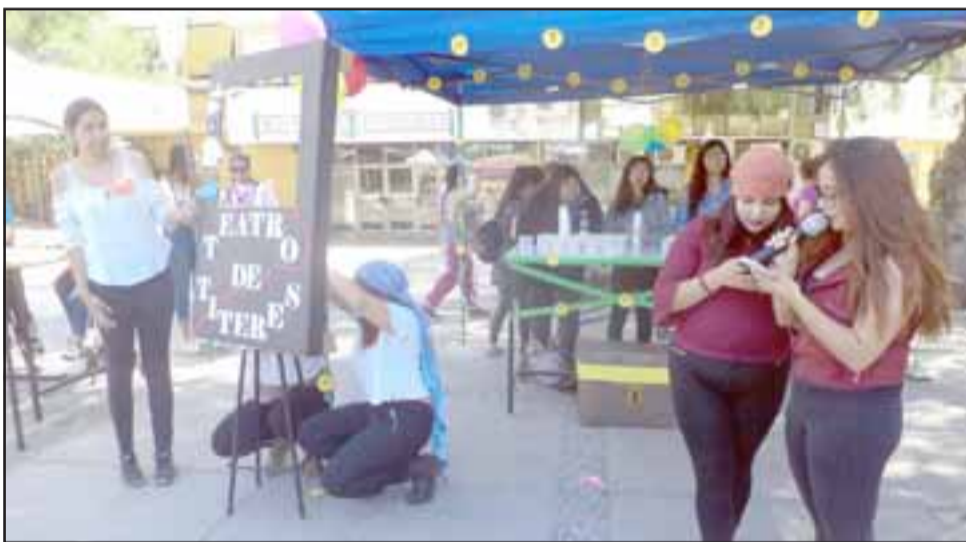
Alumnas de la carrera de Educación Diferencial realizan una muestra de teatro durante la actividad.