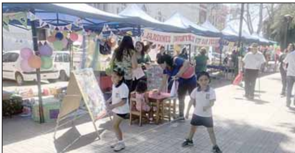
La actividad tuvo lugar en la Plaza de Armas de la comuna, donde el público pudo apreciar las actividades que desarrollan normalmente los niños y que tienen como objetivo potenciar la parte sensorio-motriz, entre muchas otras.