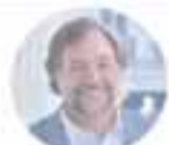
Pedro Pablo Errázuriz Presidente Empresa de Ferrocarriles del Estado