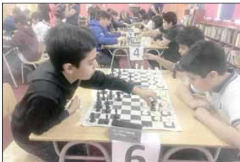
Un entretenido torneo de ajedrez realizó la Escuela John Kennedy, donde participaron alumnos de distintos establecimientos de la comuna.

Según explicó el profesional, durante todo el año existe un alto interés de los niños de todos los cursos por practicar el ajedrez, una actividad que presenta beneficios en todas las edades, debido a que favorece el ejercicio y desarrollo de las aptitudes mentales, tales como concentración de la atención, memoria asociativa, cognitiva, selectiva y visual y abstracción y razonamiento.