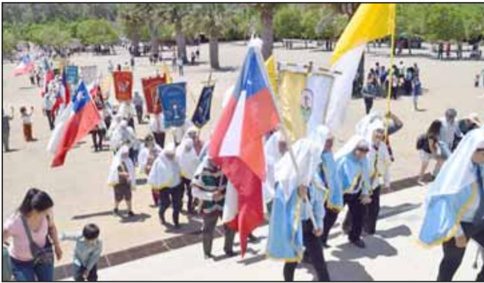
Cientos de Cuasimodistas de la zona central peregrinaron hasta el Santuario de Santa Teresa de Los Andes este domingo 25 de noviembre.