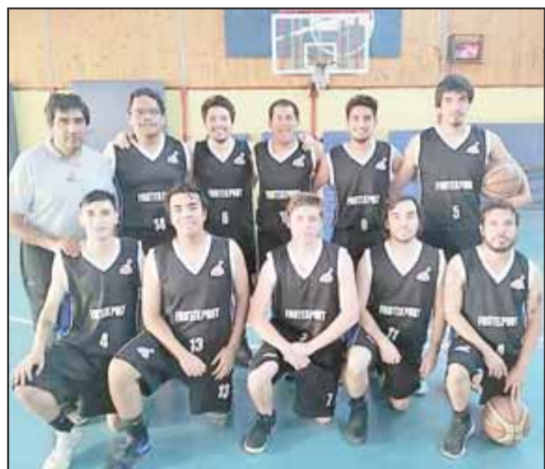
Frutexport tuvo un debut goleador en el Clausura de Abar.

Más ajustados, pero igualmente importantes y merecidos fueron los triunfos de Árabe y el IAC, sobre DL Ballers y San Felipe Basket, respectivamente; los de colonia sufrieron y debieron hacer un gran esfuerzo para ganar por 57 a 53, mientras que el IAC debió recurrir a la experiencia de sus ju-