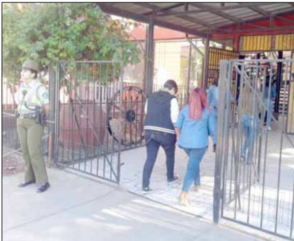
Como siempre Carabineros a cargo de la seguridad en este tipo de eventos.