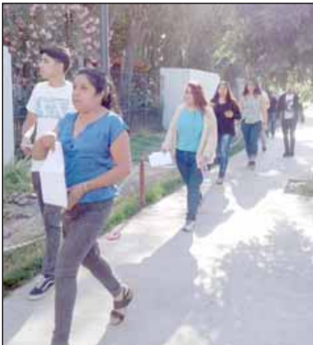
Estudiantes llegando a rendir la prueba al Liceo de Hombres.