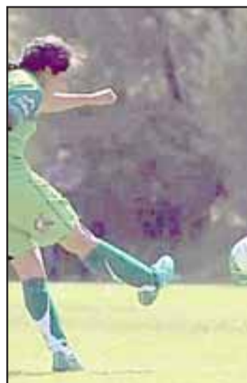
Concluyó la primera etapa del Regional de Fútbol Femenino.

Grupo 5: Hijuelas, Llay Llay Grupo 6: San Felipe, Rincónada de Los Andes Grupo 7: Santa María, Cate-mu