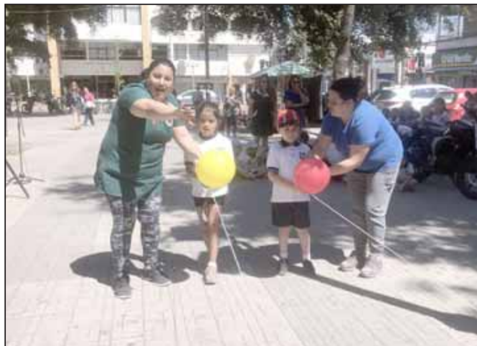
Los menores participaron activamente de la feria educativa, donde el objetivo era mostrar a los vecinos las distintas actividades que se realizan al interior de estas unidades educativas.