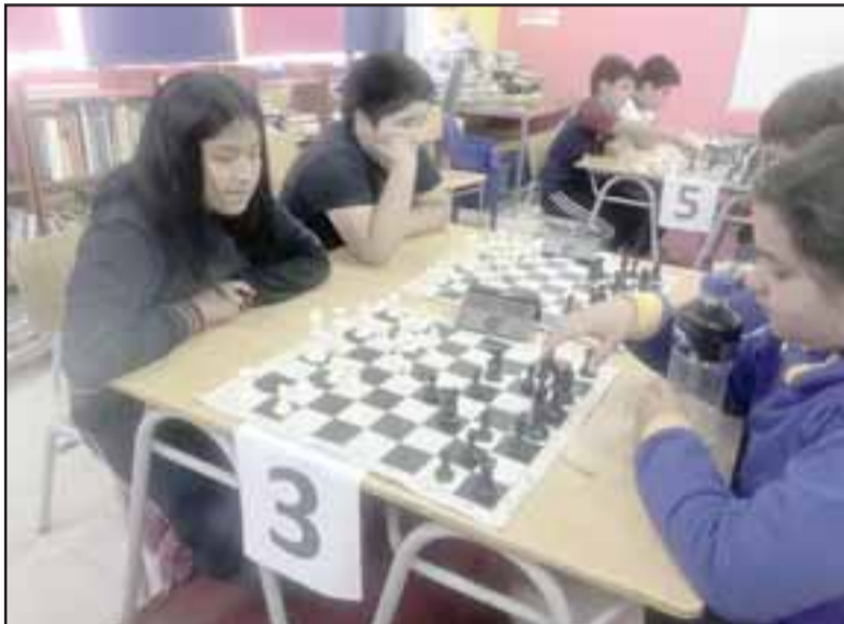
El objetivo del torneo es que los niños desarrollen las habilidades cognitivas y mejoren el rendimiento escolar.