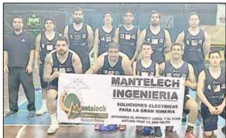
Un triunfo y una caída dejó para el Prat la fecha doble del fin de semana pasado.

Quilicura Basket 84 – Manquehue 94; Alemán de Concepción 55 – Liceo Curicó 63; Stadio Italiano 81 – Ceppi 65; Arturo Prat 75 – Tinguiririca 80.