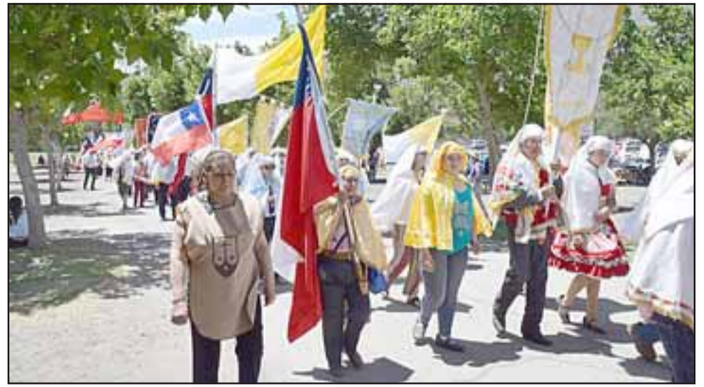
Las delegaciones peregrinaron en oración y rogando al Señor por la perseverancia en su misión de acompañamiento a los enfermos y adultos mayores con diferentes grados de dependencia, acercándolos a Jesús a través de la Comunión.