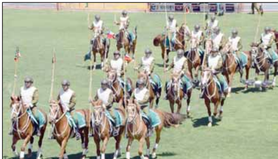
IMPONENTES. - Aquí vemos el porte y elegancia del Cuadro Verde de Carabineros de Chile, 26 jinetes con sus caballos que nos visitaron este sábado gracias a la gestión de la Segunda Comisaría de Carabineros San Felipe.

Con el correr de los años, el conjunto se hizo amplia-