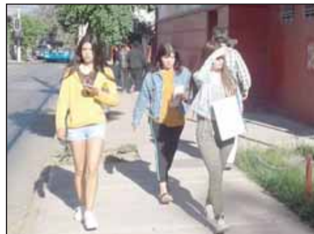
Jóvenes llegando en la mañana a rendir la prueba de Lenguaje al Liceo Doctor Roberto Humeres Oyaneder.

En lo que respecta a la prueba propiamente tal, ayer se rindió la de Lenguaje en la mañana y en la tarde era la rendición de Ciencia. Mientras que hoy continúa con Matemáticas a las 09:00 horas para cerrar con el proceso de Historia, Geografía y Ciencias Sociales a las 14:30 horas.