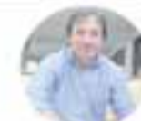
Lucas Palacios Subsecretario Ministerio de Obras Públicas