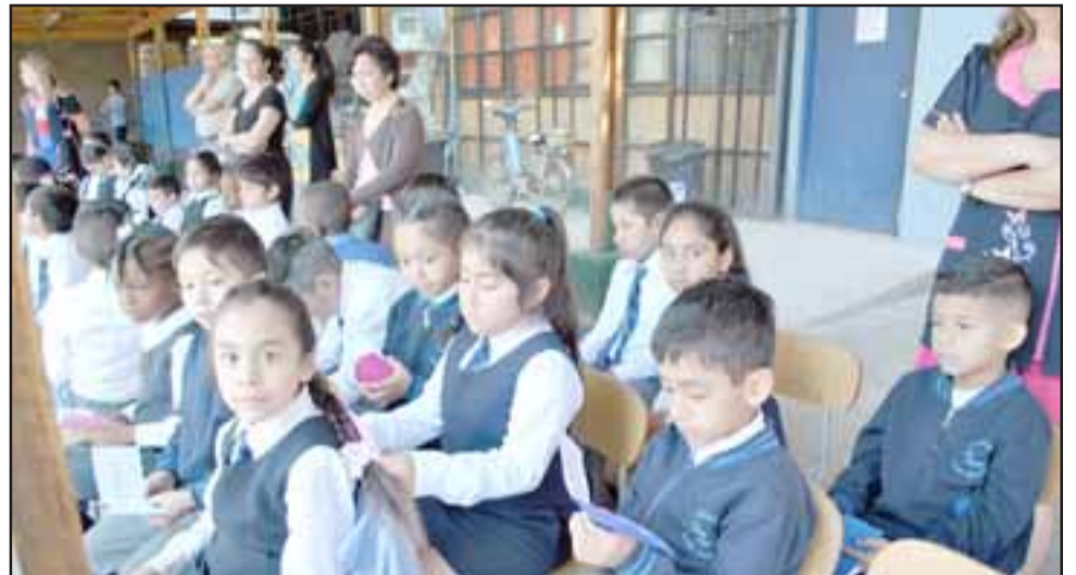
Los alumnos de los primeros básicos de la Escuela Buen Pastor participaron en la emocionante ceremonia 'Yo aprendí a leer'.

Según explicó la profesional, todos los alumnos de los dos primeros básicos del establecimiento dominan,