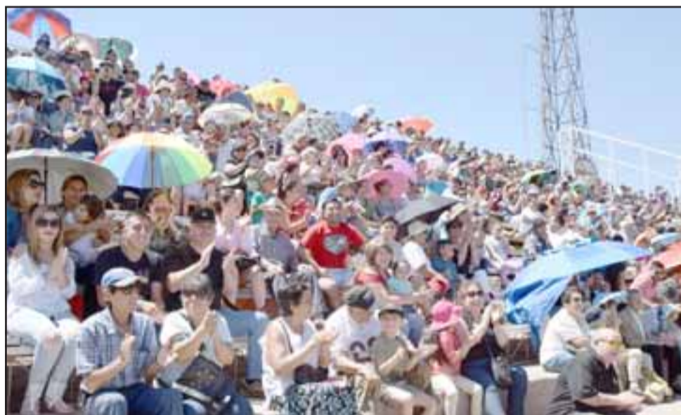
MILES APLAUDIERON. - El público abarrotó las graderías del Estadio Municipal, aplaudieron y disfrutaron de un sano y bello espectáculo equino.