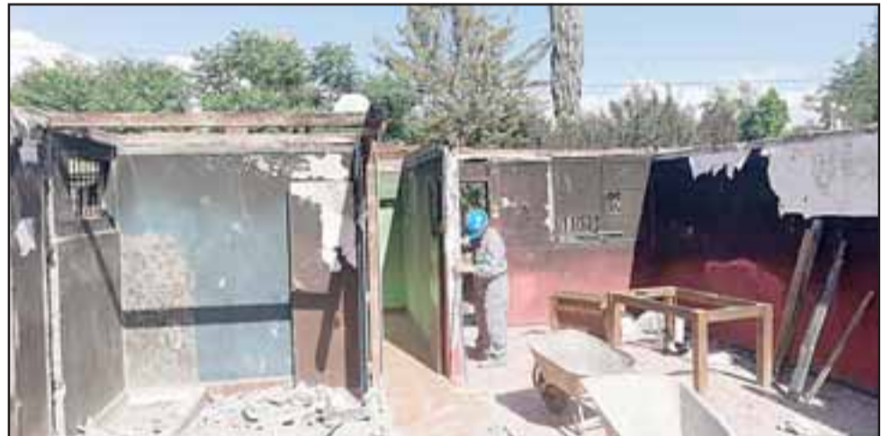
Las viviendas resultaron dañadas a raíz de un incendio que se desató el pasado 21 de noviembre en el pasaje Guillermo Bañados de la población La Santita.

ZUMBATON - GRUPOS DE ROCK MUSICA RANCHERA - SOLISTAS DJ - MUSICA URBANA - PINTA CARITAS GRAN CICLETADA - EXPO TUNNING MOTOCICLETAS - SERVICIO PELUQUERÍA SHOW ARTÍSTICO DE LA EDUCACIÓN MUNICIPAL