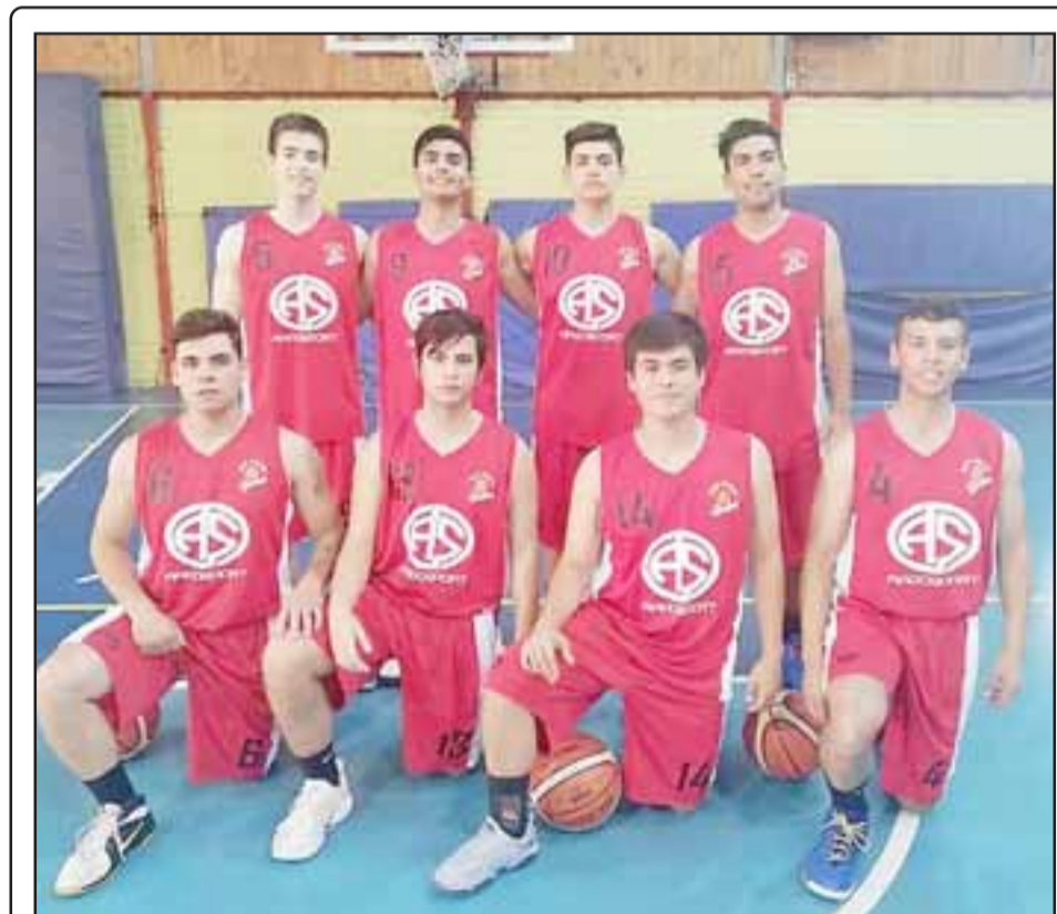
El juvenil equipo de San Felipe Basket jugará el domingo.