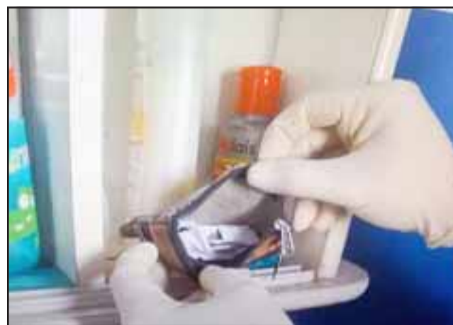
Personal del OS7 de Carabineros incautó papellitos de pasta base de cocaína en el inmueble del imputado.