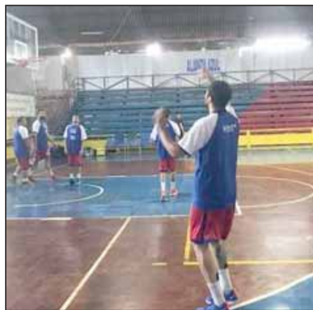
Los sanfelipeños deberán sumar para no quedar comprometidos en los últimos lugares de la tabla.