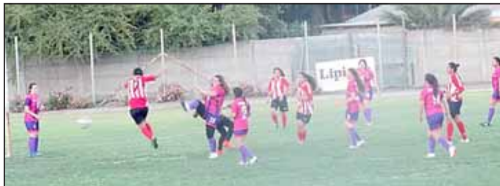
Este sábado los distintos combinados de la zona buscarán dar el primer golpe en el Regional de Fútbol de Mujeres.

Otros duelos en que intervendrán selecciones aconagüinas serán: Llay Llay – Cartagena y Quilpué frente a Hijuelas, asociación que hace ya un buen rato es parte del fútbol aconagüino en los distintos regionales que organiza Arfa.