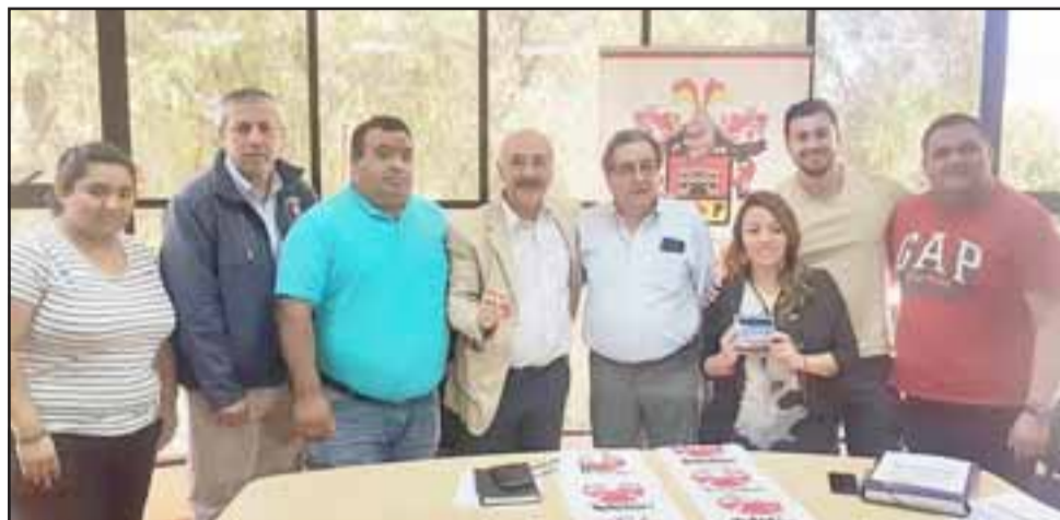
Ya está todo listo y dispuesto para los shows que en San Felipe, Curimón y Bucalemu se estarán realizando para motivar a la comunidad a colaborar con la Teletón.