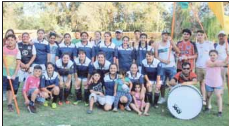
Rama femenina del club Central de Putaendo.

Estas Imágenes fueron captadas por nuestro colaborador Roberto 'Fotógrafo Vacuna' Valdivia , quien en una de sus tantas vueltas por los recintos deportivos del valle de Aconcagua retrató a estos entusiastas conjuntos.