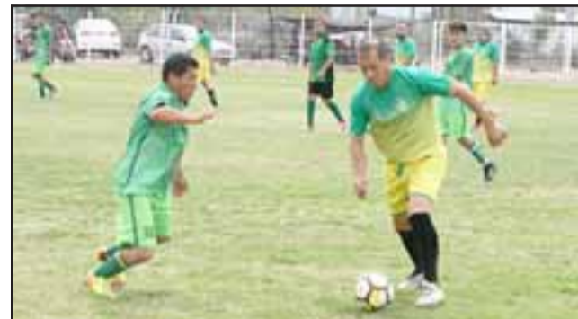
Una jornada que puede marcar un punto de inflexión será la que se vivirá este domingo en el fútbol amateur sanfelipeño.