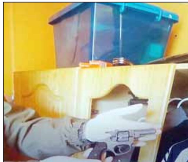
Un revolver y municiones fueron incautados por Carabineros durante el operativo.