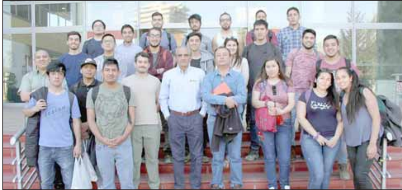
Veinticinco jóvenes estudiantes y docentes componían una nueva delegación de Inacap que visitó las instalaciones de División Andina.