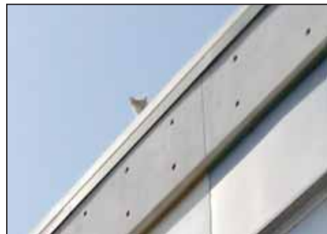
El gato se asomó por algunos minutos, no se sabe si para saludar, pero demostró que sí está sobre el techo, en lo que entendemos es su ambiente natural.

vencionista de riesgos, encargada del medio ambiente y salud ocupacional, quien al ser consultada por la situación del gato dijo: "El gato está en el techo desde el día sábado, el lunes a primera hora subimos en primera instancia con servicios generales, donde el gato se comportó de manera agresiva, por lo tanto nuestra opción fue bajar y pedir apoyo a bomberos, donde bomberos lamentablemente no nos pudo apoyar por tema de disponibilidad de personal y de carro, por lo cual nosotros nos apoyamos con un bombero que trabaja acá como funcionario de nosotros, y subimos al techo nuevamente, donde el gato escapa, por lo tanto el gato no es que