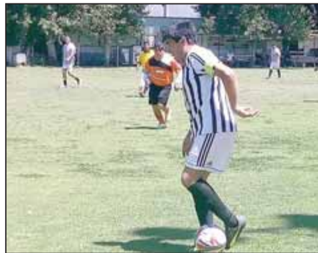
Por ahora dos equipos son los que están involucrados en la pelea por el primer lugar del torneo central de la Liga Vecinal.