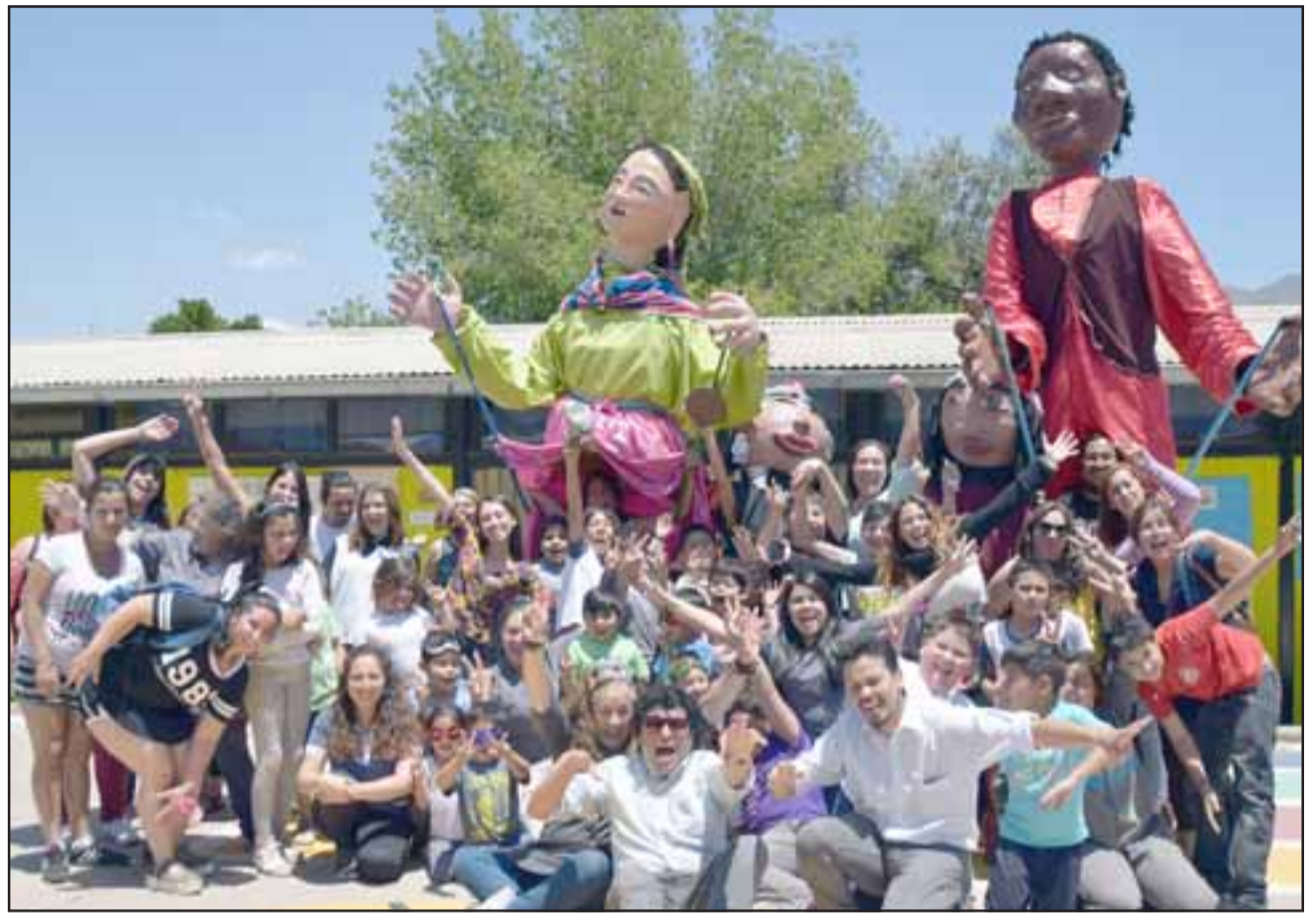
ESCUELA FELIZ.- Aquí tenemos el gran elenco de Marionetas viajantes, junto a parte de los niños de la Escuela Manuel Rodríguez, en el cierre 2018 de Acciona.

«Este es el cierre de Acciona que partió en marzo y que este jueves finaliza y se retomará en 2019. Para este cierre presentamos una amplia muestra de actividades y marionetas hechas por los niños, así como un pasacalle ofrecido gratuitamente por Marionetas