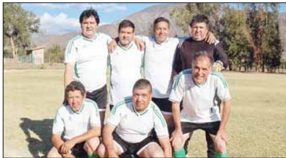
Pocos, pero buenos. – por entusiasmo y calidad no se quedan atrás los Sénior del Estrella de Putaendo.