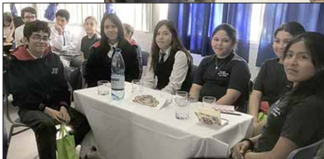
Estudiantes de tres establecimientos municipales de San Felipe participaron en el debate realizado por los alumnos de la Escuela John Kennedy.