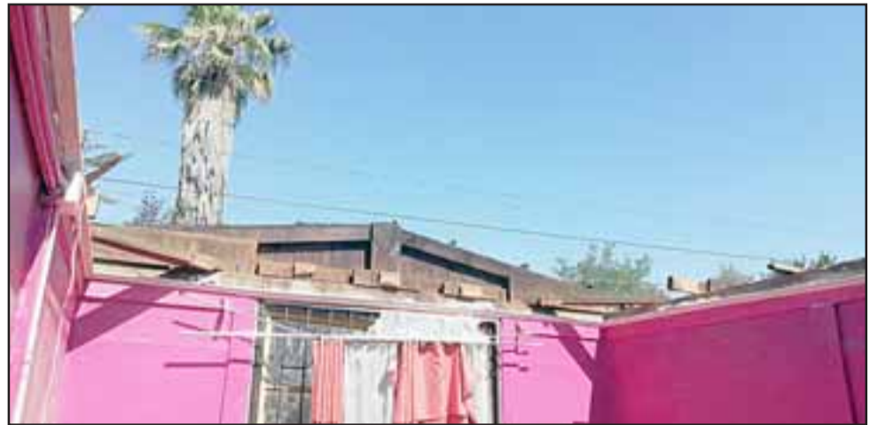
Las pérdidas de las techumbres son evidentes y las familias debieron abandonar los inmuebles, a la espera de lograr reconstruirlas con la ayuda de la comunidad y autoridades.