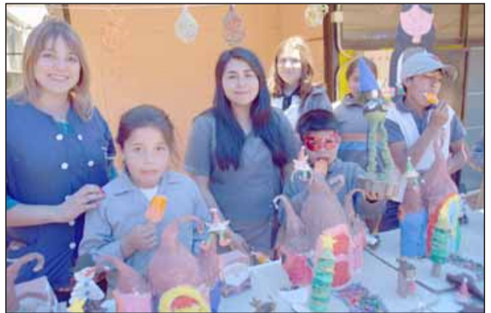
CREATIVIDAD.- Estos pequeñitos muestran las marionetas que hicieron ellos mismos en los talleres de Acciona.