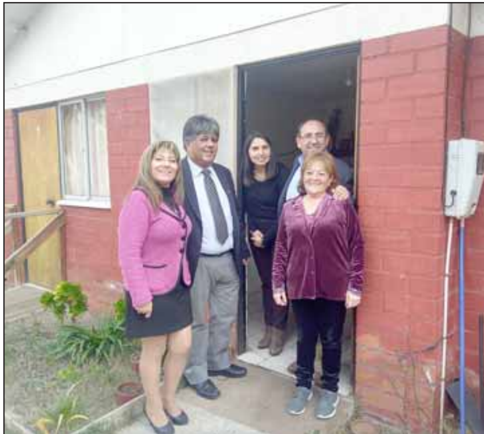
Las viviendas tuteladas cuentan con una sede comunitaria y áreas verdes entregadas a los adultos mayores en comodato hasta su fallecimiento.