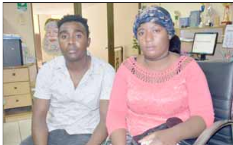
ESTÁN INDIGNADOS. - Este matrimonio haitiano visitó Diario El Trabajo para hacer público el drama que están viviendo.

mo viernes 14 de diciembre a las 9:30 horas en ese jardín», comentó González a Diario El Trabajo .