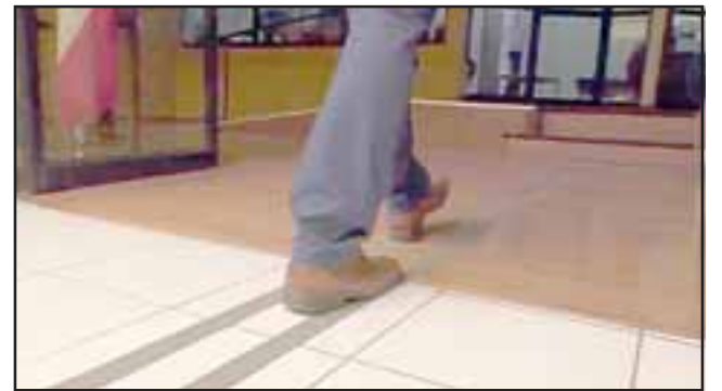
Estas huinchas podotáctiles permitirán a las personas no videntes acceder a diversas oficinas como alcaldía, salones, oficinas de concejales, entre otras.

«Nosotros este año, como equipo de administración y comunicaciones, definimos algunas líneas que ya estábamos trabajando, pero que faltaban trabajar y que son estas huinchas podotáctiles, que permitirán que las personas no videntes puedan acceder a diversas oficinas como alcaldía, salones de concejales, entre otras, y esto se suma al proyecto del ascensor municipal.