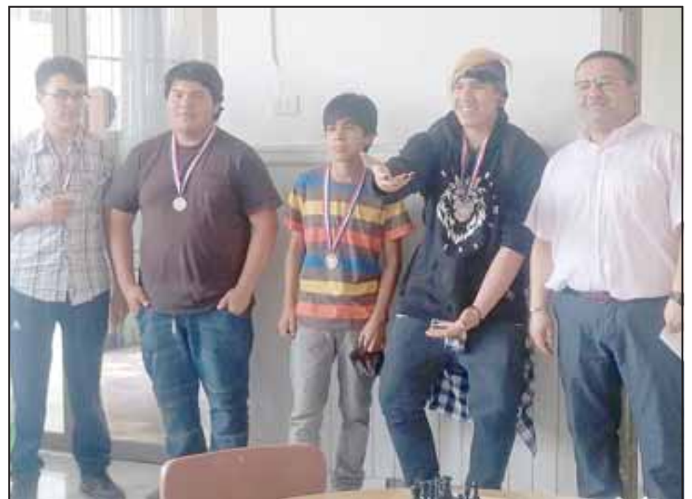
A DESCANSAR.- Aquí vemos a varios ganadores en distintas categorías del torneo. Será hasta 2019 cuando nuevamente los talleres de Ajedrez reinicien en las escuelas.