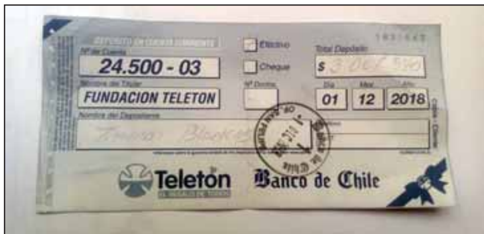
El comprobante del depósito con los más de tres millones de pesos reunidos por Tierras Blancas.

para la Teletón donde me llamen ahí voy a estar, el servidor público lo llevo adentro, eso es lo que me apasiona y eso es lo que me gusta”, finalizó Pantoja. A nivel de San Felipe hemos sabido extraoficialmente que se reunió la cantidad de 86 millones de pesos, el año pasado fueron unos 82 millones.