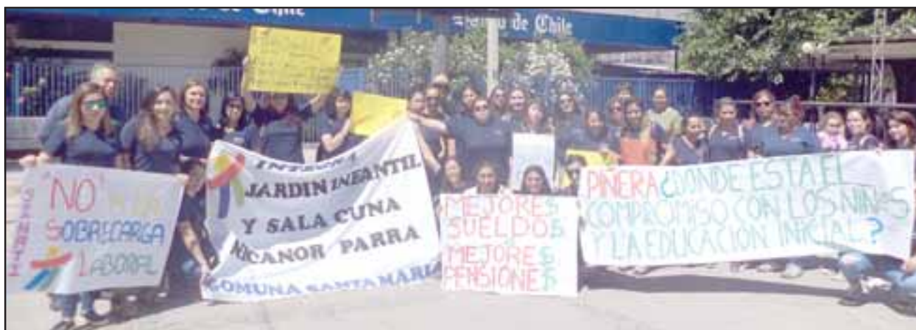
‘Tías’ de distintos jardines infantiles dependiente de Fundación Integra durante el paro en la plaza cívica de San Felipe.