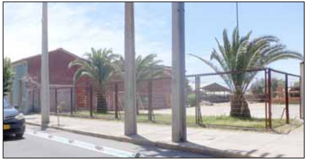
Estos son los terrenos del Consejo Local de Deportes, lugar que sería una de las alternativas para la construcción de un Polideportivo, al igual que la Escuela Agrícola, el Fundo La Peña y el Estadio Fiscal.

Cabe señalar que los terrenos donde se emplaza la