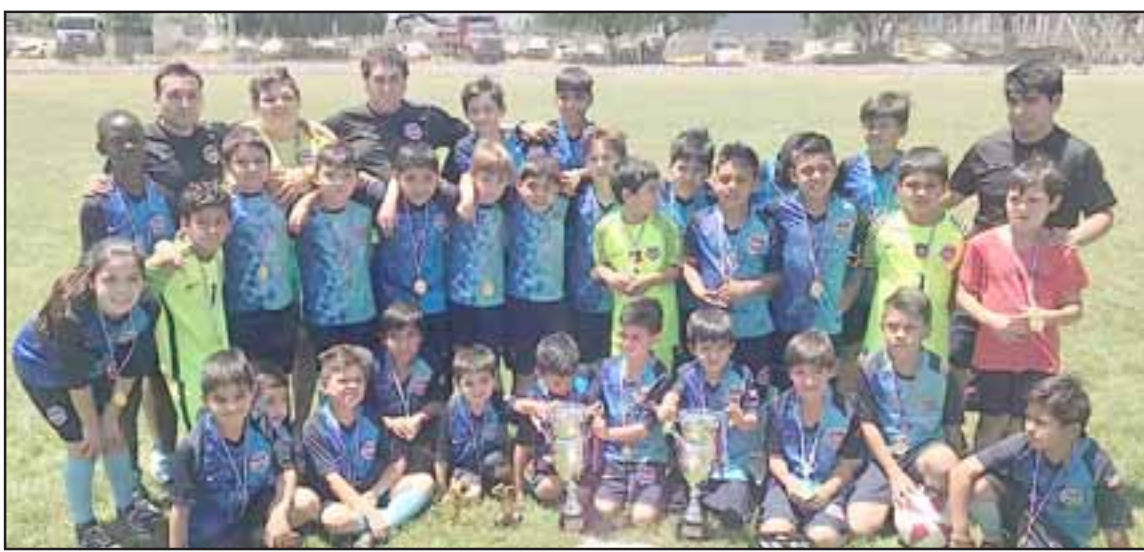
Los niños de la Escuela de Fútbol Boris Sagredo.

También hay que destacar que con anterioridad, en el mes de noviembre, la serie U10 obtuvo un más que meritorio tercer lugar en la Champions Kids que se realizó en Santiago, y en la que estos niños eliminaron a conjuntos de la talla de la Universidad Católica.