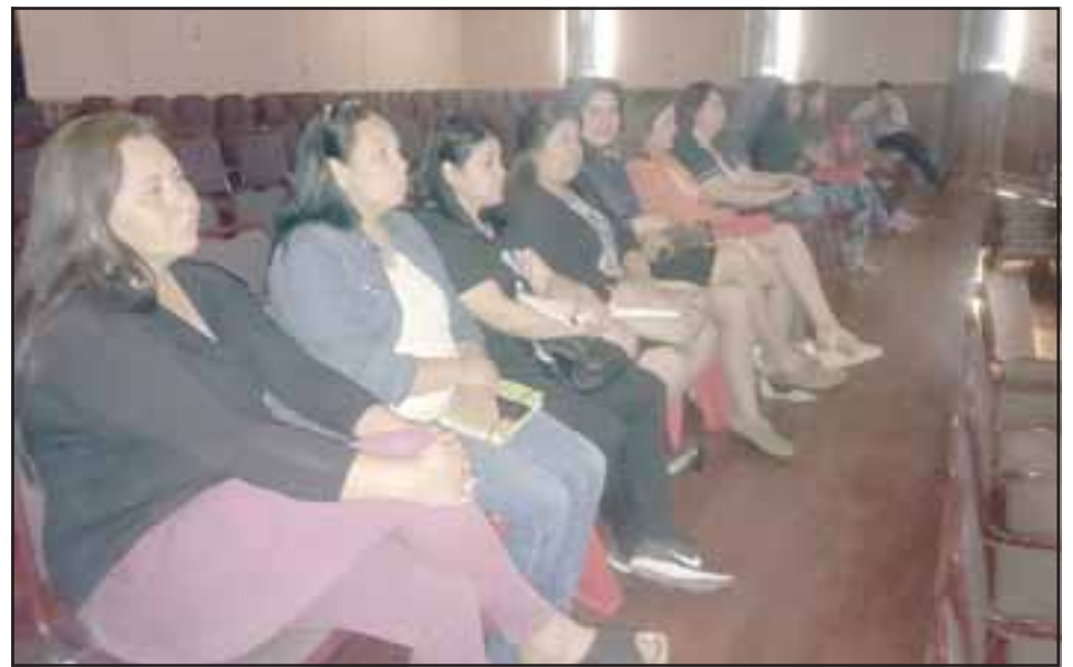
Educadoras de párvulo de distintos establecimientos educacionales municipales participaron en el seminario sobre Nuevas Bases Curriculares de la educación parvularia.