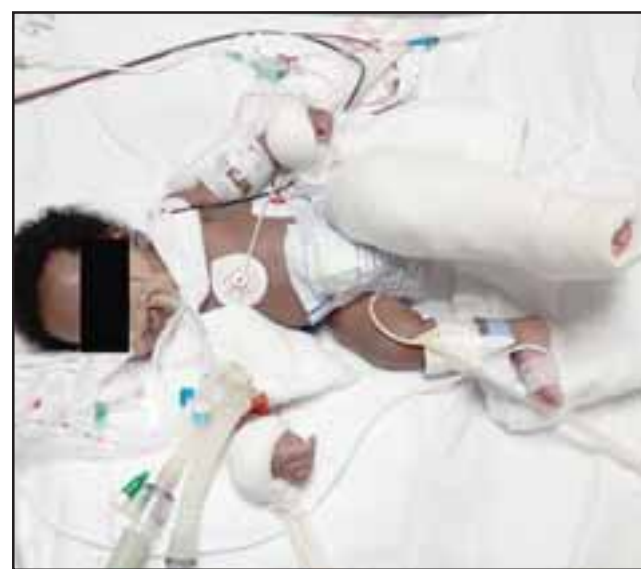
INSÓLITO. - Aquí vemos a la recién nacida, apenas con dos meses de vida y ya con un yeso en su pierna, al parecer la fractura la sufrió en el Hospital San Camilo, pues nunca ha sido dada de Alta.

Diario El Trabajo buscó respuesta en la Dirección del Hospital San Camilo, sin embargo por cuestión