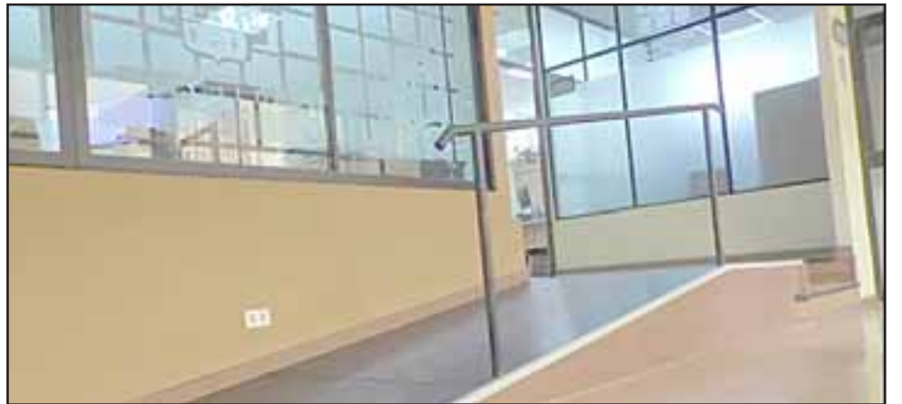
También se instaló una rampa que permitirá a personas discapacitadas, acceder a la alcaldía en forma segura.