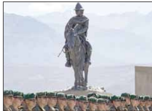
La imponente estatua de 3,5 metros de alto recuerda al baqueano Justo Estay, quien se encargó de guiar a las tropas del Ejército Libertador en el cruce de la cordillera.

haber participado en un homenaje de esta envergadura», sostuvo León.