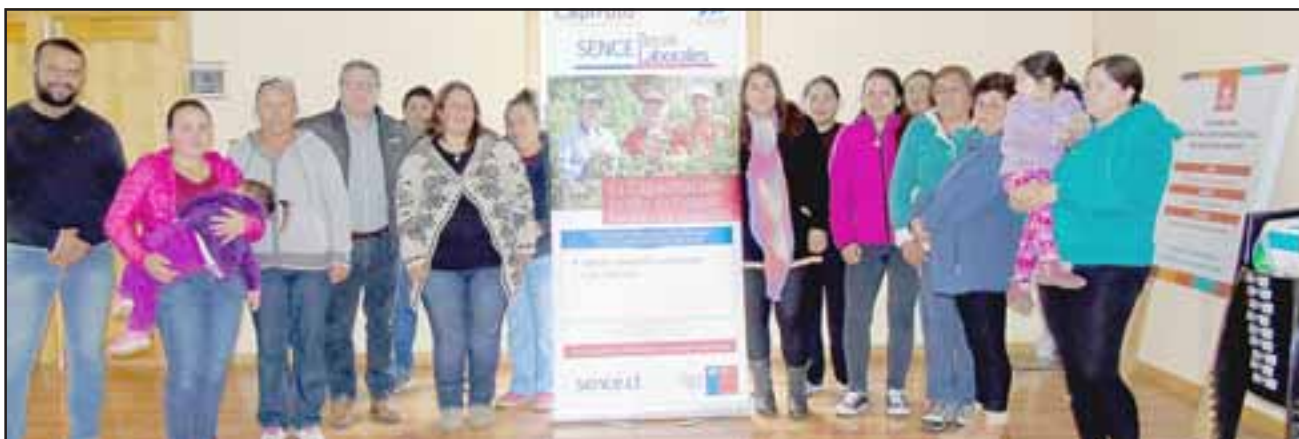
De lunes a viernes, de 8:30 a 13:30 horas, este grupo de mujeres asiste al curso obras menores sanitarias y grifería.

Las usuarias actualmente cursan la etapa de capacitación técnica del programa, valorando la posibilidad de adquirir nuevos conocimientos.