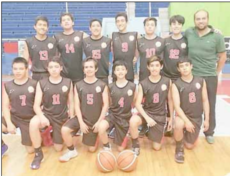
La selección U15 de San Felipe fue derrotada en los dos partidos en la pasada eliminatoria para el Nacional de categoría.

La derrota con Coquimbo dejó muy endebladas las opciones de San Felipe, ya que, si querían clasificar al