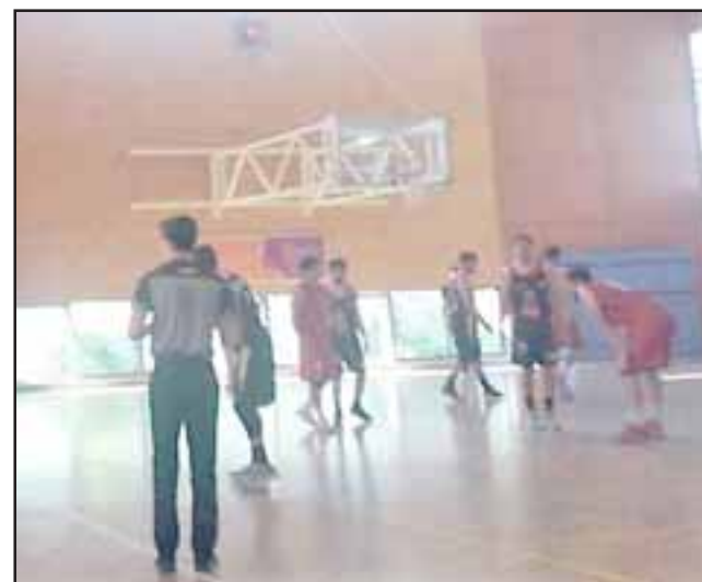
En Concepción (imagen) el Prat se impuso a Alemán en un partido muy estrecho.

Un día después en la capital de la región del Bío Bío, los pratinos, ante un cotizado elenco de Alemán, estaban obligados a convertirse