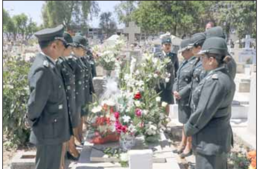
Previo a la Misa, a la que asistió un destacamento de honor de la Escuela de Gendarmería de Chile del General Manuel Bulnes Prieto.

Previo a la Misa, a la que asistió un destacamento de honor de la Escuela de Gen-