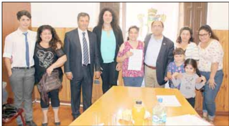
En el caso del Grupo Folclórico Los Conquistadores del sector Viña Errázuriz, los recursos adjudicados serán utilizados para comprar vestimentas para los bailarines.