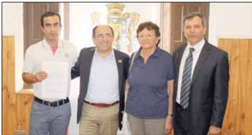
La Asociación de Fútbol Amateur de Panquehue destinará los recursos para comprar balones de fútbol e implementos para el desarrollo de entrenamientos, tales como conos, escalera de coordinación, entre otros.