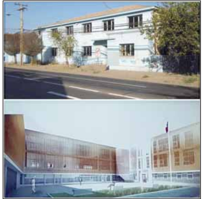
En más de 130 funcionarios aumentará la dotación de detectives una vez que sea construido el nuevo cuartel de la Prefectura Provincial Los Andes.

Por ello, firmó que este es un proyecto que merece ser aprobado por el Gobierno Regional, pues actualmente los funcionarios de la PDI están trabajando en condiciones de mucho hacinamiento y falta de espacio para el desarrollo de sus actividades policiales.