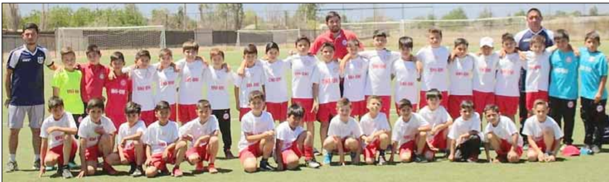
Esta tarde los infantiles del Uní Uní enfrentarán a sus similares de O'Higgins.