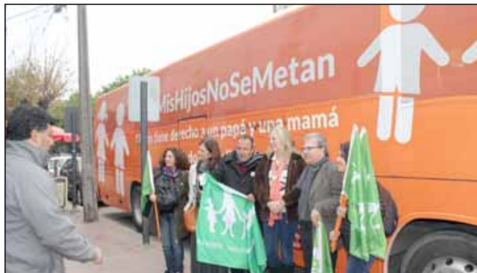
SIGUE CRECIENDO.- La ONG Padres Objetores Chile cuenta con sedes en: Copiapó, La Serena, Aconcagua, Santiago, Rancagua, Chillán, Concepción, Temuco, Villarrica, Osorno y Puerto Montt. Aquí vemos El Bus de la Libertad.

ventud, a los padres en su rol formador y la familia, acerca de rol de los padres como primer formador moral de los hijos; el derecho a que la formación moral de los niños sea protegida en todas las etapas de la niñez y adolescencia y sea protegida frente a cualquier agresión externa o interna que la lesione; las condiciones adecuadas para que toda persona que asuma por su cuenta la defensa del derecho de padre a educar a los hijos en sus creencias; la libertad religiosa y la libertad de enseñanza en casos concretos, no encuentre, por su actitud, discriminación alguna en sus derechos y oportunidades y el derecho que tiene toda persona a preservar su libertad individual ante lo que considere que vulnera sus más íntimas convicciones.