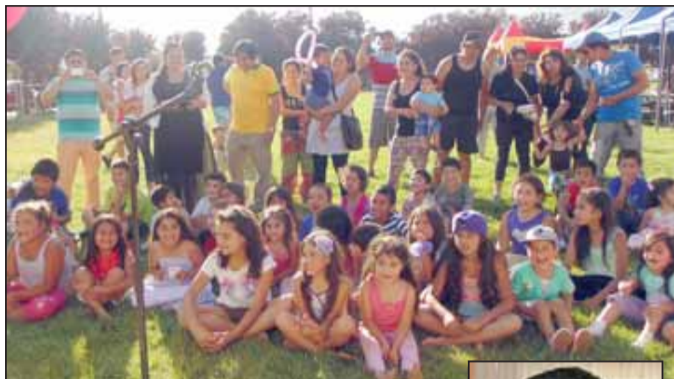
ESPERAN SU NAVIDAD.- Ellos son la generación de pequeños 2014, cuando vivieron su fiesta navideña, ahora vienen más niños también esperando vivir su Navidad.

tros barrios, en total somos más de 100 familias las que participamos en el grupo, pero de manera activa siempre contamos con unas 25 personas para realizar las actividades en la comunidad; por ejemplo hace un par de semanas hicimos nuestra Fiesta de la Primavera, todos los vecinos nos unimos para poder hacer este desfile de carros alegó-