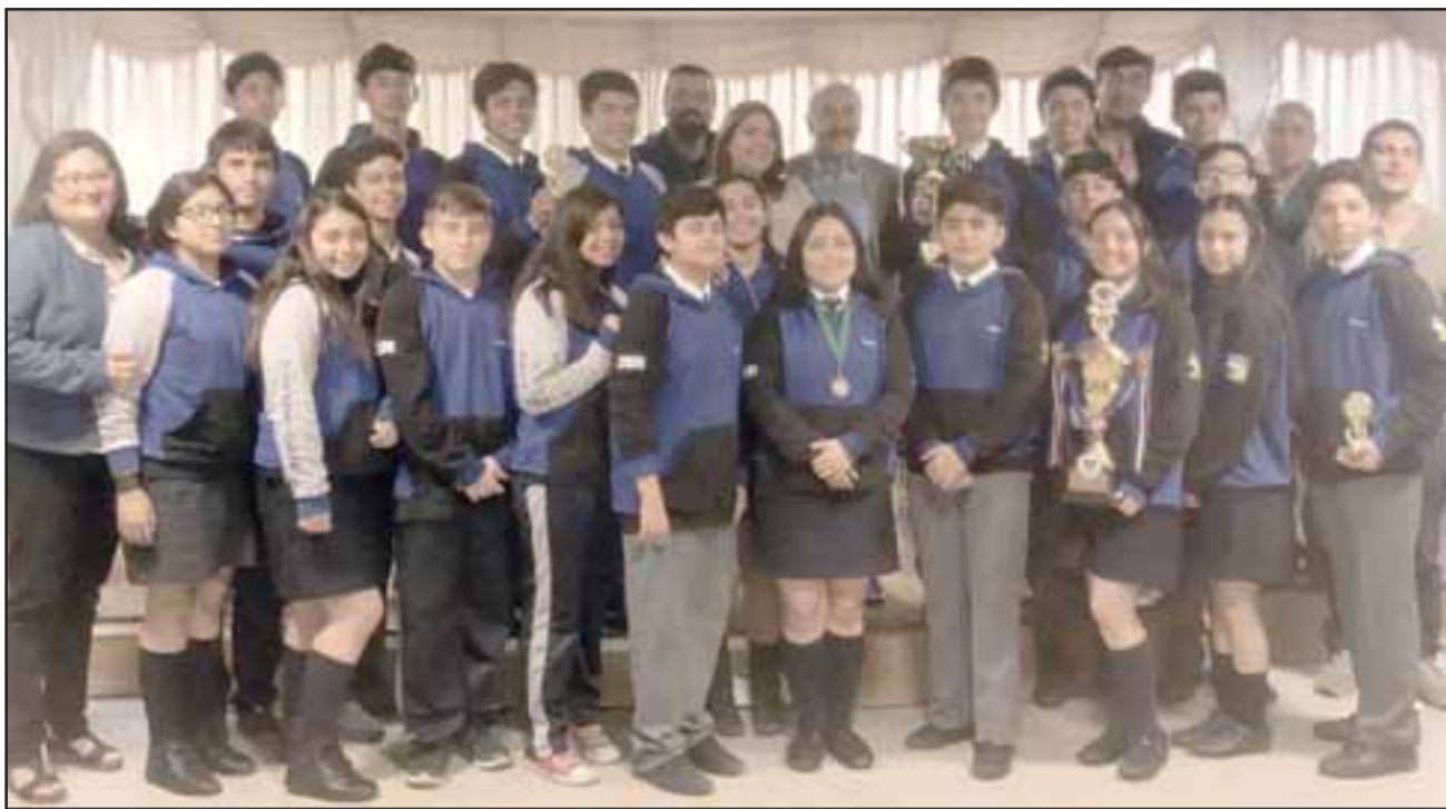
La actividad se realizó en el salón de honor del municipio sanfelipeño, instancia donde los estudiantes conversaron con las autoridades, recibiendo el reconocimiento por los logros conseguidos.