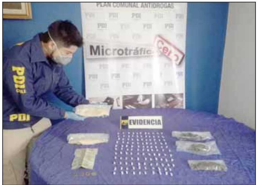
Personal de la Bicrim de la PDI de San Felipe incautó las drogas desde el domicilio de los entonces imputados en la población La Esperanza de Llay Llay.

La policía civil, al continuar con las diligencias, incautó al interior de un au-