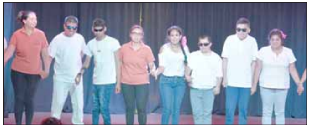
Los jóvenes estudiantes pudieron presentar su trabajo y aportes ante el público invitado.

Entre las novedades del evento estuvo la presentación del video 'Ponte en mi lugar', en el que participan autoridades, profesores y alumnos de la comuna, luego de haber vivido la ex-