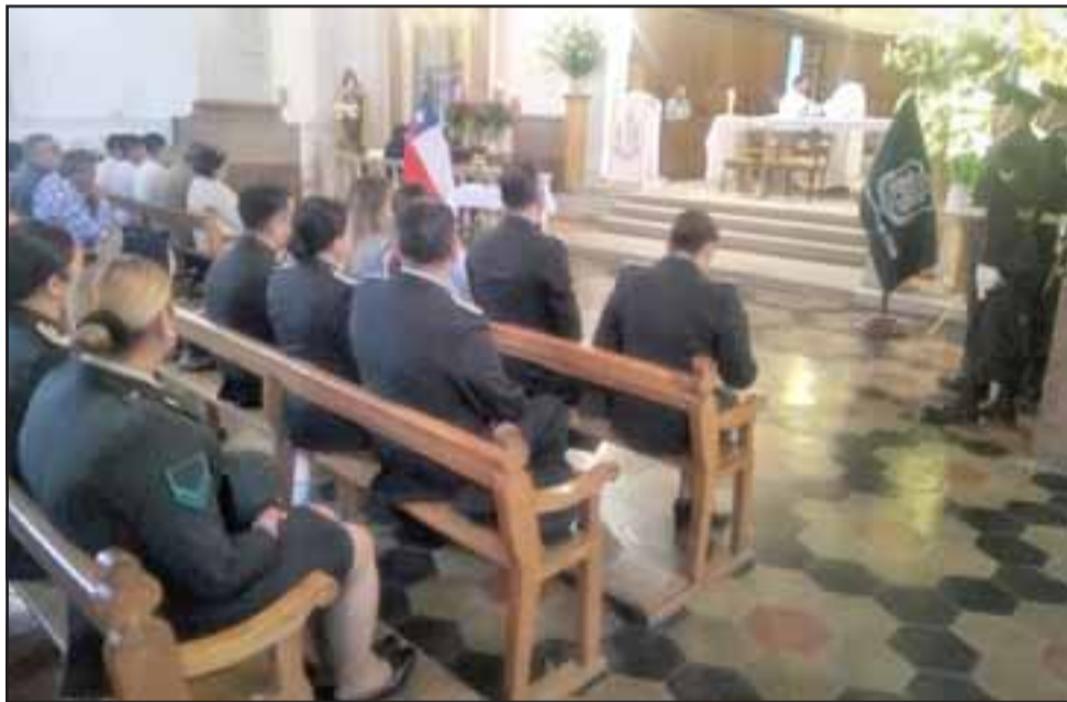
Funcionarios y excompañeros llegaron hasta la catedral de San Felipe para acompañar a los familiares en el acto religioso.

darmería de Chile del General Manuel Bulnes Prieto, funcionarios de unidades de Valparaíso, Centro Penitenciario Femenino