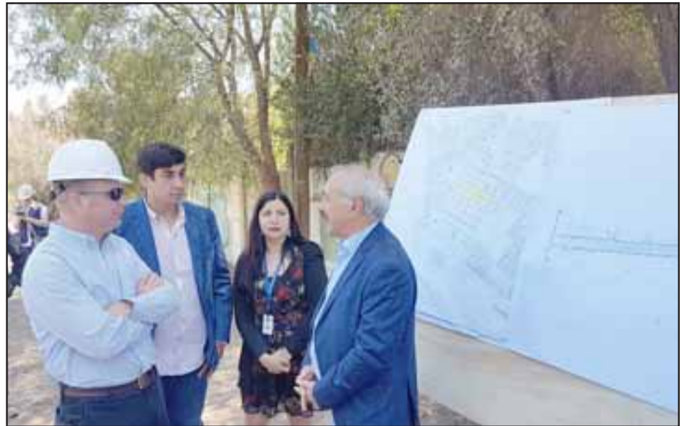
En la intersección de avenida Miraflores con Hermanos Carrera comenzaron los trabajos de la futura 'Circunvalación San Felipe', uno de los proyectos más necesarios para la ciudad.