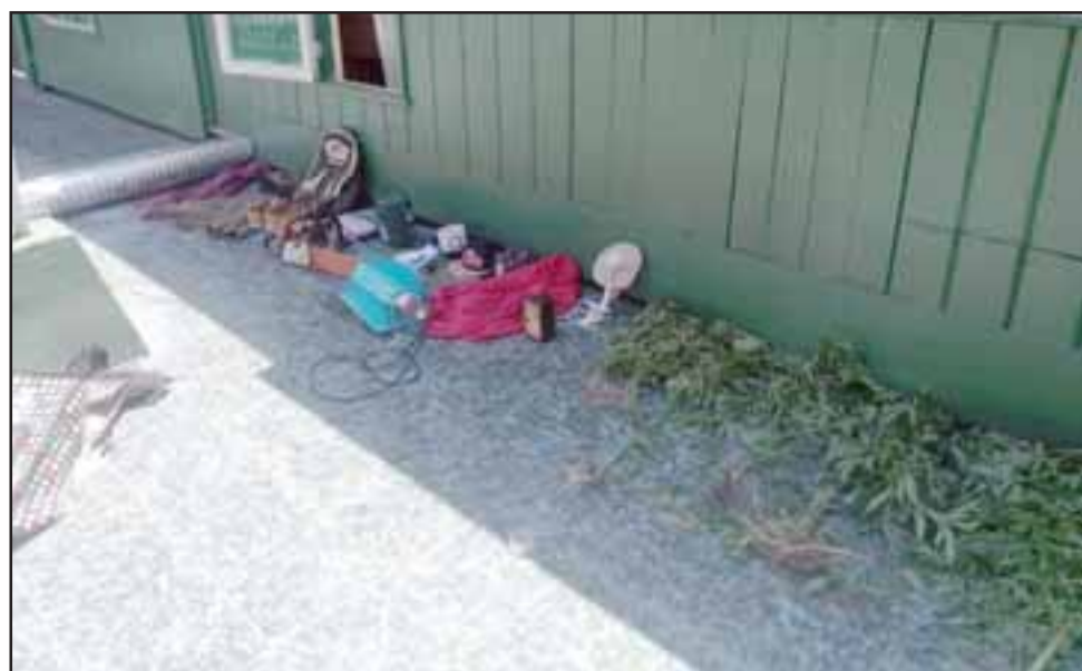
Personal de la SIP de Carabineros recuperó las especies robadas desde el inmueble en Panquehue, decomisando un cultivo ilegal de cannabis sativa y una cantidad indeterminada de marihuana elaborada.

En este lugar se habrían despojado de las especies sustraídas en la vía pública, abandonando además el vehículo en el que se movilizaban para correr hacia predios agrícolas para impedir su detención. Carabineros al fiscalizar el vehículo utilizado por los sujetos, incautaron un bolso que contenía nueve plantas de cannabis sativa, además de marihuana elaborada.