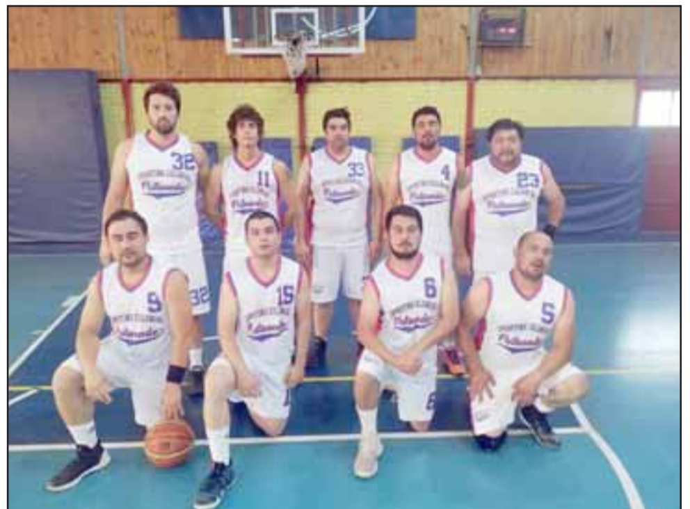
Pese a que los resultados no los han acompañado, los putaendinos de Sporting Colonial destacan por su gran espíritu deportivo.

Lobos 42 - Sonic 55; Sporting Colonial 31 - San Felipe Basket 80; Frutexport 89 - Arturo Prat 55