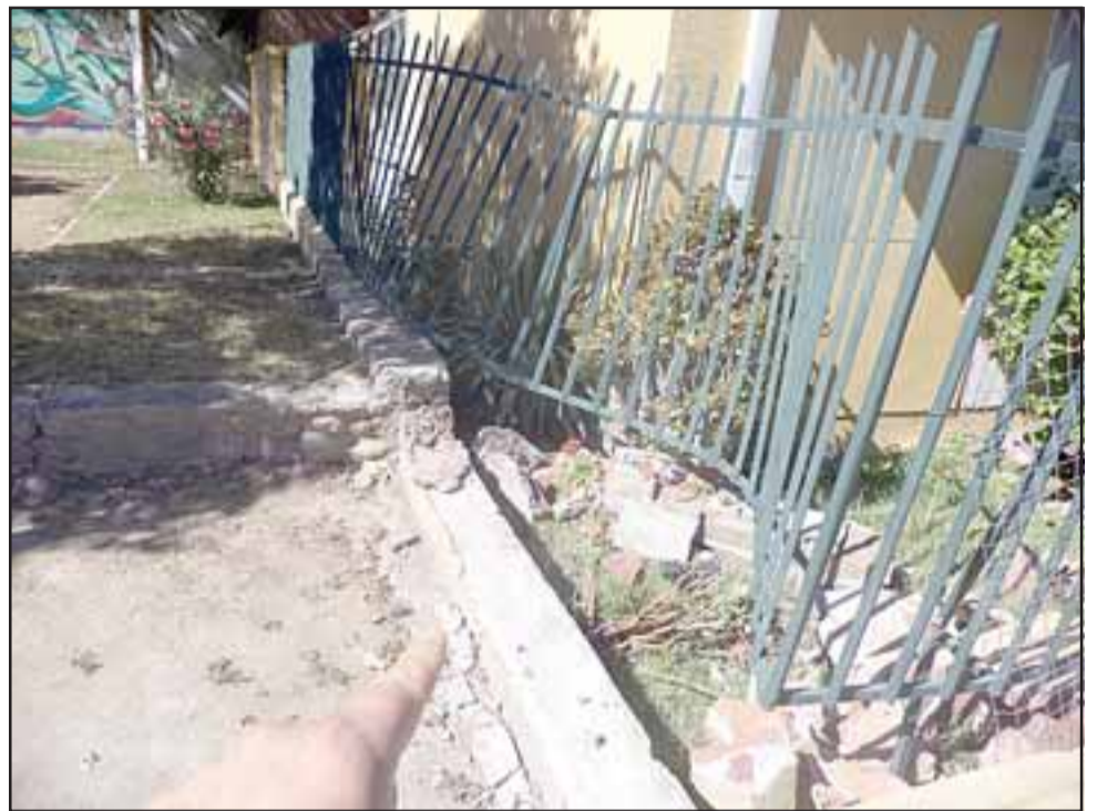
Así quedó ahora el costado de la reja que se había salvado del choque anterior y estaba en buenas condiciones.

Cabe señalar que en el mes de mayo ocurrió el otro accidente, donde una camioneta terminó también incrustada en la reja del frontis de su domicilio.