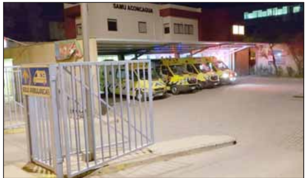
Personal de Carabineros concurrió hasta el servicio de urgencias del Hospital San Camilo de San Felipe la noche de este viernes, tras la denuncia de una persona herida a bala.

Posteriormente Carabineros concurrió hasta dicho centro hospitalario, entre-