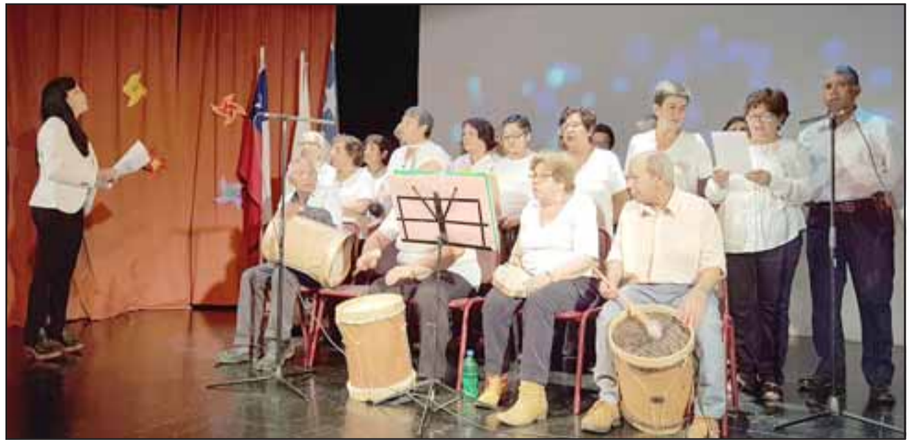
Para celebrar el aniversario se realizó una actividad en el Teatro Municipal de San Felipe, en la cual los usuarios presentaron diversos números artísticos.

«Ha tenido un desarrollo muy fructífero, es una muestra de lo que necesitamos como sociedad hoy día,