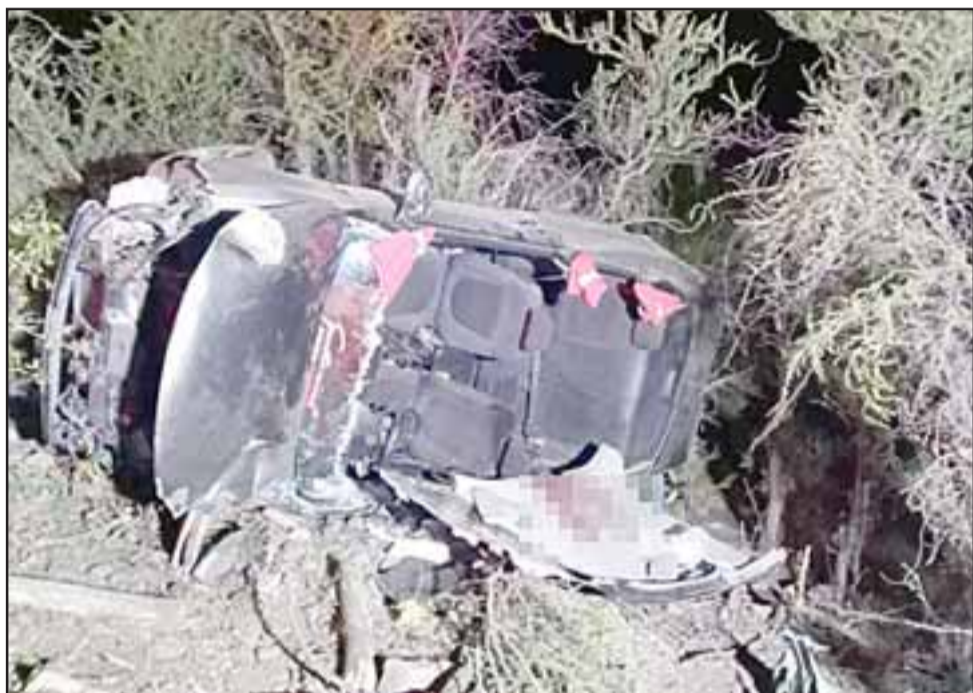
LO FATAL.- Este mortal accidente se produjo la madrugada de ayer lunes en el sector de Los Rosales.

para poder sacar a esta persona que estaba atrapada al interior del móvil».