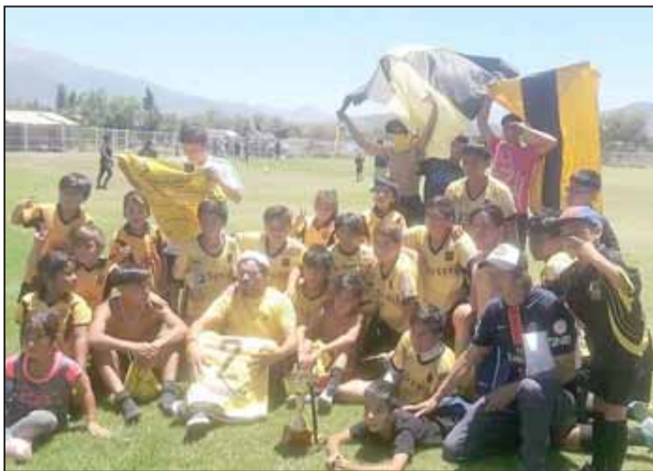
Los niños del Pentzke festejaron eufóricos el título de la Segunda Infantil del fútbol sanfelipeño.