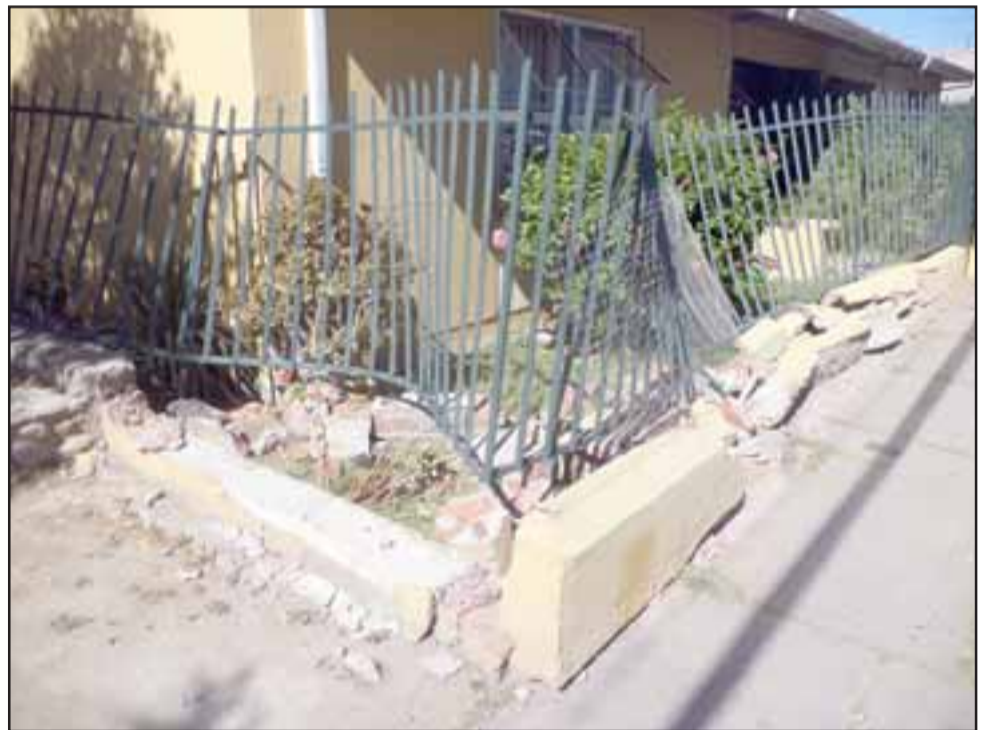
Así está la reja dañada en ambos lados, tanto norte como oriente.