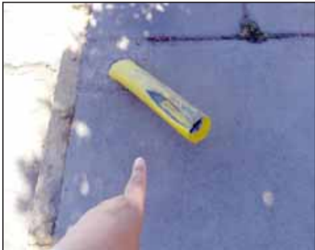
Así quedó el fierro que instaló la municipalidad a días de ocurrido el accidente en mayo de este año.