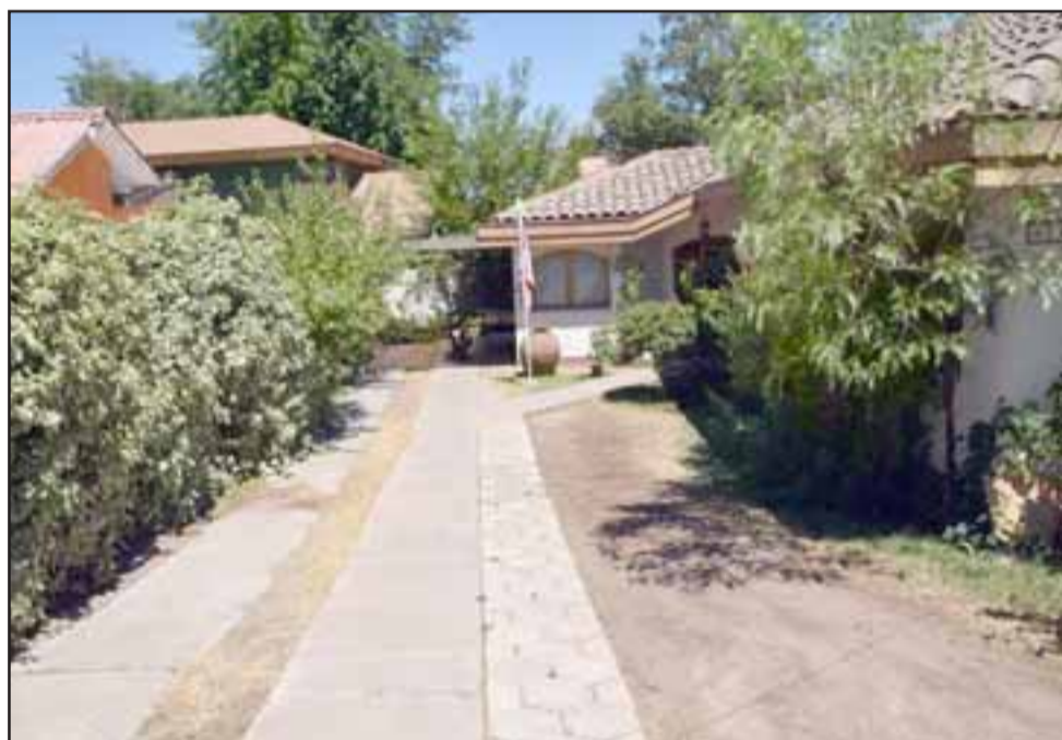
PIE ACONCAGUA.- Estas son las oficinas del PIE Aconcagua, en San Felipe, desde donde se elaboran los informes técnicos que los jueces manejan para decidir sus sentencias y directrices.