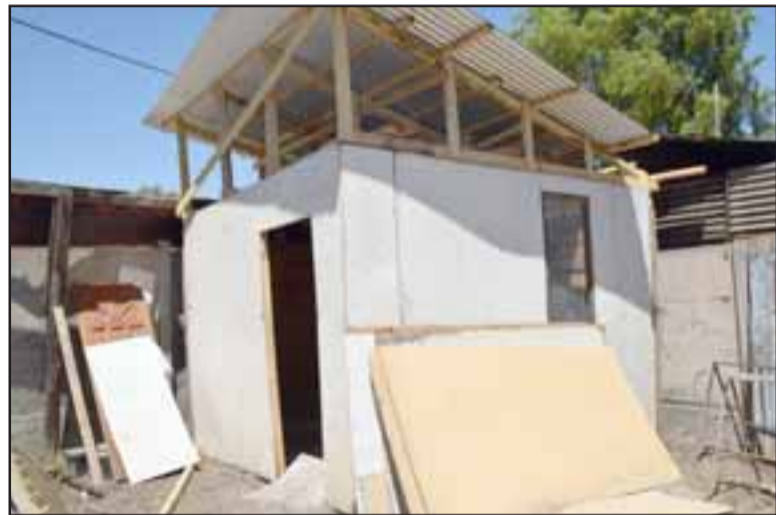
FALTA POCO.- Esta es la pieza que algunos de sus amigos le están construyendo, ojala el panorama cambie para bien, para este vecino sanfelipeño.