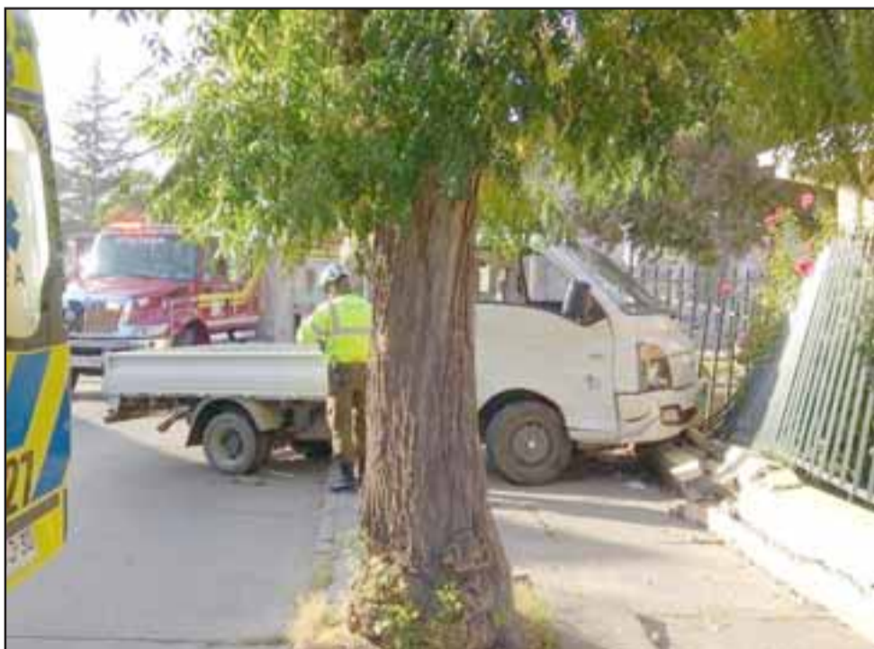
Acá vemos la camioneta que terminó incrustada en el primer accidente que se registró en el mes de mayo de este año.