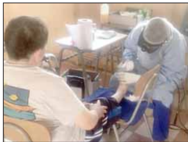
Los vecinos de Algarrobal recibieron atención en podología, consultando especialmente adultos mayores.

lizar estos operativos, en lo que queda del año y también en enero y febrero», comentó Opazo.