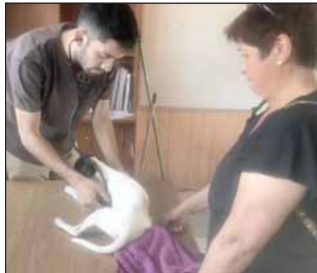
Las mascotas también recibieron una completa atención en el operativo social.

«Los vecinos nos han solicitado poder realizarlo un día sábado, así que vamos a realizar una planificación en conjunto con el equipo de voluntariado para poder seguir en terreno en los colegios para rea-