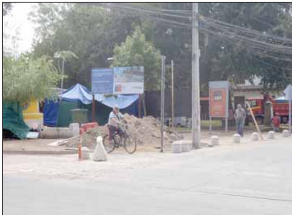
El costado norte de la avenida Yungay con Prat.

Por resolución de fecha 24 de julio de 2018, en causa Rol C-610-2018, caratulada "Agrícola Encón Palomar con MOP Dirección General de Aguas", sobre aprovechamiento de derechos de aguas, del Primer Juzgado de Letras de San Felipe, se recibe la causa a prueba por el término legal, fijándose como hechos sustanciales, pertinentes y controvertidos los siguientes: 1.- Efectividad de la existencia de los puntos de captación de aguas subterráneas cuya regularización y derechos se solicita, en su caso, caudal de los mismos y forma de extracción. 2.- Periodo de uso y si éste ha sido permanente y continuo en el tiempo. Hechos y circunstancias que así lo acrediten. 3.- En su caso, efectividad que la utilización por el solicitante ha sido efectuada libre de clandestinidad o violencia y sin reconocer dominio ajeno. Hechos y circunstancias que así lo acrediten. Se fija para recibir la testimonial que rindan las partes, la audiencia de los dos últimos días hábiles del probatorio, de Lunes a Viernes a las 10:30 horas y si recayere en día Sábado, al día hábil siguiente en el horario señalado.