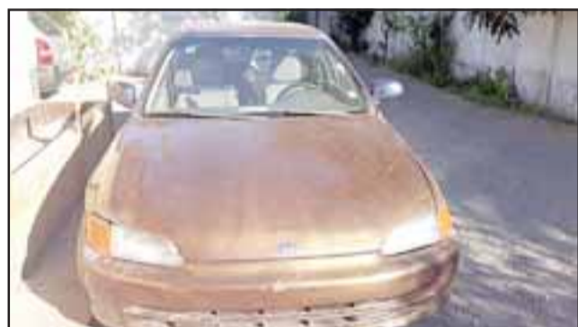
El imputado mantenía las llaves de este vehículo que momentos antes había sido sustraído desde la ciudad de San Felipe.