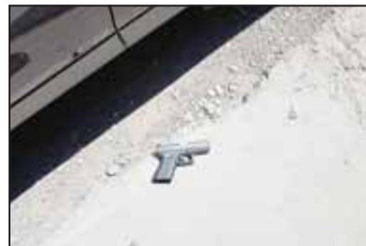
El sujeto se habría despojado del arma de fuego que mantenía en su poder.