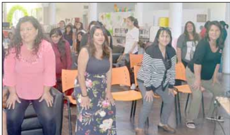
BIEN PREPARADAS.- Las mamitas embarazadas también aprendieron saludables ejercicios para mejorar su embarazo.

Es importante señalar que el Baby Shower Comunal está enmarcado en el Programa Chile Crece Contigo del Ministerio de Desarrollo Social, en conjunto con la Municipalidad de Santa María. El alcalde Claudio Zurita Ibarra señaló a Diario El Trabajo que «estas actividades son tan importantes que hacen que el municipio le dé un gusto a las mujeres embarazadas de la comuna y celebrarlas como corresponde con este Baby Shower Comunal. Un agradecimiento a la Red de Protección Social que, desde el embarazo está en constante cuidado de los niños y niñas», comentó Zurita.