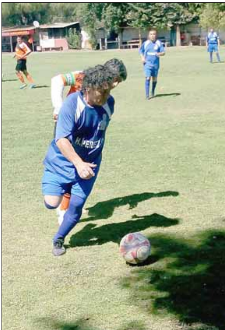
Sin sorpresas se desarrolló la pasada jornada del torneo central de la Liga Vecinal.

Carlos Barrera logró mantener su escueta ventaja sobre sus perseguidores en el torneo central de la Liga Vecinal, después de imponerse el domingo último por 4 goles a 1 a Pedro Aguirre Cerda, cuadro que con esta derrota ya perdió todas sus chances de acercarse a los puestos de vanguardia de la competencia.