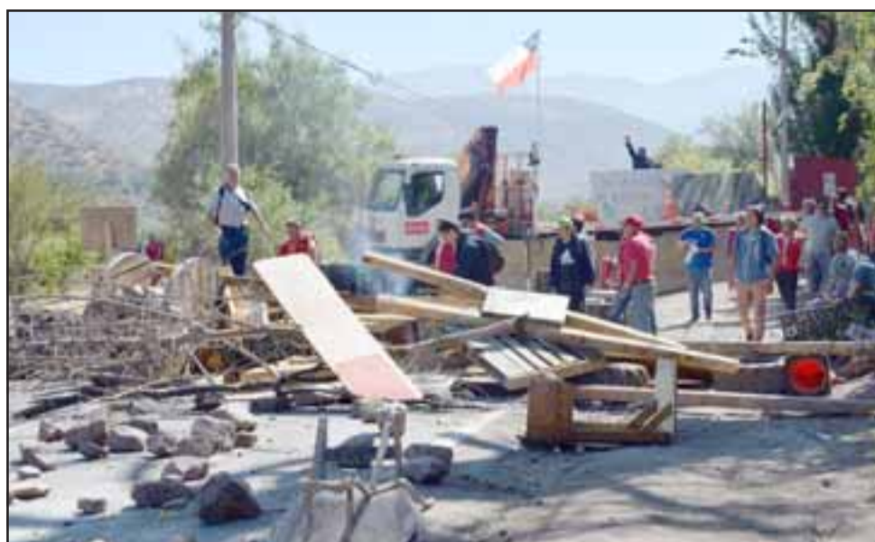
PASO BLOQUEADO.- El paso principal al hospital está totalmente bloqueado por estas barricadas, sólo se puede ingresar por un camino emergente.

formal de los dirigentes sociales de la comunidad organizada que han venido trabajando en conjunto con todos los establecimientos de la Red. Nosotros entendemos y validamos el legítimo derecho de los trabajadores de la empresa a manifestarse y a exigir sus demandas, sin embargo cuando la situación traspasa las barreras del lugar donde ellos se encuentran, que es el sector de la obra y esto afecta la comunicación, el flujo normal y el funcionamiento normal del hospital, para nosotros es muy complejo. Nosotros como comunidad hospitalaria rechazamos todo acto de violencia que pueda ocurrir al interior del establecimiento, y que genera una sensación y ambiente de temor al interior del establecimiento, independiente de si ellos se encuentran en la obra o en el espacio asignado a la empresa que construye, el día lunes en la noche se sintieron explosiones, en donde nuestros trabajadores se vieron expuestos a situaciones de riesgo, entendemos que hay una necesidad de luchar por sus reivindicaciones, pero también nosotros como trabajadores exigimos nuestro legítimo derecho de acceder a