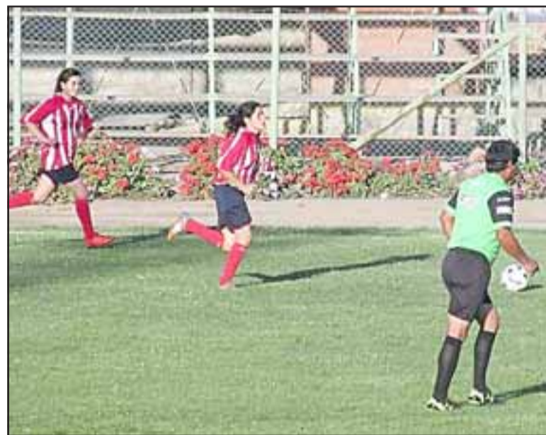
Por los octavos de final del Regional Femenino chocarán San Felipe y Rinconada.

Hijuelas – Los Placeres; Valparaíso – Cartagena; Villa Alemana – Reñaca; Limache – Achupallas; Quilpué – Manuel Montt; Unión Peñablanca – Unión Pacífico; Rinconada – San Felipe.