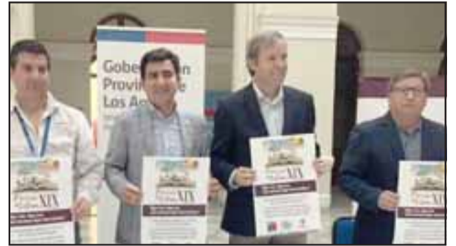
El gobernador de Los Andes junto a representantes de la Asociación de Funcionarios de la Gobernación y de Codelco División Andina, en el lanzamiento oficial de la XIX Feria del Libro.