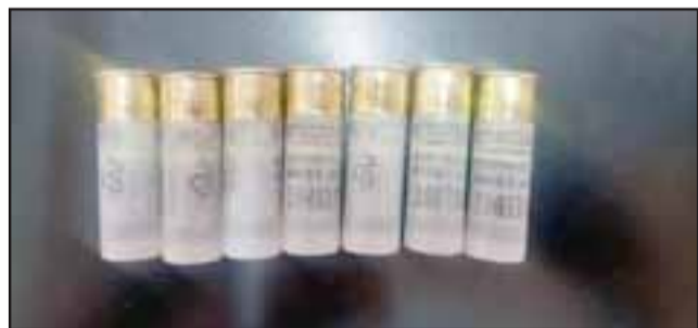
Carabineros incautó cartuchos de escopeta en el interior de un vehículo.

La Ligua. Asimismo se decomisaron siete municiones 9 milímetros, siete cartuchos para escopeta calibre 12, un cortaplumas y el vehículo encargado por robo.