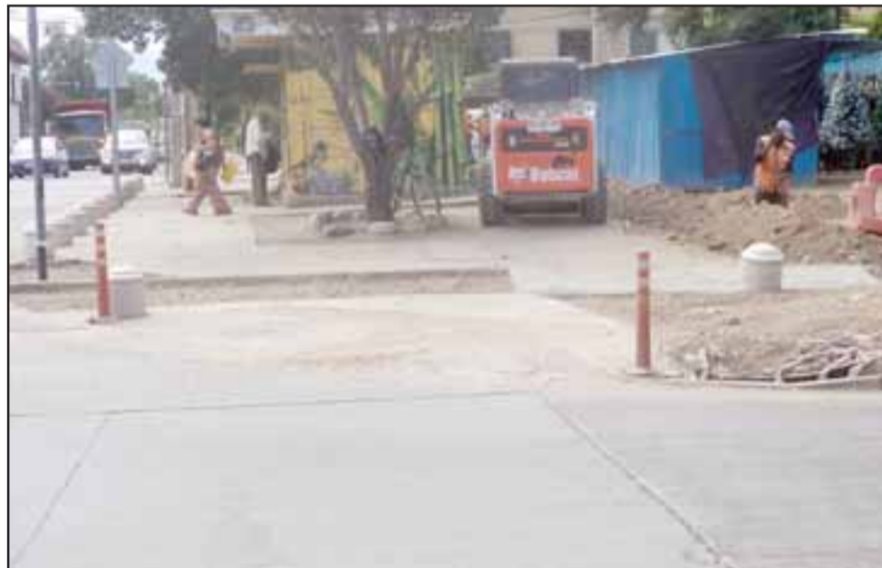
Acá vemos la rotura de avenida Yungay, al lado de la feria del Juguete.

Asimismo agregó que «han sido intervenciones distintas, complementarias, pero que eran necesarias hacerlas según nos señaló el Serviu», finalizó el profesional.