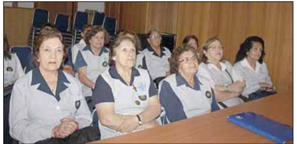
Damas de Blanco, Damas de Rojo, Damas de Rosado, Voluntariado Caritas Chile, Damas de Vedruna y el Consejo Consultivo de Usuarios, fueron las instituciones homenajeadas.