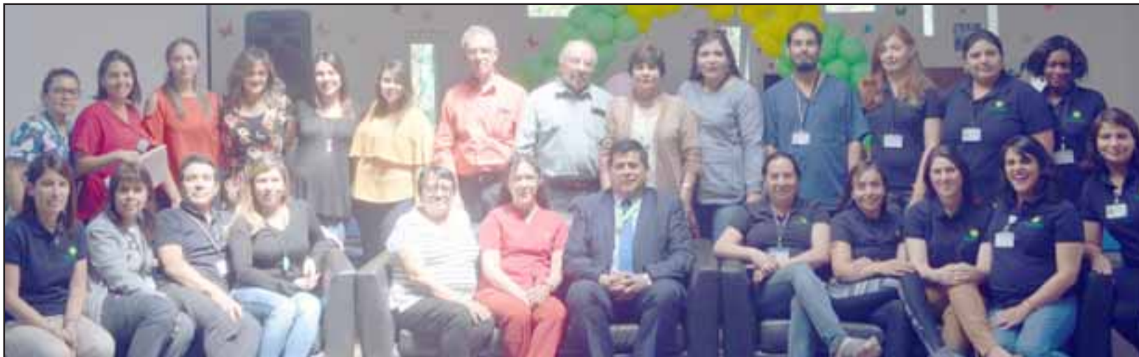
EXITOSA JORNADA.- Aquí tenemos a varias de las madres que participaron este año en el tercer Baby Shower Comunal 2018, desarrollado en la Biblioteca de Santa María.

SANTA MARÍA.- Esta semana se realizó el tercer Baby Shower Comunal, una actividad en la que la Red de Protección Social Comunal de Santa María, compuesta por profesionales del Municipio, de Salud y de Educación de la comuna, realizan una fiesta en honor a las mujeres embarazadas de Santa María, transformándose en un verdadero baby shower para ellas. Esta actividad tiene como objetivo difundir y educar a las gestantes sobre el uso y beneficios de los elementos del Parn (Programa Apoyo al Recién Nacido) y así estimular su uso, además de reforzar y entregar algunos contenidos de los talleres prenatales que se entregan a todas las gestantes de la comuna.