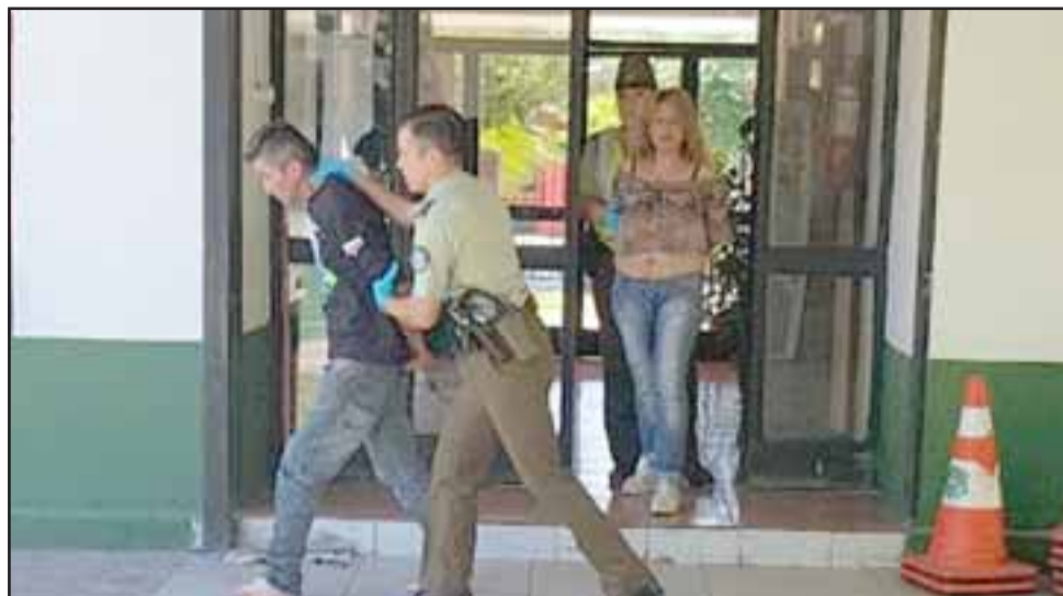
Los imputados fueron detenidos por Carabineros de la Tenencia de Santa María durante la tarde de este martes.

Carabineros detalló que la pistola incautada, calibre 9 milímetros, mantenía encargo vigente por robo, denunciado en la Fiscalía de