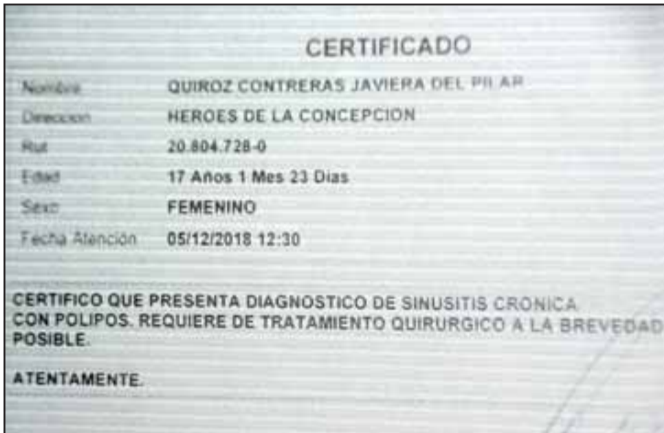
DICTAMEN MÉDICO.- Diario El Trabajo revisó a profundidad los dictámenes médicos que acreditan la gravedad de esta enfermedad.