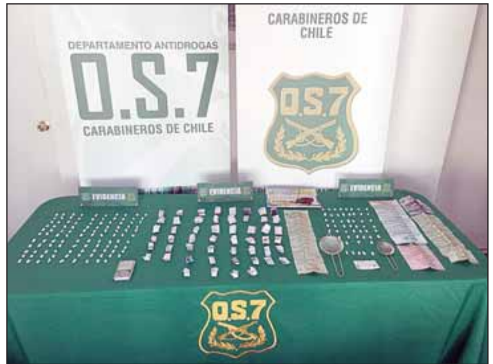
Personal de Carabineros del OS7 incautaron desde dos domicilios en la Villa Alto Aconcagua de Los Andes, pasta base de cocaína, marihuana y dinero en efectivo, siendo detenidos un hombre y una mujer.

En ambos domicilios fueron detenidos una mujer de 54 años de edad, de ini-