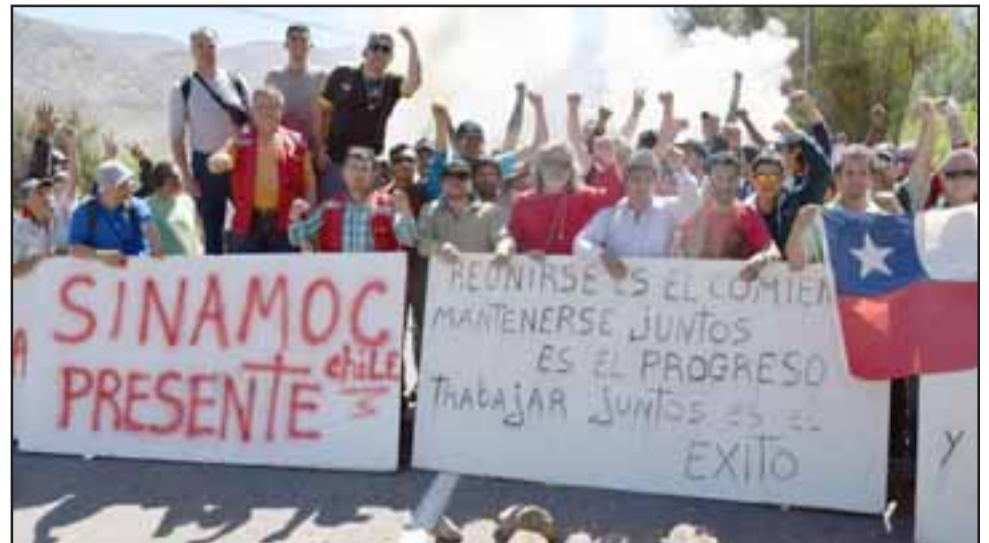
SE TOMARON EL SECTOR.- Estos obreros y su movimiento de Paro tienen preocupadas a las autoridades y muy nerviosos a empleados y pacientes del hospital.