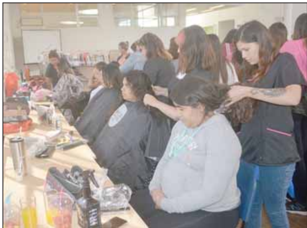
REGALONEADAS.- Estas vecinas en cambio, se dejaron ‘amononar’ por las profesionales a cargo de la actividad.