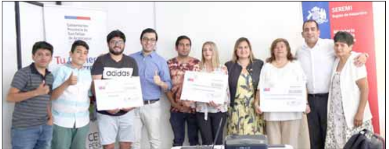
Este Fondo de Fortalecimiento de las Organizaciones de Interés Público beneficia por un parte a iniciativas que potencian a las organizaciones, permitiéndoles ser autosustentables y autónomas.

miento de las Organizaciones de Interés Público beneficia por un parte a iniciativas que potencian a las organizaciones, permitiéndoles ser autosustentables y autónomas, además de potenciar habilidades de liderazgo social, competencias técnicas y promover acciones de voluntariado. Por otra parte, también se otorga a proyectos dirigidos a fortalecer a la comunidad