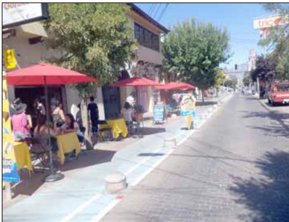
La gente respondió positivamente a la idea de boulevard, con mesas en las calles y actividades artísticas, lo que ha cambiado radicalmente la situación para la gente del rubro gastronómico.

porque busca otro tipo de objetos, digamos como para regalar; la verdad, como te digo, en lo personal digamos nosotros hemos probado distintos tipos de horarios y días para abrir; en el rubro nuestro no es significativo abrir un día domingo, a lo mejor en otro tipo de rubro puede ser, por ejemplo acá los comerciantes que venden comida tienen su clientela fija.