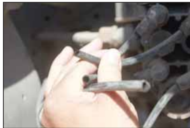
MALA LECHE.- Las mangueras y cables de los camiones fueron cortados para que no se pudieran encender las máquinas.