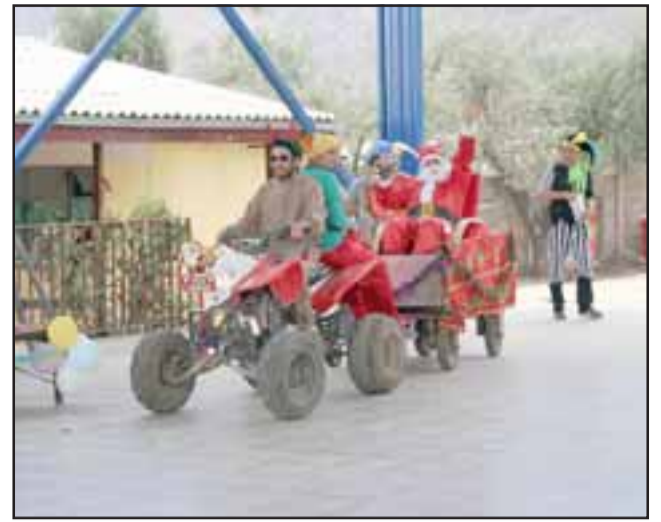
El viejito pascuero entrando al jardín infantil, donde niños y sus familias lo esperan con expectación.