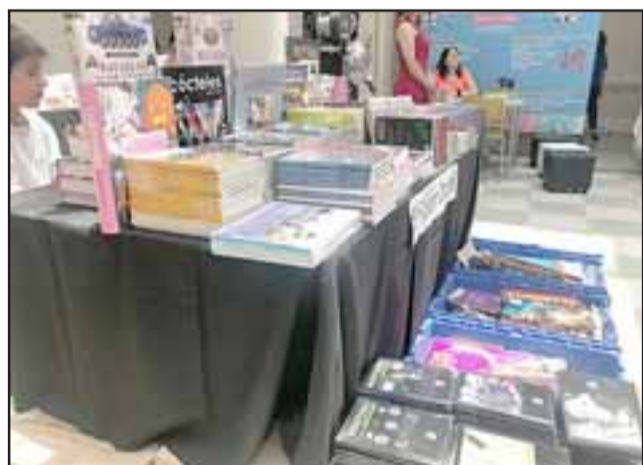
Este lunes se inauguró la XIX Feria del Libro de Los Andes, la que permanecerá abierta hasta este jueves en el edificio de la gobernación provincial de Los Andes.

historiadores, escritores de novelas para jóvenes y niños, además de la música a cargo de artistas locales y nacionales.