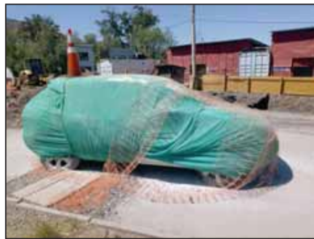
Vandalismo puro contra la propiedad y las cosas, como este automóvil, el cual fue literalmente envuelto en mallas, los neumáticos pinchados y quién sabe qué otros daños en pintura o interior.

Finalmente, Susan Porras destacó el trabajo de las diferentes instituciones que participaron en la resolución del conflicto, destacando especialmente el rol cumplido por Carabineros, la Gobernación Provincial, la Inspección del Trabajo y diversos actores sociales de Putaendo, siempre con el objetivo de cumplir con la reconstrucción del establecimiento. “El Hospital Psiquiátrico es un compromiso del Gobierno del Presidente Piñera y desde esa perspec-