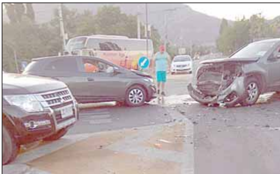
Al menos diez personas resultaron heridas en la última colisión registrada este domingo, donde se vieron involucrados tres vehículos.

es a lo que el alcalde va a postular que es el fondo Espejo, que son recursos que llegan del Transantiago a las partes regionales, y en ese ámbito estamos apuntando para llegar, estamos hablando sobre un inversión de los cien millones de pesos... es bastante.