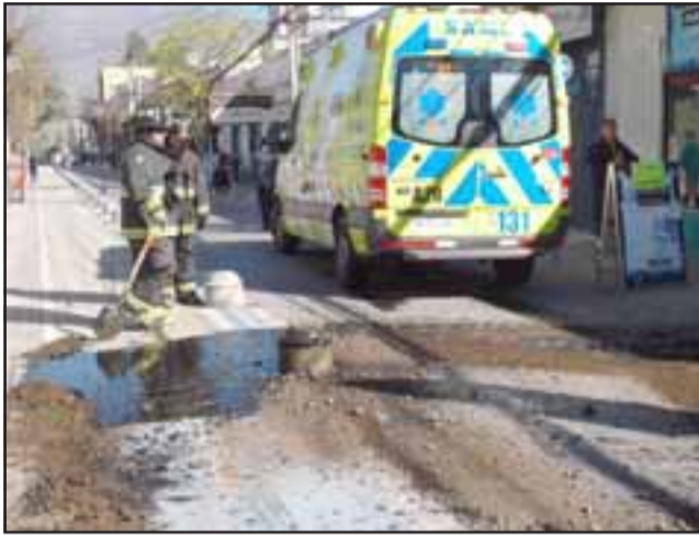
Acá vemos a la ambulancia cuando también pasó a llevar un bolardo.

No hubo heridos, solo el estado de shock que suele ocurrir en estos casos.