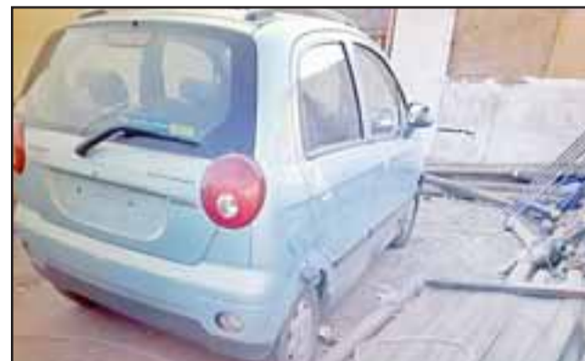
El vehículo fue encontrado por Carabineros en el domicilio del actual sentenciado en el sector de Curimón el 29 de noviembre del 2017.