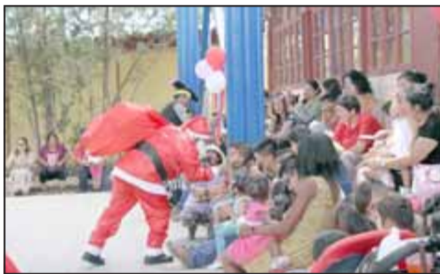
Toda la comunidad educativa participó de la fiesta de Navidad que trabajadores de Andina brindan cada año.

actividad. «Me parece súper bueno, la fiesta es preciosa y ya no hay cosas gratis y ellos además están regalando tiempo que están haciendo, porque».