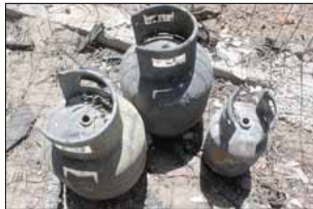
TEMPERATURAS INFERNALES. - Los tres balones de gas explotaron durante el siniestro, tal como lo registran nuestras cámaras.

La municipalidad reaccionó a través de Emergencia Municipal y la Dideco, a través de su Departamento de Asistencia Social; «reaccionamos de inmediato, realizamos la entrega de un Kit de Emergencia, mismo que contiene colchonetas, alimentos no perecibles y artículos de aseo, estamos trabajando desde la evaluación social y técnica constructiva, donde los vecinos pidieron que nos concentrásemos en la compra