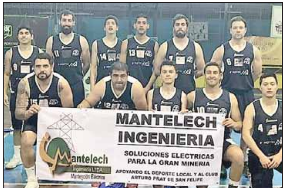
El quinteto pratino está en la actualidad en el penúltimo lugar de la tabla solo por la diferencia de goles.