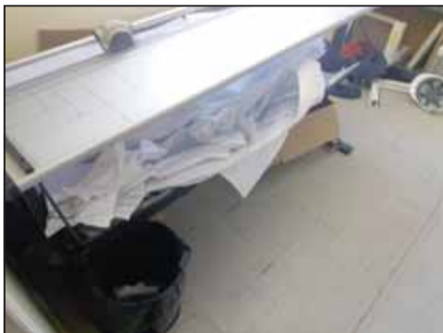
Ni los planos se salvaron de la actitud destemplada de los dirigentes del movimiento, quienes tras los daños huyeron de la comuna.