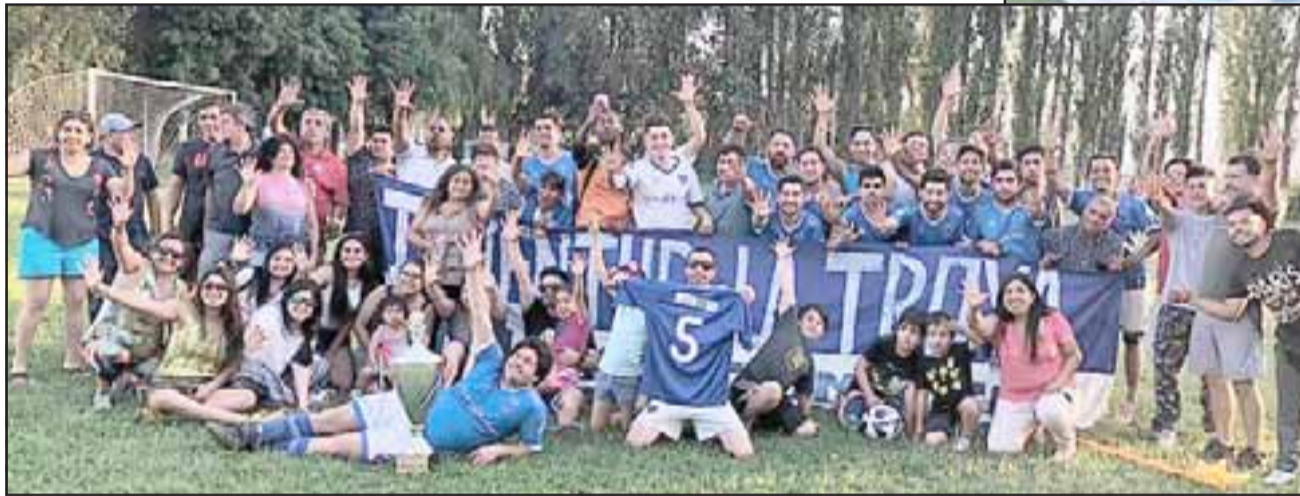
Los jugadores festejaron junto a su hinchada este nuevo logro de Juventud La Troya en la categoría más trascendente en el fútbol local.

Con este título La Troya aseguró su participación en la Copa de Campeones como San Felipe 1. El nombre del, o sus acompañantes al máximo torneo de clubes de la región, deberá esperar por el momento, ya que Unión Delicias, Alianza Curimón y Ulises Vera quedaron igualados en puntaje, situación que