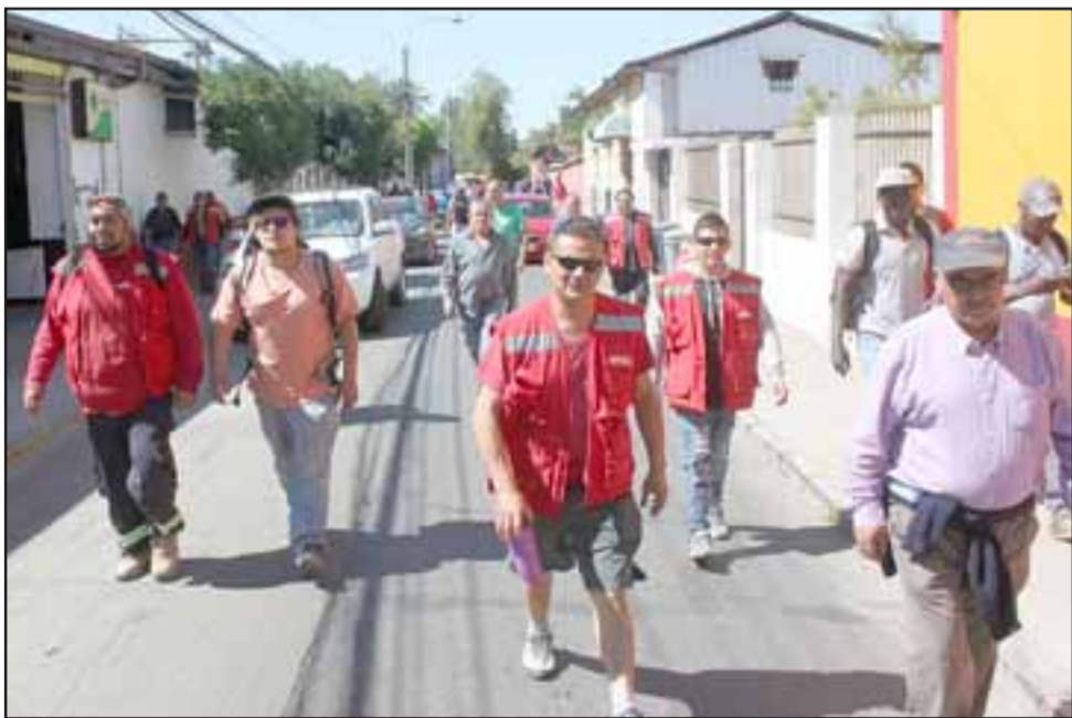
FIN DE LA HUELGA- Los trabajadores que no apoyaron las acciones del bloque de ayer lunes, marcharon pacíficamente por las calles de Putaendo, en busca de una solución e integrarse al trabajo.