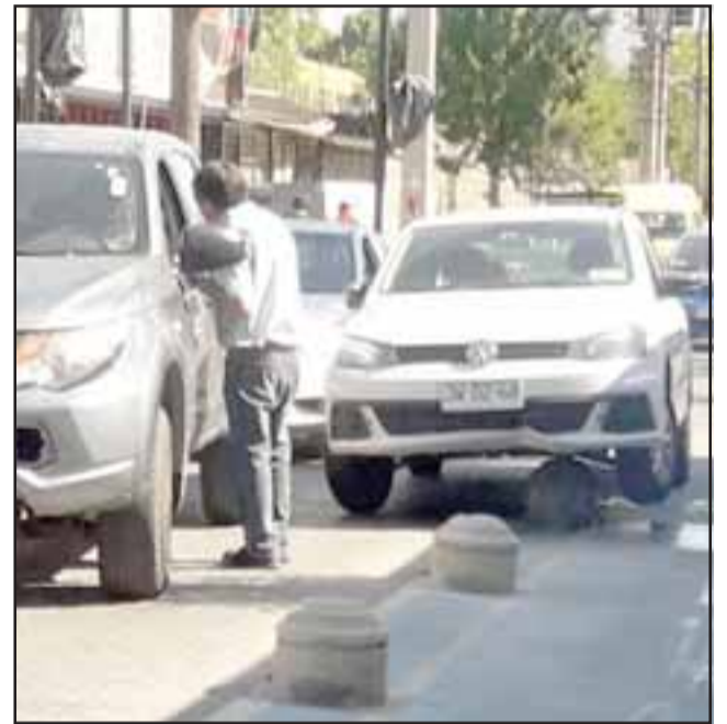
El automóvil marca Volkswagen quedó montado sobre un bolardo en la esquina de Salinas con Santo Domingo.

Fiscalía y PDI desbaratan banda de traficantes: