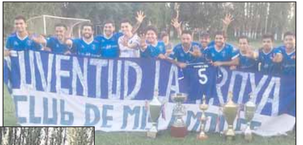
La serie de Honor de Juventud La Troya se alzó como la mejor de todas en el balompié aficionado sanfelipeño.

los embates de un Unión Delicias que con más ganas que fútbol se fue tras la paridad. “Los muchachos mostraron personalidad y tuvieron mucha hombría porque no era fácil jugar el domingo, es más, dos jugadores nuestros no quisieron estar para evitarse problemas” , comentó a El Trabajo Deportivo , un miembro de Juventud La Troya.