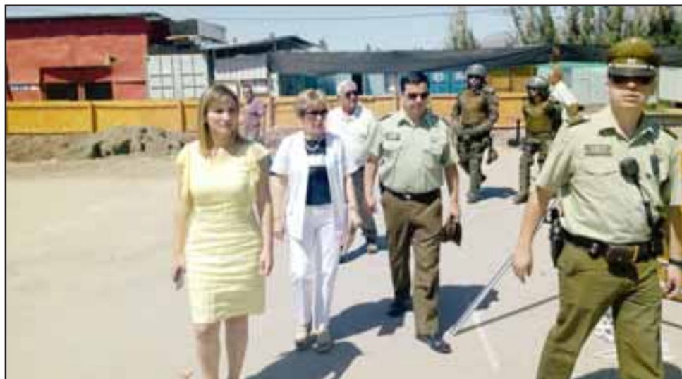
La directora del Servicio de Salud recorrió las obras y pudo percatarse del daño causado por algunos trabajadores que estuvieron en la toma.

La autoridad agradeció la voluntad y disposición de los funcionarios del Hospital Philippe Pinel, que pese a todas las condiciones de anomalía vividas durante estos días, realizaron su trabajo de la mejor manera posible. “Siempre hemos dicho que no puede ser que el derecho de los trabajadores a mejorar sus condiciones laborales, pueda interferir con el de nuestros funcionarios a acceder libremente al hospital, ni con el de los usuarios y sus familias a recibir atención de salud