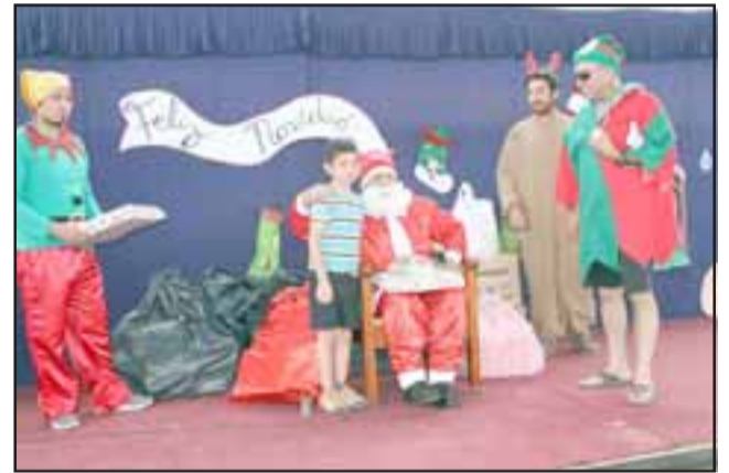
Cada niño y niña del jardín infantil Campanitas de Jahuel de Santa Filomena recibió su regalo.