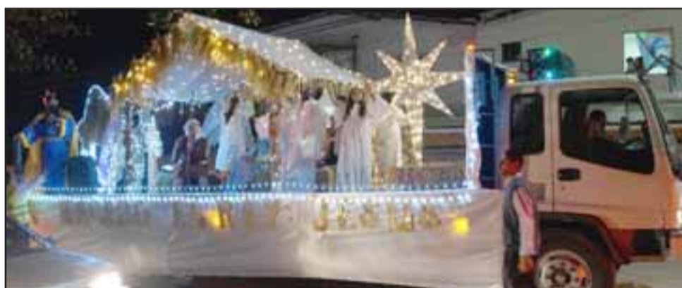
BIEN ILUMINADO.- Aquí tenemos el pesebre móvil diseñado por la 2ª Compañía de Bomberos de San Felipe, haciendo su trabajo comunitario.