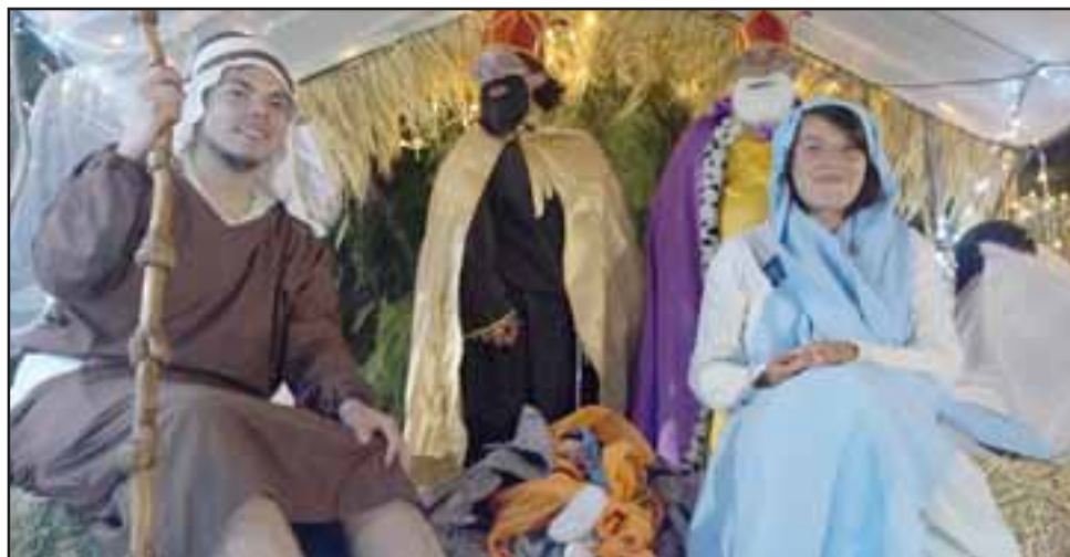
PESEBRE MÓVIL.- Ellos son los personajes María y José, dándoles fuerza y vigor a este pesebre móvil que recorrió las poblaciones de nuestra comuna esta Navidad.