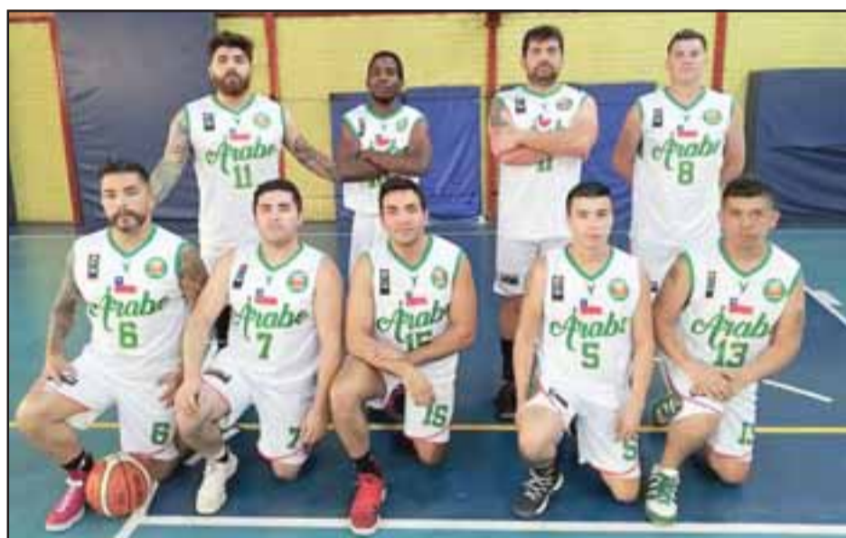
El equipo de Árabe sucumbió ante el poderío y buen momento por el que está pasando el Frutexport.

Durante la tarde de ayer en la ciudad de Viña del Mar, se realizaría el sorteo para definir las llaves de cuartos de final.