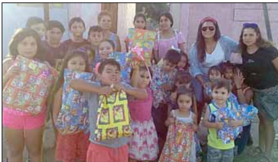
Y LLEGARON LOS JUGUETES. - Aquí vemos a estos pequeñines de Puente, en Los Andes, recibiendo sus juguetes, son regalos que llegaron gracias a quienes los donaron y estas vecinas jugueteras.

partamental, Yevide, Población Puente, Callejón Los Naranjos, Departamentos Encón, Algarrobal, Villa Santa Teresita, Población San Felipe, Juan Pablo II y La Parrasía y Los Álamos, entre otras, en total fueron más de 100 juguetes, también en poblaciones de Los Andes.