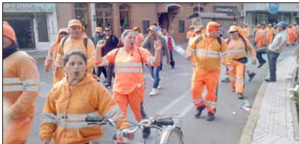
El grupo de recolectores pasando por calle Coimas en dirección al municipio de San Felipe, minutos antes de reunirse con la autoridad.

Fueron unos sesenta los trabajadores que se manifestaron, entre ellos barredores, encargados de recolección y también de volumen alto.