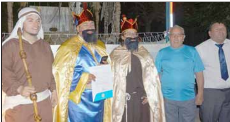
TRÍO CON CORONA.- Los tres Reyes Magos tampoco podían faltar a esta cita navideña, ellos llegaron con regalos, aceite, oro y mirra.