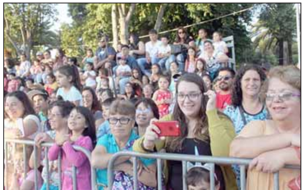
CIRCO TACHUELA JUNIOR. - Cerca de 2.000 personas se dieron cita en la Plaza de Armas de Santa María, para disfrutar del cierre del 127º Aniversario de la comuna.