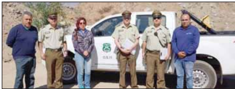
Representantes de la empresa a cargo del show pirotécnico, la unidad fiscalizadora de explosivos de Carabineros de Los Andes, Bomberos y de la unidad de emergencias de la Municipalidad de Llay Llay, inspeccionan el lugar donde serán lanzados los fuegos.

tivo e importancia para los llayllaínos, lo que quedó en evidencia el año 2017, cuando los habitantes de la comuna pudieron votar a favor o en contra de su realización en una encuesta desarrollada por el municipio local, la que fue gestionada a través de las juntas de vecinos y de manera digital en la página web de la municipalidad. En dicha ocasión la consulta ciudadana arrojó que la gente prefería el espectáculo pirotécnico, en contraste a la idea de utilizar el mismo presupuesto