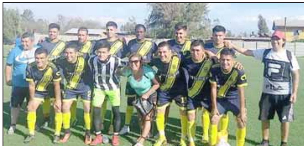
La serie de Honor de Unión Delicias clasificó a la Copa de Campeones.