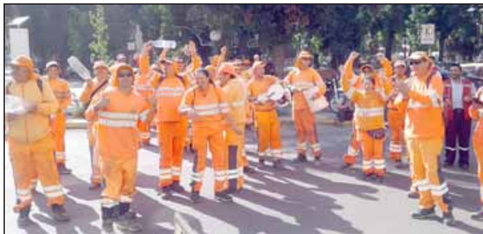
El grupo de recolectores protestando en el frontis del municipio.