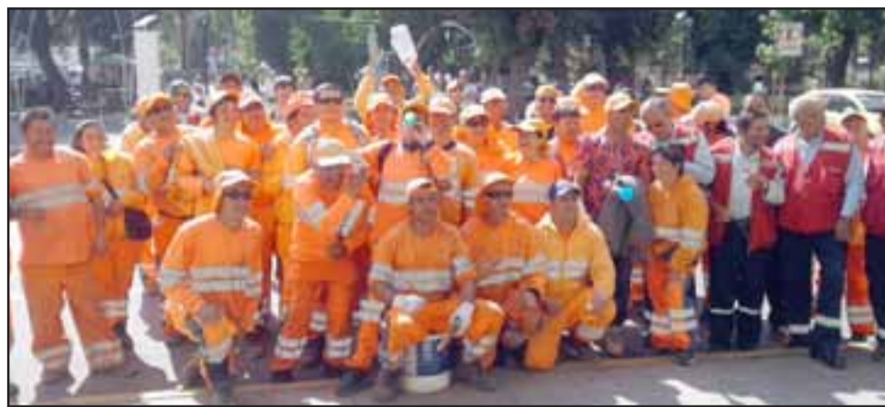
Los recolectores luego de la reunión sostenida con el alcalde (s) Jorge Jara Catalán.

nosotros veníamos a solicitar, no porque él no pueda hacer algo, nosotros no nos sentimos gratos con su respuesta; conversamos con el administrador municipal, nos llevamos una mejor respuesta, están llanos a recibirnos en una mesa de trabajo para poder conversar con el municipio sobre mejoras para nuestros trabajadores, nuestro contrato y así poder respaldarnos. El administrador dice que en estos momentos se van a pagar dos facturas a la