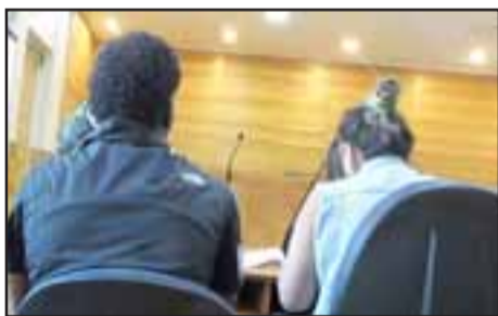
El delincuente habitual fue acusado solamente por violación de morada, ya que no alcanzó a sustraer especies.

Fue sorprendido y reducido por propietario del inmueble.