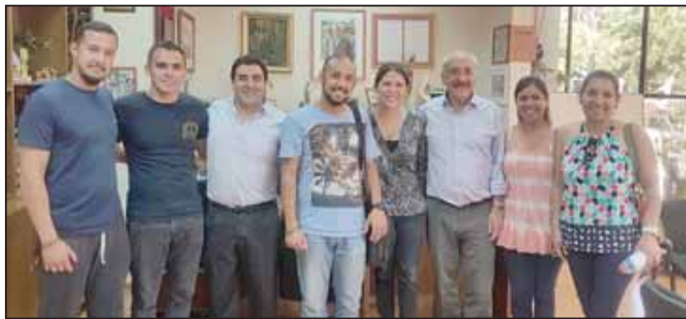
Los comerciantes del rubro gastronómico están más que felices con la implementación del boulevard en Prat, por lo que están pidiendo mantenerlo al menos por el verano.