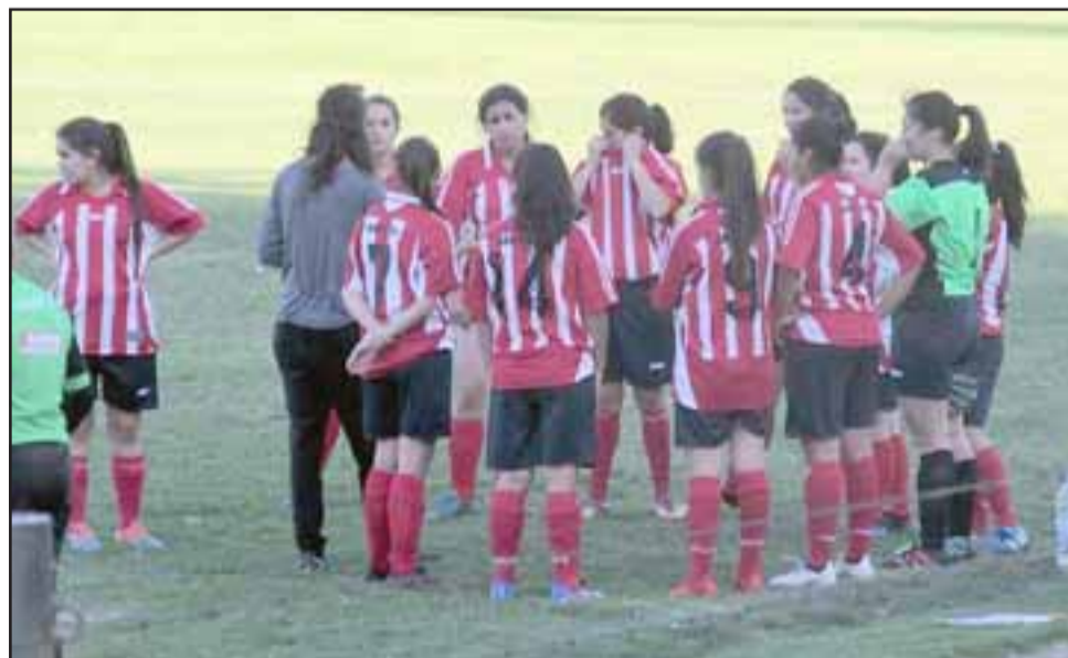
Una serie de combinaciones permitieron que la selección de San Felipe avanzara como mejor perdedor a los cuartos de final del Regional de Mujeres.