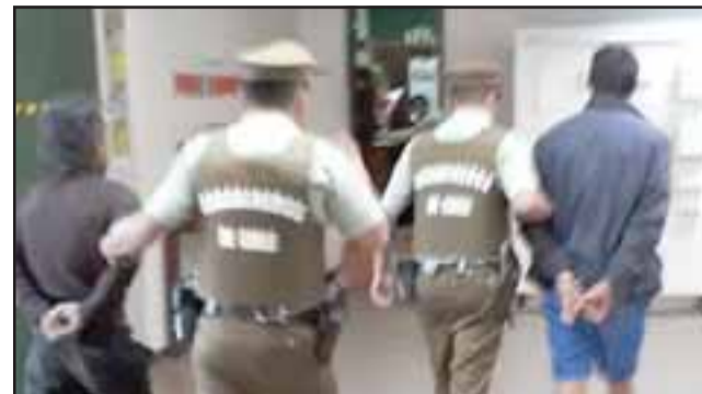
Los detenidos fueron capturados por Carabineros de Catemu por el delito de robo con violencia ocurrido la madrugada de este lunes.

Los imputados fueron identificados con las iniciales L.A.A.Q. de 38 años de edad y B.A.E.F. de 25 años de edad, quienes fueron de-