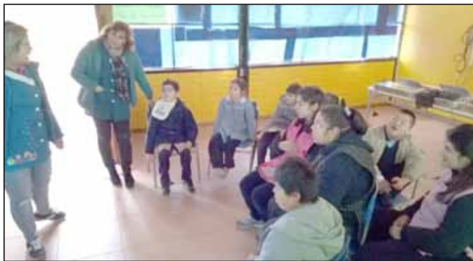
Este año la celebración del Día de la Discapacidad se realizó en el teatro de la comuna.

También se dio a conocer la obtención de un proyecto en Senadis de $8.100.000 Los equipos