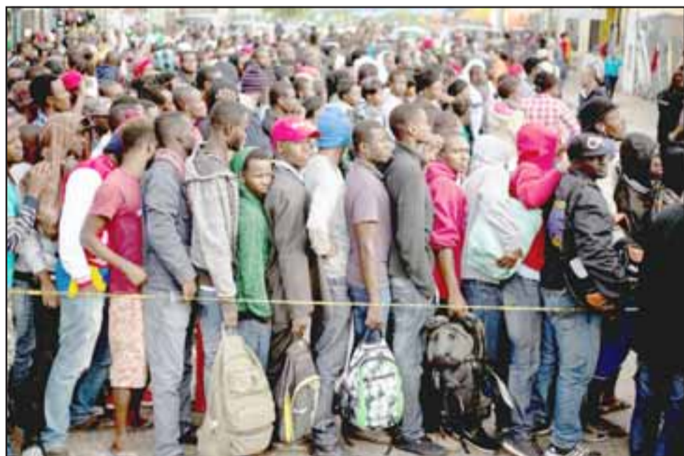
VOLVIENDO A CASA. - Muchos son los haitianos que han retornado a su país en los últimos meses por iniciativa propia. (Referencial)