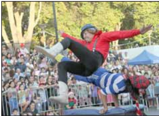
GRANDES ACRÓBATAS. - Aquí tenemos a los mejores acróbatas del Circo, estos payasos en verdad que arrollaron con el público presente.