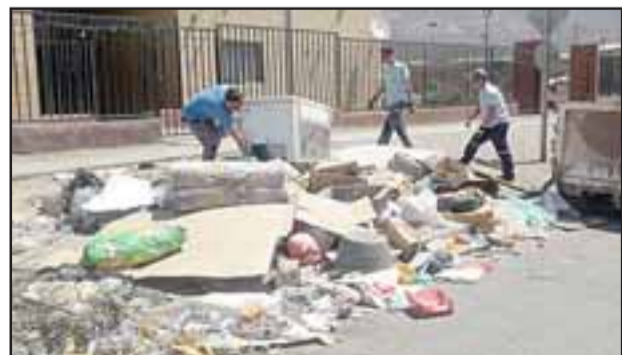
Pese al paro de los trabajadores, el municipio se encargó de realizar con personal propio la recolección de basura.

A su vez, se informó que, si bien la paralización generó inconvenientes en el retiro de la basura domiciliaria, se trabajó con personal municipal y de la empresa de mantenimiento de áreas verdes, en sectores críticos, desarrollando acciones de limpieza y retiro.