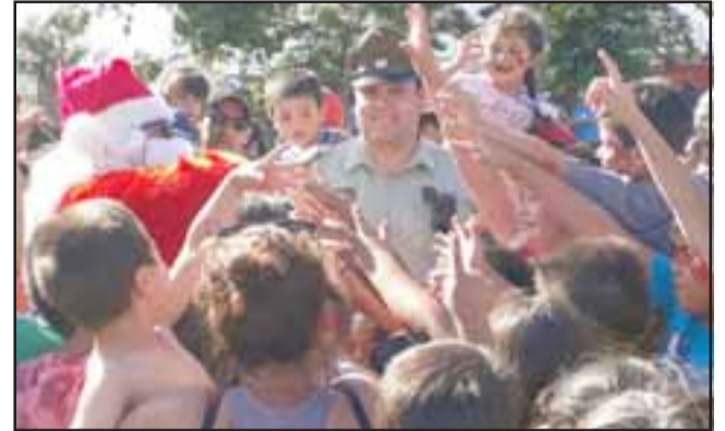
Los niños estaban ansiosos por la visita del Viejito Pascuero en la comuna de Llay Llay.