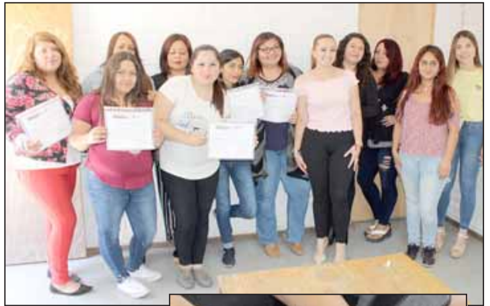
En total fueron 10 mujeres del Programa Mujeres Jefas de Hogar de Panquehue, las que recibieron este curso de Manicure.

El programa ofrece el acceso a Talleres de Forma-