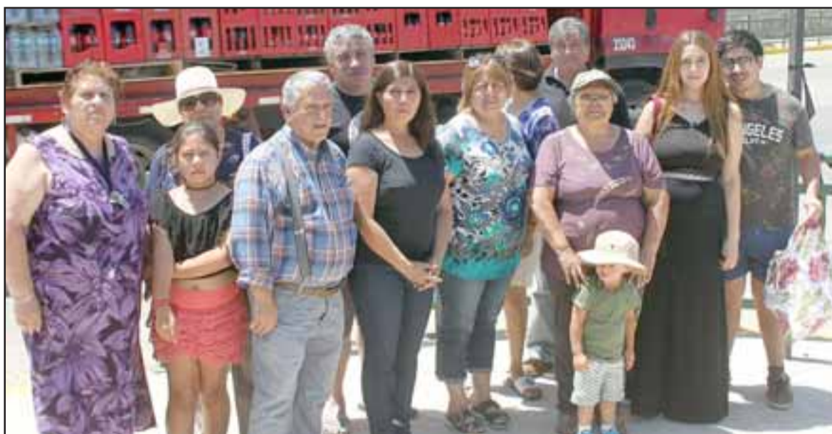
VECINOS INUNDADOS.- Ellos son vecinos de Villa El Señorial, quienes están viviendo serios apuros con las filtraciones de un canal de regadío que afecta sus viviendas, mientras que el Municipio ofrece una solución definitiva para este mes de enero.