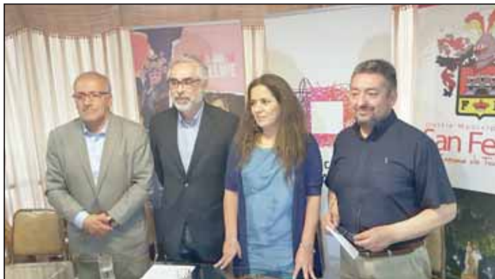
Junto a representantes de los distintos municipios que colaboran con esta versión, además del Parque Cultural de Valparaíso, se dio el vamos ayer jueves a esta actividad.

En el espacio público, en tanto, el pasacalle nacional 'Ni una abeja menos' de la compañía Cassis, recorrerá la ciudad con una puesta en escena que plantea la importancia que tienen las abejas en el ecosistema mundial, en donde el 75%