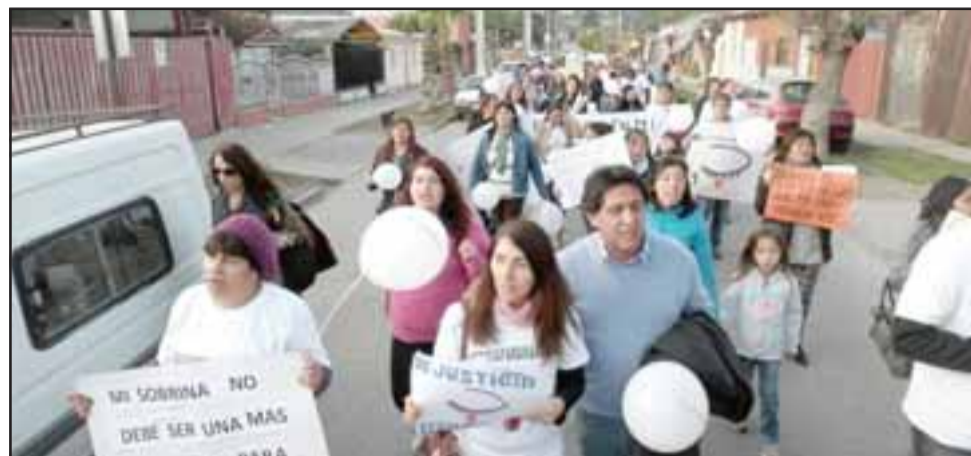
En diferentes oportunidades la familia y los vecinos han efectuado marchas exigiendo justicia por este crimen en las comunas de Llay Llay y San Felipe.