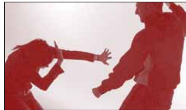
Los hechos se originaron en una vivienda de la población Santa Brígida de San Felipe en marzo de este año. (Foto Referencial).