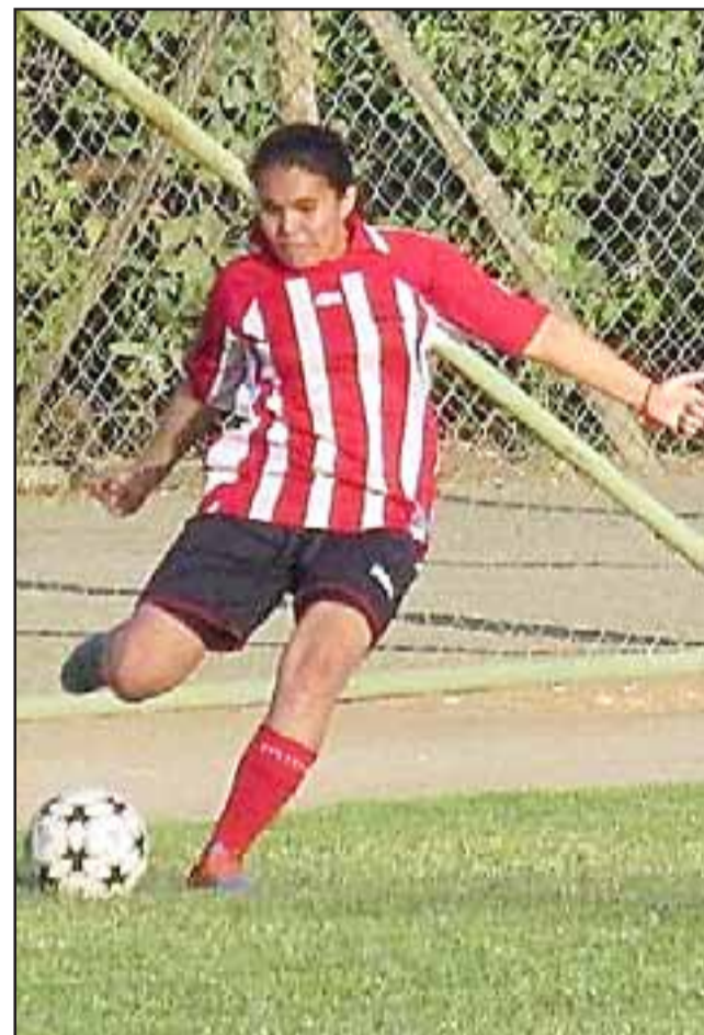
Dos equipos del valle de Aconcagua accedieron a los cuartos de final del Regional de mujeres.

Los dos seleccionados aconcagüinos partirán como locales, por lo que es vital que ganen sus respectivos encuentros para que lleguen con ventaja a las revanchas del próximo fin de semana.