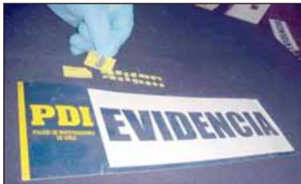
La sustancia habría sido adquirida en Argentina, en Mendoza o Buenos Aires, e internada a Chile por el aeropuerto Arturo Merino Benítez.

tención la mujer se disponía a comercializar diez estampillas de este producto en una suma de 150 mil pesos. No obstante, en total se lograron incautar 43 estampillas impregnadas con esta droga, con un avalúo cercano al millón de pesos.