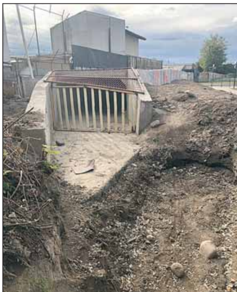
CANAL LIMPIO.- Los canaleros aseguran que este canal ya está limpio, esta foto así lo demuestra.