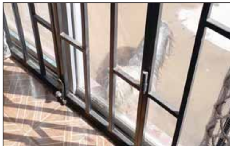
CANAL DESBORDADO.- Aquí vemos a este perrito en el patio de una casa, completamente mojado por el agua del canal dentro de la propiedad.