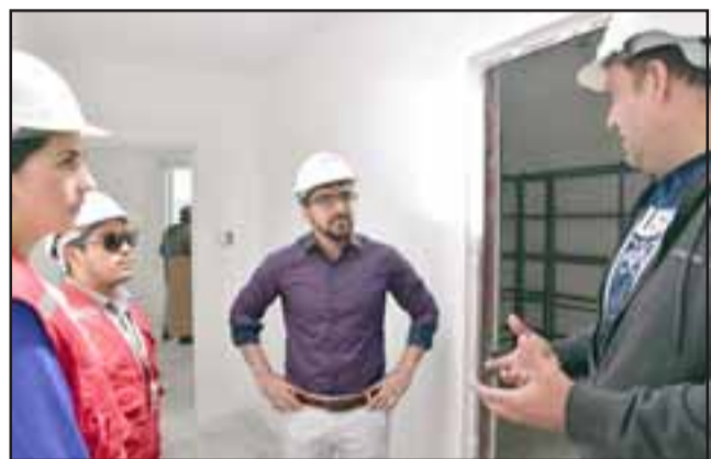
El alcalde Edgardo González visitó las obras del nuevo jardín que por sus características técnicas será el más moderno del país.

tiastillables, sistema de climatización, circuito cerrado de televisión, sistema de alarmas, mobiliario y juegos infantiles de alta calidad. Adicionalmente cuenta con una propuesta de paisajismo en suelo natural, plantación de árboles, arbustos y un huerto para mantener el contacto de niños y niñas con la naturaleza.