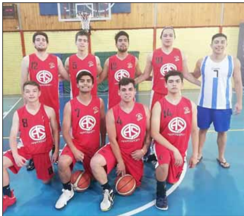
El juvenil conjunto de San Felipe Basket es uno de los animadores del Clausura de ABAR.

la liberación de la hormona del crecimiento, ayudando a reducir grasa y aumentando la fuerza.