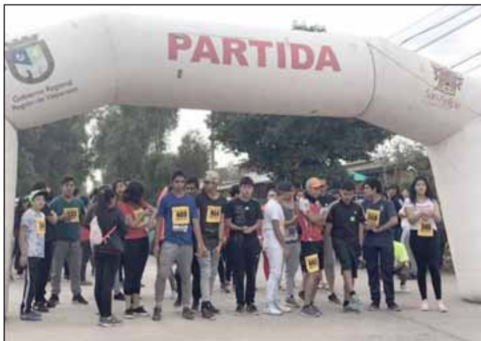
Distintas actividades realizó el Liceo San Felipe durante este año, culminando este 2018 con una evaluación muy positiva.

Asimismo, este 2018 los alumnos trabajaron de cerca con los adultos mayores, a quienes se les hizo un de-