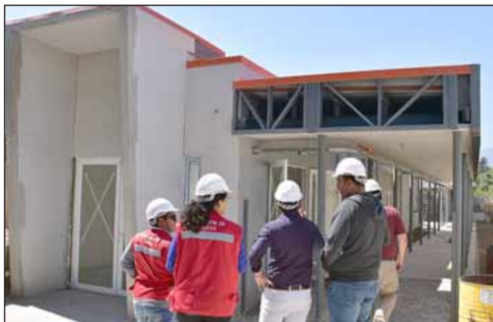
Las obras se encuentran bastante adelantadas y se espera que ahora en enero o febrero de 2019 estén terminadas.

Por medio de una propuesta sustentable con estrategias de diseño arquitectónico, el establecimiento apunta a fomentar la eficiencia energética por medio del confort térmico, lumínico y acústico, los que se complementan al utilizar un alto estándar en la calidad de los materiales de la construcción, todos certificados ante la Junta Nacional de Jardines Infantiles. La construcción abarca ventanas de tipo termopanel an-