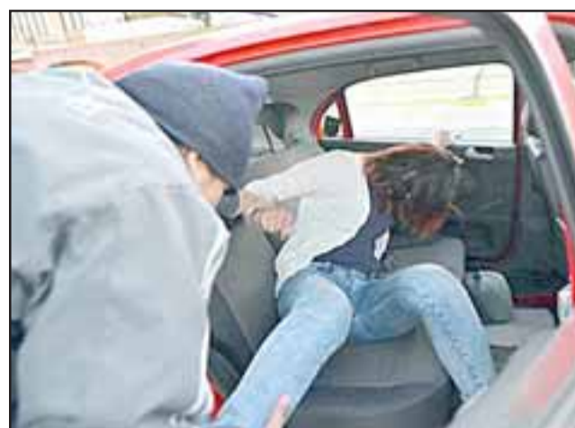
La adolescente acusó al conductor de un taxi de intentar cometer una violación al interior del móvil el año 2015. (Foto Referencial).

Fue detenido por Carabineros de Santa María: