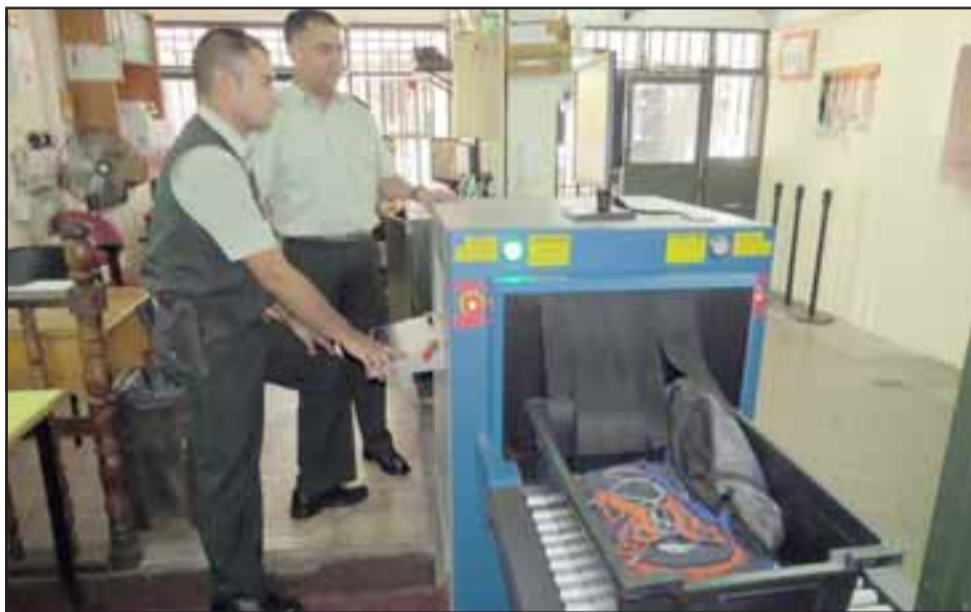
Con esta tecnología se le permite al personal trabajar acorde a las mayores necesidades de control que deben existir en el ingreso a los penales.

mente en ciertas situaciones que pueden ocurrir entre los internos, «o que puedan poner en riesgo a ellos o nuestro personal y actuar preventivamente de las distintas situaciones que pueden ocurrir en el penal».