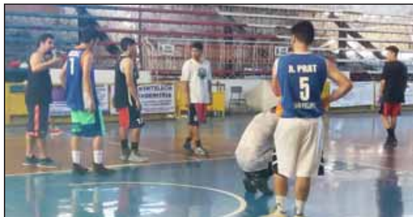
Un difícil itinerario en la fase de grupos espera al Prat en el próximo Campioni Del Domani.