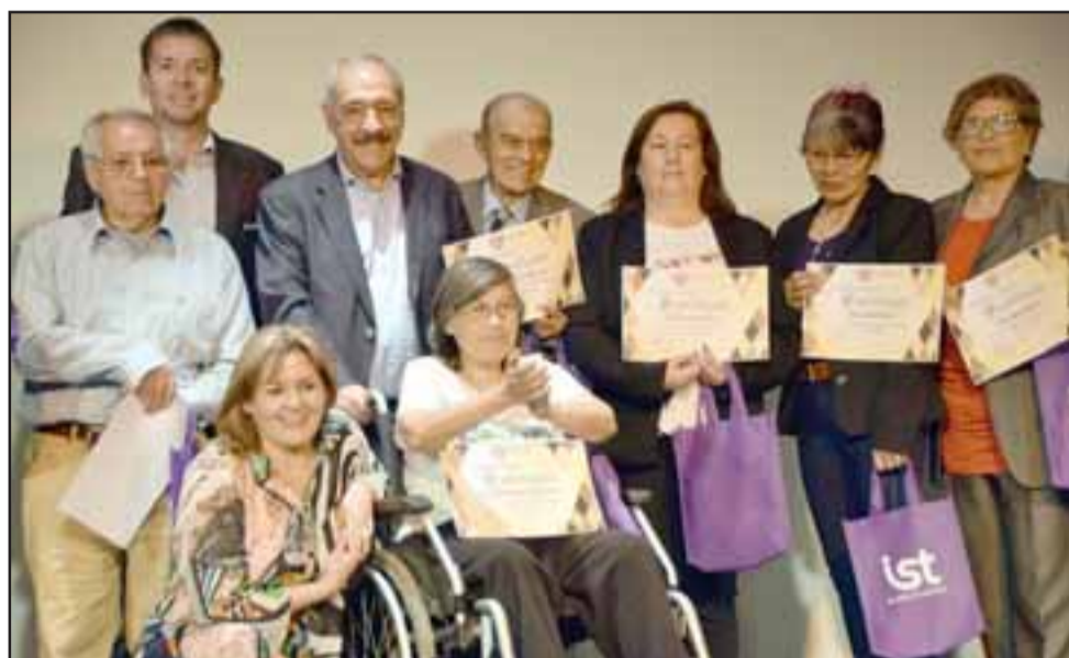
SIN BARRERAS.- No importan las limitaciones físicas para estos vecinos, ellos siempre quieren superarse y servir a los demás.

Entre las novedades para este año, según nos explicó la funcionaria, está el crear el Centro de Egresados de la Escuela del Dirigente, en el que experi-