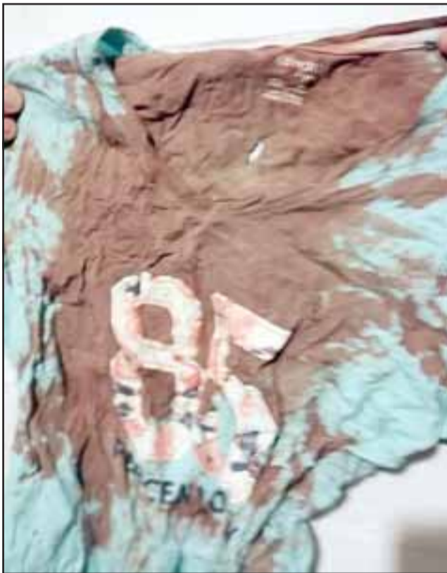
Una de las prendas de vestir manchada con sangre.

Al finalizar la nota la mujer nos indicó que su hermano había sido trasladado al hospital de la ciudad de Valparaíso.