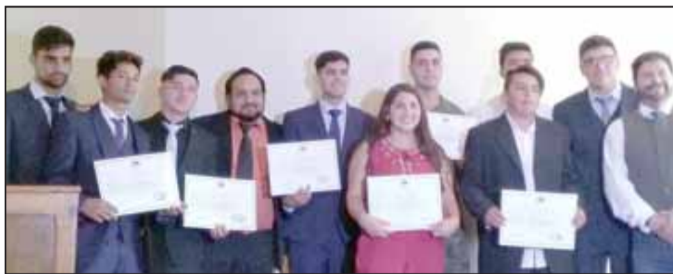
SUERTE CHIQUILLOS.- Ellos son parte de pujante Generación 2017, quienes durante 2018 realizaron su Práctica profesional.

Recordar también que el Colegio Assunta Pallota se encuentra en pleno proceso de matrícula, en su dirección de Calle San Francisco 201, Curimón o llamando al 34-2531011.