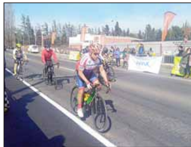
En la Vuelta Ciclista, el circuito iniciará en San Felipe, continuará por Santa María y seguirá por San Esteban.