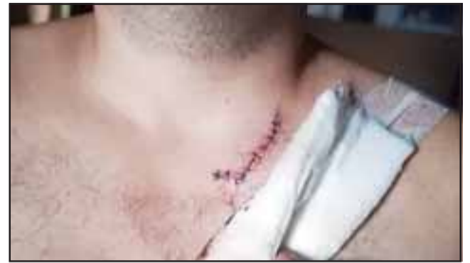
Acá vemos el corte propinado a la pareja de la mujer.

- Sí, en la fiscalía, pero yo tuve que ir a la fiscalía militar porque a nosotros el día que nos atacaron ahí afuera de Manuel Montt, nos pasaron por riña, y esto fue un asalto porque a mi hermano... bueno lo de mi hermano lo pasaron por asalto porque le llevaron el celular ese día. Lo que yo no entiendo por qué personas que están con armas blancas, se supone que a ti te deben detener si portas un arma blanca, las armas de ellos las tiene todas Carabineros: martillos, cuchillos, todas esas cosas están en Carabineros, huellas, en bolsas, con todo, ¿por qué