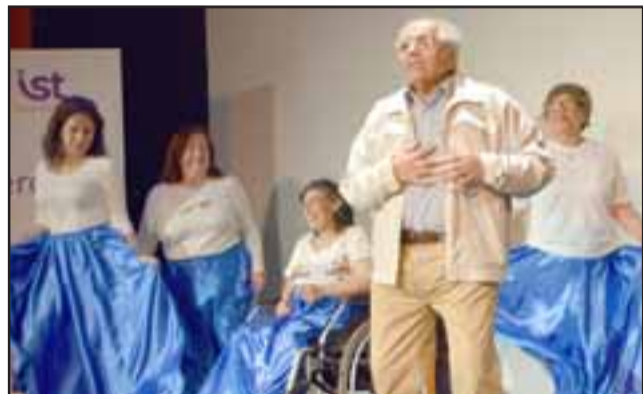
ACTORES TAMBIÉN.- Aquí vemos una de las muchas titulaciones que estos vecinos han logrado, cada uno con su chispa de humor y alegría en sus actividades.

mentados dirigentes de la comuna compartirán su experticia con los que están en formación. Tomando en cuenta que en 2018 fueron 50 dirigentes los que egresaron de esta es-