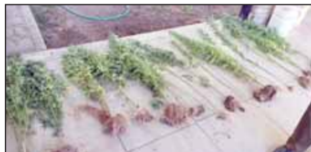
Carabineros de la Tenencia de Santa María incautó 17 plantas de cannabis sativa desde el interior de una propiedad de calle Nieto Norte de esa localidad, siendo detenido su propietario de 66 años de edad por infracción a la Ley 20.000 de drogas.

Posteriormente por instrucción del Fiscal de turno,