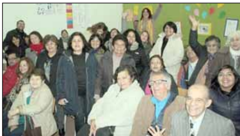
APRENDER ES CRECER.- A partir de hoy viernes se abre el proceso de Matrícula 2019 para los vecinos de nuestra comuna que quieran capacitarse.