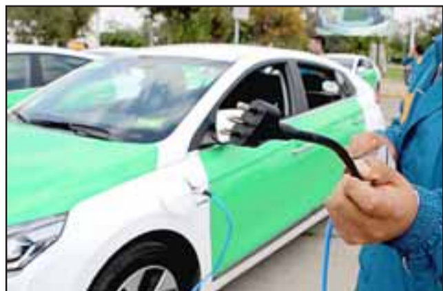
En la medida que exista esta tecnología en la zona podrían circular estos vehículos de alquiler.