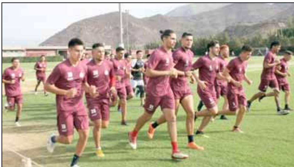
El grupo de jugadores está siendo sometido a intensos trabajos físicos.

En su primer encuentro con la prensa sanfelipeña, el técnico unionista señaló que al igual que otros años la pretemporada tendrá lugar en el complejo deportivo debido a que, "es muy cómodo, además nos permitirá hacer los partidos amistosos sin tener que trasladarnos muy lejos; a eso se suma que se podrá