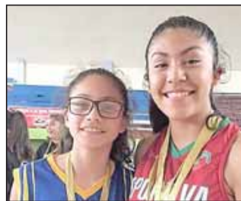
La jugadora de San Felipe Basket (a la derecha en la foto) fue citada a la concentración de la selección chilena U14.

La jugadora aconcagüina se concentró en horas del miércoles 2 de enero en las instalaciones del colegio Simons de la ciudad de Talcahuano, para ser parte de un