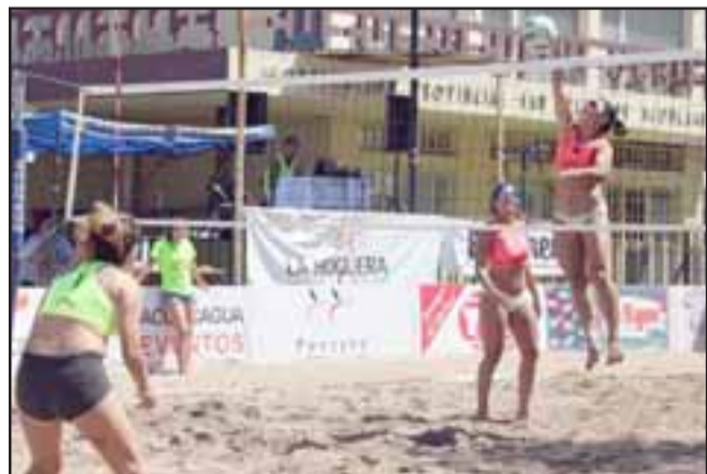
El Voleibol Arena se inicia hoy viernes, desde las 17 horas, y continuará el sábado y domingo.

iniciará a partir de las 9,00 de la mañana.