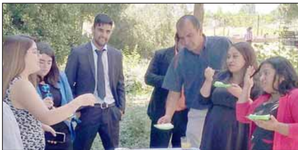
Cada uno de los egresados también recibió el cariño y digna despedida tras años de estudio en esa casa del saber.