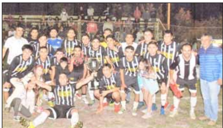
El representativo del club Cóndor ganó la Máster Cup 2018.

cuentra trabajando con miras al torneo Sudamericano de la categoría que está agendado para el mes de noviembre de este 2019.