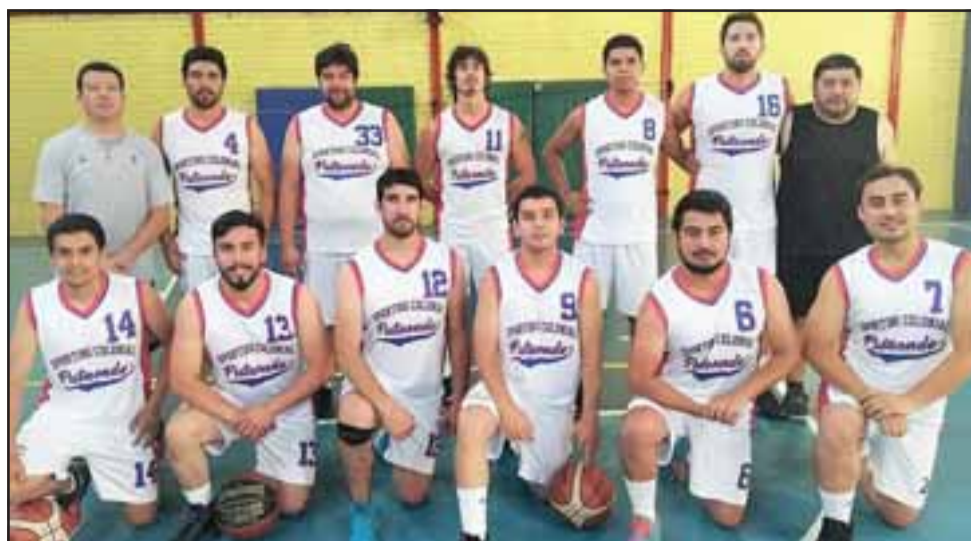
Los putaendinos de Sporting Colonial tendrán un fin de semana muy agitado ya que jugarán el sábado y domingo en el torneo Abar.