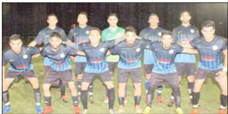
El Inter Sporting tuvo una destacada participación en el cuadrangular putaendino.