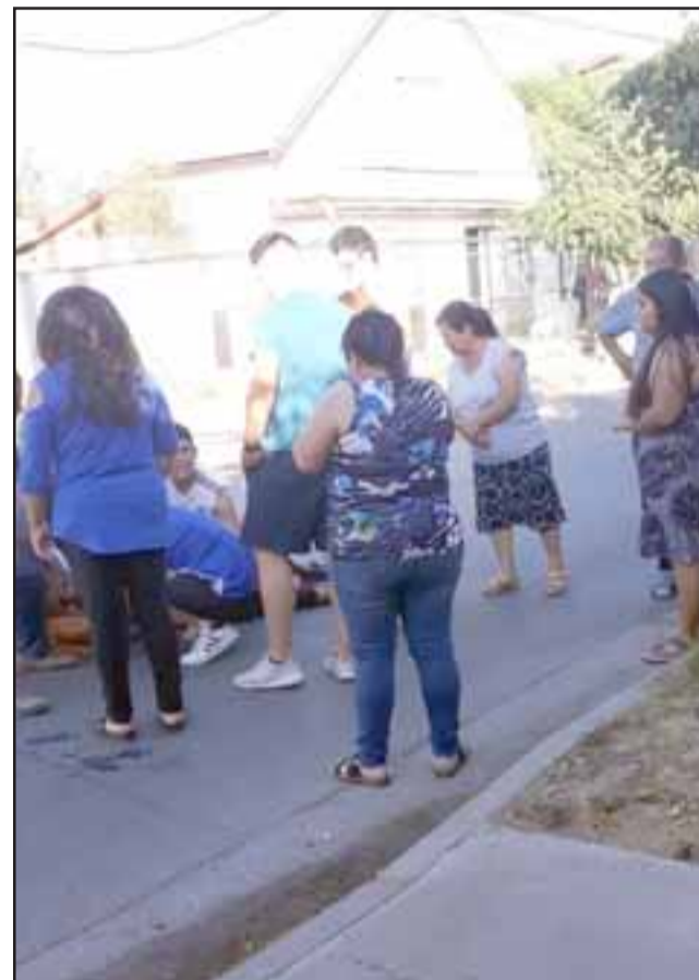
Acá se aprecia a los vecinos ayudando al joven motociclista que está en el suelo luego del accidente.