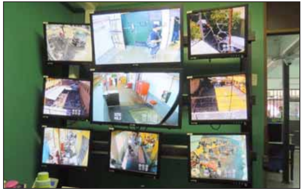
Gracias a estas cámaras se logran determinar conductas que van en contra de la seguridad del recinto.

Añadió que con esto también se puede actuar rápida-