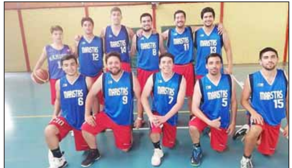
El quinteto de los Ex Maristas buscará este domingo hacerse un espacio en la postemporada del Clausura de Abar.