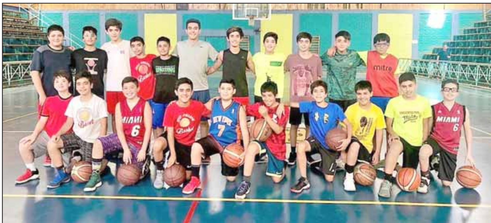
Los equipos formativos de San Felipe Basket competirán en torneos que se realizarán en Puerto Varas y Ancud.

nada su actuación en la hermosa Puerto Varas, la delegación sanfelipeña se subirá