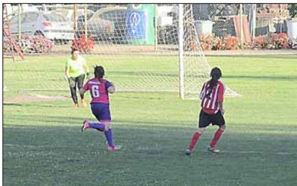
Este sábado se jugarán los partidos de ida correspondientes a las semifinales del torneo Regional Femenino.

Deportes Castro, rivales a los que enfrentará San Felipe Basket.