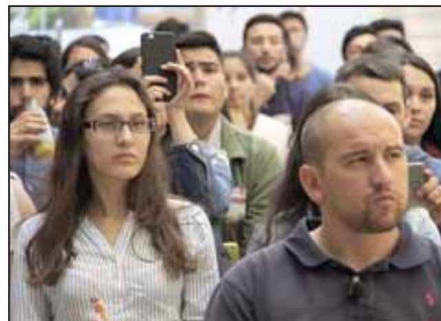
Un total de 132 jóvenes están realizando su práctica profesional en la División Andina, de los cuales 39 son de las provincias de Los Andes y San Felipe.

Doce de los estudiantes que realizarán su práctica son alumnos destacados de los liceos Polivalente Manuel Rodríguez de Til Til, Pedro Aguirre Cerda de Calle Larga, Mixto de Los Andes, Liceo de San Esteban y del Instituto Tecnológico de la Universidad de Playa Ancha (UPLA), establecimientos con los que División An-