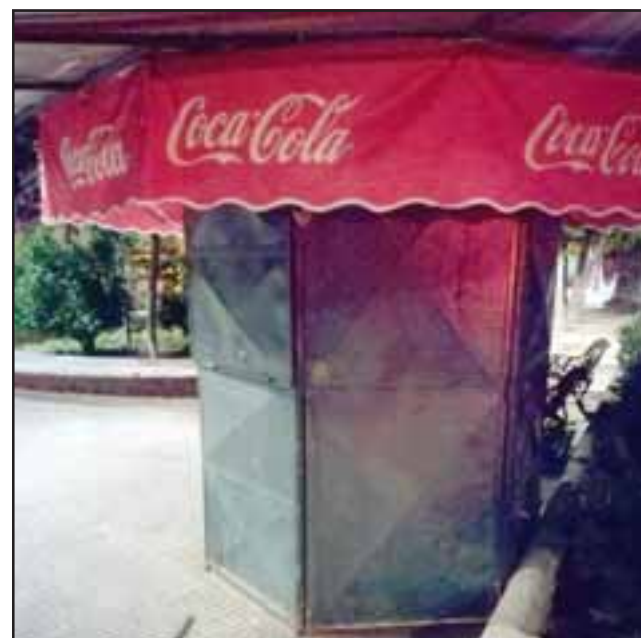
El delito ocurrió a eso de las 04:40 horas de la madrugada de este miércoles en el kiosco ubicado en la Plaza de Armas de Putaendo.