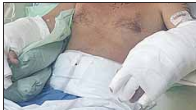
Con quemaduras bastante complejas que abarcan el 30 por ciento de su cuerpo resultó el trabajador tras la explosión del gas emanado del diluyente. (Foto archivo referencial)

efectivamente un incendio estructural en Panquehue centro, lamentablemente el incendio se produjo porque estaban haciendo limpieza en unos pisos con diluyente; nosotros no sabemos qué cantidad de metros que pudieron limpiar con diluyente, había una persona que estaba haciendo ese trabajo, se conversó con esta persona, hubo una pequeña explosión entre una cocina, una lavadora y una secadora, hubo como un chispazo y esto formó una explosión; esta persona estaba bastante complicada, porque tiene