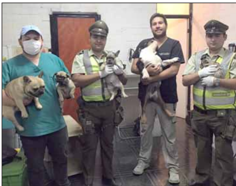
Tres perros y ocho cachorros fueron rescatados por funcionarios de la oficina Veterinaria de la Municipalidad de Llay Llay, denunciándose el delito de maltrato animal ante Carabineros de esa comuna.