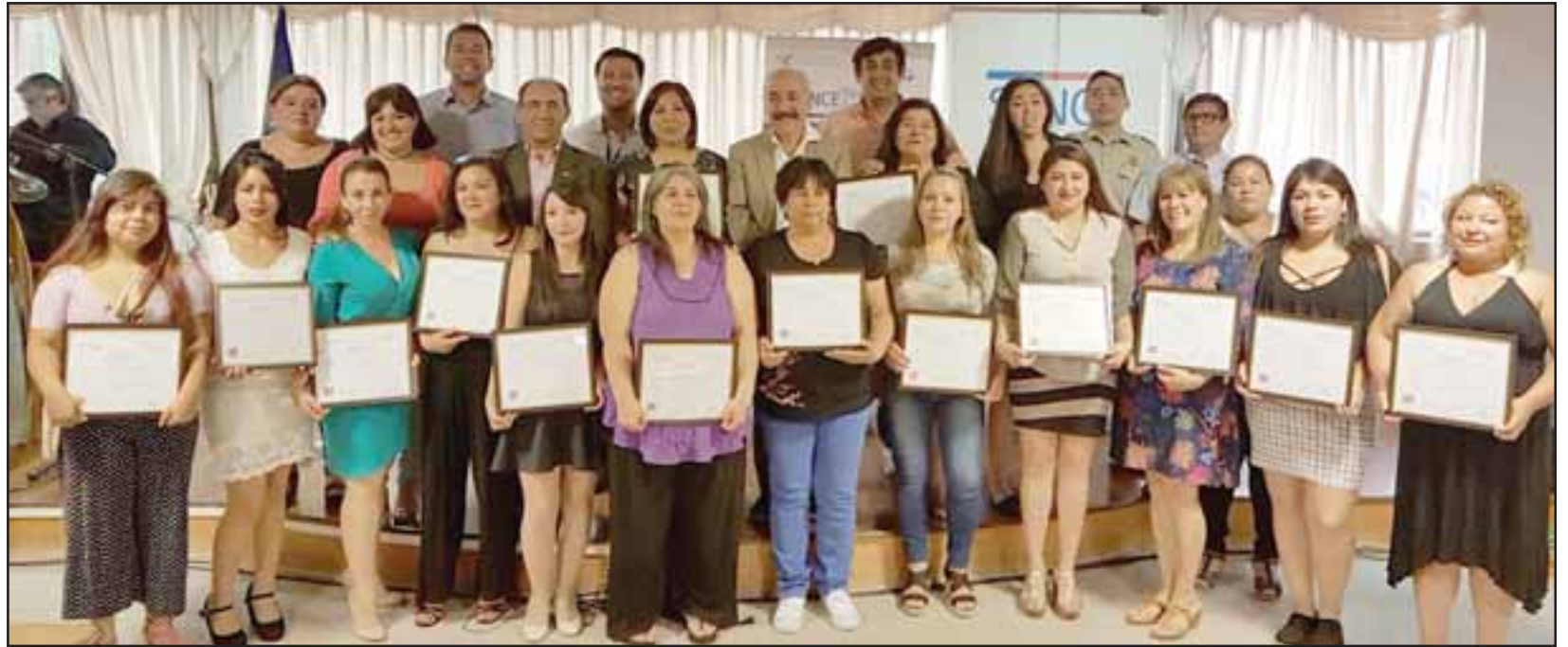
Las beneficiadas se capacitaron durante 150 horas en la preparación de productos de pastelería.

El 2018 se adjudicaron dos cursos, uno de pastelería y otro de corte-confeción, esto permite que las mujeres se capaciten y comiencen nuevos emprendimientos. La tarea es continuar postulando a las becas laborales para este año.