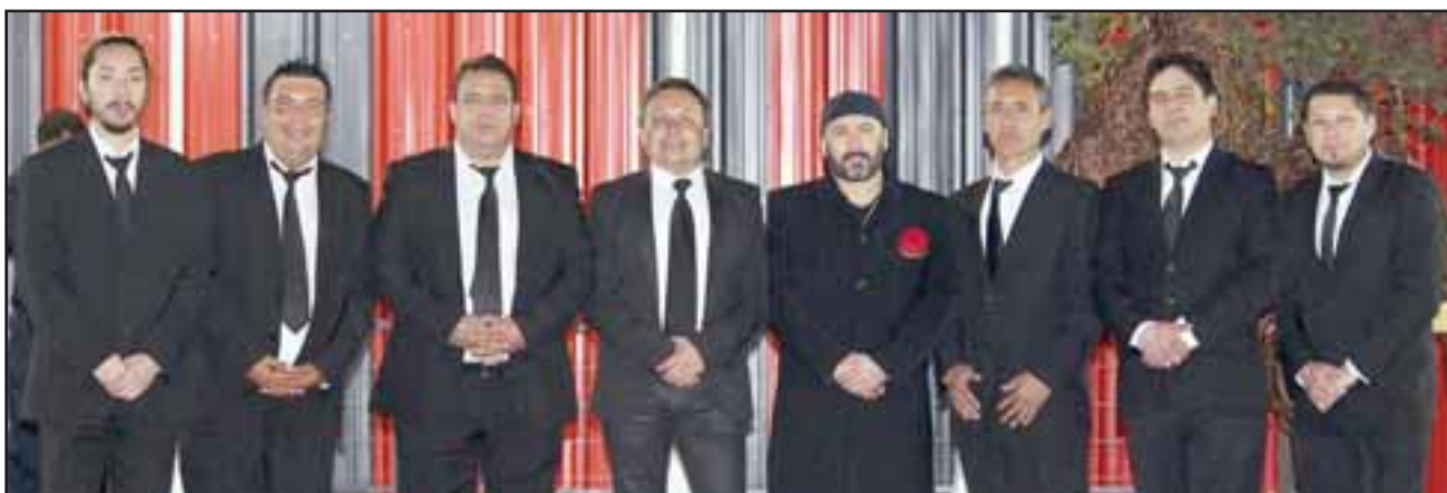
LOS MEJORES DEL VALLE.- Aquí tenemos a la mejor Sonora del Valle Aconcagua, agrupación musical compuesta por puros artistas locales con gran experiencia.

grabados en estos últimos dos años: Me estoy enamorando , un arreglo de una cumbia antigua, y Mi Pobreza , otra linda cumbia adaptada a nuestro estilo original, estos son nuestros dos 'Caballitos de Batalla' ya sonando en la mayoría de las radioemisoras del país. Estas producciones las hicimos con el estudio de grabación Alexitico, de Catemu y Ramiro Cruz,