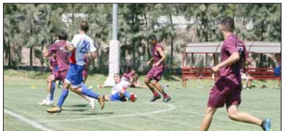
Ayer Unión San Felipe realizó su primer test futbolístico de pretemporada.

Respecto al sistema de juego que utilizará su escuadra, el coach fue claro que todo dependerá de las características de los jugadores, aunque ayer se vio que el Uní Uní jugó un tiempo con línea de 3 y el otro con 4 en el fondo. “No variamos, es solo que las características de los jugadores dan otra figura, pero la idea de fondo es la misma, pese a que la sensación sea distinta; lo importante es que todos participen al momento de tener el balón y den opciones de pases, nunca hay que disociar el ataque de la defensa”, finalizó el estratega.