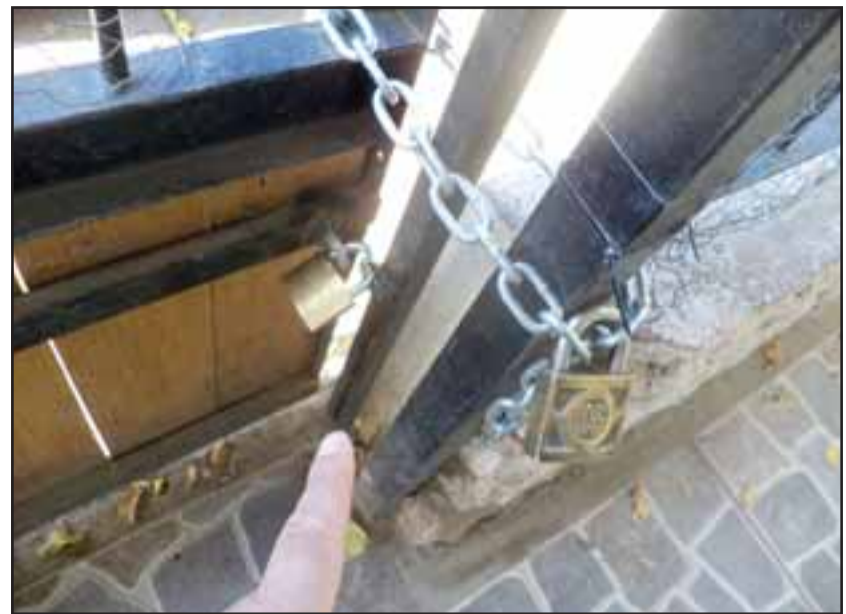
Acá podemos apreciar los dos candados que tuvo que instalar en un lado del portón.

- No, no es primera vez que me roban, las dos veces anteriores que se entraron, se evitaron porque mi papá