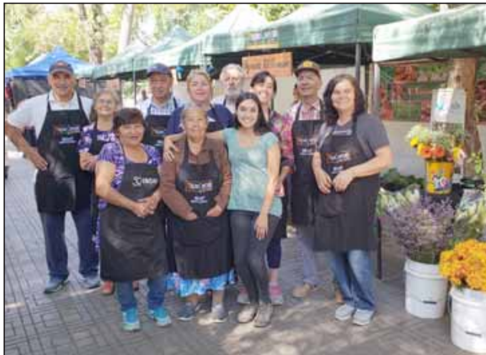
Parte de los emprendedores agrícolas que iniciaron la feria 'Mercado Campesino', en plena Plaza de Armas, y que funciona de las 08.30 hasta las 20.30 horas.

En la misma línea agradeció el apoyo de Prodesal San Felipe, ya que «nos ayuda y nos entregan conocimientos y además realizamos un interesante trabajo en equipo. Acá hay diversos productores, nosotros entregamos directamente al consumidor, con un precio conveniente y sin intermediarios», sostuvo.