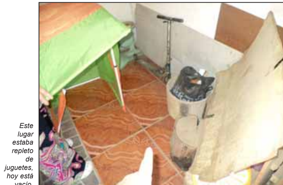
Este lugar estaba repleto de juguetes, hoy está vacío.