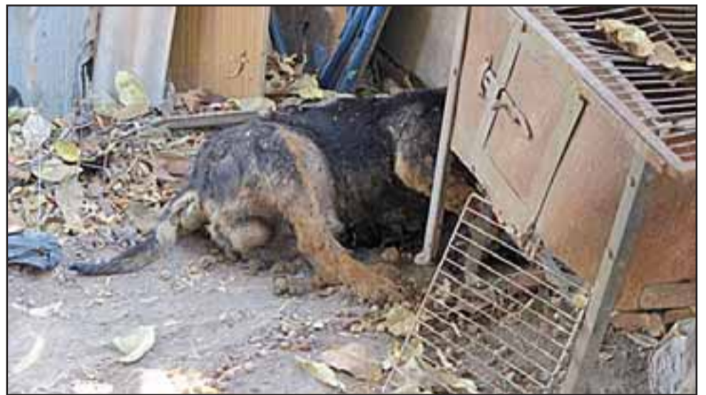
Así luce la vivienda, o lucía, cuando ingresaron las autoridades a controlar este foco de insalubridad.