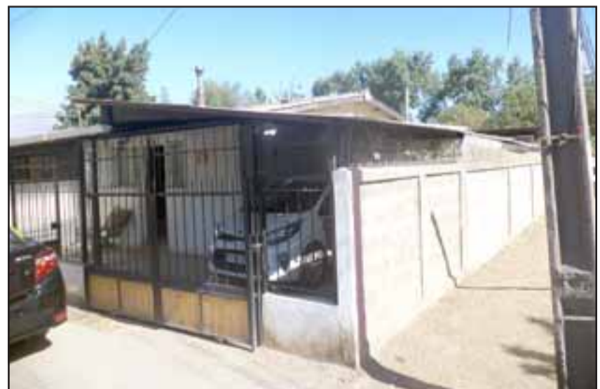
La casa de la afectada ubicada en el pasaje Alcalde Adolfo Stemann de la Población San Felipe.