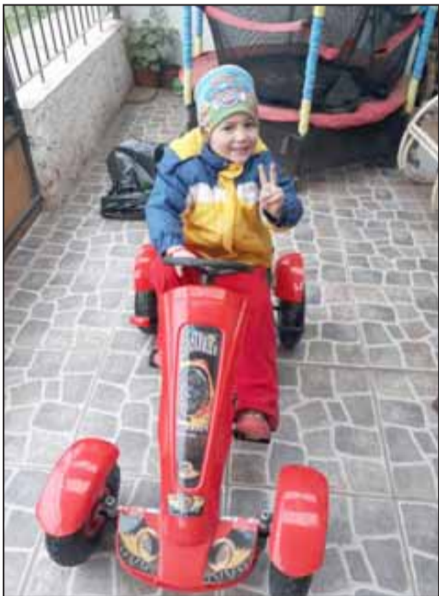
Acá vemos a su hijo en el auto que le habían regalado.

se levantó y me levanté yo, y se llevaron cachureos que había, pero con el transcurso de los años a mi hijo le han estado regalando cosas, ahí todo eso, se dejan adelante porque es más factible que mi hijo juegue porque en el patio están los perros, prefiero que juegue en el antejardín, de hecho se cerró, la primera vez que se entraron a robar se puso el