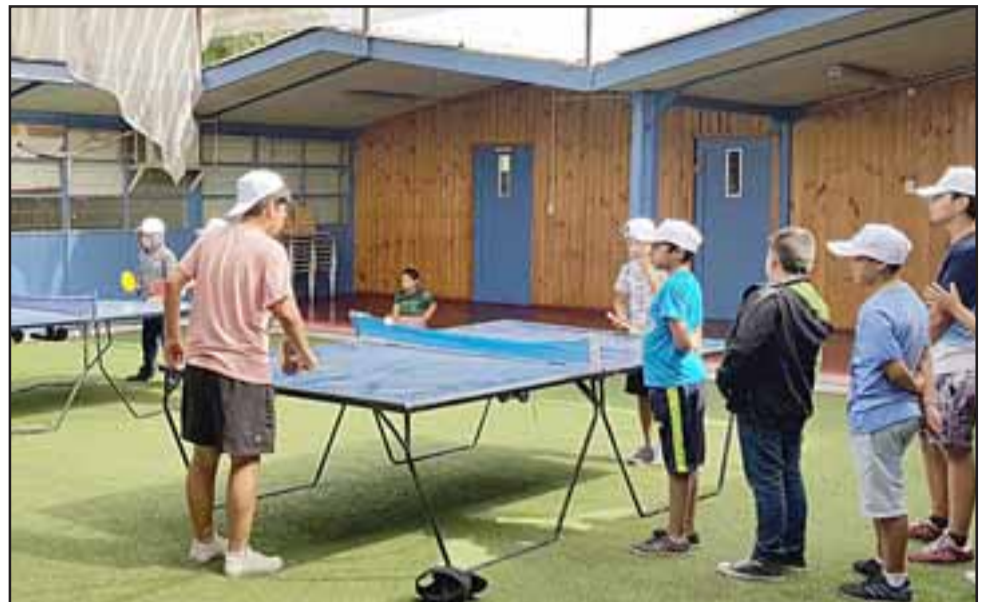
Actividades recreativas, fomento de buenas prácticas y espacios de interacción marcan la iniciativa ‘Escuelas Abiertas 2019’ organizada por el DAEM de Los Andes.

entrega sin costo alguno implementación deportiva, desayuno y almuerzo a quienes están inscritos, esto complementando el trabajo de monitores y docentes, quienes se preocupan no sólo de realizar juegos y competencias, sino que también promover hábitos