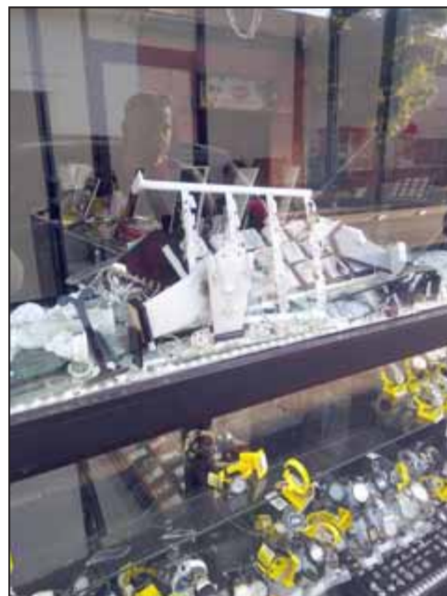
El robo se cometió en horas de la madrugada de este miércoles.