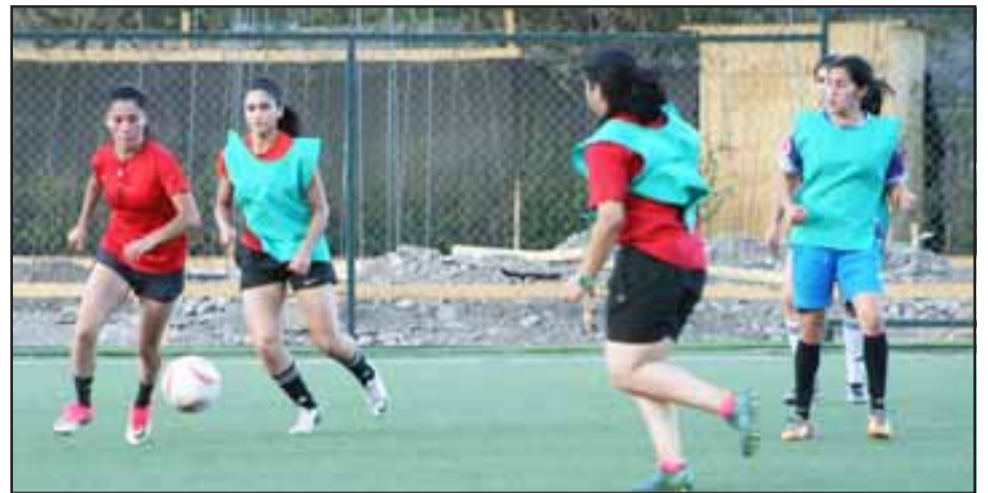
Como parte de su proceso de preparación para el decisivo partido de este fin de semana, la selección femenina de San Felipe entrenó el martes en el Complejo Deportivo del Uní Uní

El presidente de la Asociación de Fútbol de San