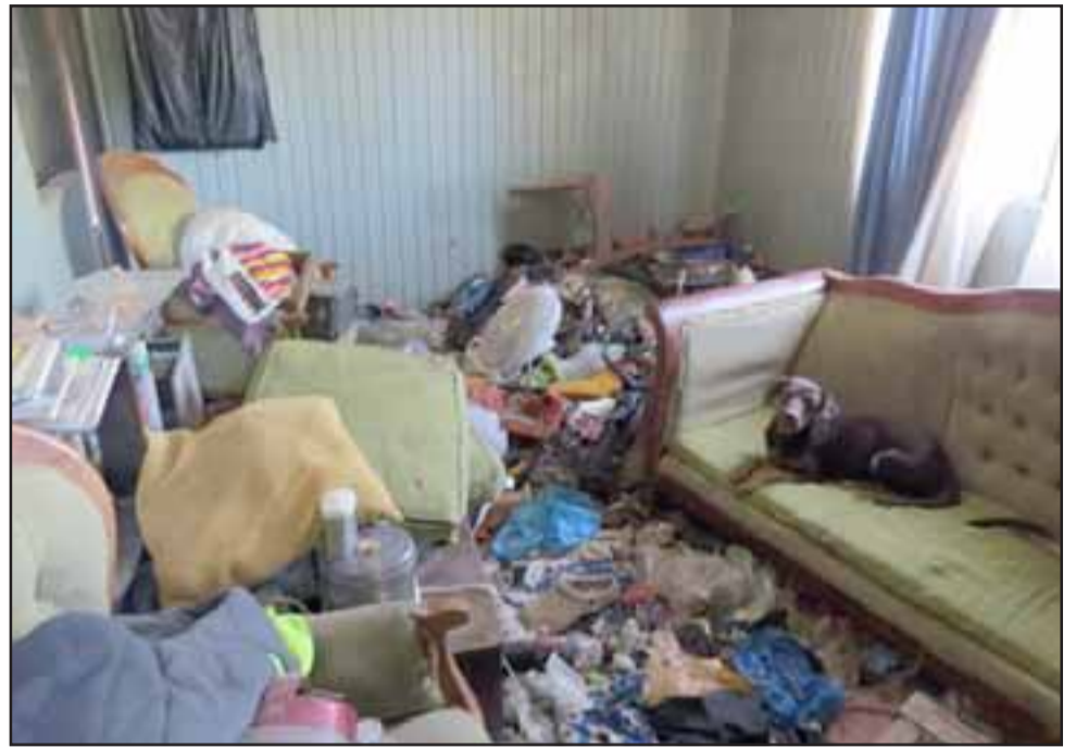
La Municipalidad de Los Andes en conjunto con Carabineros procedió a intervenir un domicilio de Población Virgen del Valle.

Agregó que los vecinos sufren también con los malos olores, razón por la cual la situación es insostenible, «ya que además hay una cantidad enorme de fecas debido a que en algún momento hubo muchos animales, entonces cada vez la situación ha sido más crítica».