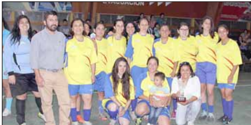
El primer lugar fue para Cesfam Centenario de Los Andes.

Codelco Andina ha realizado una serie de actividades en su Polideportivo, abiertas a la comunidad, con la idea de avanzar en el fortalecimiento de la relación entre los vecinos del valle y la empresa minera. Durante el año pasado se trabajó en conjunto con la Municipalidad de Los An-