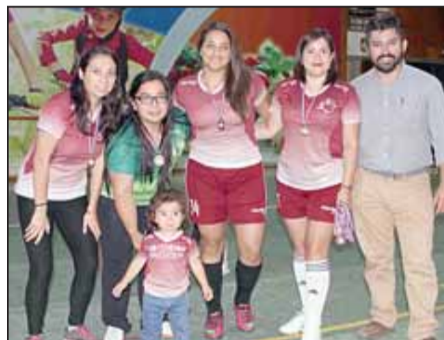
El CD Femenino San Esteban ocupó el segundo lugar del torneo.