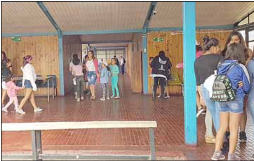
En dependencias de la Escuela Especial Valle Andino se está realizando el programa ‘Escuelas Abiertas’.

Durante cuatro semanas, el programa destinado a niños entre 8 y 13 años,