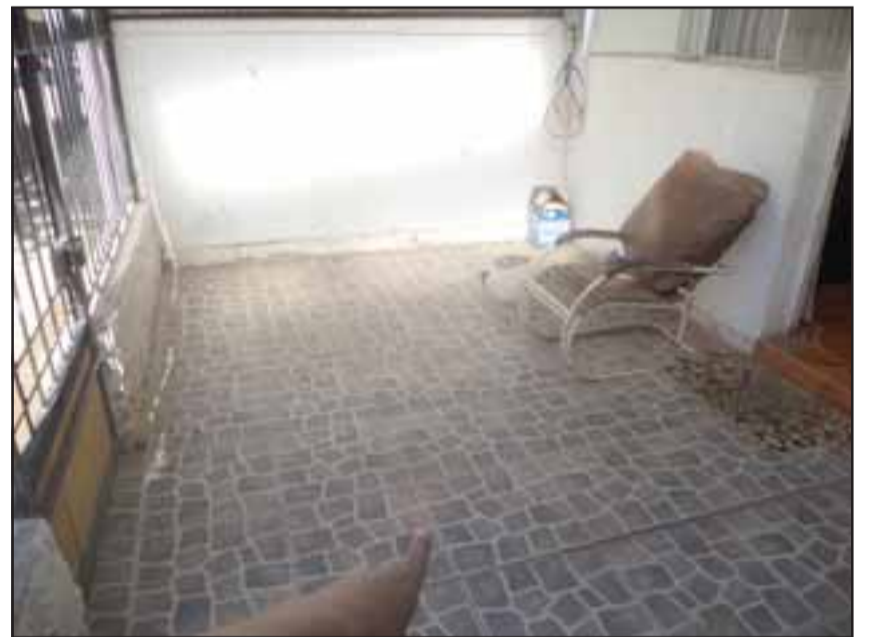
En este lugar estaba la cama elástica de la afectada.

Agregó también que le robaron unas seis pelotas de fútbol que le regalaron a su hijo para la última navidad.