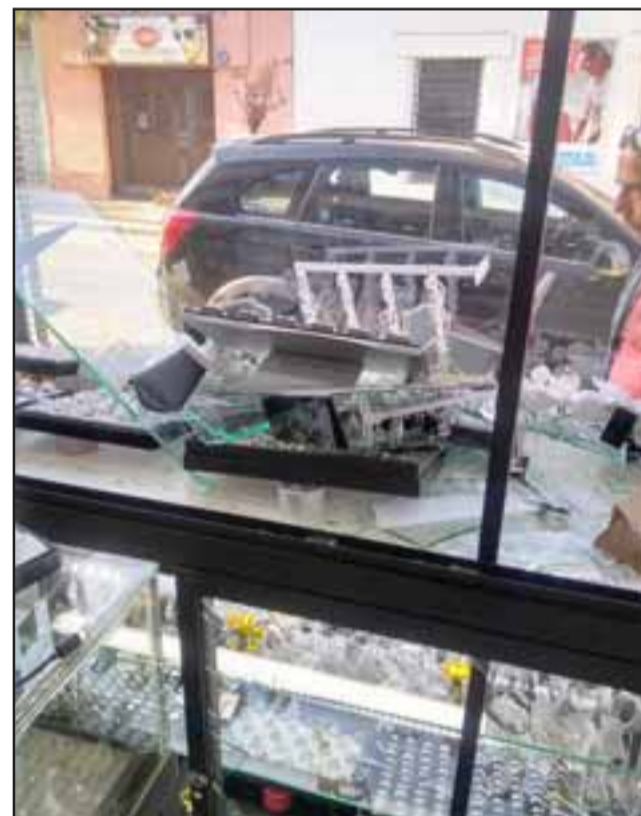
Los delincuentes realizaron cuantiosos daños a la Joyería ubicada en calle Prat N° 585 de San Felipe.