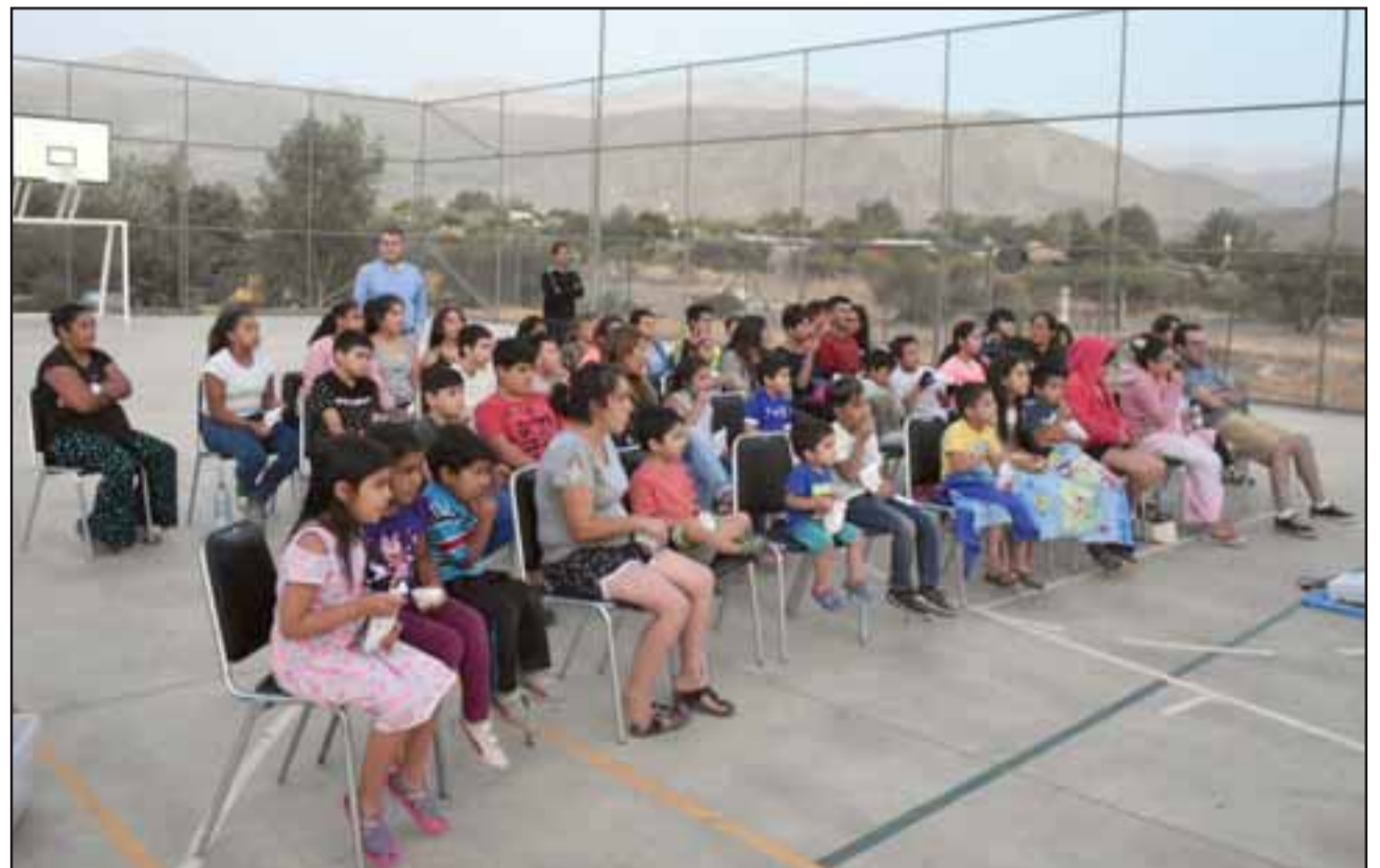
Este martes en la Villa Los Olivos del sector La Higuera se inició el ciclo de Cine Bajo Las Estrellas, organizado por la Oficina de Cultura y el Programa Senda-Previene de la Municipalidad de Santa María.