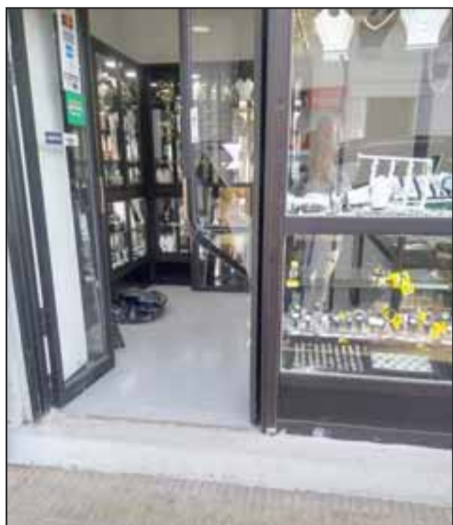
La propietaria recuperó las joyas sustraídas por los delincuentes, sin embargo Carabineros no logró las detenciones de los imputados.