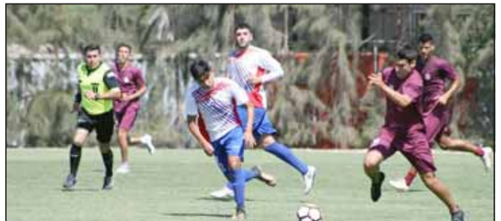
El encuentro jugado contra el Sifup fue parejo y muy bien disputado.