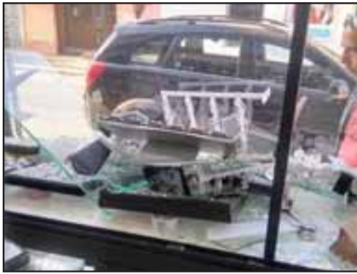
Cuantiosos daños causaron delincuentes

Avalúo alcanza alrededor de los $14 millones