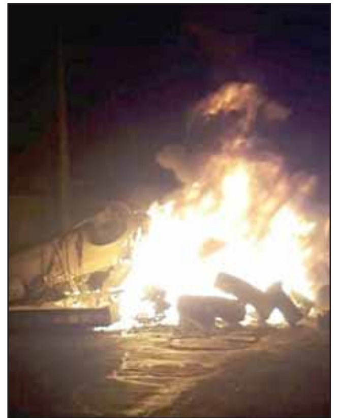
Desconocidos volvieron a instalar barricadas en distintos puntos de la ex carretera 60 CH en Panquehue. Esta vez hubo un detenido.

La capitana aclaró que hasta el momento no se tiene identificados a los integrantes de este grupo, pese a haberse realizado reuniones de coordinación con las autoridades, tanto de la comuna como autoridades vecinales, dirigentes; «pero aún no se tiene claro a qué organización corresponde, por lo tanto en la semana se van a llevar a efecto reuniones con las autoridades, tanto de la comuna