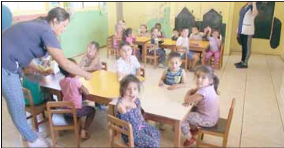
Estos espacios educativos terminarán de habilitarse antes del mes de marzo, ya que durante los últimos meses del año pasado organizaron este tipo de trabajo piloto en cada nivel.

reses y necesidades de cada niño y a las diferentes edades. Con los más pequeños por ejemplo nosotros con el diagnóstico podemos saber cuáles son sus intereses y necesidades y también con aporte de las familias, porque ellos nos van contando cómo se comportan en la casa, qué es lo que hacen, cuáles son sus gustos”, dijo la educadora.