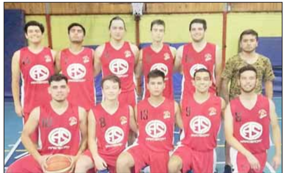
El juvenil conjunto de San Felipe Básquet se puso 1 a 0 en su llave de semifinales.

año consolidarse en el fútbol para despegar e ir por desafíos mayores. “Me he propuesto que esta temporada pueda conseguirlo (consolidación), ahora en lo grupal todos queremos lo mismo y para lograrlo es vital subir de categoría; no me gusta hablar mucho sobre el futuro, pero en esta oportunidad por el plantel que se ha armado uno palpa y siente que hay un grupo que puede pelear por algo; hay mucha hambre en este plantel, y eso se siente, ahora todos queremos responder a las expectativas”, finalizó el espigado zaguero centro albirrojo.