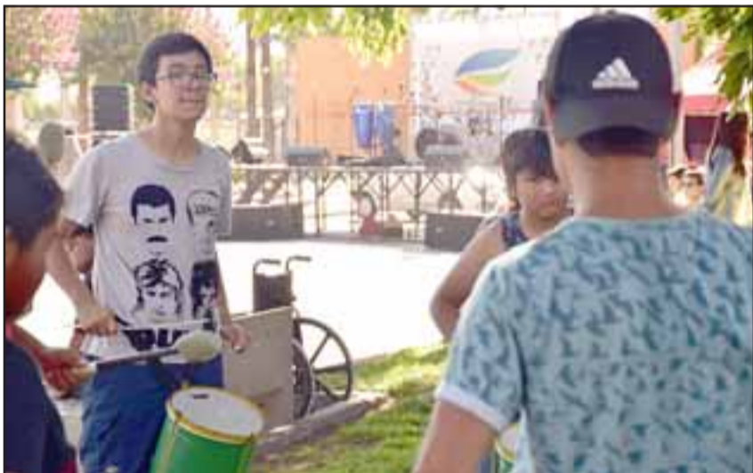
Durante el mes de enero y hasta fines de febrero se están implementando los talleres gratuitos de Batucada y de Malabarismo.

de verano hemos preparado una parrilla de actividades de cultura y deporte, como son el taller de malabarismo, el festival Violeta al Viento, Viva el verano y así otras actividades que hemos planificado, buscando generar espacios de esparcimiento e integración para nuestros vecinos y vecinas de la comuna de Llay Llay y por cierto que les invitamos a entretenerse y disfrutar con nosotros», concluyó el edil.