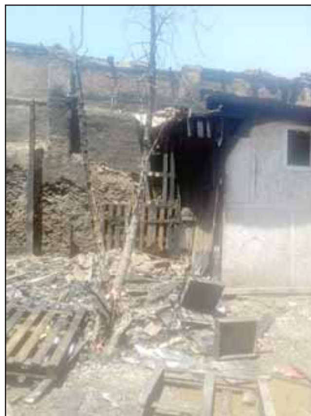
OTRA Y CONTANDO. - Así luce el escenario que impera en la propiedad donde ocurrió este nuevo incendio, penosamente son haitianos quienes vuelven a ser protagonistas de otro desastre como este.