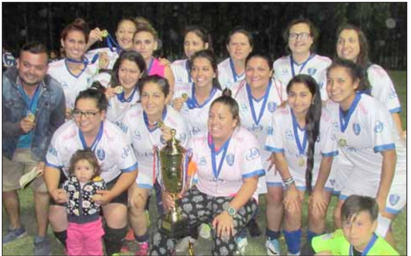
PRIMERA VEZ EN DAMAS. - Ellas son las flamantes campeonas de La Semana Troyana 2019 en la categoría Damas, las chicas de Juventud La Troya celebraron su triunfo con sus amigas, hinchada y amigos.

El domingo 13 de enero finalizó en La Troya la primera jornada de La Semana Troyana 2019, etapa en la que las damas y niños jugaron ocho equipos por categoría, quedando el primer lugar en la categoría