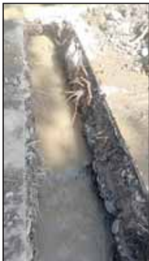
Este es uno de los canales intervenidos por personal municipal.

Por las próximas dos semanas se extenderá la intervención de un tramo del canal de regadío, ubicado en Avenida O'Higgins frente a la Segunda Comisaría de Carabineros, destinado a mitigar en parte los desbordes que se registran en el sector. Para esto, personal municipal rompió el pavi-