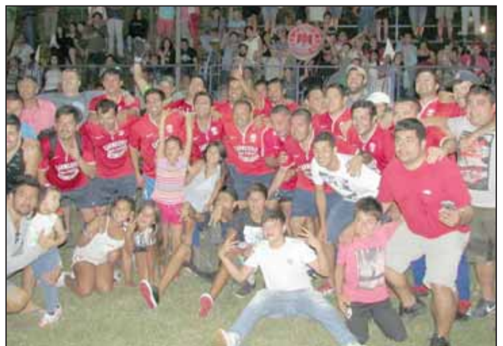
SÉNIORS IMPECABLES. - Ellos son los campeones en la categoría Séniors, Almendral Alto, repitiéndose el palto en un mismo torneo, como sólo pueden hacerlos los mejores.