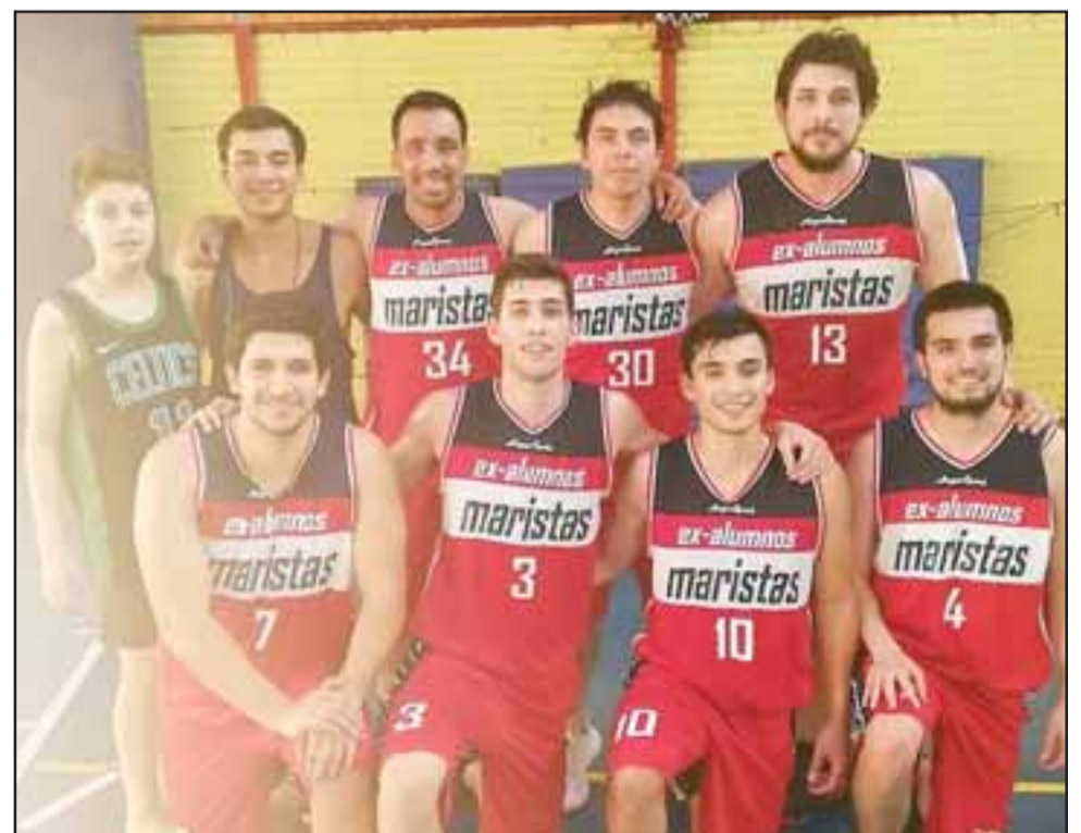
Los ExMaristas hicieron diferencias importantes en el primer juego de semifinales con Frutexport.