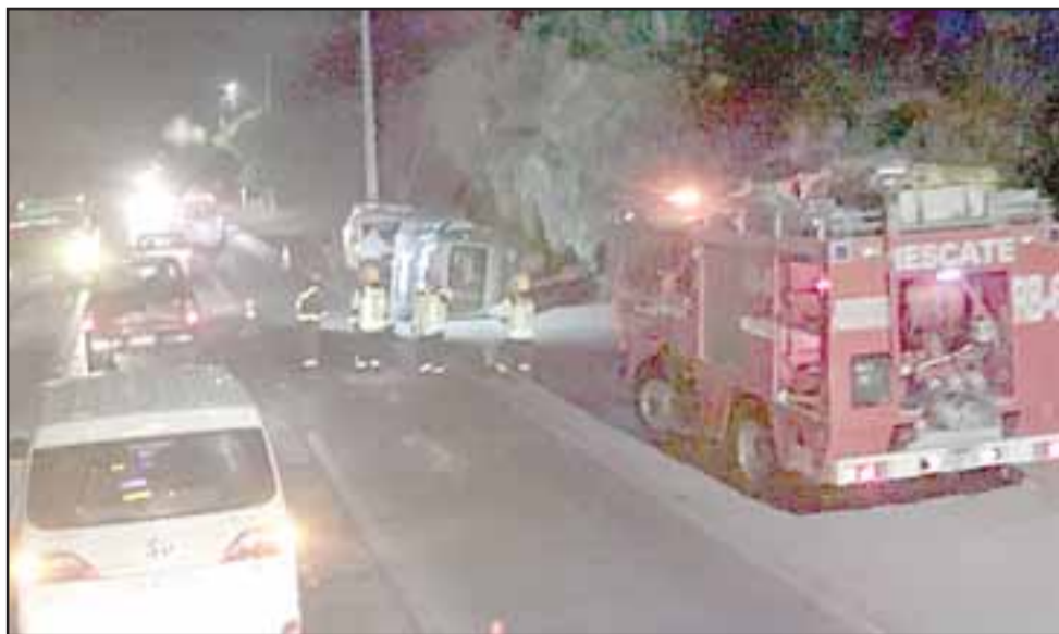
El accidente tránsito ocurrió cerca de las 21:30 horas de este domingo en el sector El Escorial de Panquehue.

Tres personas resultaron lesionadas de carácter leve luego de una violenta colisión producida entre un vehículo particular y un furgón, ocurrida cerca de las 21:35 horas de este domingo en el kilómetro 24 de la Ruta 60 CH en el sector El Escorial de Panquehue.