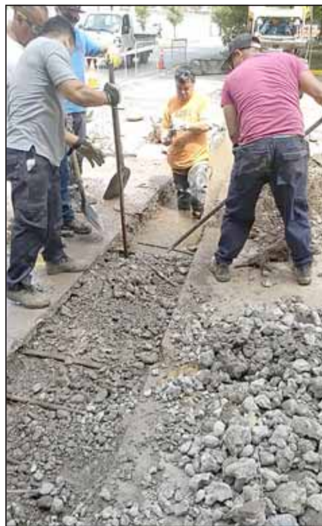
La obra implicó romper el pavimento que cubre estos canales. Los trabajos consisten en rearmar el emboquillado de la acequia que pasa frente a la Segunda Comisaría de Carabineros.

unas semanas esté terminado, (...) también hacemos un llamado a la comunidad a no tirar basura en los canales porque eso genera más atochamientos que lo que ocurre habitualmente», sostuvo González.