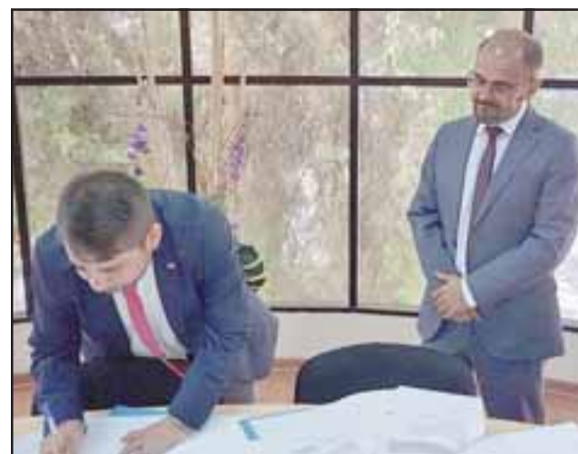
Con la firma de este convenio se conservan los programas ya implementados y se abre la posibilidad de incorporar nuevas iniciativas.