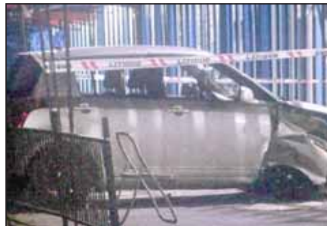
El Cabo 1° de iniciales F.H.I. impactó el cierre perimetral del penal debido a que perdió el control al estar en estado de intemperancia.

El militar, quien se encontraba de civil haciendo uso de su feriado legal, perdió el control de su Suzuki Swift y terminó impactando con la estructura de acceso del penal tras hacer un trompo, resultando con lesiones de carácter leves y causando severos daños en la parte delantera del vehículo.