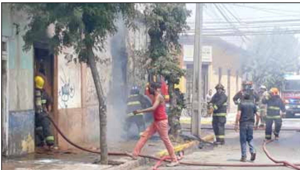
YA ES UN PATRÓN. - Cabe señalar que son varios los incendios de casas habitadas por ciudadanos haitianos; en Calle Traslaviña, en Uno Norte y el otro en la intersección de las calles San Martín con Navarro. Esta escena se registró en diciembre de 2017 en Navarro esquina San Martín.