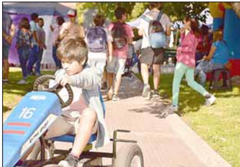
La Municipalidad de Llay Llay está llevando a cabo diversas actividades de verano para habitantes de la comuna, para que niños como éste lo pasen muy bien en sus vacaciones.

En el mes de febrero se realizarán actividades culturales y deportivas, es así como el día 9 de febrero se presentará el show de Circo Peluches, de la Compañía El Festín de la risa, una obra que deleitará al público con el mundo la música, el baile y la ilusión, una obra para toda la familia, con entrada liberada. Además, el 16 de febrero se realizará la cicle-