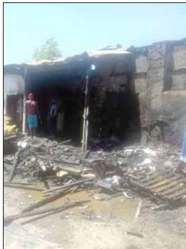
TODO EN CENIZAS. - Hasta el momento nadie ha muerto por los incendios que afectaron a personas haitianas, aún así las pérdidas materiales son millonarias.