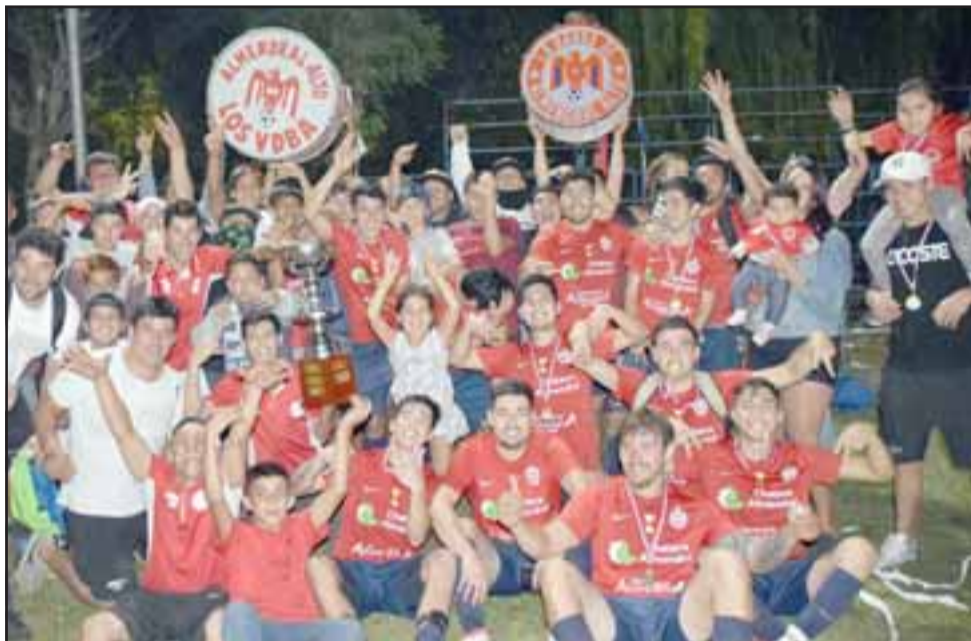
CAMPEONES OTRA VEZ. - Ellos son Almendral Alto, los nuevos campeones de La Semana Troyana 2019 en la categoría Adulta, celebrando con su hinchada el especial momento.