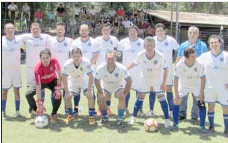
TERCER LUGAR. - Aquí tenemos al tercer lugar de la categoría Séniors, los guerreros de Juventud La Troya.

Infantil los chicos de Juventud La Troya , mientras que en la categoría Damas también fue para las chicas de Juventud La Troya . Los segundos lugares son para los clubes Húsares de Santa María y Alianza Curimón.