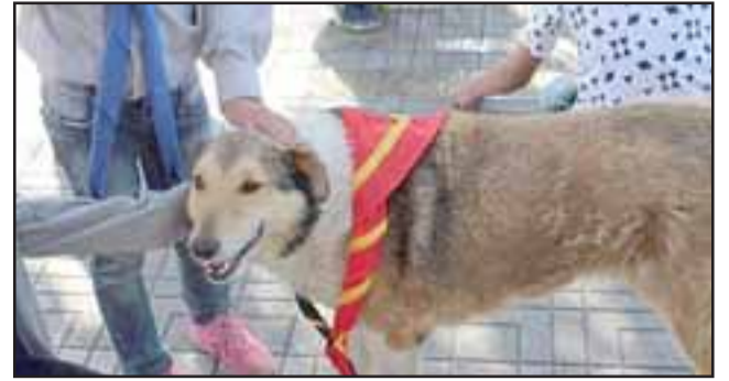
Acá lo vemos con un pañolón de scout, la mascota más querida de la ciudad ya no nos acompañará más en los desfiles patrios.

Desde acá nuestro recuerdo para el gran y querido 'Bufanda'. Como dice la