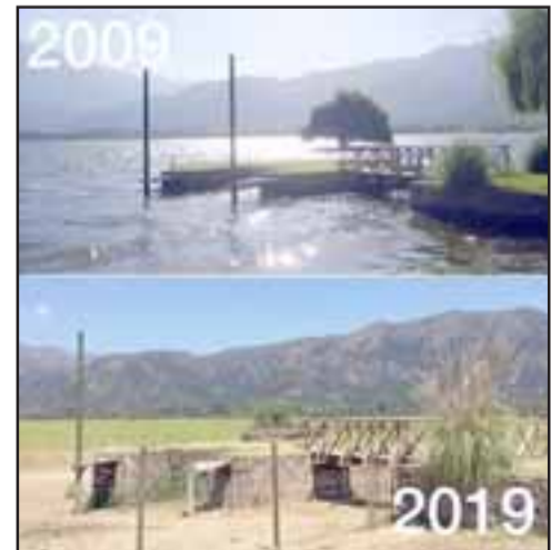
Acúleo fue una laguna ubicada en la comuna de Maipo, provincia de Metropolitana.

Al igual que La Muerte dio muchas señales al Joven Pescador: La naturaleza también nos ha estado enviado muchos mensajes, que no hemos sabido interpretar o a lo mejor, no hemos querido oír. Lamentablemente la sequía azota a nuestro querido Valle de Aconcagua y en razón a ello ¿qué estamos haciendo como sociedad? ¿Sabemos qué medida paliativa a corto y largo plazo contemplan nuestras autoridades? ¿Los establecimientos educativos, trabajan este tema con nuestros niños? Esperemos que La Muerte de la sequía no nos pille a la vuelta de la esquina y que San Felipe, de ser una Próspera ciudad, no se transforme en un Humberstone.