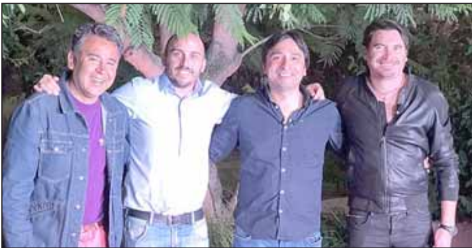
El programa además cuenta con espacios dedicados a los emprendedores locales, la cultura, la interacción con la ciudadanía aconcaguina a través de consultas y entrevistados.