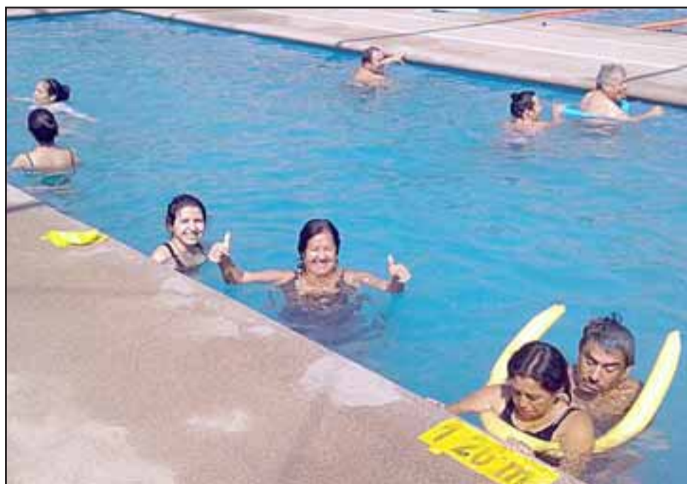
REFRESCANTE RECUPERACIÓN.- Aquí vemos a un grupo de personas de nuestra provincia recibiendo terapia con kinesiólogos de la Oficina de la Discapacidad.