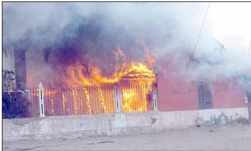
INFERNAL.- Así de impactante fueron las escenas que debieron controlar los bomberos durante muchas horas de trabajo.

Reconoce que la alta temperatura ayudo a la propagación del incendio, pero también el viento reinante que hasta ayer a eso de las 13:00 se mantenía en las mismas condiciones, "claramente eso ayudó muchísimo a que se propagara la emergencia y la temperatura que teníamos ayer era tremenda, tuvimos emergencias compuestas de pasto, estructural, teníamos un escape de gas con una bomba de 2.000 kilos, tuvimos emergencia química por los productos que se manejan en este tipo de proceso... fue una emergencia muy... muy compleja, tuvimos el gran apoyo del Cuerpo de Bomberos de Los Andes de la Segunda Compañía de materiales peligrosos que nos vino a colaborar ya que con ellos pudimos superar esta emergencia,