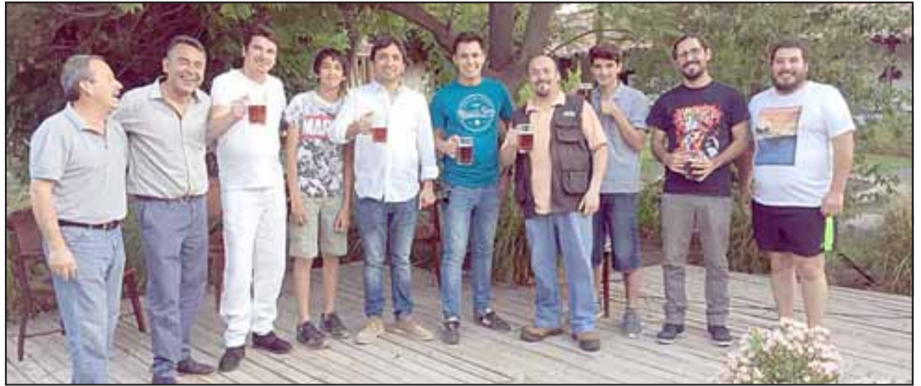
Primer capítulo logró más de 22.000 reproducciones en Internet y se emitió a un público de 700.000 potenciales telespectadores por las señales de VTV en Los Andes, San Felipe, Quillota y La Calera.