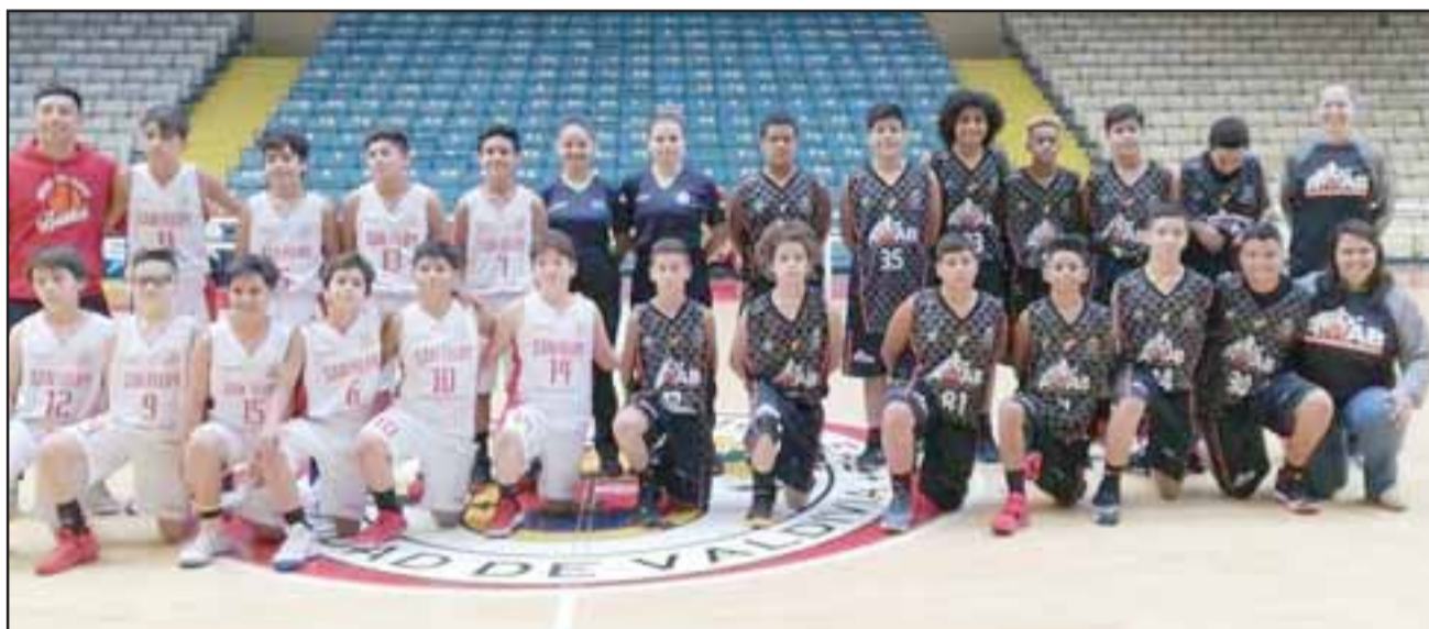
El equipo U13 de San Felipe Básquet hizo su estreno frente al Girafinhas de Brasil.