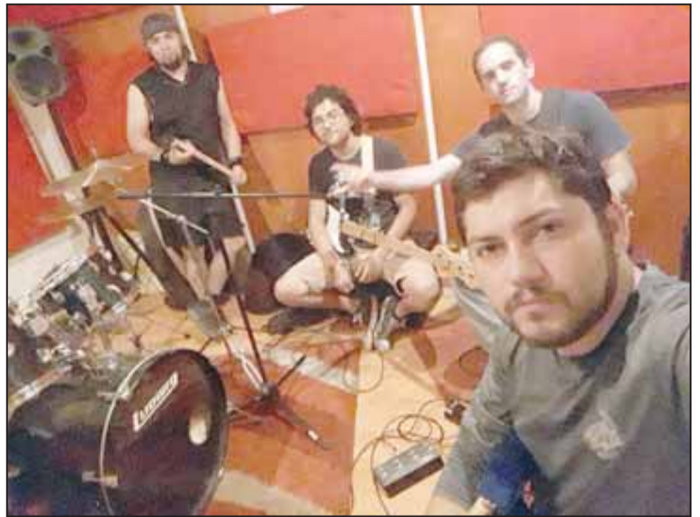
VOLTAGE.- Aquí tenemos a este cuarteto de músicos aconcaguinos, abriéndose paso en el mundo del espectáculo.

- Lo estamos tomando con calma, queremos hacer las cosas con una total dedicación y eso requiere tiempo. Los cuatro hemos estado de acuerdo en que no sacamos nada con entregar a la gente todos los temas