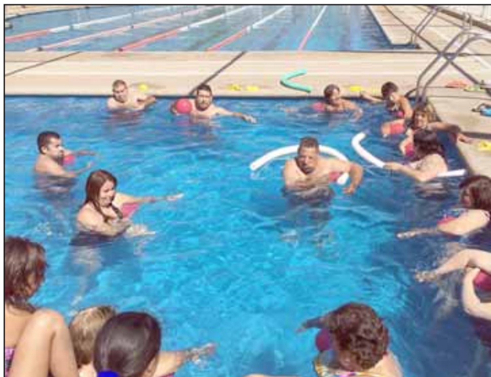
POCO A POCO.- El proceso de rehabilitación en piscina es lento, seguro y muy efectivo, además los usuarios disfrutan más que si lo hicieran fuera del agua.

servicios de salud están medio colapsados y por eso nosotros buscamos una estrategia, llegamos a la conclusión de que era importante crear un dispositivo que entregara rehabilitación y ver que en verano tenemos que aprovechar el agua, ya que en el agua en una piscina, nos podemos mover mucho mejor, se experimenta la sensación de pesar menos, a estos talleres asisten personas que tienen movilidad reducida, a quienes les cuesta hacer la marcha y tienen rangos articulares disminuidos y también mucho dolor, entonces el taller lo creamos y lo gestionamos de tal manera de poder entregarles un servicio completo», co-