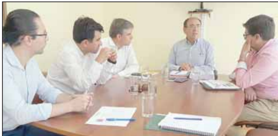
Ambas autoridades coincidieron en que el potencial del turismo en la zona debe ser en las diez comunas que componen las provincias de San Felipe y Los Andes.

Trabajo mancomunado entre la empresa privada y pública para que los turistas, tanto nacionales como extranjeros sepan las bondades y cualidades artísticas, gastronómicas, arqui-