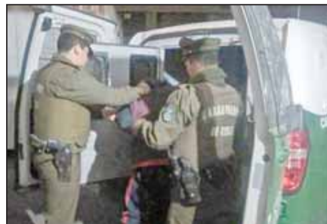
Ambos sentenciados deberán cumplir las condenas en la cárcel tras el juicio desarrollado en el Tribunal Oral en Lo Penal de San Felipe.