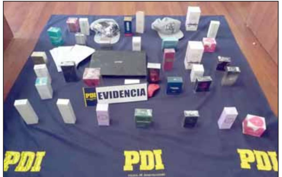
Una mujer fue detenida por el delito de Receptación de especies. Y el autor material está plenamente identificado.

Asimismo, dijo que mientras los detectives realizaban pericias en los locales robados fue encontrado un Notebook que había sido dejado escondido en el entretecho para posteriormente ser sacado y reducido. «Es por ello que en estos momentos estamos enfocados en poder ubicar a esta persona con los medios de prueba necesarios para colocarlo a disposición de los Tribu-