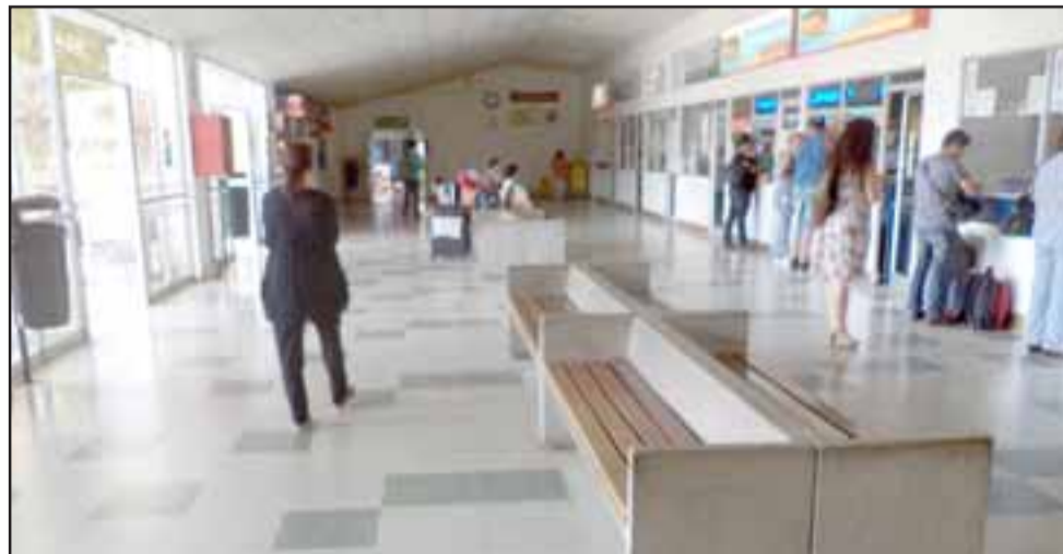
Este era el panorama del terminal este martes en la mañana.

El encargado pide mayor presencia policial especialmente los fines de semanas.