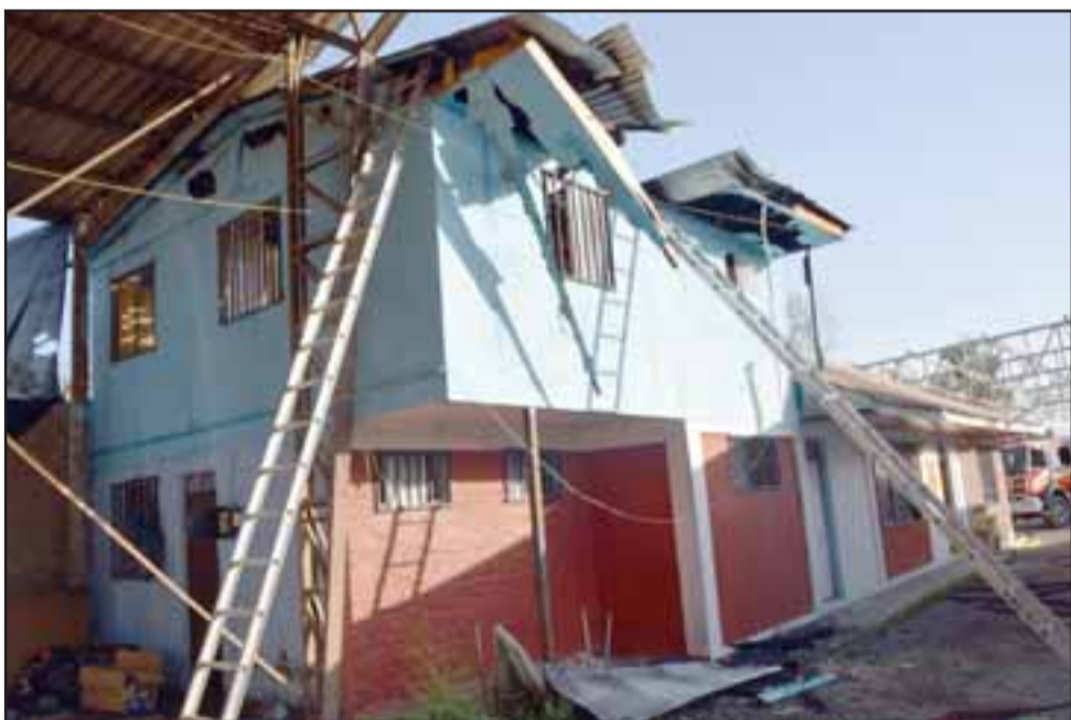
Cuantiosos daños se registraron a raíz de este incendio.

sus propios colegas para trabajar arduamente en combatir rápidamente el siniestro, concurriendo unidades desde San Felipe, Putaendo, San Esteban y Los Andes en apoyo al incendio estructural.