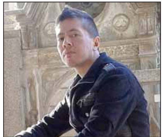
ARTISTA SANFELIPEÑO.- Los interesados en conocer más de cerca a este artista sanfelipeño pueden contactarlo al 954957902.

- Mr. Psíquico y Los Psicotrónicos fue mi primer disco virtual de nueve temas. Fue grabado entre diciembre de 2013 y marzo 2014 en Reñaca, V Región. Las canciones que contiene el disco se ambientan entre el electro-pop, el indie y la experimentación. Sin olvidar el 'Dancing' para movernos un poco. Canciones como 'Guerrillas' se inspiran en la valentía que tuvieron algunos líderes combatientes para liberar a un pueblo de la opresión, otros tracks hablan sobre la muerte que