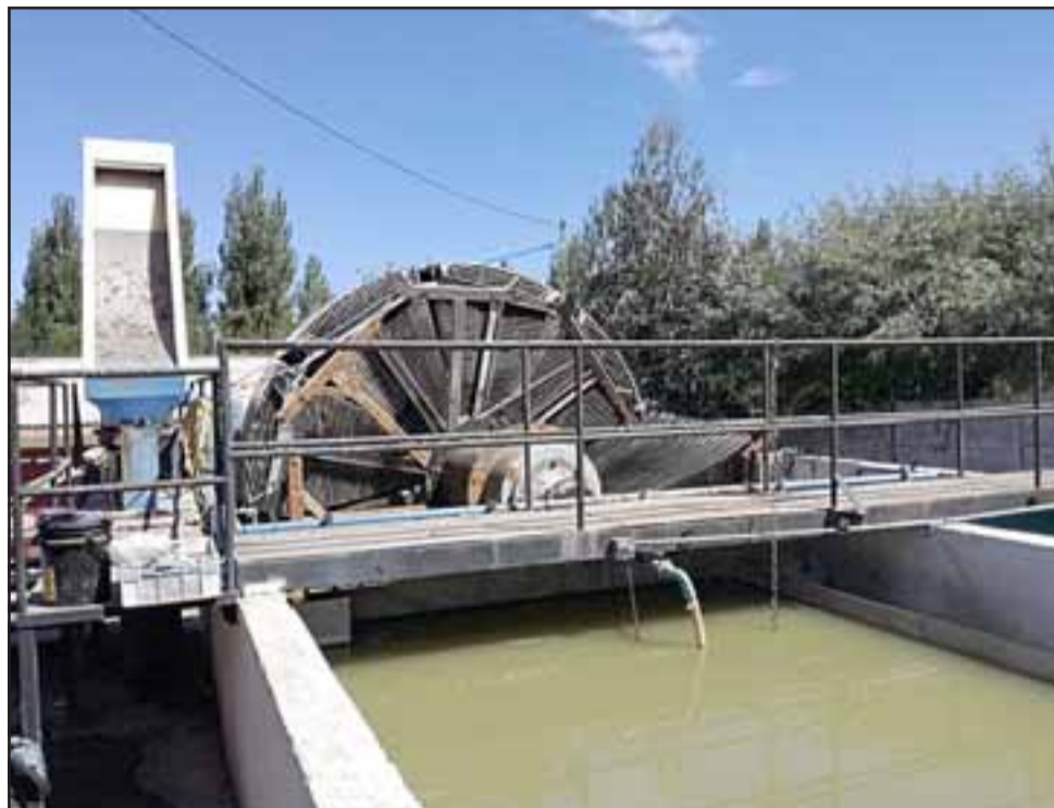
Falla en el sistema provocó nuevos focos de malos olores en el sector de Nueva Algarrobal.

La presidenta de la junta de vecinos además detalló que «esto ya está hace tres semanas que estamos viviendo así. Tenemos que comer, vivir con malos olores, sale por los baños y por todas partes. Queremos que se nos den una solución pronto, porque ya no podemos seguir viviendo así».