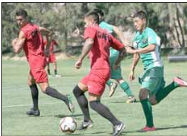
El sábado pasado el Uní Uní enfrentó a Trasandino de Los Andes.