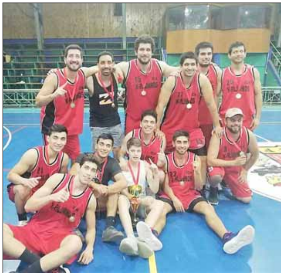
Tras ganar la serie final al Prat, el equipo de los Ex Maristas se graduó como campeón del Clausura de Abar.