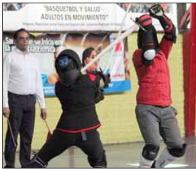
DESTREZA Y REFLEJOS.- La actividad se desarrolló este sábado en la Sala Múltiple de San Felipe, luego, compartieron experiencias entre los participantes.