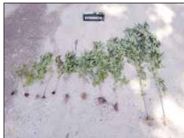
Las diligencias fueron efectuadas por personal de OS7 de Carabineros Aconcagua, incautando los cultivos ilegales de cannabis sativa en Calle Larga y Curimón.

En ambos casos, dos mujeres resultaron detenidas, quienes por instrucción de la Fiscalía fueron dejadas en libertad, quedando a la espera de ser citadas a concurrir hasta el Ministerio