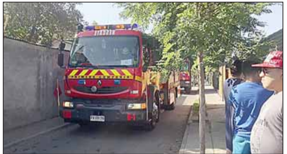
Unidades de Bomberos debieron presentarse en el sector para hablar con este vecino, quien continúa almacenando basura en su vivienda.

Dijo que le han hecho ver esta situación al dueño de la casa, « pero lo único que me ha comentado es que los papeles los trae para escogerlos y separarlos, ya que viene un camión grande a dejarlos y después a retirarlos, y ya estamos hartos de reclamar sin ver preocupación del vecino y lo malo es que tienen que ocurrir cosas así para que se sepa todo esto ».