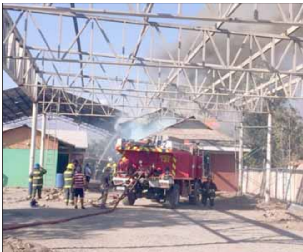
El siniestro ocurrió la tarde de este viernes en la Primera Compañía de Bomberos de Santa María.

Los voluntarios debieron requerir la presencia de