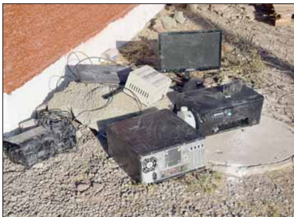
Computadores resultaron dañados tras el incendio que afectó a las oficinas de Bomberos de Santa María.