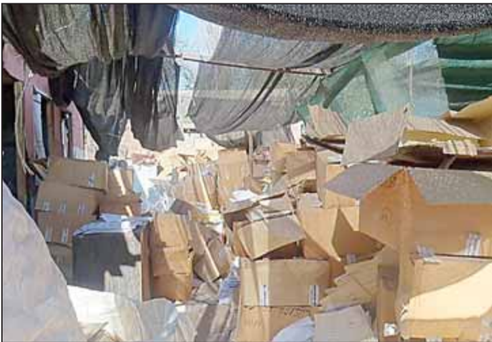
Así luce el panorama en esta casa, algunos temen que esta historia termine de manera trágica.