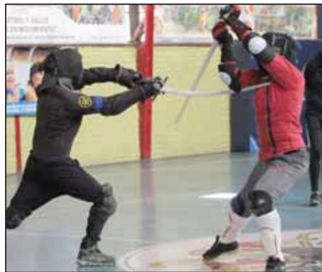
ASÍ SE VIVIÓ.- Exponentes de varias partes de nuestro país se dieron cita en San Felipe, para desarrollar el 7º Congreso de Armas Occidentales de Hema Chile.

«Además, Sema hará una exhibición de sable militar chileno en la conmemoración del Cruce de Los Andes por parte del Ejército Libertador. Dicha activi-