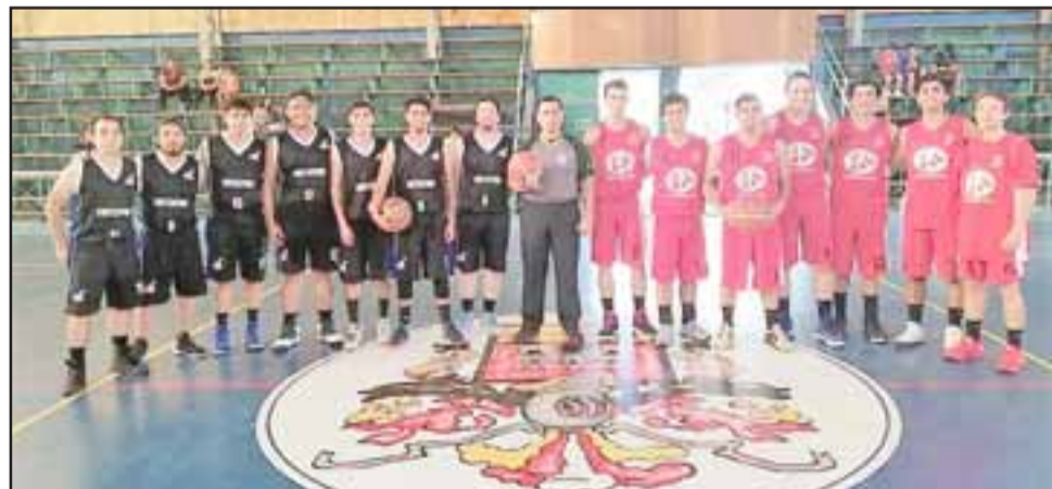
Los equipos de Frutexport y San Felipe Básket animaron una entretenida serie por el tercer lugar del torneo.