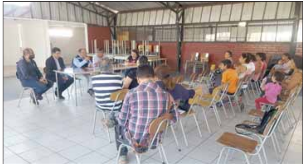
En la sede de la Junta de Vecinos de El Llano se realizó esta primera reunión donde las autoridades municipales y de gobierno pudieron entregar algunas propuestas a las inquietudes planteadas por los vecinos.

En tanto, la primera autoridad provincial comentó que «en un mes más nos volveremos a juntar con propuestas concretas, donde incorporaremos a Esval, Conaf por el manejo de pequeños bosques que existen en el lugar; Vialidad para ver alternativas de accesos complementarios al sector de El Llano Alto, para dar una solución más definitiva a esta problemática que empatizamos con los vecinos. Concordamos con sus inquietudes y como autoridades tanto de la Municipalidad y la Gobernación naturalmente estamos comprometi-