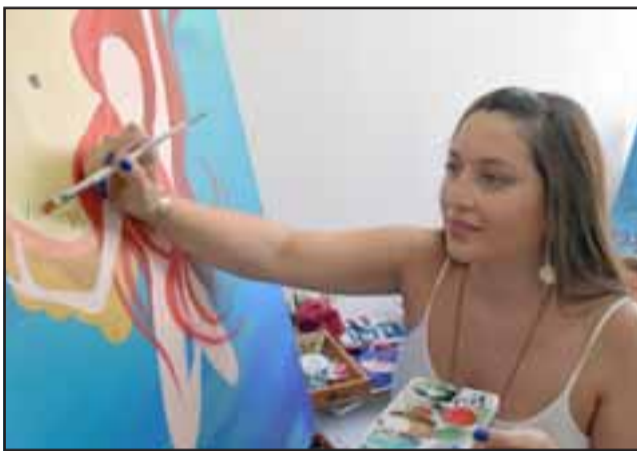
SENSIBILIDAD.- Aquí la vemos en su faceta de pintora y dibujante, su mente es una fábrica de ideas e imágenes.

desean que yo exprese en una pintura, y me dan libertad para crear obras surrealistas, todas mis obras son producto de mi imaginación, y no tienen que tener un sentido definido, cada quién encuentra algo distinto en mis cua-