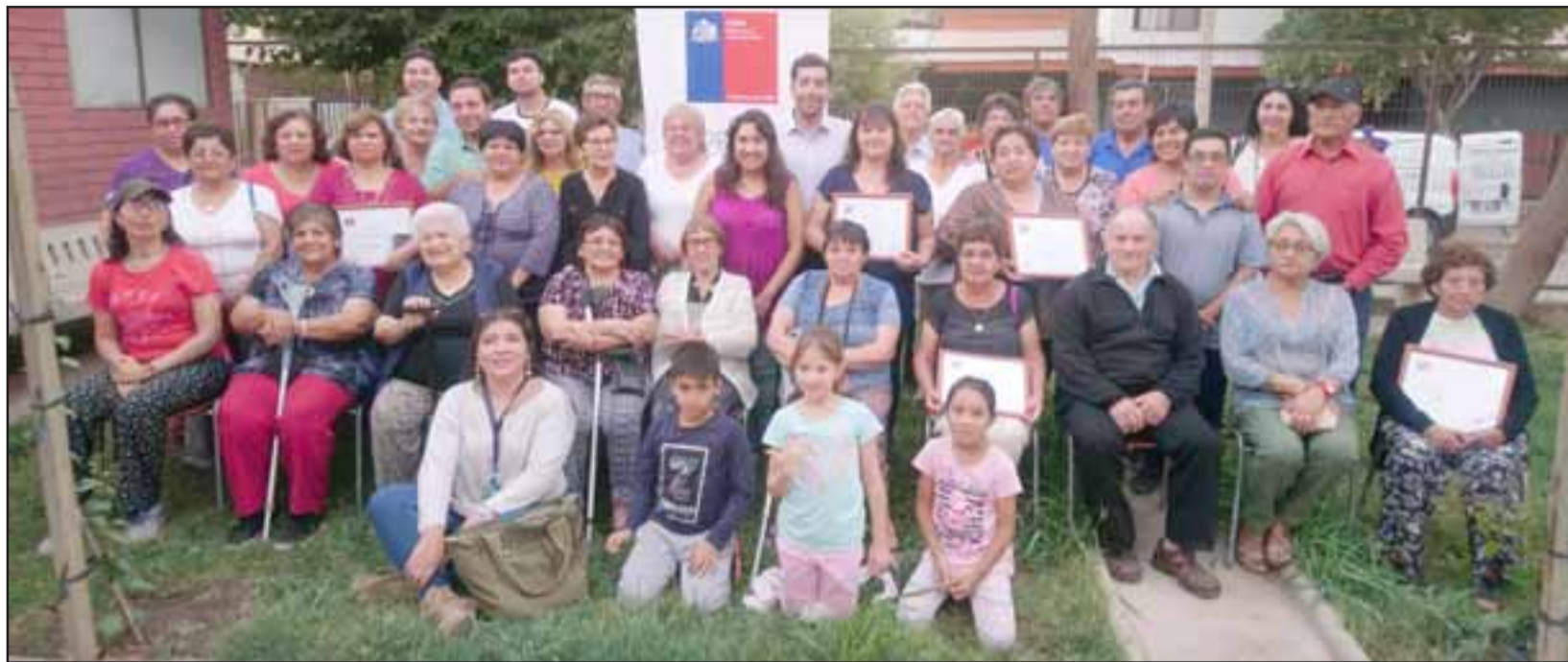
En la imagen vecinos de los sectores de Alborada, en Rinconada de Los Andes, quienes al igual que sus pares de Foncea, en San Esteban, felices con el programa 'Acción' desarrollado por el Fosis en sus comunidades.