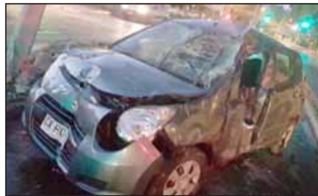
El accidente ocurrió cerca de las 06:00 de la madrugada de ayer miércoles en la avenida Santa Teresa de Los Andes.