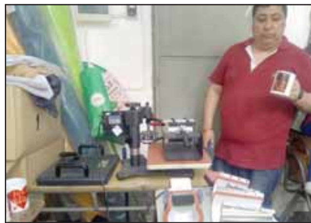
Gracias a las buenas ventas pudieron comprar equipos para la sublimación de tazones, poleras, gorros y otros artículos.

El subteniente Mena agregó que se están analizando opciones para crear un segundo taller de corte y confección o trasladar el existente a un espacio más amplio. Mientras esto sucede los privados de libertad continúan trabajando para responder a los pedidos que realizan comerciantes de las provincias de San Felipe y Los Andes.