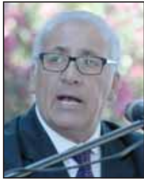
Guillermo Reyes, alcalde de Putaendo.

5. Adicionalmente, el alcalde solicitará al Servicio de Salud Aconcagua que pueda ser parte de la investigación, independiente de las acciones que le correspondan por Ley a la propia autoridad fiscalizadora. A su vez, el edil espera que esta repartición pública, también realice su propio procedimiento para conseguir mayor rigurosidad y transparencia en la investigación.