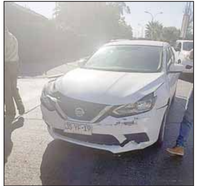
Uno de los vehículos involucrados en este accidente ocurrido la mañana de ayer miércoles en la cancha de tenis de San Felipe.

El oficial policial enfatizó que de acuerdo al procedimiento efectuado por Carabineros, no se registraron personas lesionadas a raíz