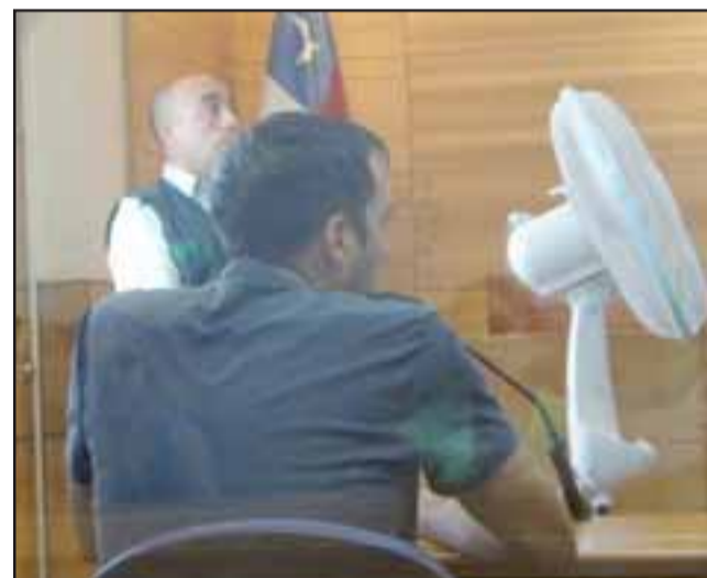
El Ministerio Público solicitó fijar una nueva audiencia para discutir medidas cautelares o salida alternativa.

El argentino pasó a disposición del Tribunal de Garantía de Los Andes, siendo formalizado por el delito de Robo en lugar no habitado en grado de consumado. Por no tener antecedentes penales al menos en Chile, el Ministerio Público solicitó fijar una nueva audiencia para discutir medidas cautelares o salida alternativa.