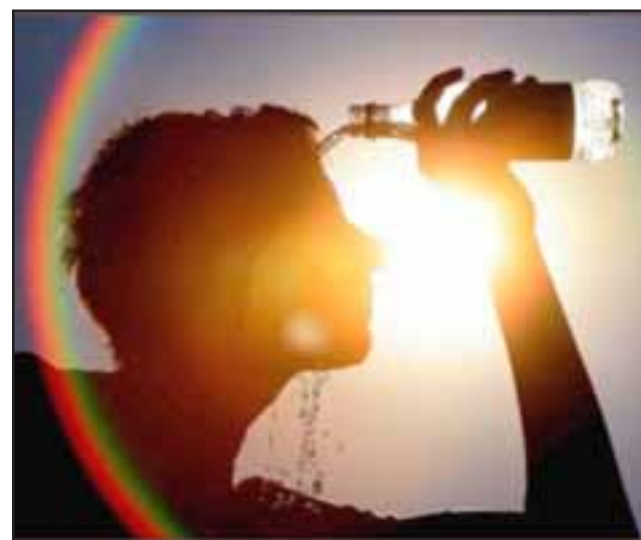
Una nueva ola de calor fue anunciada para hoy y mañana en el valle de Aconcagua, donde las máximas podrían llegar a los 39 grados.