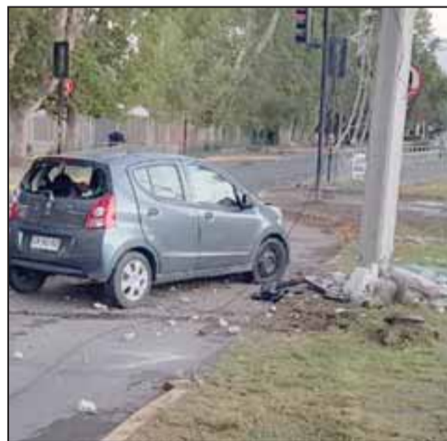
El conductor del automóvil circularía bajo los efectos del alcohol según informó Carabineros.