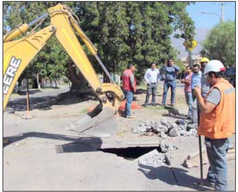
El peligroso socavón será por fin reparado, luego que se iniciaran los trabajos que demandan una inversión de 10 millones de pesos.

sitada, con una alta carga de vehículos pesados y que ayudó a que esta zona se deteriore aún más.