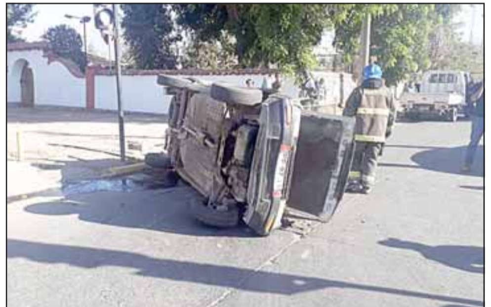
La camioneta terminó volcada a raíz de la violenta colisión.