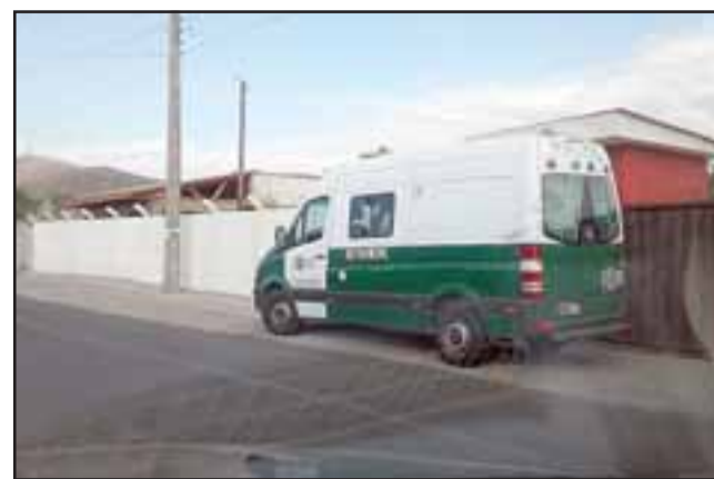
Carabineros frente al taller donde fueron encontrados estos vehículos que mantenían encargo por robo.

tres vehículos con encargo por robo de otras ciudades del país se hayan encontrado en este taller en el sector de 21 de Mayo. En este sentido el capitán Franco Herrera explicó que «este es un modus operandi, atendiendo al hecho que existe gran fiscalización en Santiago, es común que busquen otros lugares, lejos del límite urbano. Muchas veces las