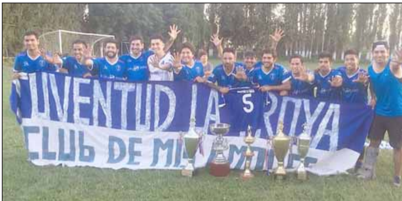
El campeón de San Felipe, Juventud La Troya, chocará con un equipo de Santa María.

Juventud La Troya (San Felipe) – Santa Filomena (Santa María); Las Palmas (Rural Llay Llay) – Viña Errázuriz (Panquehue); Independiente (Panquehue) – Independiente (Papudo); Unión Tocornal (Santa Ma-