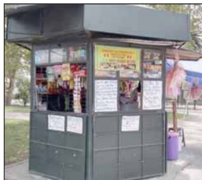
En horas de la madrugada de ayer miércoles el sospechoso forzó la protección metálica y se metió al kiosco, sustrayendo mercadería, un microondas y la suma de $380.000 que mantenía la dueña para pagar un mesón refrigerado que había comprado.