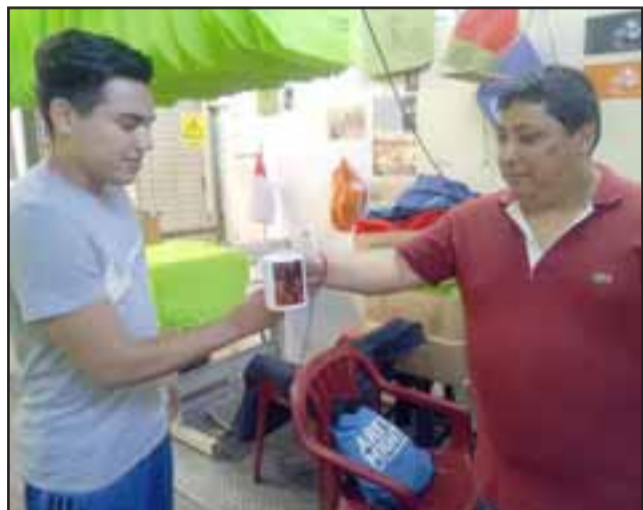
Los mismos internos se han estado acercando estos días a pedir un artículo especial para regalar a sus parejas este 14 de febrero, día de los enamorados.