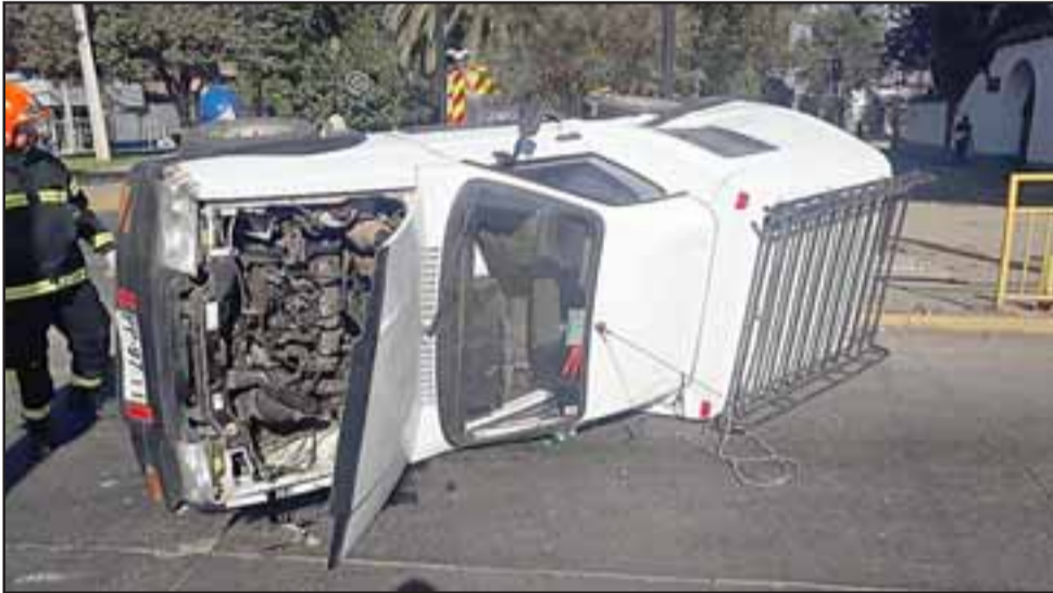
Ambos conductores circulaban en normal estado y documentación al día.