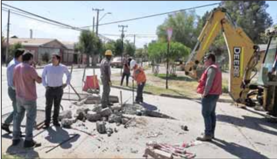
El canal de regadío que pasa por debajo de este punto mantenía una filtración que afectó el hormigón y ocasionó que una parte de la losa cediera, provocando finalmente el socavón.